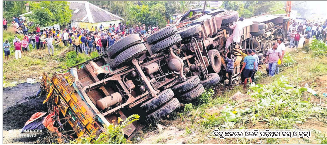
ବିରୁ ଛକରେ ଓଲଟି ପଡ଼ିଥିବା ବସ୍ ଓ ଟ୍ରକ୍।