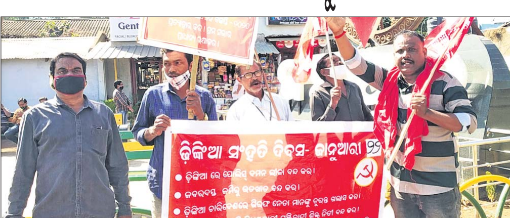
ବିରୋଧ ପ୍ରଦର୍ଶନ କରୁଥିବା ସିପିଆଇ କର୍ମଚାରୀ।

ଜୟପୁର, ୨୨।୧ (ନି.ପ୍ର.) ଜୟପୁର ମୁଖ୍ୟ ଗ୍ରାମିକ ଛକ ଏନ୍ ଏସ୍ - ୨୬ ଉପରେ ଶନିବାର ଜୟସିଂହପୁର ଡିକିଆ ଅଞ୍ଚଳରେ ଚାଲିଥିବା ପୋଲିସ୍ ଆଡ଼କରାଜ ବିରୋଧରେ ଭାରତୀୟ କମ୍ୟୁନିଷ୍ଟ ପାର୍ଟି (ସିପିଆଇ) କୋରାପୁଟ ଜିଲ୍ଲା ପକ୍ଷରୁ ସ୍ୱର ଉତ୍ତୋଳନ କରାଯାଇଛି। କର୍ମଚାରୀମାନେ ବିରୋଧ ପ୍ରଦର୍ଶନ କରି ଏହାର ନିନ୍ଦା କରିଛନ୍ତି।