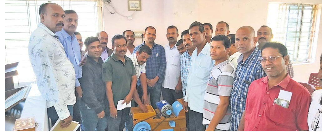
କର୍ମଚାରୀଙ୍କୁ ତାଲିମ ପ୍ରଦାନ କରାଯାଇଛି।

ଭଞ୍ଜନଗର ଉପଖଣ୍ଡରେ ଅଧିକାଂଶ ସ୍ଥାନରେ କାର୍ଗଜ କଳମରେ ମଣ୍ଡି ଖୋଲିଛି। ସେଠାରେ ଗୁଡ଼ିକରେ ମଣ୍ଡି ଖୋଲା ହୋଇନଥିବାରୁ ଚାଷୀମାନେ ମଣ୍ଡି ବଦଳରେ ସିଧା ମିଲରଙ୍କ ପାଖରେ ନେଇ ଧାନ ଦେଉଛନ୍ତି। ଅନ୍ୟପକ୍ଷେ ମିଲରମାନେ ମଧ୍ୟ ଚାଷୀଙ୍କୁ ଶୋଷିତାରେ ଲାଗିଛନ୍ତି। ଚାଷୀମାନେ ଧାନ ବିକ୍ରି କରିବାକୁ ଗଲେ ମିଲର ଅଧିକାଂଶ ଧାନକୁ ନିମ୍ନମାନର ଦର୍ଶାଇ କିଣି ନାହାନ୍ତି। ୧୦୦୧ ଭଳି ଅନେକ କିସମର ଧାନ କିଛି ମିଲର ନେଉନାହାନ୍ତି। ମଣ୍ଡି ଖୋଲା ହୋଇନଥିବାରୁ ମିଲରମାନେ ଧାନ କିଣିବା ସମୟରେ ଯନ୍ତ୍ର ବଦଳରେ କିଛି ମିଲର ନେଉନାହାନ୍ତି। ମଣ୍ଡି ଖୋଲା ହୋଇନଥିବାରୁ ମିଲରମାନେ ଧାନ କିଣିବା ସମୟରେ ଯନ୍ତ୍ର ବଦଳରେ କିଛି ମିଲର ନେଉନାହାନ୍ତି। ମଣ୍ଡି ଖୋଲା ହୋଇନଥିବାରୁ ମିଲରମାନେ ଧାନ କିଣିବା ସମୟରେ ଯନ୍ତ୍ର ବଦଳରେ କିଛି ମିଲର ନେଉନାହାନ୍ତି। ମଣ୍ଡି ଖୋଲା ହୋଇନଥିବାରୁ ମିଲରମାନେ ଧାନ କିଣିବା ସମୟରେ ଯନ୍ତ୍ର ବଦଳରେ କିଛି ମିଲର ନେଉନାହାନ୍ତି।