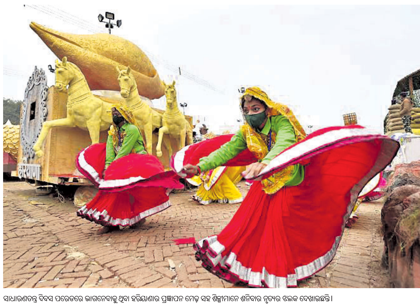
ସାଧାରଣତନ୍ତ୍ର ଦିବସ ପରେତରଫ ଭାଗନେବାକୁ ଥିବା ହରିଦ୍ୱାରୀର ପ୍ରାଞ୍ଚିକମେ ମେଡ଼ ସହ ଶିଳ୍ପୀମାନେ ଶନିବାର ନୃତ୍ୟର ଝଲକ ଦେଖାଇଛନ୍ତି।

ନୂଆଦିଲ୍ଲୀ, ୨୨।୧: ବିଦେଶରୁ ଭାରତ ଆସୁଥିବା ଯାତ୍ରୀଙ୍କ କୋଭିଡ୍ ରିପୋର୍ଟ ପଜିଟିଭ୍ ଆସିଲେ ସେମାନଙ୍କୁ ଆଇସୋଲେଶନରେ ରଖାଯିବା ବାଧ୍ୟତାମୂଳକ ନୁହେଁ ବୋଲି କେନ୍ଦ୍ର ସରକାରଙ୍କ ପକ୍ଷରୁ କୁହାଯାଇଛି। ଏହି ଗାଇଡ୍‌ଲାଇନ ଶନିବାର ୦୧:୦୦ ଲାଗୁ ହୋଇଛି। ତେବେ ସଂକ୍ରମିତ ବ୍ୟକ୍ତି ପ୍ରୋଟୋକଲ ଅନୁସାରେ ଘରେ କ୍ୱାରାଣ୍ଟାଇନରେ ରହିବେ ବୋଲି କୁହାଯାଇଛି। ବିଦେଶ ଫେରନ୍ତାଙ୍କ ପାଇଁ କାର୍ଯ୍ୟକାରୀ ଗାଇଡ୍‌ଲାଇନ ଅନୁସାରେ, ଭାରତରେ ପହଞ୍ଚିବା ପରେ କୋଣସି ବ୍ୟକ୍ତି କରୋନା ପଜିଟିଭ୍ ବାହାରିଲେ ତାଙ୍କୁ ୭ ଦିନ ପର୍ଯ୍ୟନ୍ତ ଘରେ କ୍ୱାରାଣ୍ଟାଇନରେ ରହିବାକୁ ପଡ଼ିବ। ଅଧିକାଂଶ ସମୟରେ ଆକ୍ରାନ୍ତଙ୍କୁ ଆଉଁସି-ପିସିଆର୍ ଟେଷ୍ଟ କରିବାକୁ ପଡ଼ିବ। ପୂର୍ବ ନିୟମ ଅନୁସାରେ, ବାହାର ଦେଶରୁ ଆସୁଥିବା ବ୍ୟକ୍ତିଙ୍କୁ ଆଇସୋଲେଶନ କେନ୍ଦ୍ରରେ ରହିବା ବାଧ୍ୟତାମୂଳକ ଥିଲା। ତେବେ ସ୍କିମ୍‌ବେଳେ କୋଣସି ବ୍ୟକ୍ତିଙ୍କଠାରେ ଲକ୍ଷଣ ଦେଖାଗଲେ ତାଙ୍କୁ ତୁରନ୍ତ ଆଇସୋଲେଟ କରାଯାଇ ସ୍ୱାସ୍ଥ୍ୟକେନ୍ଦ୍ରକୁ ନିଆଯିବା ନିମନ୍ତେ ବ୍ୟବସ୍ଥା କରାଯିବାରୁ ମଧ୍ୟ କେନ୍ଦ୍ର ସରକାର କହିଛନ୍ତି।