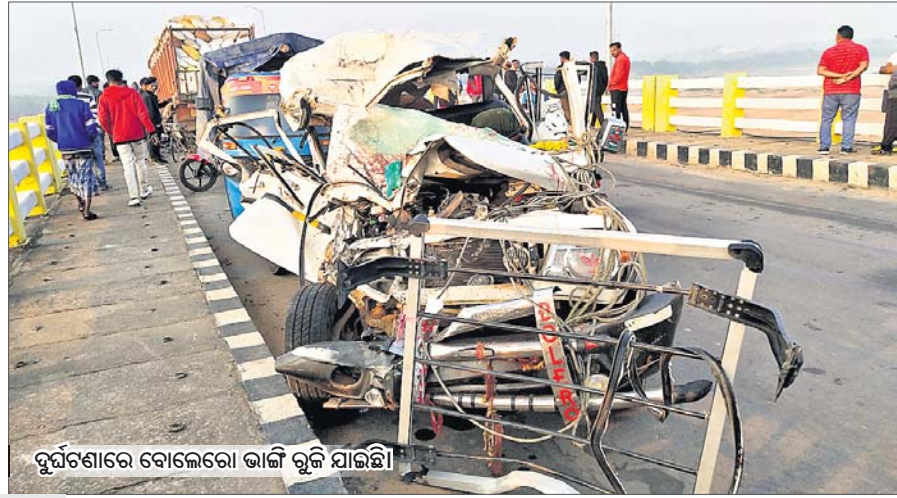
ଦୁର୍ଘଟଣାରେ ବୋଲେରୋ ଭାଙ୍ଗି ଭୁଲି ଯାଇଛି।