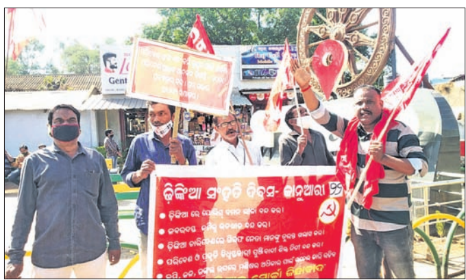
ବିଶୋଇ ପ୍ରଦର୍ଶନ କରୁଥିବା ସିପିଆଇ କର୍ମଚାରୀ ।

ଗୋପାଳପୁର, ୨୨୧(ଡି.ଏନ୍.ଏ.)- ଗୋଲହରା ରେଳଷ୍ଟେଶନ ନିକଟରେ ଜଣେ ଅଜଣା ବ୍ୟକ୍ତିଙ୍କ ମୃତଦେହ ଶନିବାର ବୁଝାପୁର ଡିଆରପି ପୋଲିସ୍ ଠାବ କରିଛି।