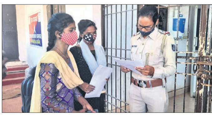
ଏଏଆଇ ପୂର୍ଣ୍ଣିମା ଚେଟେକ ନିକଟରେ ପାଟିତାମାନେ ଅଭିଯୋଗ କରିଛନ୍ତି ।

୨ ହଜାର ଟଙ୍କା ଲେଖାଏ ପଠାଇବାକୁ ଘୋଷଣା କରୁଥିଲେ। ଚଳିତ ମାସ ୫ ତାରିଖରେ ସେମାନେ ୨ ହଜାର