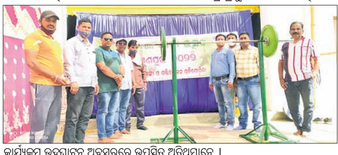
କାର୍ଯ୍ୟକ୍ରମ ଉଦଘାଟନ ଅବସରରେ ଉପସ୍ଥିତ ଅତିଥିମାନେ ।

ପ୍ରତିଯୋଗିତାକୁ ଉଦଘାଟନ କରିଥିଲେ। ବୁଦ୍ଧଦିନ ଧରି ଏହି ପ୍ରତିଯୋଗିତା ଚାଲିବାକୁ ଥିବାବେଳେ ଚଳିତ ବର୍ଷ କୋଭିଡ୍ କଟକଣା ଦୃଷ୍ଟିରୁ ସ୍ଥାନୀୟ ଖେଳାଳିଙ୍କୁ ନେଇ ଏହା ଆୟୋଜିତ ହୋଇଛି।