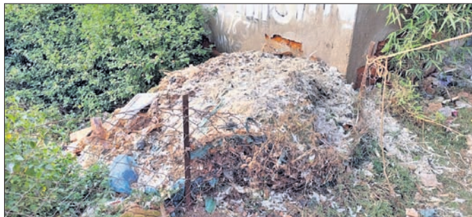
ରାଜସ୍ୱର ଆମିଷ ବଜାରରେ ପଡ଼ିଥିବା ବର୍ଜ୍ୟବସ୍ତୁ।

ନବରଙ୍ଗପୁର ଜିଲ୍ଲା ରାଜସ୍ୱର ବ୍ଲକ୍ ସଦର ମହକୁମାସ୍ଥିତ ଧର୍ତ୍ତରାପାରେ ଥିବା ଆମିଷ ବଜାର ଅବ୍ୟବସ୍ଥାରେ ପଡ଼ିରହିଛି।