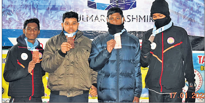
ଓଡ଼ିଶା ଚିମ୍ବ ଖେଳାଳି ଓ କୋର୍ଚ୍ଚ ।