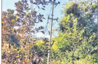
ଗ୍ରାହ୍ୟର୍ମର ନ ଥିବା ଲକେଇ ପୋଲ ।

ନବରଙ୍ଗପୁର ଜିଲ୍ଲା ପାପଡ଼ାହାଣ୍ଡି ବ୍ଲକ୍ ସଦର ଡାକ୍ତରଖାନା ନିକଟରେ ଥିବା ଗ୍ରାହ୍ୟର୍ମର ଗୁରୁବାର ବିଳମ୍ବିତ ରାତିରେ ଦୁର୍ଭିକ୍ଷମାନେ ଚୋରି କରି ନେଇଯାଇଛନ୍ତି।