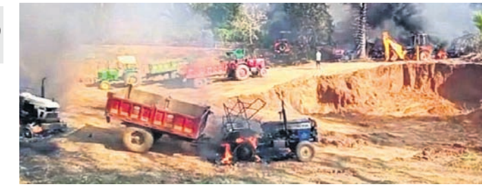
ମାଓବାଦୀମାନେ ପୋଡ଼ି ଦେଇଥିବା ଗାଡ଼ି । ମାଲକାନଗିରି/ଏମ୍ପି-୭୯, ୨୨।୧ (ବି.ଏନ୍.ଏ.)

୯ ଟ୍ରାକ୍ଟର, ୨ ଜେସିବି ଜାଲିଦେଲେ ମାଓବାଦୀ ରାସ୍ତାକାମକୁ ବିରୋଧ ସେମାନେ ଗାଡ଼ିକୁଟିକରେ ନିଆଁ ଲଗାଇ ଦେଇଥିଲେ । ଖବରପାଇଁ ପରିସ୍ଥିତି ତଦାରଖ ସହ ଛୁଟି ନିୟନ୍ତ୍ରଣ ପାଇଁ ସୁରକ୍ଷାକର୍ମୀଙ୍କ ଏକ ଟିମ୍ ଘଟଣାସ୍ଥଳକୁ ପଠାଯାଇଛି ବୋଲି ବିକାସର ସର୍ବକମଳ ଲୋଚନ କଣ୍ୟାପ କହିଛନ୍ତି । ପୂର୍ବନାମୋଗ୍ୟ ଉକ୍ତ ଅଞ୍ଚଳରେ ସୁରକ୍ଷାକର୍ମୀଙ୍କ ବାରମ୍ବାର କୋମି ଅପରେଶନ ଯୋଗୁ ମାଓବାଦୀଙ୍କ ପ୍ରାଚୁର୍ଯ୍ୟ କମିବାରେ ଲାଗିଛି । ତେବେ ନିଜ ଛୁଟି ଜାହିର କରିବାକୁ ସେମାନେ ଏପରି ଘଟଣା ଘଟାଇଛନ୍ତି ।