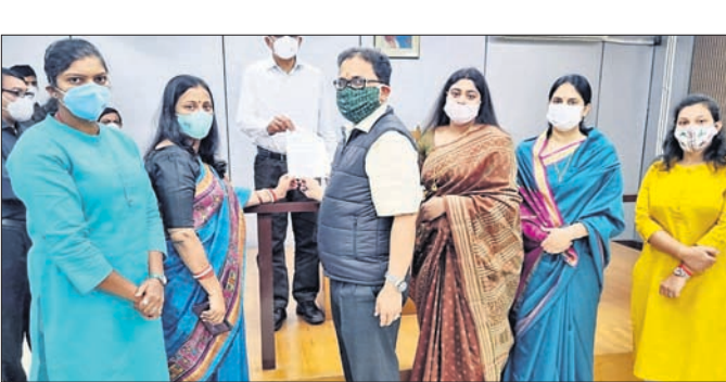
ରାଜ୍ୟ ନିର୍ବାଚନ କମିଶନରଙ୍କୁ ଭେଟୁଛନ୍ତି ବିଜେଡି ପ୍ରତିନିଧି ଦଳ ।

ଭୁବନେଶ୍ୱର, ୨୨।୧ (ବୁଧବେ) ପଞ୍ଚାୟତ ନିର୍ବାଚନ ପାଇଁ ରାଜ୍ୟରେ ଆଦର୍ଶ ଆଚରଣ ବିଧି ଲାଗୁ ହୋଇଥିବା ବେଳେ ପେଟ୍ରୋଲ ପମ୍ପରେ କେନ୍ଦ୍ର ଭାଙ୍ଗିବା ସରକାରଙ୍କ ହୋଟି ଲାଗିଛି, ଯାହାକୁ ବର୍ତ୍ତମାନ ଦୂରୀ ହୋଇଯାଇଛି । ଏହା ନିର୍ବାଚନ ଆଚରଣ ବିଧି ଉଲ୍ଲଙ୍ଘନ କରୁଥିବା ଅଭିଯୋଗ ନେଇ ଶନିବାର ବିଜେଡିର ଏକ ପ୍ରତିନିଧି ଦଳ ରାଜ୍ୟ ନିର୍ବାଚନ କମିଶନରଙ୍କ ନିକଟରେ ଫେରାଦ ହୋଇଛି । ପ୍ରମାଣସୂଚକ ଡାକ୍ତରୀ ବିଭିନ୍ନ ପେଟ୍ରୋଲ ପମ୍ପରେ