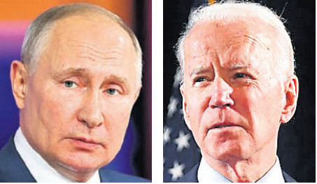
ଭାଷିନିର ପୁତ୍ରିନ (ବାମ) ଓ ଜୋ ବାଇଡେନ୍ (ଡାହାଣ) ଆମେରିକା ପଠାଇଥିବା ୯୦ ଚନ୍ଦ୍ର ଅସ୍ତ୍ରଶସ୍ତ୍ର ୟୁକ୍ରେନ ରାଜଧାନୀ କିଭରେ ପହଞ୍ଚିଛି।

ଦୁଇ କନଫରେନ୍ସରେ କହିଥିଲେ। ଏହି ଅନୁମାନ କରିବାର ମାତ୍ର ଦିନ ପରେ ଆମେରିକା ୟୁକ୍ରେନକୁ ପ୍ରଥମ ପର୍ଯ୍ୟାୟରେ ଘାତକ ସାମରିକ ସହାୟତା ପ୍ରଦାନ କରିଛି। ଶୁକ୍ରବାର ରାତିରେ ଆମେରିକା ଚରଫରୁ ପ୍ରାୟ ୨ କୋଟି ଟଙ୍କାର ଅସ୍ତ୍ରଶସ୍ତ୍ର ୟୁକ୍ରେନ ରାଜଧାନୀ କିଭରେ ପହଞ୍ଚିଛି। ଏ ନେଇ କିଭରେ ଥିବା ଆମେରିକୀୟ ଦୂତାବାସ ପକ୍ଷରୁ ବୁଲେଟି ଯୋଗେ ସୂଚନା ଦିଆଯାଇଛି। ଏଥିରେ ପ୍ରାୟ ୯୦ ଚନ୍ଦ୍ର ଘାତକ ଅସ୍ତ୍ରଶସ୍ତ୍ର ଏବଂ ବୋକାବାରୁଦ ରହିଛି। ୟୁକ୍ରେନ ସାମାଜିକ ଚେତାବନୀ ଦେଇଆସୁଛନ୍ତି। ଆମେରିକା ରାଷ୍ଟ୍ରପତି ଜୋ ବାଇଡେନ୍ ମଧ୍ୟ ସମାନ ଆଶଙ୍କା କରୁଥିବା ବୁଧବାର ଏକ