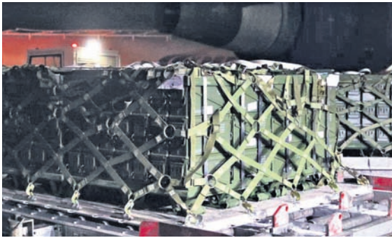
ଆମେରିକା ପଠାଇଥିବା ୯୦ ଚନ୍ଦ୍ର ଅସ୍ତ୍ରଶସ୍ତ୍ର ୟୁକ୍ରେନ ରାଜଧାନୀ କିଭରେ ପହଞ୍ଚିଛି।

ଦୁଇ କନଫରେନ୍ସରେ କହିଥିଲେ। ଏହି ଅନୁମାନ କରିବାର ମାତ୍ର ଦିନ ପରେ ଆମେରିକା ୟୁକ୍ରେନକୁ ପ୍ରଥମ ପର୍ଯ୍ୟାୟରେ ଘାତକ ସାମରିକ ସହାୟତା ପ୍ରଦାନ କରିଛି। ଶୁକ୍ରବାର ରାତିରେ ଆମେରିକା ଚରଫରୁ ପ୍ରାୟ ୨ କୋଟି ଟଙ୍କାର ଅସ୍ତ୍ରଶସ୍ତ୍ର ୟୁକ୍ରେନ ରାଜଧାନୀ କିଭରେ ପହଞ୍ଚିଛି। ଏ ନେଇ କିଭରେ ଥିବା ଆମେରିକୀୟ ଦୂତାବାସ ପକ୍ଷରୁ ବୁଲେଟି ଯୋଗେ ସୂଚନା ଦିଆଯାଇଛି। ଏଥିରେ ପ୍ରାୟ ୯୦ ଚନ୍ଦ୍ର ଘାତକ ଅସ୍ତ୍ରଶସ୍ତ୍ର ଏବଂ ବୋକାବାରୁଦ ରହିଛି। ୟୁକ୍ରେନ ସାମାଜିକ ଚେତାବନୀ ଦେଇଆସୁଛନ୍ତି। ଆମେରିକା ରାଷ୍ଟ୍ରପତି ଜୋ ବାଇଡେନ୍ ମଧ୍ୟ ସମାନ ଆଶଙ୍କା କରୁଥିବା ବୁଧବାର ଏକ