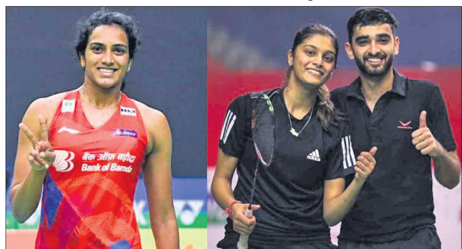
ମ୍ୟାଚ ଜିତିବାପରେ ପି.ଭି. ସିନ୍ଧୁ ଏବଂ ଇଶାନ ଭଟ୍ଟାଚାର୍ଯ୍ୟ ଓ ତନିଷା କ୍ରାଷ୍ଠୀ ।