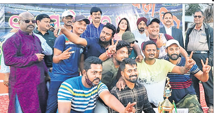
ଅତିଥିକ ଗହଣରେ ଚାମ୍ପିୟନ ପାଲ୍ୟୋନିୟର ଦଳର ଖେଳାଳି ।

ନିମାପଡ଼ା ଆଧିକାରିକ ଆସୋସିଏସନ୍ ପକ୍ଷରୁ ଘାଟଣା ସମ୍ପର୍କୀୟ ଗ୍ରାହକଙ୍କୁ ଆକର୍ଷଣ କରିବା ପାଇଁ ନିମାପଡ଼ା କର୍ମ ଡିଭିଜନ୍ ଚୁନାବଳୀ ଉପରେ ଉଦ୍‌ଘାଟିତ ହୋଇଛି। ଫାଇନାଲରେ କଟକର କୁଚରାଜଲ କୁବକୁ ହରାଇ ପୁରୀ ପାଲ୍ୟୋନିୟର କୁବ ଚାମ୍ପିୟନ ହୋଇଛି। ଚମ୍ପି କିଟି କୁଚରାଜଲ ପ୍ରଥମେ ବ୍ୟାଟ୍ କରି ୫୪.୨ ଓଭରରେ ସମସ୍ତ ଉଲ୍ଲେଖ କରିବା ପାଇଁ ଚାହୁଁଛନ୍ତି। ଏହା ପୂର୍ବରୁ ସେ ଏହି ବିଷୟଟି ଉପରେ ପ୍ରାୟ ୩୦୦ ଲକ୍ଷେ ୨୦୧୭ରେ ଲାଗିଥିଲା। ଏହା ପୂର୍ବରୁ ସେ ଏହି ବିଷୟଟି ଉପରେ ପ୍ରାୟ ୩୦୦ ଲକ୍ଷେ ୨୦୧୭ରେ ଲାଗିଥିଲା।