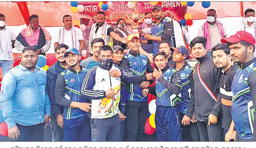
ପରିଆଗଡ଼ କ୍ରିକେଟ ଚୁନାବଳୀ ଯଦୁପୁର ଷ୍ଟାଡ଼ିୟମର ଷ୍ଟାଡ଼ିୟମର ଉପସ୍ଥିତ ଅତିଥିକ ଗହଣରେ ।