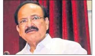
ଏମ୍. ଭେଙ୍କାୟା ନାଲଭୁ

ନୂଆଦିଲ୍ଲୀ, ୨୩।୧ (ପି.ଟି.): ଉପରାଷ୍ଟ୍ରପତି ଏମ୍. ଭେଙ୍କାୟା ନାଲଭୁ କୋଭିଡ଼ ପଜିଟିଭ୍ ରିଜଲ୍ଟ ହୋଇଛନ୍ତି। ଉପରାଷ୍ଟ୍ରପତି ହିଟାୟ ଅର ପାର୍ଲି କରୋନା ଆକ୍ରାନ୍ତ ହୋଇଛନ୍ତି। ହାଇଦ୍ରାବାଦରେ ଥିବା ଭେଙ୍କାୟା ସଂକ୍ରମିତ ଜଣାପଡ଼ିବା ପରେ ନିଜକୁ ଗୋଟିଏ ସପ୍ତାହ ଲାଗି ଆଲସୋଲୋଗନରେ ରଖିଛନ୍ତି ଓ ତାଙ୍କ ସଂସର୍କରେ ଆସିଥିବା ଅନ୍ୟମାନଙ୍କୁ ମଧ୍ୟ ସଙ୍ଗରୋଧରେ ରହିବା ସହ ପରୀକ୍ଷା କରାଗଲେବାରୁ ପରାମର୍ଶ ଦେଇଛନ୍ତି। ଦୁଇଦିନ ଅନୁଶ୍ରେଣୀ ହେବାରୁ ଥିବା ସାଧାରଣତନ୍ତ୍ର ଦିବସ ଉତ୍ସବରେ ଉପରାଷ୍ଟ୍ରପତି ଯୋଗ ଦେଇ ନ ପାରିବେ।