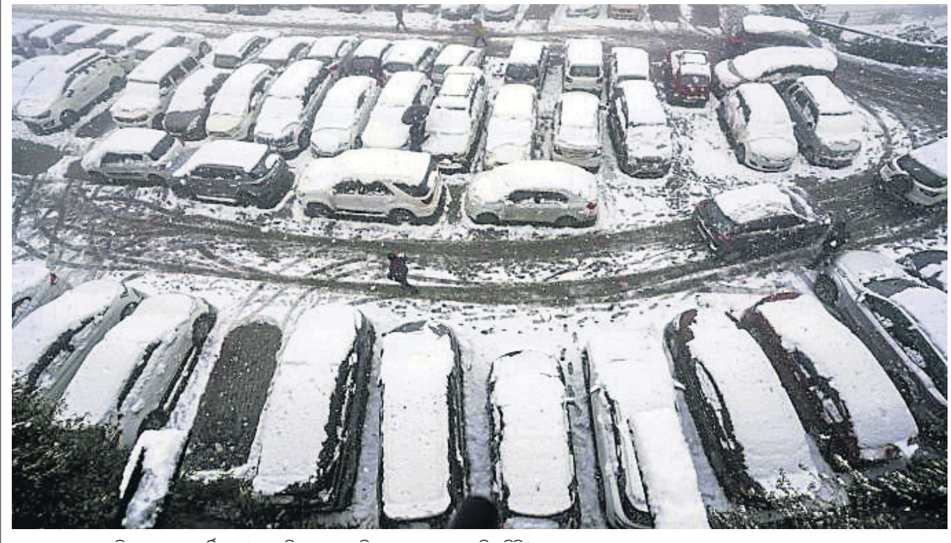
ଝୁଆରପାଟ ଯୋଗୁ ଶିମଲାରେ ଏକ ପାର୍କିଂ ଘୁମାରେ ରବିବାର କାରଗୁଡ଼ିକ ଉପରେ ବରଫ ଜମି ରହିଛି।

ପାଟଣା, ୨୩।୧: ଫାର୍ମରେ କ୍ରିକେଟ ଖେଳୁଥିବା କେତେଜଣ ପିଲାଙ୍କୁ ଘରଠାଳିବା ପାଇଁ ବିହାରର ପର୍ଯ୍ୟଟନ ମନ୍ତ୍ରାଳୟ ଉପାଧୀକାରୀ ନେତା ନାରାୟଣ ପ୍ରସାଦଙ୍କ ପୁଅ ଫାଙ୍କା ଗୁଳି ଚଳାଇଥିବା ଅଭିଯୋଗ ହୋଇଛି।