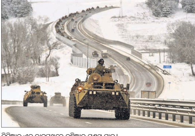
କ୍ରିମିଆର ଏକ ରାଜପଥରେ ରୁଷିଆର ସଶସ୍ତ୍ର ସମାନ୍।

ୟୁକ୍ରେନ ଉପରେ ରୁଷିଆ ଆକ୍ରମଣ କରିବା ଆଶଙ୍କା ଦିନକୁ ଦିନ ବୃଦ୍ଧିଲାଭ ହେବାରେ ଲାଗିଥିବାବେଳେ କ୍ରିଗେନଙ୍କ ନାଁରେ ସଜିନ ଅଭିଯୋଗ ଆଣିଛନ୍ତି କ୍ରିଗେନ।