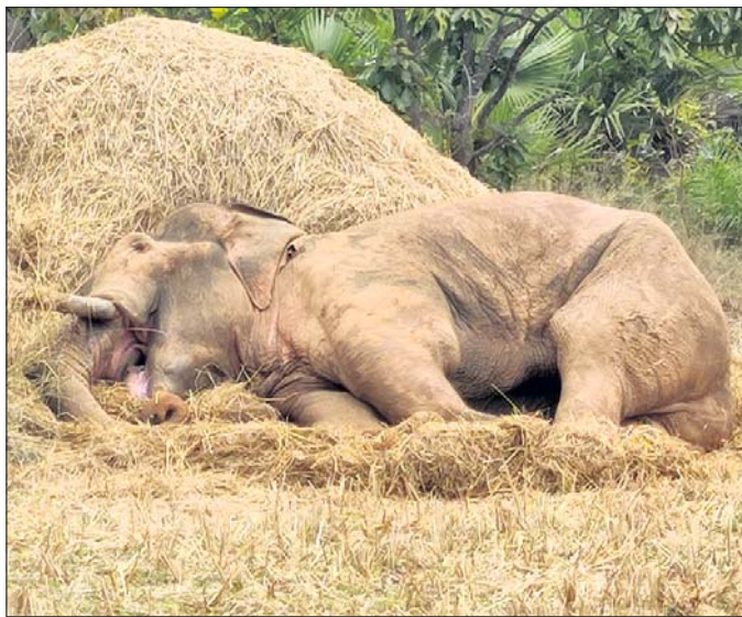
କନ୍ଧାହାତୀର ମୃତଦେହ ପଡ଼ିରହିଛି।