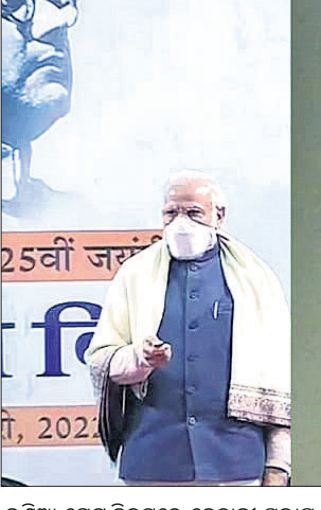
କଣ୍ଠିଆ ଗେର ନିକଟରେ ନେତାଙ୍କ ସୁଭାଷ ଚନ୍ଦ୍ର ବୋଷଙ୍କ ହଲୋଗ୍ରାମ ପ୍ରତିମୂର୍ତ୍ତିକୁ ପ୍ରଧାନମନ୍ତ୍ରୀ ନରେନ୍ଦ୍ର ମୋଦି ଅନାବରଣ କରୁଛନ୍ତି।

୨୦୨୨ ବର୍ଷ ନିମନ୍ତେ ଏହି ପୁରସ୍କାର ପାଇଛନ୍ତି। ଉତ୍ତରରେ ମୋଟ ୭ଟି ପୁରସ୍କାର ପ୍ରଦାନ କରାଯାଇଥିଲା।