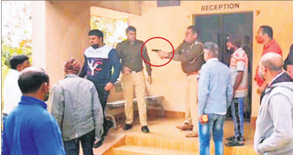
ହରିୟାଣା ପୋଲିସ୍ ଖବରବାଚୀଙ୍କୁ ବନ୍ଧୁକ ଦେଖାଇ ଭୟଭୀତ କରାଉଛନ୍ତି।

ଲକ୍ଷାଧିକ ଟଙ୍କା ହେଉଥିବାରୁ ଅଭିଯୋଗରେ ଫେରାର ଥିବା ବାଲେଶ୍ଵର ବାହାନଗା ଅଞ୍ଚଳର ୨୨ବର୍ଷୀୟ ଗିରଫ କରିବାକୁ ଆସି ହରିୟାଣା ପୋଲିସ୍ ହତହତା ହୋଇଛି। ଅଭିଯୁକ୍ତଙ୍କୁ ନ ପାଇ ସେମାନଙ୍କ ପରିବାର ଲୋକଙ୍କୁ ଖତାପତା ଥାନାକୁ ଆଣିଥିବା ପୋଲିସ୍ ଟିମ୍ ସ୍ଥାନୀୟ ଲୋକଙ୍କ ବିରୋଧରେ ଶିକାର ହୋଇଛି। ପରିସ୍ଥିତି ଏପରି ହୋଇଥିଲା ଯେ, ଖବର ସଂଗ୍ରହ କରିବାକୁ ଯାଇଥିବା ଜଣେ ଖବରବାଚୀଙ୍କୁ ପୋଲିସ୍ ବନ୍ଧୁକ ଦେଖାଇ ଭୟଭୀତ କରିବାକୁ ପ୍ରସ୍ତାବ ଦେଲା। ଏହାକୁ ନେଇ ଥାନା ପରିସରରେ ଉତ୍ତେଜନାମୂଳକ ପରିସ୍ଥିତି ସୃଷ୍ଟି ହେବା ସହ ପୋଲିସ୍ ଏବଂ ଲୋକଙ୍କ ମଧ୍ୟରେ ଚେତନା ହୋଇଥିଲା। ଖବରପାଇ ସଦର ଏସ୍ପିଓ ଘଟଣାସ୍ଥଳରେ ପହଞ୍ଚି ପରିସ୍ଥିତିକୁ ନିୟନ୍ତ୍ରଣ କରିବାକୁ ଆଣିଥିଲେ। ଶେଷରେ ହରିୟାଣା ପୋଲିସ୍ ଭୁଲ୍ ମାଗି ଥାନାକୁ ଆଣିଥିବା ଅଭିଯୁକ୍ତଙ୍କ ସମ୍ପର୍କୀୟଙ୍କୁ ଛାଡ଼ିଥିଲା। ଏହି ଘଟଣା ପରେ ହରିୟାଣା ପୋଲିସ୍ ଟିମ୍ ଫେରି ଯାଇଥିବା ଜଣାପଡ଼ିଛି।