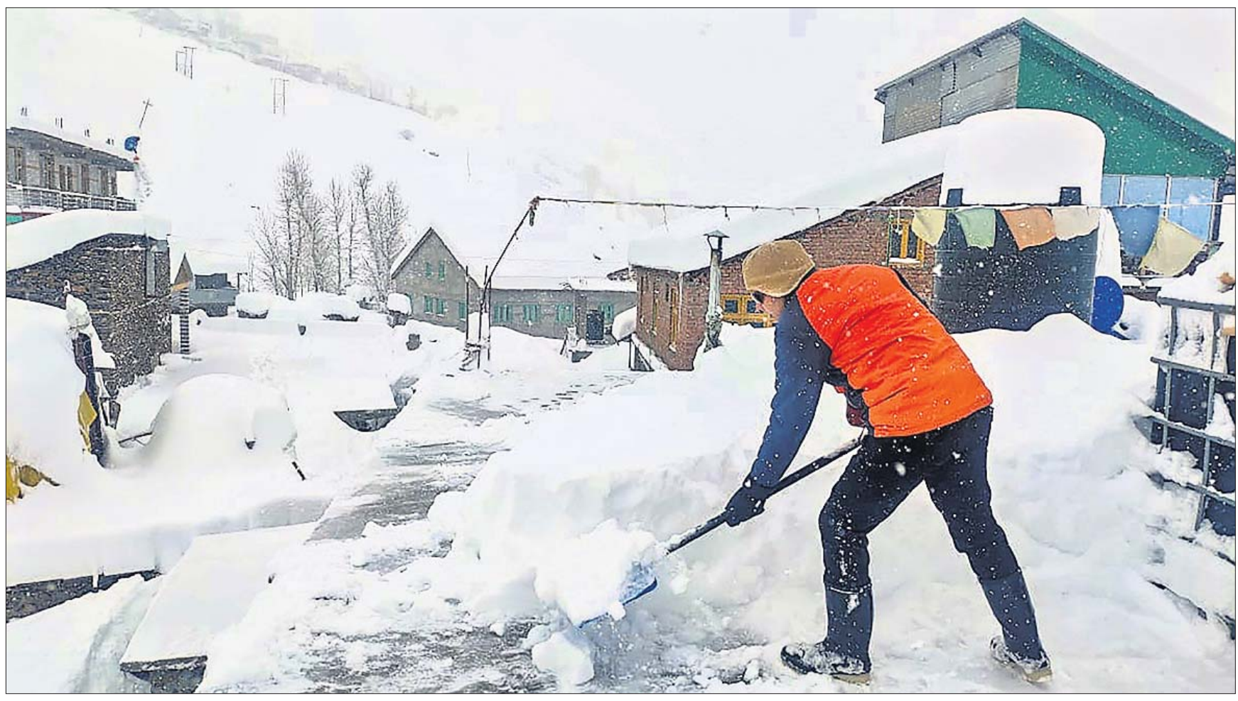
ହିମାଳୟ ପ୍ରଦେଶର ଲହୁଆଲ ଶ୍ୱିଟ ଜିଲ୍ଲା ସିୟୁଠାରେ ରବିବାର ଜଣେ ବ୍ୟକ୍ତି ନିଜ ଘର ଉପରୁ ବରଫ ସଫା କରୁଛନ୍ତି।

ନୂଆଦିଲ୍ଲୀ, ୨୩।୧ (ପି.ଟି.): ଆର୍ଥିକ ଅପରାଧ ମାମଲାରେ ଚଳନ୍ତ କରୁଥିବା ପ୍ରବର୍ତନ ନିର୍ଦ୍ଦେଶାଳୟ (ଇଡି) ଦିଲ୍ଲୀର ସ୍ୱାସ୍ଥ୍ୟ ଓ ଗୃହମନ୍ତ୍ରୀ ସତ୍ୟେନ୍ଦ୍ର ଜେନଙ୍କୁ ଗିରଫ କରିପାରିବେ ବୋଲି ମୁଖ୍ୟମନ୍ତ୍ରୀ ଅରବିନ୍ଦ କେଜ୍ରିୱାଲ ରବିବାର କହିଛନ୍ତି। ଆସତ୍ତା ମାସରେ ପଞ୍ଜାବ ବିଧାନସଭା ନିର୍ବାଚନ ହେବାକୁ ଥିବାବେଳେ ଭାଙ୍ଗିବାକୁ ସମ୍ଭାବ୍ୟତା କରିବା ଲାଗି ଦିଲ୍ଲୀର ଏମ୍ପି ମନ୍ତ୍ରୀଙ୍କୁ ଗିରଫ କରାଯିବ ନେଇ ଏକ ସୂତ୍ରରୁ ସେ ଜାଣିବାକୁ ପାଇଥିବା କେଜ୍ରିୱାଲ କହିଥିଲେ। ତେବେ ତାଙ୍କ ଦଳର ନେତା ଓ କର୍ମୀମାନେ କୌଣସି ଭୁଲ କରି ନ ଥିବାରୁ କେନ୍ଦ୍ରୀୟ ସଂସ୍କାରକୁ ଉଦ୍ଧାର କରି ନାହିଁ। ଜେନଙ୍କୁ ଗିରଫ କଲେ ଏମ୍ପି ପଛକୁ ଡୁଲୁଥିବ ନାହିଁ। ନିର୍ବାଚନ ଲଢ଼ିବାକୁ ଆମେ ପ୍ରସ୍ତୁତ ବୋଲି ଦିଲ୍ଲୀ ମୁଖ୍ୟମନ୍ତ୍ରୀ କହିଛନ୍ତି। ଅନ୍ୟପକ୍ଷରେ ଭାଙ୍ଗିବା ନିୟମିତ କେନ୍ଦ୍ର ସରକାରଙ୍କୁ ମନ୍ତ୍ରୀ ଜେନ ସମାଲୋଚନା କରିଛନ୍ତି। ସେ ଗିରଫ ପାଇଁ ପ୍ରସ୍ତୁତ ଥିବା କହିଛନ୍ତି। ପୂର୍ବରୁ ଇଡି ଦୁରାଧିକାରୀଙ୍କ ଘରରେ ଚଢ଼ାଉ କରି ବିଧାନ ହୋଇଥିଲା। ଏହା କେବଳ ରାଜନୀତି ପାଇଁ ତାଙ୍କୁ ଗିରଫ କରିବା ଲାଗି ନୁହେଁ ଆହ୍ୱାନ ଦେଇଛନ୍ତି। ଆଗାମୀ ନିର୍ବାଚନରେ ପରାଜିତ ହେବ ବୋଲି ଭାଙ୍ଗି ଆନୁଭବ କରିବା ପରେ ବିରୋଧୀଙ୍କୁ ଅସୁବିଧାରେ ପକାଇବା ପାଇଁ କେନ୍ଦ୍ରୀୟ ସରକାରୀଙ୍କୁ ଚୁପ୍‌ଚାପରେ ଚଳାନ୍ତି କରୁଥିବା ଏମ୍ପି ଆବାହକ କେଜ୍ରିୱାଲ କହିଛନ୍ତି।