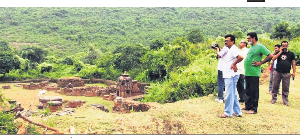
ଉଦ୍‌ଘାଟନାରେ ଅନ୍ୟାନ୍ୟର ପର୍ଯ୍ୟଟକ।

ସମ୍ପୃକ୍ତ ପର୍ଯ୍ୟଟନର ଗୁରୁତ୍ୱ ବଢ଼ିଛି। ଓଡ଼ିଶାରେ ବି ଭରପୁର ପର୍ଯ୍ୟଟନ ସମ୍ପଦ ରହିଛି। ହେଲେ କାତାଠା ଓ ଅର୍ଦ୍ଧଶତାବ୍ଦୀରୁ ଆବଶ୍ୟକ ପ୍ରଚାରପ୍ରସାର ଅଭାବରୁ ଓଡ଼ିଶାର ପର୍ଯ୍ୟଟନ ସମ୍ପଦ ପର୍ଯ୍ୟଟକଙ୍କ ଦୃଷ୍ଟି କରାଯାଇନଥିଲା। ଏ ନେଇ ପରିବାରବର୍ଗ କେବଳ କୋଶାଳ୍ପ ପର୍ଯ୍ୟଟନ, ପୁରୀ ଶ୍ରୀଜଗନ୍ନାଥ ମନ୍ଦିର, ଚିଲିକା ହ୍ରଦ ଏବଂ ବିସୁତ ବେଳାକୂଳି ବ୍ୟତୀତ ଓଡ଼ିଶାର ଅନ୍ୟ କୌଣସି ପର୍ଯ୍ୟଟନ ସମ୍ପଦ ପର୍ଯ୍ୟଟକମାନଙ୍କୁ ବିଶେଷ ଆକର୍ଷଣ ଦେବା ପାଇଁ ଚାହୁଁଛି।