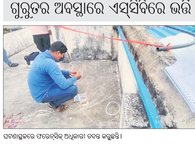
ଘରଗାଈକର ଫରେସ୍‌ସିବ୍ ଅଧିକାରୀ ଚଢ଼ାଉ କରୁଛନ୍ତି।

ପରିଷଦ ମନ ଓ ଆତ୍ମା ପେଇଁ ନୈସର୍ଗିକ ଶାନ୍ତି ଲାଭ କରେ ତାହା ଅବଶ୍ୟତ। ବୌଦ୍ଧ କୀର୍ତ୍ତୀକା ସହ ସମୁଦ୍ର କୁଳ ଓ ଐତିହାସିକ କ୍ଷେତ୍ର ସମ୍ପଦରୁ ବିଶେଷ ଭାବେ ଆକୃଷ୍ଟ କରିଥାଏ। ଏହିକ୍ରମରେ ୨୦୧୮ ଅଲ୍‌କୋବରରେ ଓଡ଼ିଶାକୁ ଦେଶର ୧୫,୦୭,୪୮୨ ଓ ୯,୧୮୧ ବିଦେଶୀ ପୂର୍ଣ୍ଣ-୩