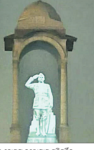
କଣ୍ଠିଆ ଗେର ନିକଟରେ ନେତାଙ୍କ ସୁଭାଷ ଚନ୍ଦ୍ର ବୋଷଙ୍କ ହଲୋଗ୍ରାମ ପ୍ରତିମୂର୍ତ୍ତିକୁ ପ୍ରଧାନମନ୍ତ୍ରୀ ନରେନ୍ଦ୍ର ମୋଦି ଅନାବରଣ କରୁଛନ୍ତି।