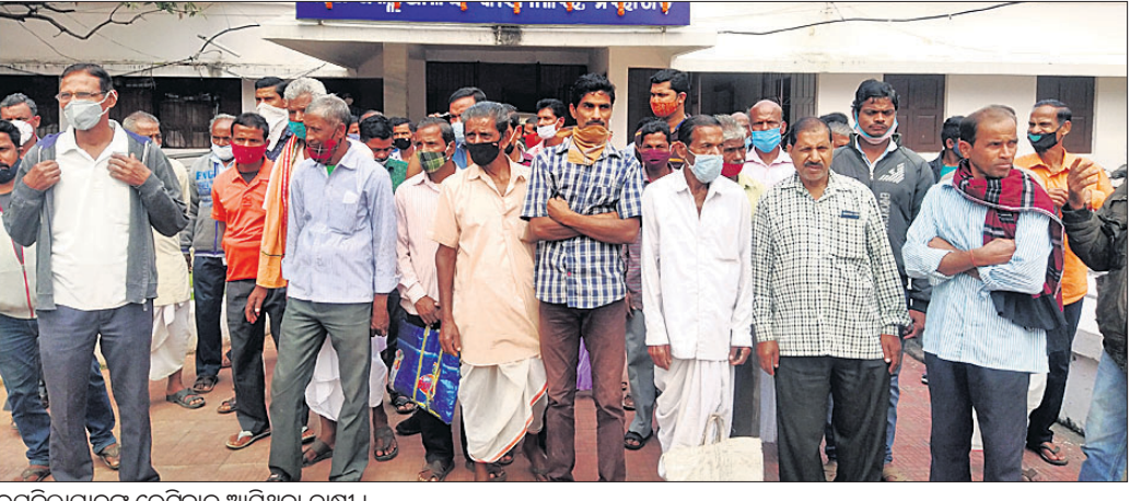
ଉପଜିଲ୍ଲାପାଳଙ୍କୁ ଭେଟିବାକୁ ଆସିଥିବା ଗାଷ୍ଟୀ