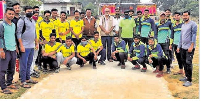
ଅତିଥି ଗହଣରେ ଖେଳାଳିମାନେ ।