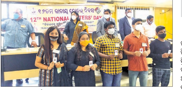
ନୂଆ ଭୋଟରଙ୍କୁ କାର୍ଡ ପ୍ରଦାନ କରାଯାଇଛି ।