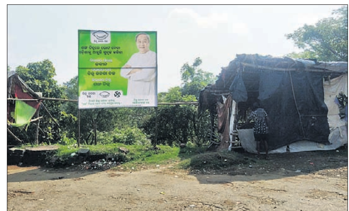
ସରକାରୀ ବଳର ହୋଡ଼ି ।

ପଞ୍ଚାୟତ ନିର୍ବାଚନକୁ ନେଇ ଉତ୍ତୁକା ବହୁଛି । ତେବେ ବୁଢ଼ ଖାର୍ଚ୍ଚମେୟର ପଦବୀ ଦଶପଲ୍ଲୀ ବ୍ଲକ୍ରେ ନିଲାମ ହୋଇଥିବା ଅଭିଯୋଗ ହୋଇଛି । ସ୍ଥାନୀୟ ଲୋକଙ୍କ ସୂଚନା ଅନୁଯାୟୀ, ତିନିଟି ପଞ୍ଚାୟତର ତିନିଟିର ଏକ ଖାର୍ଚ୍ଚମେୟର ପଦବୀ ପାଇଁ ୬୨ ହଜାର ଓ ଦଲକ ସାହି ଖାର୍ଚ୍ଚ ମେୟରପାଇଁ ୫୧ ହଜାର ଟଙ୍କାରେ ନିଲାମ ହୋଇଥିବା ଚର୍ଚ୍ଚାର ବିଷୟ ହୋଇଛି ।