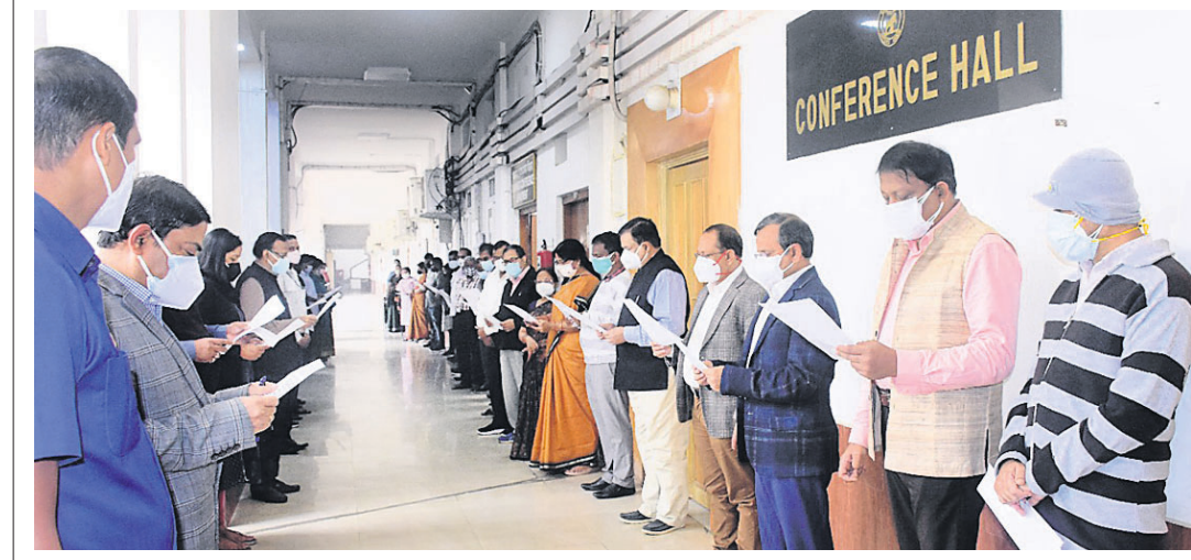
୧୨ତମ ଜାତୀୟ ମତଦାତା ଦିବସ ପାଇଁ ଅବସରରେ ମଙ୍ଗଳବାର ଲୋକସେବା ଭବନରେ ମୁଖ୍ୟ ଶାସନ ସଚିବ ଶପଥପାଠ କରାଉଛନ୍ତି।