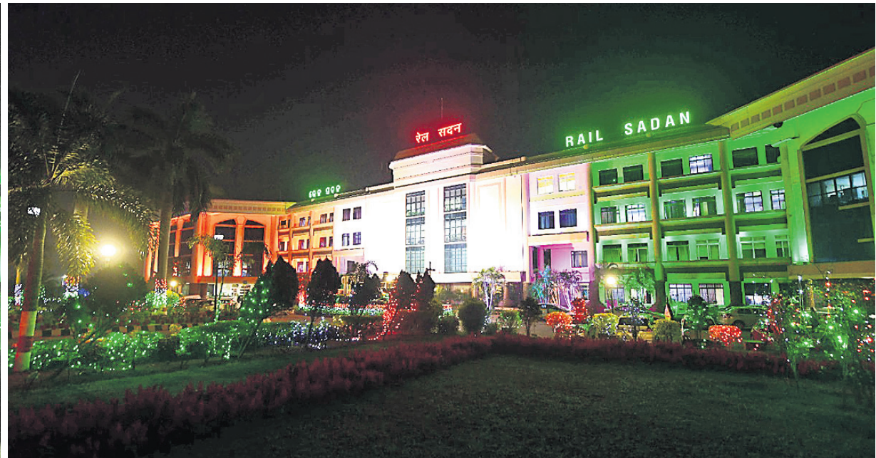
ସାଧାରଣତନ୍ତ୍ର ଦିବସ ଅବସରରେ ପୂର୍ବରୁ ମଙ୍ଗଳବାର ଭୁବନେଶ୍ୱରରୁ ଖାରବେଳ ଭବନ (ବାମ) ଓ ରେଳ ସଦନକୁ ଆଲୋକମାଳାରେ ସଜ୍ଜିତ କରାଯାଇଛି ।