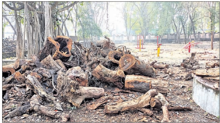
ଉନ୍ନତି କରଣ ପୌରପାଳିକା ପକ୍ଷରୁ କାମ ଆରମ୍ଭ ହୋଇଛି। ତେବେ ଗଛର ସୁରକ୍ଷା ନ କରି ଏଭଳି ଗଛ କଟାଯାଇ ପାର୍ଚ୍ଚ ନିର୍ମାଣ କରାଯାଇଥିବା ପରିବେଶପ୍ରେମୀଙ୍କ ମଧ୍ୟରେ ଅସନ୍ତୋଷ ପ୍ରକାଶ ପାଉଛି। ଏପରିକି ଏଠାରେ କିଛି ବର୍ଷ ପୂର୍ବରୁ ଏହାର ଏକ ଘରୋଇ କମ୍ପାନୀ କରିଆରେ ଲକ୍ଷ ଲକ୍ଷ ଟଙ୍କା ଖର୍ଚ୍ଚ କରାଯାଇ ଉନ୍ନତି କରଣ କାମ

କେନ୍ଦୁଝର, ୨୫୧୧ (ସ.ପ୍ର.): କେନ୍ଦୁଝର ଲାବଣ୍ୟହଳ ନିକଟରେ ଥିବା ପରିବେଶର ସୁରକ୍ଷା ପାଇଁ ପ୍ରସ୍ତୁତ କରାଯାଇଥିବା ପରିବେଶ ଉଦ୍ୟାନର ଉନ୍ନତି କରଣ ନାମରେ ସବୁଜ ଗଛ କଟାଯାଇ କଳ୍ପିତ ଜଙ୍ଗଲ ସୃଷ୍ଟି କରିବା ପାଇଁ କରାଯାଇଥିବା ଉଦ୍ୟାନକୁ ଅଞ୍ଚଳବାସୀ ନାପସନ୍ଦ କରିଛନ୍ତି। ଏହାର ଉନ୍ନତିକରଣ ପାଇଁ ବହୁ ଟଙ୍କା ଖର୍ଚ୍ଚ କରାଯାଇଥିଲେ ହେଁ ଏହା ମଧ୍ୟରେ ଥିବା ପୁରୁଣା ଗଛକୁ କାଟି ଦିଆଯାଇଛି। କିନ୍ତୁ ଏବେକାଳ ଦିନ ବିଭାଗ ପାଖରେ କୌଣସି ସୂଚନା ନାହିଁ। ଜିଲ୍ଲାପାଳଙ୍କ ଆବାସିକ କାର୍ଯ୍ୟାଳୟ କଡ଼ରେ ଏବଂ ଉପଜିଲ୍ଲାପାଳଙ୍କ କାର୍ଯ୍ୟାଳୟ ସମ୍ମୁଖରେ ଥିବା ଏହି ପୁରୁଣା ଉଦ୍ୟାନର