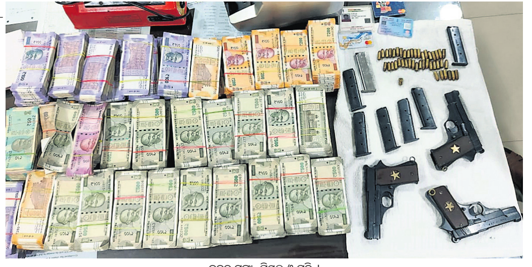
ଜବତ ଟଙ୍କା, ପିସ୍ତଲ ଓ ଚୁଳି ।

ଆବରଣ ବିଧି ଲାଗୁ ହୋଇଥିବାରୁ ସାଧାରଣତନ୍ତ୍ର ଦିବସରେ ନିଜ ଜିଲ୍ଲାରେ କୌଣସି ନେତା ଓ ମନ୍ତ୍ରୀ ଅତିଥି ଭାବେ ଯୋଗ ଦେଇପାରିବେ ନାହିଁ। ଏପରିକି ସରକାରୀ ଯୋଜନା ପ୍ରଚାର ସମ୍ପର୍କିତ ପ୍ରଘୋଷଣାମୂଳକ ହେବ ନାହିଁ ବୋଲି ରାଜ୍ୟ ନିର୍ବାଚନ କମିଶନର ଗାଳତ୍ୱଲାଭନ ଜାରି କରିଛନ୍ତି। ସାଧାରଣତନ୍ତ୍ର ଦିବସରେ ଅତିଥି ଭାବେ ଯୋଗ ଦେଉଥିବା ନେତା ଓ ମନ୍ତ୍ରୀ ନିଜ ଭାଷଣକୁ କେବଳ ରାଷ୍ଟ୍ର, ସ୍ୱାଧୀନତା ସଂଗ୍ରାମୀ, ଶହୀଦ ଓ ରାଷ୍ଟ୍ରର ଜୟଗାନ ମଧ୍ୟରେ ସୀମିତ ରଖିବେ। ଏଥିରେ କୌଣସି ପ୍ରକାର ସରକାରୀ ସଫଳତାର କାହାଣୀ କିମ୍ବା ଯୋଜନାର ସଫଳତା ସମ୍ପର୍କରେ ଉଲ୍ଲେଖ କରିପାରିବେ ନାହିଁ। ରାଜ୍ୟପାଳ ଓ ମୁଖ୍ୟମନ୍ତ୍ରୀଙ୍କ କାର୍ଯ୍ୟକ୍ରମ ସମ୍ପର୍କରେ ସମସ୍ତ ମନ୍ତ୍ରୀ, ମୁଖ୍ୟ ଶାସନ ସଚିବ, ଆରଡିଏ ଓ ଜିଲ୍ଲାପାଳଙ୍କୁ ଏହି ଗାଳତ୍ୱଲାଭନ ଅନୁସାରେ ଜାରି କରାଯାଇଛି। ଉଲ୍ଲେଖଯୋଗ୍ୟ ଯେ ସାଧାରଣତନ୍ତ୍ର ଦିବସ ସମାରୋହ ପାଳନ ପାଇଁ ପରାମର୍ଶ ଦିଆଯାଇଛି।