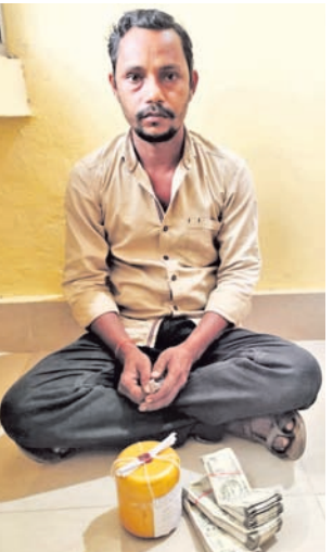
ଏନଡିପିଏସ୍ ଆକ୍-୨୧ ଅନୁଯାୟୀ ଏକ ମାମଲା (ନଂ.୨୩୭/୨୨) ରୁଜୁ ହୋଇଛି।