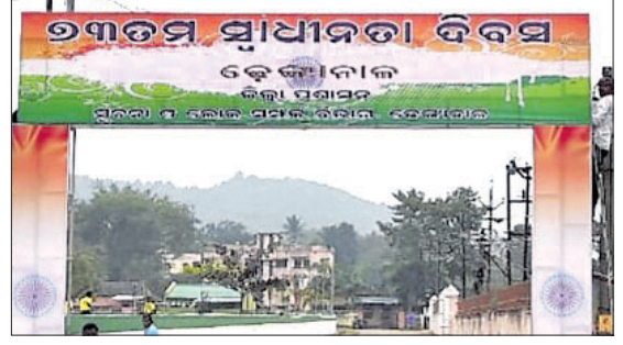
ପ୍ରଥମେ ଲଗାଯାଇଥିବା ତୋରଣ।

ଢେଙ୍କାନାଳ ସଦରରେ ଜିଲ୍ଲାସ୍ତରୀୟ ସାଧାରଣତନ୍ତ୍ର ଦିବସ ପାଳନକୁ ନେଇ ବ୍ୟାପକ ପ୍ରସ୍ତୁତି ଚାଲିଥିବାବେଳେ ତୋରଣ ବ୍ୟାନରର ତ୍ରୁଟି ପାଇଁ ପ୍ରଶାସନକୁ ଟ୍ରୋଲ୍ ହେବାକୁ ପଡ଼ିଛି। କାରଣ ୭୩ତମ ସାଧାରଣତନ୍ତ୍ର ଦିବସ ପରିବର୍ତ୍ତେ ଏଥିରେ ୭୩ତମ ସ୍ୱାଧୀନତା ଦିବସ ବୋଲି ଲେଖାଯାଇଥିଲା। ଏହାର ଫଟୋ ସୋସିଆଲ ମିଡିଆରେ ଭାଇରାଲ୍ ହେବା ପରେ ସାମାଜିକ ଗଣମାଧ୍ୟମରେ ଖୋଜାବ୍ୟକ୍ତ କରିଛନ୍ତି ବୁଦ୍ଧିଜୀବୀ। କାତାୟ ଅଧିକାରୀଙ୍କ ଦାୟିତ୍ୱରେ ଥିବା ଅଧିକାରୀଙ୍କ ସାଧାରଣ ଜ୍ଞାନ ଅଭାବକୁ ଏଭଳି ହୋଇଥିବା ସେମାନେ କହିଛନ୍ତି। ଅନ୍ୟପକ୍ଷେ ପ୍ରଶାସନ ନିଜର ଭୁଲ ସୁଧାରି ସଂଶୋଧିତ ବ୍ୟାନର ଲଗାଇଛି। ସ୍ଥାନୀୟ ଶ୍ୱାସକ୍ରିୟରେ ଜିଲ୍ଲାସ୍ତରୀୟ ପରେ ଲାଗି ମଜଲ୍‌କର ପ୍ରଶାସନ ଏବଂ ସୂଚନା ଓ ଲୋକସମ୍ପର୍କ ବିଭାଗ ପକ୍ଷରୁ ପ୍ରସ୍ତୁତ