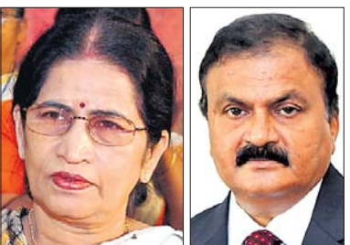
ପ୍ରତିଭା ରାୟ | ସ୍ୱର୍ଗତ ଗୁରୁପ୍ରସାଦ ମହାପାତ୍ର

ପ୍ରତିଭା ରାୟ ପଦ୍ମଭୂଷଣ ବିଜେତା ହୋଇଛନ୍ତି। ସେହିପରି ପାରାଆଧିକାର ପ୍ରମୋଦ ଭଗତ, କଳା କ୍ଷେତ୍ରରେ ଶ୍ୟାମାମଣି ଦେବୀ, ସାହିତ୍ୟ ଓ ଶିକ୍ଷାରେ