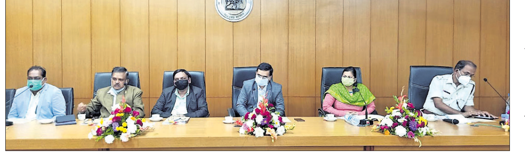
ବୈଠକରେ ଉପସ୍ଥିତ ଥିବା ଅଧିକାରୀ ।