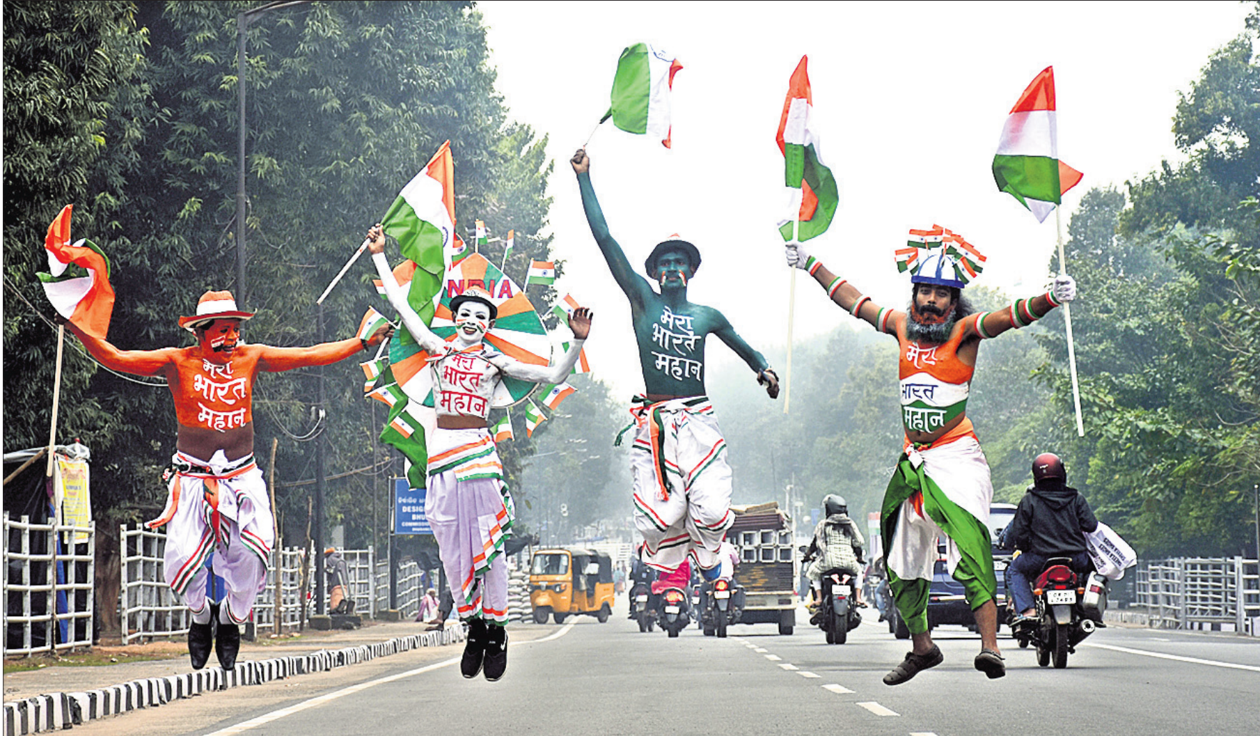
ସାଧାରଣତନ୍ତ୍ର ଦିବସ ଅବ୍ୟବହୃତ ପୂର୍ବରୁ ମଙ୍ଗଳବାର ଭୁବନେଶ୍ୱର ପିଏମ୍‌ଜିରେ 'ବନ୍ଦେ ମାତରମ୍' ଅନୁଷ୍ଠାନ ପକ୍ଷରୁ କଳାକାରମାନେ 'ମେରିଜାନ୍ ହିନ୍ଦୁସ୍ତାନ' ପରିବେଷଣ କରୁଛନ୍ତି।

ଏଠାରେ ଜନସ୍ୱାର୍ଥ ମାମଲା ଦାୟର କରିଥିବା ବ୍ୟକ୍ତିଙ୍କ ଏକତରଫା ବ୍ୟସ୍ତତା ବୁଝିହେଉଛି। ମନେରଖିବାକୁ ହେବ ଯେ, ଏହାଦ୍ୱାରା ଉତ୍ତରୀୟା ଯାଉଥିବା ବିଷୟ ହଠାତ୍ କାହିଁକି ଉତ୍ତରପ୍ରଦେଶ, ଉତ୍ତରାଖଣ୍ଡ, ପଞ୍ଜାବ, ମଣିପୁର ଓ ଗୋଆ ଭଳି ରୁରୁପୁର୍ଣ୍ଣ ରାଜ୍ୟର ନିର୍ବାଚନ ପୂର୍ବରୁ କରାଯାଉଛି, ତାହା ମଧ୍ୟ ବୁଝିବା କଷ୍ଟକର ନୁହେଁ। ଏହା ସତ୍ୟ ଯେ ବିଭିନ୍ନ ଦଳ ନିଜ ସ୍ଥିତିରେ ପରିବର୍ତ୍ତନ ଆଣିବା ପାଇଁ ଅନେକ ଉପାୟ ଆପଣାଉଛନ୍ତି। କିଏ ଧର୍ମ ସପକ୍ଷରେ କହି ଏକ ଗୋଷ୍ଠୀକୁ ମାରିବା ପାଇଁ ଉଦ୍ଦାହତ କରୁଥିବା ବେଳେ ଅନ୍ୟ କେହି ସରକାରୀ ରାଜକୋଷକୁ ଖାଲିକରି ଜନସାଧାରଣଙ୍କୁ ମାରଣ ସାମଗ୍ରୀ ଓ ସୁବିଧା ଯୋଗାଇଦେବ ବୋଲି ପ୍ରତିଷ୍ଠିତ ଦେଉଛନ୍ତି। ଦେଖିବାକୁ ଗଲେ ଉଭୟ ନିଶ୍ଚିତଭାବେ ମାରାତ୍ମକ। ବୁଝିବାର ବିଷୟ କୌଣସି ରାଜନୈତିକ ଦଳ କ୍ଷମତାକୁ ଆସିଲେ ଜନସାଧାରଣଙ୍କୁ ସୁଶାସନ, ଉତ୍ତମ ପୋଲିସ ବ୍ୟବସ୍ଥା, ବିଶୁଦ୍ଧ ପାନୀୟ ଜଳ, ଗୁଣାତ୍ମକ ଶିକ୍ଷା, ଉପଯୁକ୍ତ ସ୍ୱାସ୍ଥ୍ୟସେବା, ଭଲ ଭିଡିଓ, ବିନାମୂଲ୍ୟରେ ଆଇନ ସହାୟତା ଆଦି ଯୋଗାଇଦେବା ବିଷୟରେ ଘୋଷଣା କରୁନାହାନ୍ତି। ଏକ ଜନମଙ୍ଗଳ ରାଷ୍ଟ୍ରରେ ଗଣମାନଙ୍କ କଲ୍ୟାଣ ହେବା କଥା ସରକାରଙ୍କ ମୂଳ ଲକ୍ଷ୍ୟ। ଅନ୍ୟପକ୍ଷରେ ହାସ୍ୟାସ୍ତ ବିଷୟ ହେଉଛି ଯେ, ଦେଶର ଗରିବ ନାଗରିକଙ୍କ ପାଖରେ ସୁବିଧା ପହଞ୍ଚାଇବା ବେଳକୁ ଅନେକଙ୍କ ଦେହ ସହୁନାହିଁ। କିନ୍ତୁ ଅନେକ ଲକ୍ଷ କୋଟି ଟଙ୍କା ଛାଡ଼ି କରିଦିଆଯାଇ ହାତଗଣତି ପ୍ରିୟ କମ୍ପାନୀଗୁଡ଼ିକୁ ବଞ୍ଚାଇବା ଲାଗି ହେଉଥିବା ଉଦ୍ୟମରେ କେହି ବିଚଳିତ ହେଉନାହାନ୍ତି। ସେହିପରି ବହୁ ହଜାର କୋଟି ଟଙ୍କା ସମ୍ପତ୍ତିର ମାଲିକାନା ଥିବା ସରକାରୀ ଉଦ୍‌ଭୋଗ କମ୍ପାନୀକୁ ଅଳ୍ପ ଅର୍ଥରେ ବିକିଦେବା ବେଳେ ସରକାରଙ୍କୁ କେହି ପ୍ରଶ୍ନ କରିବାର ସ୍ୱାଧୀନତା କରୁନାହାନ୍ତି। ଅପରପକ୍ଷରେ ତେଲିଆଳ ମୁଣ୍ଡକୁ ତେଲ ବୋହୁଥିଲେ ମଧ୍ୟ କାହାର ନକର ପହୁନାହିଁ। ଏମାନଙ୍କ ପାଇଁ ନୁଷ୍ଠିରା ପୁଣ୍ୟ ସବୁବେଳେ ନୁଷ୍ଠିରା ରହିଲେ ଶାସନ ସୁରୁଖୁରୁରେ ରାଜିବ।