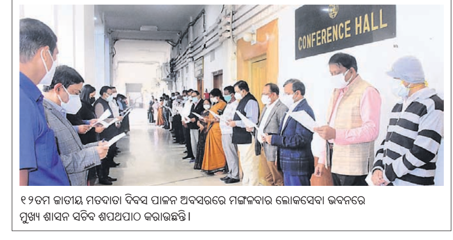
୧୨ତମ ଜାତୀୟ ମତଦାତା ଦିବସ ପାଇଁ ଅବସରରେ ମଙ୍ଗଳବାର ଲୋକସେବା ଭବନରେ ପୁଷ୍ପ ଶାସନ ସଚିବ ଶପଥପାଠ କରାଯାଇଛି।