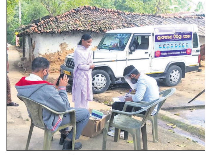
ଗ୍ରାମରେ ଭ୍ରାମ୍ୟମାଣ ସ୍ୱାସ୍ଥ୍ୟ ଶିବିର ।

ସମ୍ବଲପୁର ହାରାକୂଦ ହିଷ୍ଟାଲ୍ କୋ ପକ୍ଷରୁ କରୋନା ମହାମାରୀର ମୁକାବିଲା ପାଇଁ ପଦକ୍ଷେପ ଗ୍ରହଣ କରାଯାଇଛି।