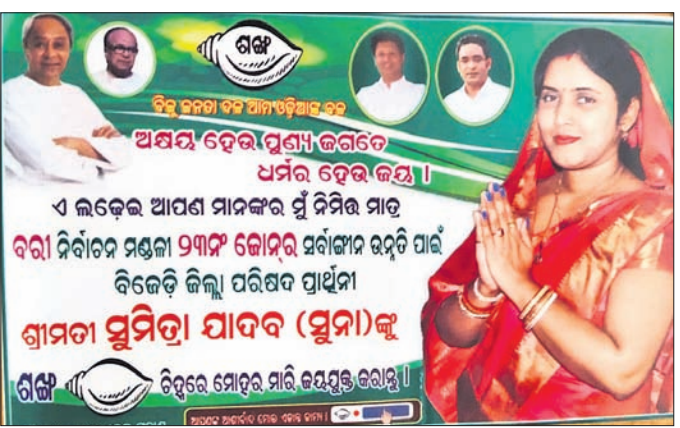
ବିଜେଡି ଜିଲ୍ଲା ପରିଷଦ ପ୍ରାର୍ଥୀଙ୍କ ପୋଷ୍ଟରରେ ବିଧାୟିକାଙ୍କ ପ୍ରଚାର ନାହିଁ।