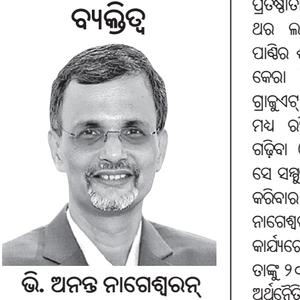
ଡ. ଅନନ୍ତ ନାଗେଶ୍ୱର

ଭାରତ ଅର୍ଥନୀତି ୨୦୧୨ର ବିପ୍ରାକରଣ ଓ ଏହାର ୪ ବର୍ଷ ପରେ କରୋନା ମହାମାରୀ ଯୋଗୁ ଦୁର୍ବଳ ହୋଇପଡ଼ିଛି। ଇନ୍ଦନାଠାରୁ ଆରମ୍ଭ କରି ନିତ୍ୟ ବ୍ୟବହାରୀ ସାଧ୍ୟ ସାମଗ୍ରୀ ଦର ନେଇ ପ୍ରତିଶତରେ ନାଗରିକ ସହଜ ହେଉଛି। ନିଯୁକ୍ତି ସଙ୍କୁଚିତ ହୋଇଯାଇଥିବାରୁ ଶିଳ୍ପିତ ବେକାରଙ୍କ ସଂଖ୍ୟା ବଢ଼ିଗଲାଣି। ଅର୍ଥନୀତିର ପ୍ରତି ବିଭାଗକୁ ଏହିଭଳି ଚର୍ଚ୍ଚା କଲେ ସକାରାତ୍ମକ ଅପେକ୍ଷା ନକାରାତ୍ମକ ଦିନ ଅଧିକ ସାମ୍ନାକୁ ଆସୁଛି। ଏଭଳି ଛ୍ପତିକୁ ସୁଧାରିବା ଲାଗି ଅର୍ଥନୀତିକ ଓ ବିଶେଷଜ୍ଞମାନେ ଲାଗି ଥିଲେ ମଧ୍ୟ ସେହା ସମାଧାନର ବାଟ ଦେଖାଯାଉ ନାହିଁ। ୧ ଫେବୃଆରୀରେ କେନ୍ଦ୍ର ସରକାର ୨୦୧୨-୨୩ ଆର୍ଥିକ ବର୍ଷ ସକାଶେ ବଜେଟ ଉପସ୍ଥାପନ କରିବେ। ତା' ପୂର୍ବରୁ ଅର୍ଥନୈତିକ ସର୍ତ୍ତ ଗୁରୁତ୍ୱ ବହନ କରିଥାଏ। ଭବିଷ୍ୟତରେ ପ୍ରଧାନ ଅର୍ଥନୈତିକ ଉପଦେଷ୍ଟା ସଞ୍ଚାୟ ସାମାଜିକ ନେତୃତ୍ୱରେ ସର୍ତ୍ତ ତିଆରି କରାଯାଇଛି। ୩୧ ଜାନୁଆରୀରେ ଅର୍ଥନୈତିକ ସର୍ତ୍ତ ପାର୍ଲମେଣ୍ଟରେ ଉପସ୍ଥାପନ ହେବା ପୂର୍ବରୁ କେନ୍ଦ୍ର ସରକାର ଅର୍ଥନୀତିକ ଭି. ଅନନ୍ତ ନାଗେଶ୍ୱରଙ୍କୁ ୨୮ ଜାନୁଆରୀରେ ପୂର୍ଣ୍ଣ ଅର୍ଥନୈତିକ ଉପଦେଷ୍ଟା (ସିଇଏ) ଭାବେ ନିଯୁକ୍ତି ଦେଇଛନ୍ତି। ଡିସେମ୍ବର ୨୦୧୧ରେ କ୍ରିଷ୍ଣପୁରୀ ସୁଦ୍ରମନ୍ଦଳ ୩ ବର୍ଷାୟା କାର୍ଯ୍ୟକାଳ ଶେଷ ହେବା ପରେ ଏହି ପଦବୀ ଶାଲିପଡ଼ିଥିଲା। ତେବେ ବଜେଟ ପୂର୍ବରୁ ନାଗେଶ୍ୱରଙ୍କ ଯୋଗଦାନ ଆର୍ଥିକ ପରିଚାଳନାରେ ସହାୟକ ହେବ ବୋଲି ଆଶା କରାଯାଉଛି। ଏଭଳି ପରିପ୍ରେକ୍ଷାରେ