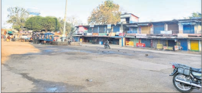
ଦୋକାନ ବନ୍ଦ ହୋଇ ସହର ଜନଶୂନ୍ୟ ହୋଇପଡ଼ିଛି।

ଝୁଲେନ ପୋଲ ମରାମତି ସାଙ୍ଗକୁ ସହର ମଧ୍ୟରେ ବସ୍ ଚଳାଚଳ ଦାବିକରି କୁଟିଣ୍ଡା ବ୍ୟବସାୟୀ ସଂଘ ଶନିବାର ଠାକୁ ଅନିର୍ଦ୍ଦିଷ୍ଟ କାଳ ପର୍ଯ୍ୟନ୍ତ ଦୋକାନ ବଜାର ଓ ବସ୍ ଚଳାଚଳ ବନ୍ଦ କରାଇଛନ୍ତି।