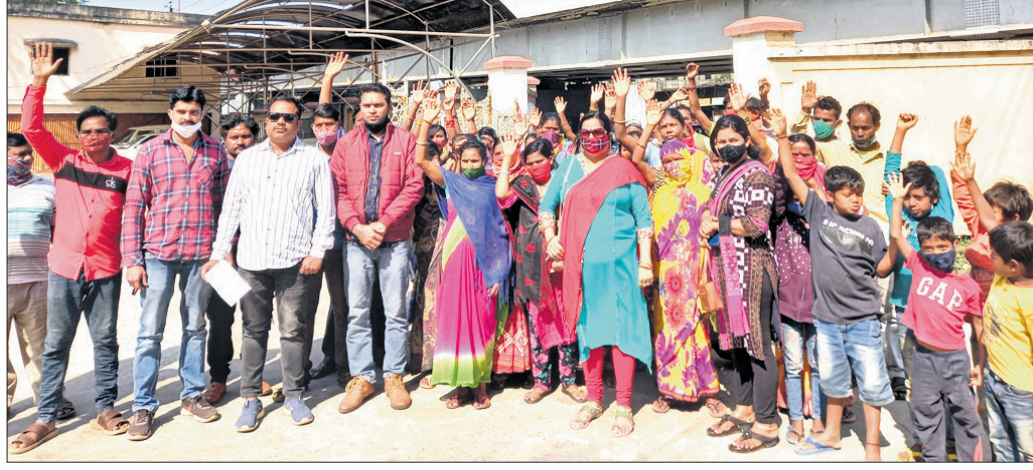
ଜିଲାପାଳଙ୍କ ଅଧିକ ସମ୍ମୁଖରେ ଚେପଟିପୁଲିଆବାସୀ ।