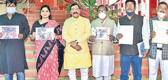
ରାଜ୍ୟ ନିର୍ବାଚନ କମିଶନରୁ ଭେଟିବାକୁ ଆସିଥିବା ଭାଜପା ପ୍ରତିନିଧି ଦଳ।