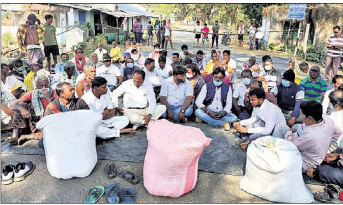
ଚାଷୀଙ୍କ ଦ୍ୱାରା କରାଯାଇଥିବା ରାସ୍ତାରେକୋ।

ପୋଲସରାପୁରଠାରେ ରାସ୍ତା ଉପରେ ଧାନ ବସ୍ତା ରଖି ଛତ୍ରପୁର-ତାରାତାରିଣୀ ମୁଖ୍ୟ ରାସ୍ତାକୁ ଚାଷୀମାନେ ଅବରୋଧ କରିଥିଲେ। ୫ ଘଣ୍ଟା ଧରି ଉକ୍ତ ମୁଖ୍ୟ