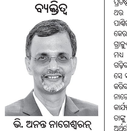
ଭି. ଅନନ୍ତ ନାଗେଶ୍ୱର

ଭାରତ ଅର୍ଥନୀତି ୨୦୧୨ର ବିପ୍ରଦାନକରଣ ଓ ଏହାର ୪ ବର୍ଷ ପରେ କରୋନା ମହାମାରୀ ଯୋଗୁ ଦୁର୍ବଳ ହୋଇପଡ଼ିଛି। ଇନ୍ଦନଠାକୁ ଆରମ୍ଭ କରି ନିତ୍ୟ ବ୍ୟବହାରୀ ସାଧ୍ୟ ସାମଗ୍ରୀ ଦର ନେଇ ପ୍ରତିଶ୍ରଣରେ ନାଗରିକ ସହଜ ହେଉଛି। ନିଯୁକ୍ତି ସକ୍ଷୁଦ୍ଧି ହୋଇଯାଇଥିବାରୁ ଶିକ୍ଷିତ ବେକାରଙ୍କ ସଂଖ୍ୟା ବଢ଼ିଗଲାଣି। ଅର୍ଥନୀତିର ପ୍ରତି ବିଭାଗକୁ ଏହିଭଳି ଚର୍ଚ୍ଚା କଲେ ସକାରାତ୍ମକ ଅପେକ୍ଷା ନକାରାତ୍ମକ ଦିନ ଅଧିକ ସାମ୍ନାକୁ ଆସୁଛି। ଏଭଳି ଛ୍ତିତିକୁ ସୁଧାରିବା ଲାଗି ଅର୍ଥନୀତିକ ଓ ବିଶେଷଜ୍ଞମାନେ ଲାଗି ଥିଲେ ମଧ୍ୟ ସେହା ସମାଧାନର ବାଟ ଦେଖାଯାଉ ନାହିଁ। ୧ ଫେବୃୟାରୀରେ କେନ୍ଦ୍ର ସରକାର ୨୦୧୨-୨୩ ଆର୍ଥିକ ବର୍ଷ ସକାଶେ ବଜେଟ ଉପସ୍ଥାପନ କରିବେ। ତା' ପୂର୍ବରୁ ଅର୍ଥନୈତିକ ସର୍ବୋତ୍ତମ ସ୍ଥିତି ବହନ କରିଥାଏ। ଭବିଷ୍ୟତରେ ପ୍ରଧାନ ଅର୍ଥନୈତିକ ଉପଦେଷ୍ଟା ସଞ୍ଚାୟ ସାମାଜିକ ନେତୃତ୍ୱରେ ସର୍ବୋତ୍ତମ ଚିନ୍ତା ପ୍ରସ୍ତୁତ କରାଯାଉଛି। ୩୧ ଜାନୁଆରୀରେ ଅର୍ଥନୈତିକ ସର୍ବୋତ୍ତମ ମାନକରେ ଉପସ୍ଥାପନ ହେବା ପୂର୍ବରୁ କେନ୍ଦ୍ର ସରକାର ଅର୍ଥନୀତିକ ଭି. ଅନନ୍ତ ନାଗେଶ୍ୱରଙ୍କୁ ୨୮ ଜାନୁଆରୀରେ ପୁଷ୍ୟ ଅର୍ଥନୈତିକ ଉପଦେଷ୍ଟା (ସିଇଏ) ଭାବେ ନିଯୁକ୍ତି ଦେଇଛନ୍ତି। ତିସେମ୍ବର ୨୦୧୧ରେ କୃଷ୍ଣପୂର୍ଣ୍ଣ ସୁଦ୍ରମନ୍ୟଙ୍କ ୩ ବର୍ଷାୟା କାର୍ଯ୍ୟକାଳ ଶେଷ ହେବା ପରେ ଏହି ପଦବୀ ଶାଳିପଡ଼ିଥିଲା। ତେବେ ବଜେଟ ପୂର୍ବରୁ ନାଗେଶ୍ୱରଙ୍କ ଯୋଗଦାନ ଆର୍ଥିକ ପରିଚାଳନାରେ ସହାୟକ ହେବ ବୋଲି ଆଶା କରାଯାଉଛି। ଏଭଳି ପରିପ୍ରେକ୍ଷାରେ