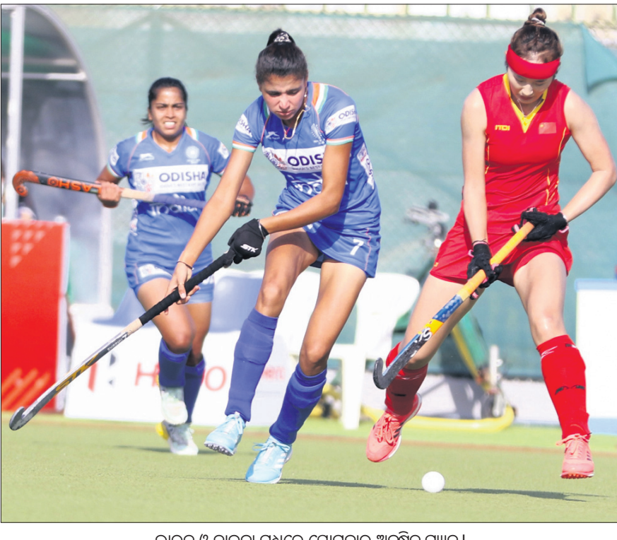
ଭାରତ ଓ ଚାଇନା ମଧ୍ୟରେ ସୋମବାର ଅନୁଷ୍ଠିତ ମ୍ୟାଚ୍ ।

ମସ୍କଟ, ୩୧୧୧ ଘାତୀୟ ସୁଲତାନ କ୍ୱାବୋସ କମ୍ପ୍ଲେକ୍ସରେ ସୋମବାର ଭାରତୀୟ ମହିଳା ହକି ଦଳ ଏଫ୍‌ଆଇଏଚ୍ ପ୍ରୋ ଲିଗ୍ ଅଭିଯାନ ଆରମ୍ଭ ହୋଇଛି। ନିଜ ପ୍ରଥମ ମ୍ୟାଚ୍‌ରେ ଭାରତ ବୃହତ୍ ବ୍ୟବଧାନରେ ଚାଲିନାଳୁ ପରାସ୍ତ କରି ଏହାର ଅଭିଯାନ ଆରମ୍ଭ କରିଛି। ଆରମ୍ଭରୁ ଆଧିପତ୍ୟ ବିସ୍ତାର କରି ଖେଳିଥିବା ଭାରତ ୭-୧ ଗୋଲରେ ବିଜୟୀ ହୋଇଛି। ଏଥିପରେ ଭାରତୀୟ ମହିଳା ଦଳ ସମ୍ପୂର୍ଣ୍ଣ ଷ୍ଟାଡ଼ିୟମ୍‌ରେ ଏହାର ହକି ପ୍ରୋ-ଲିଗ୍ ଡେବ୍ୟୁ କରିଛି। ଏହି ବିଜୟ ଫଳରେ