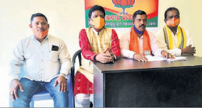
ଖବରଦାତା ସମ୍ମିଳନୀରେ ଭାବିବା ପକ୍ଷରୁ ସୂଚନା ଦିଆଯାଇଛି।

ଖୋର୍ଦ୍ଧା ଜିଲ୍ଲା ଗାମ୍ପା ବ୍ଲକ କମାଗୁରୁ ପଞ୍ଚାୟତରେ ବିଭିନ୍ନ ଯୋଜନାରେ ୭୦ଲକ୍ଷ ଟଙ୍କା ଦୁର୍ନୀତି ହୋଇଛି। ଯୋଗଦାନ ମିଳିପତାଠାରେ ଆନ୍ଦୋଳିତ ଏକ ଖବରଦାତା ସମ୍ମିଳନୀରେ ଏହାର ପର୍ଯ୍ୟାପଣ କରିଛି ଭାବିଲା। ପଞ୍ଚାୟତରେ ବିଭିନ୍ନ ଯୋଜନାରେ ଆସିଥିବା ଲକ୍ଷାଧିକ ଟଙ୍କା ମଧୁରସ୍ୱରରେ ମିଳିନିଶି ଚଳୁ କରିଛନ୍ତି। ମିଥ୍ୟା ବିଲ୍ ପ୍ରସ୍ତୁତ କରି ଟଙ୍କା ହରିଲୁଟ କରାଯାଇଛି। ଏନେଇ ଜିଲ୍ଲା ପ୍ରଶାସନ ନିକଟରେ ଅଭିଯୋଗ ସତ୍ତ୍ୱେ କୌଣସି ପଦକ୍ଷେପ ଗ୍ରହଣ କରାଯାଇନାହିଁ ବୋଲି ଭାବିବା ଅଭିଯୋଗ କରିଛନ୍ତି। ସୂଚନା ଆଇନ ବଳରେ ମିଳିଥିବା ତଥ୍ୟ ପ୍ରକାରେ, କଲ୍ୟାଣମଣ୍ଡପ ନିର୍ମାଣ ନାମରେ ୧୦ଲକ୍ଷ ଟଙ୍କା ଆୟାତ କରାଯାଇଛି। ପଞ୍ଚାୟତ ନିମନ୍ତେ ୨୫ଲକ୍ଷ ଟଙ୍କା ହିସାବରେ ୮୦ଟି ଷ୍ଟ୍ରିଟ୍ ଲାଇଟ୍ ଲାଗିଥିଲା। ଏନେଇ ୧ଲକ୍ଷ ୬୦ହଜାର