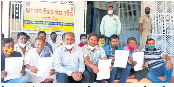
ଜିଲ୍ଲାପାଳଙ୍କ କାର୍ଯ୍ୟାଳୟ ଆଗରେ ଭାରତୀୟ କିଷାନ ସଂଘ ପକ୍ଷରୁ ଧାରଣା ଦିଆଯାଇଛି।

ଖୋର୍ଦ୍ଧା ଜିଲ୍ଲାରେ ଧାନକିଣାରେ ଅବ୍ୟବସ୍ଥା ଲାଗି ରହିଛି। ମିଲ୍ ମାଲିକଙ୍କ ମନମାନିରେ ଚାଲିଛି ମଣ୍ଡି। ଫଳରେ ଚାଷୀ ଅଭାବୀ ବିକ୍ରିର ସମ୍ମୁଖୀନ ହେଉଛନ୍ତି। ଗାଁରେ ଆନ୍ଧ୍ର ଦେପାରା ପଶି କମ୍ ମୂଲ୍ୟରେ ଧାନ କିଣି ନେଉଛନ୍ତି। ଯୋଗଦାନ ସୁଦ୍ଧା ୧୯୯୫ ମସିହାରୁ କୁଳଖ୍ୟାଳ ଧାନ କିଣାଯାଇଥିବା ଜିଲ୍ଲା ଯୋଗାଣ ବିଭାଗ ସୂଚନା ମିଳିଛି। ଅନ୍ୟପକ୍ଷେ ଧାନ ଝୋଟ ଅଖାରେ ଦେବା ଲାଗି ନିର୍ଦ୍ଦେଶନାମା ରହିଥିବା ବେଳେ କୌଣସି ମିଲ୍ ମାଲିକ ଚାଷୀଙ୍କୁ ଝୋଟ ଅଖା ଦେଉନଥିବା ଅଭିଯୋଗ ହୋଇଛି। ଏନେଇ ଭାରତୀୟ କିଷାନ ସଂଘ ଅସନ୍ତୋଷ ପ୍ରକାଶ କରିଛି। ଯୋଗଦାନ ଖୋର୍ଦ୍ଧା ଜିଲ୍ଲା ସଂଘ ଶାଖା ପକ୍ଷରୁ ଜିଲ୍ଲାପାଳଙ୍କ କାର୍ଯ୍ୟାଳୟ ଆଗରେ ଧାରଣା ଦିଆଯିବ। ସହ ଦାବିପତ୍ର ପ୍ରଦାନ କରାଯାଇଛି।