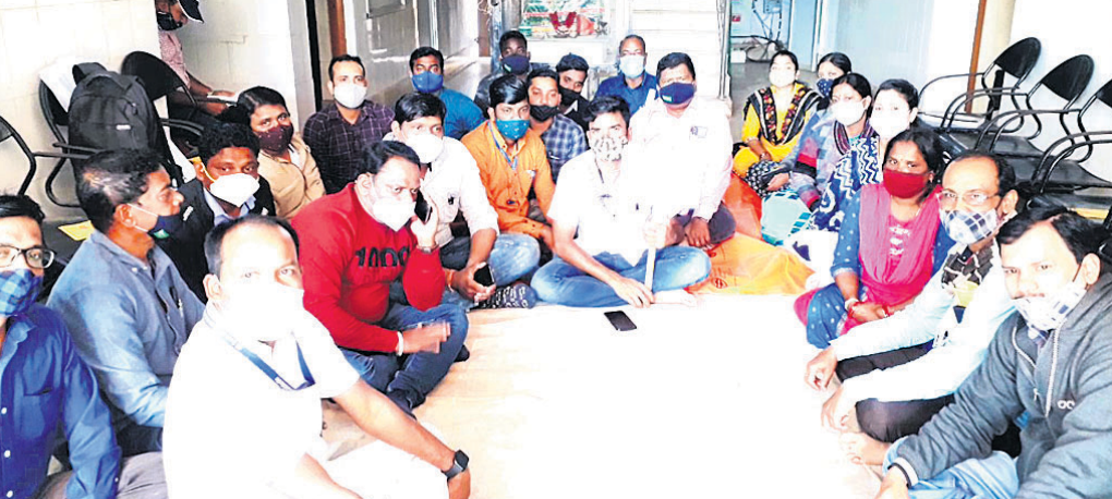
ତହସିଲଦାରଙ୍କୁ ଆକ୍ରମଣ ପ୍ରତିବାଦରେ କର୍ମଚାରୀମାନେ ଧାରଣାରେ ବସିଛନ୍ତି।