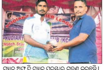
ମ୍ୟାଚ ଅଫ୍ ଦ ମ୍ୟାଚ ପୁରସ୍କାର ଗ୍ରହଣ କରୁଛନ୍ତି।

କଟଣା ପୌରାଞ୍ଚଳ କୁନିଆରା ଗ୍ରାମଠାରେ ଚାଲିଥିବା କୁନିଆରା ପ୍ରିମିୟର କ୍ରିକେଟ ଲିଗରେ ଯୋଗଦାନ ଦୁଇଟି ମ୍ୟାଚ ଅନୁଷ୍ଠିତ ହୋଇଥିଲା। ପ୍ରଥମ ମ୍ୟାଚ ବଜରଙ୍ଗୀ ଫାଇଟର ଏବଂ କରନାଥ ସ୍କୋର୍ ମଧ୍ୟରେ ଅନୁଷ୍ଠିତ ହୋଇଥିଲା। ଟପ୍ ଶୋଟର ଖେଳରେ ବଜରଙ୍ଗୀ ୨୦୦ରୁ ଅଧିକ ରନ ସଂଗ୍ରହ କରିଥିଲା। କରନାଥ ୧୧୧ରେ ୧୨୫ରୁ କଟଣା ୧୮.୧୭ରୁ ବଜରଙ୍ଗୀ