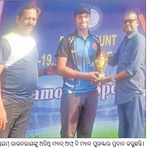
ସମୟ ରାଉତରାୟଙ୍କୁ ଅତିଥି ମ୍ୟାଚ୍ ଅଫ୍ ଦି ମ୍ୟାଚ୍ ପୁରସ୍କାର ପ୍ରଦାନ କରୁଛନ୍ତି।

ଫେରିବ। ଫେବୃଆରୀ ୧୯ ଓ ୨୦ ତାରିଖରେ ନେଦରଲାଣ୍ଡକୁ ଭେଟିବ। ଏହାପରେ ଭାରତୀୟ ମହିଳା ଦଳ ସ୍ୱିଜରଲ୍ୟାଣ୍ଡ ଓ ଜର୍ମାନୀ ଓ ଜର୍ମାନୀ ସହିତ ଏଠାରେ ପ୍ରତିଦିନିକିଆ କରିବ। ସେହିପରି ଭାରତୀୟ ପୁରୁଷ ଦଳ ଆଷ୍ଟ୍ରେଲିଆ ଫେବୃଆରୀ ୨୨ରୁ କଳିଙ୍ଗରେ ଆରମ୍ଭ ହେବ। ୨୬ ଓ ୨୭ରେ ଭାରତୀୟ ଦଳ ସ୍ୱିଜରଲ୍ୟାଣ୍ଡ ଭେଟିବ। ଏହାପରେ ଦଳ ଜର୍ମାନୀ, ଆଷ୍ଟ୍ରେଲିଆ ଓ ଜର୍ମାନୀ ବିପକ୍ଷରେ ଖେଳିବା କାର୍ଯ୍ୟକ୍ରମ ରହିଛି। ଭୁବନେଶ୍ୱର ହକି ବିଶ୍ୱକପ୍ ସମୟରେ କୋଭିଡ୍-୧୯ ଜନିତ କଟକଣା ଯୋଗୁ ସାଧାରଣ ଦର୍ଶକଙ୍କୁ ଷ୍ଟାଡ଼ିୟମ୍ ଅନୁମତି ନ ଥିଲା। ପ୍ରୋ-ଲିଗ୍‌ର ପ୍ରାରମ୍ଭିକ ପର୍ଯ୍ୟାୟରେ ସେହି କଟକଣା ବଳବତ୍ତର ରହିବା ସମ୍ଭାବନା ରହିଛି। ସଫଳ ଆୟୋଜନ ସହିତ ଖେଳାଳିଙ୍କ ସ୍ୱାସ୍ଥ୍ୟ ଓ ସୁରକ୍ଷାକୁ ରୁଚୁଛି ଦିଆଯାଉଛି।