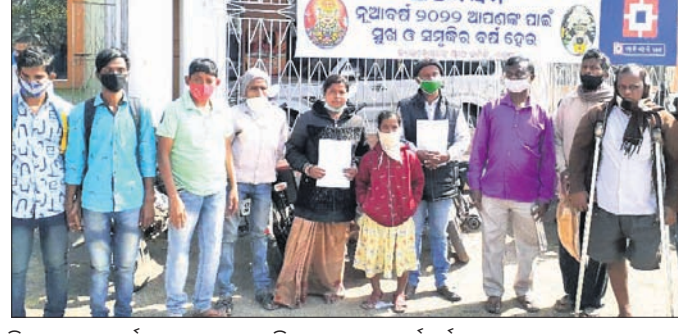
ଜିଲାପାଳଙ୍କ କାର୍ଯ୍ୟାଳୟ ସମ୍ମୁଖରେ ଭିକ୍ଷକ ମଞ୍ଚର କର୍ମଚାରୀ।