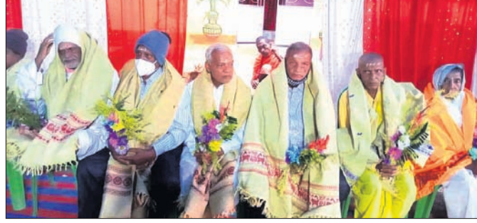
କରୁଣାକରଙ୍କ ଦ୍ୱାରା ସମ୍ବର୍ଦ୍ଧିତ ଗୁରୁମାନେ।