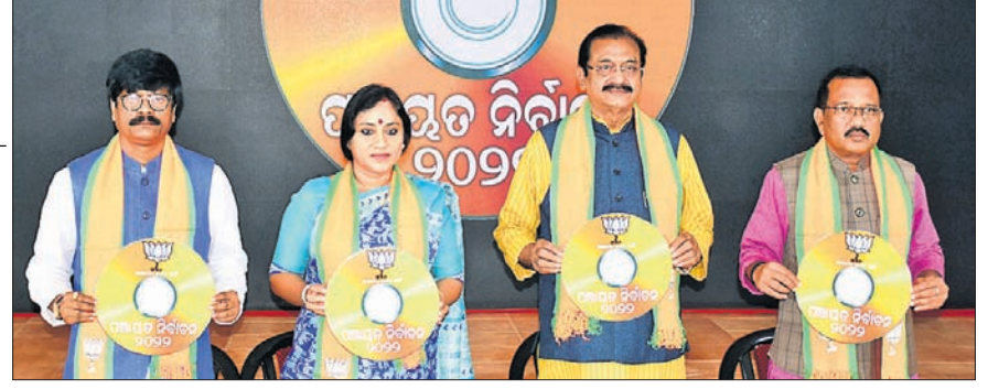
ଭାଜପା ରାଜ୍ୟ କାର୍ଯ୍ୟକ୍ରମରେ ପଞ୍ଚାୟତ ନିର୍ବାଚନ ପାଇଁ ଭିତ୍ତି ସୃଷ୍ଟି କରୁଥିବା ବ୍ୟକ୍ତିଙ୍କୁ ଦଳୀୟ ନେତୃତ୍ଵ।

କଳାହାଣ୍ଡି ଜିଲ୍ଲା କୁନାଗଡ଼ ବ୍ଲକ ବୁଦ୍ଧିବର ପଞ୍ଚାୟତରେ ଜଣେ ସରପଞ୍ଚ ପ୍ରାର୍ଥୀଙ୍କ ନିର୍ବାଚନୀ ପୋଷ୍ଟରରେ ଶିକ୍ଷକ ସ୍ଵାମୀଙ୍କ ଫଟୋ ରହିଥିବା ଦେଖିବାକୁ ମିଳିଛି।