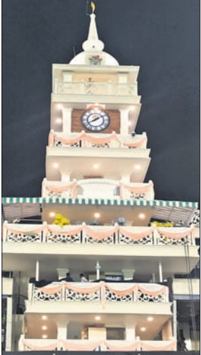
ଲିଗ୍ ପର୍ଯ୍ୟାୟ ୧୬ରୁ

ନୂଆଦିଲ୍ଲୀ, ୩୧୧ ଘରୋଇ କ୍ରିକେଟରଙ୍କ ପାଇଁ ଶୁଭ ଖବର । ଦୀର୍ଘ ବୁଲ୍‌ବର୍ଷ ପରେ ରେଭୁଲ୍ ଘରୋଇ କ୍ରିକେଟ ରଣଜୀ ଟ୍ରଫି ପ୍ରତ୍ୟାବର୍ତ୍ତନ କରୁଛି । ଭାରତୀୟ କ୍ରିକେଟ କଣ୍ଟ୍ରୋଲ ବୋର୍ଡ (ବିସିଆଇ) ଦ୍ଵାରା ପ୍ରସ୍ତୁତ ସଂଶୋଧିତ କାର୍ଯ୍ୟକ୍ରମ ଅନୁସାରେ ରଣଜୀ ଟ୍ରଫିର ଲିଗ ପର୍ଯ୍ୟାୟ ଫେବୃଆରୀ ୧୬ରୁ ମାର୍ଚ୍ଚ ୫ ପର୍ଯ୍ୟନ୍ତ ହେବ । ଦେଶର ଏହି ପ୍ରମୁଖ ଘରୋଇ କ୍ରିକେଟ