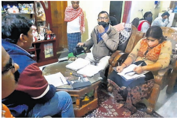
ଅଭିଯୁକ୍ତ ଯୁବକଙ୍କ ଘରେ ଭିଜିଲାନ୍ସ ଚଢ଼ାଉ ଚାଲିଛି ।