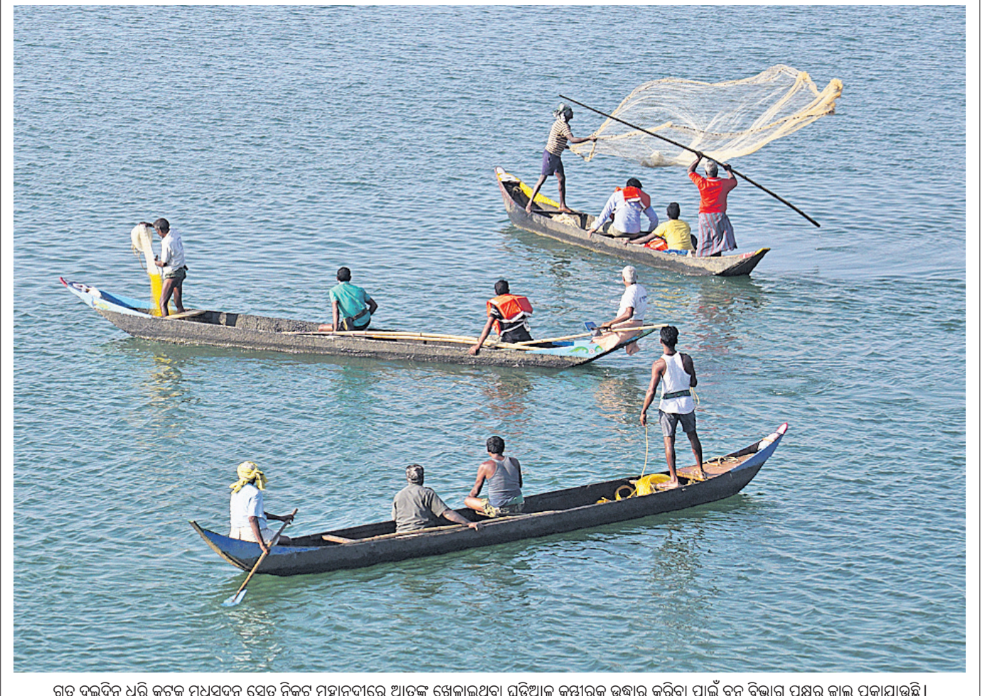
ଗତ ଦୁଇଦିନ ଧରି କଟକ ମଧୁସୂଦନ ସେତୁ ନିକଟ ମହାନଦୀରେ ଆଡ଼କ ଖେଳାଇଥିବା ଘଡ଼ିଆଳ କୁମ୍ଭୀରକୁ ଉଦ୍ଧାର କରିବା ପାଇଁ ବନ ବିଭାଗ ପକ୍ଷରୁ ଜାଲ ପକାଯାଇଛି।