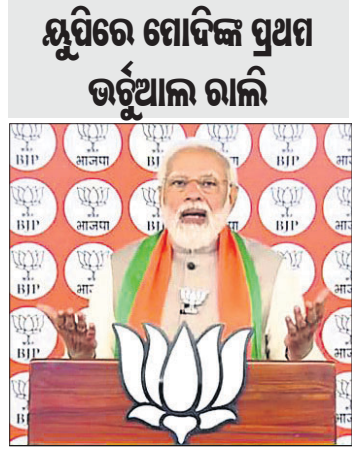
ୟୁପିରେ ମୋଦିଙ୍କ ପ୍ରଥମ ଭର୍ଚୁଆଲ ରାଲି

ଭଉଁରପ୍ରଦେଶ ବିଧାନସଭା ନିର୍ବାଚନ ପୂର୍ବରୁ ପ୍ରଧାନମନ୍ତ୍ରୀ ନରେନ୍ଦ୍ର ମୋଦି ସୋମବାର ସେଠାରେ ପ୍ରଥମ ଭର୍ଚୁଆଲ ରାଲିକୁ ସମୟାଧିକରିବା ଅବସରରେ ସମାଜବାଦୀ ପାର୍ଟି ଅଧ୍ୟକ୍ଷ ଅକ୍ଷୟକେଶ ଯାଦବଙ୍କୁ କଟା ସମାଲୋଚନା କରିଛନ୍ତି।