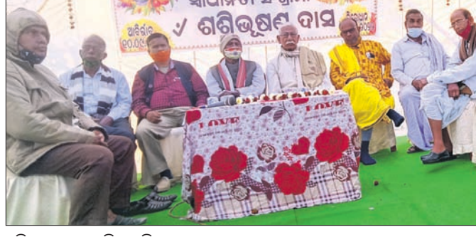
ସ୍ମୃତିସଭାରେ ଉପସ୍ଥିତ ଅତିଥି।