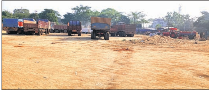
ବୈତରଣୀରୁ ବାଲି ନିଆଯାଉଛି।

କେନ୍ଦୁଝର ଜିଲ୍ଲାର ବିଭିନ୍ନ ନଦୀ/ନାଳରୁ ବାଲି ଚୋରି ଯୋଗୁଁ ସରକାରଙ୍କ ବ୍ୟାପକ ରାଜସ୍ୱ ହାନୀ ଘଟୁଥିଲେ ହେଁ ଏହାକୁ ରୋକିବା ପାଇଁ ଦୃଢ଼ ପଦକ୍ଷେପ ନିଆଯାଇ ନ ଥିବାରୁ ଅସରୋଷ ପ୍ରକାଶ ପାଇଛି। ଏଥିରେ କେତେକ ଦୁର୍ଗତିଗ୍ରସ୍ତ ରାଜସ୍ୱ ବିଭାଗ କର୍ମଚାରୀ ସାମିଲ ହୋଇଥିବାରୁ ଧରପଗଡ଼ ହେଉନାହିଁ ଏବଂ ଅଭିଯୋଗ କଲେ କାଁ ଭାଁ ଧରି ଫାଇନ ଆଦାୟ କରି ଛାଡ଼ିଦିଆଯାଇଥିବା ଅଭିଯୋଗ ହେଉଛି। ଏଭଳି ପାଟଗା ଚହସିଲ ଅନ୍ତର୍ଗତ