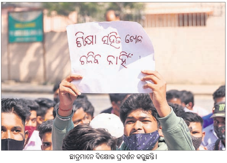
ଛାତ୍ରମାନେ ବିକ୍ଷୋଭ ପ୍ରଦର୍ଶନ କରୁଛନ୍ତି।

ଅନୁଗୋଳ ଅଧିକାରୀଙ୍କ ଦ୍ୱାରା ପରୀକ୍ଷା ବାତିଲ ଦାବିରେ ବିକ୍ଷୋଭ ପ୍ରଦର୍ଶନ କରାଯାଇଥିଲା।