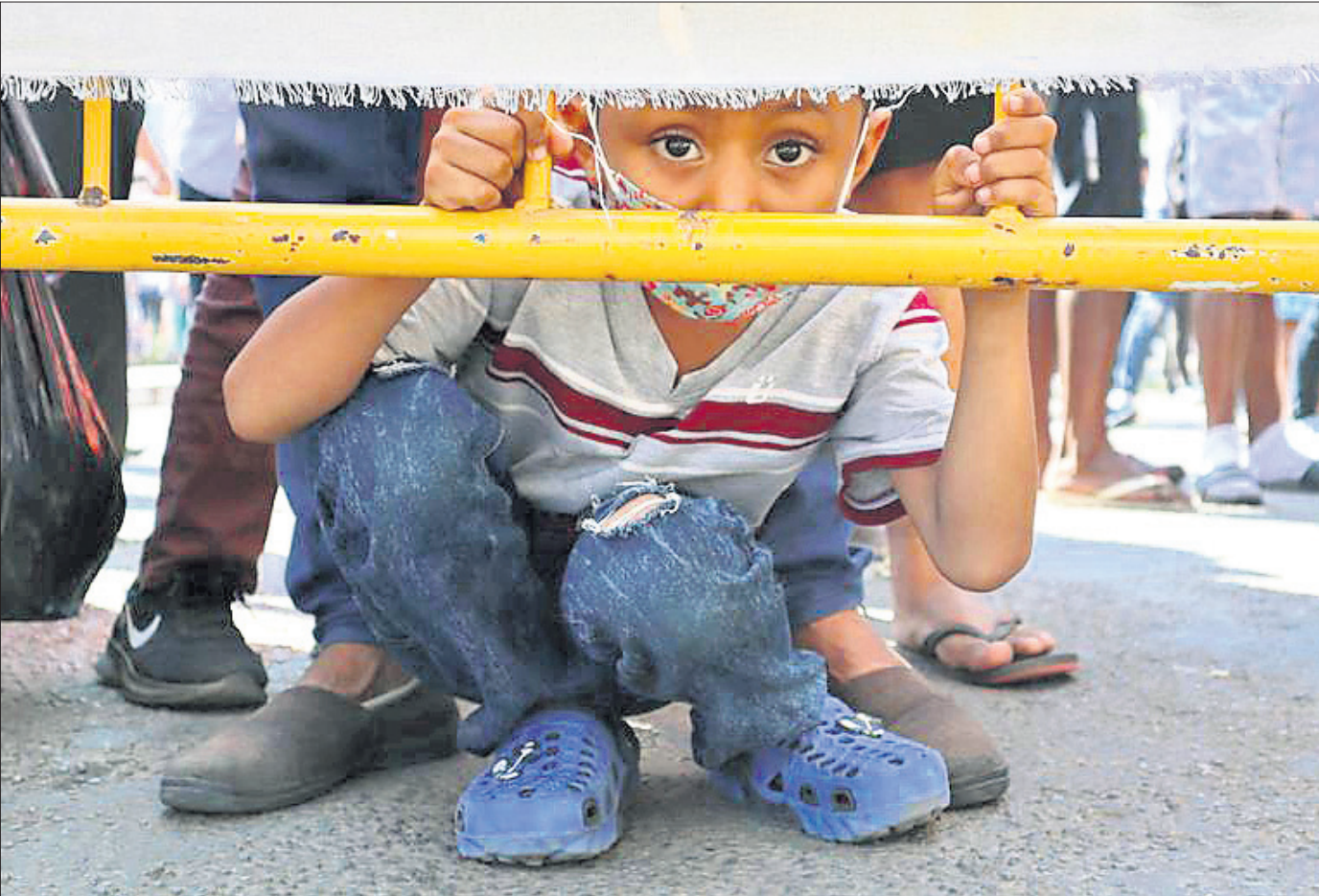
ମେକ୍ସିକୋର ତାପାଲୁଲାସ୍ଥିତ ନ୍ୟାଶନାଲ ମାଲଗ୍ରେଗନ୍ ଇନ୍ସ୍ଟିଚ୍ୟୁଟ୍ ବାହାରେ ଚୁରୁବାର ଶରଣାର୍ଥୀ ଭାବେ ନିଜ ନାମ ପଞ୍ଜୀକରଣ ପାଇଁ କୁଆଁ କୋଡ଼କୁ ଅପେକ୍ଷା କରିଛନ୍ତି କଣେ ଶିଶୁ ।

ଲଣ୍ଡନ, ୩୧: ବ୍ରିଟିଶ ପ୍ରଧାନମନ୍ତ୍ରୀ ବୋରିସ ଜନ୍ସନ୍ ଉପରେ ଇସ୍ତଫା ଲାଗି ଚାପ ବଢ଼ିବାରେ ଲାଗିଛି । ମହାମାରୀ ସମୟରେ ତାରିନିଂ ଶ୍ଟ୍ରୋକେ ଭବ୍ୟ ମନୋରାଜକୁ ନେଇ ବୋରିସ ସମାଲୋଚିତ ହୋଇଛନ୍ତି । ୨୦୨୦ ମାର୍ଚ୍ଚ ୨୫ ୨୦୨୧ ମେ’ ୧୭ ମଧ୍ୟରେ ସେଠାରେ ଏକାଧିକ ଥର ପାର୍ଟି ଆୟୋଜନ କରାଯାଇଥିବା ଅଭିଯୋଗ ହୋଇଛି । କଞ୍ଚରଭେଟିକ୍ ପାର୍ଟି ଏମ୍ପି ତାଙ୍କ ବିରୋଧରେ ଅନାମ୍ନା ପତ୍ର ଦେଇଛନ୍ତି । ସଙ୍କଟ ଚାଲିବା ଲାଗି ୧୦ ଡ୍ରାଉନିଂ ଶ୍ଟ୍ରୋକ ପକ୍ଷରୁ ଉଦ୍ୟମ ବେଳେ ବୋରିସ୍କ ସ୍ଥିତି ପ୍ରତି ବିପଦ ରହିଛି । ଏମ୍ପିମାନେ ଖୋଲାଖୋଲି ଭାବେ ପ୍ରଧାନମନ୍ତ୍ରୀଙ୍କ ଉପ୍ରାଦ୍ୟ ଦାବି କରିଛନ୍ତି ।