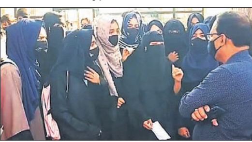
ହିଜାବ କରକଣା ନେଇ ଛାତ୍ରୀମାନେ କଲେଜ କର୍ମଚାରୀଙ୍କ ସହ ଆଲୋଚନା କରୁଛନ୍ତି ।

ବେଙ୍ଗାଳୁରୁ, ୩୧: ହିଜାବ ପିନ୍ଧିଥିବା ଛାତ୍ରୀକୁ କଲେଜରେ ଲାସ୍ କରିବା ଲାଗି କର୍ମଚାରୀ ଏକ କଲେଜ ଅନୁମତି ଦେଇନାହିଁ । ତଳେ ବର୍ଷ ଏହା ବିତାଯିବ ବୋଲି କଲେଜର ଛାତ୍ରୀମାନେ ସେମାନଙ୍କୁ ହିଜାବ ପିନ୍ଧି ଲାସ୍ କରିବାକୁ ଅନୁମତି ଦେବା ପାଇଁ ପ୍ରତିବାଦିତାଙ୍କୁ ଅନୁରୋଧ କରୁଥିବା ଭିତ୍ତି ଯୋଗୁ ଆଲ ମିଡ଼ିଆରେ ଭାଜରାଲ ହୋଇଛି । ପରାଧୀନ ଆଉ ୨ ମାସ ରହିଥିବାବେଳେ କଲେଜ ଏବେ ହିଜାବ ପିନ୍ଧିବାକୁ ନେଇ ବିବାଦ ସୃଷ୍ଟି କରୁଛି ବୋଲି ସେମାନେ ପ୍ରକାଶ କରୁଛନ୍ତି । ବର୍ତ୍ତମାନ ପ୍ରଚଳିତ ନିୟମ ଅନୁଯାୟୀ ପିଲା ହିଜାବ ପିନ୍ଧି କଲେଜ ଆସିପାରନ୍ତି, କିନ୍ତୁ କ୍ୟୁବିଲ୍ ସେମାନେ ହିଜାବ ଖୋଲିଦେବେ । ଏବେ କିଲ୍ ପ୍ରଶାସନ ସହ ଆଲୋଚନା କରାଯାଇ ପରବର୍ତ୍ତୀ ନିଷ୍ପତ୍ତି ନିଆଯିବ । ବିଚ୍ଛିନ୍ନ କଲେଜ ପାଇଁ ଭିନ୍ନ ଭିନ୍ନ ନିୟମ ରହିବା ଠିକ୍ ନୁହେଁ ବୋଲି କିଲ୍ ଦାୟିତ୍ଵରେ ଥିବା ମନ୍ତ୍ରୀ କହିଛନ୍ତି । ସୁରାମ୍ୟ ପୂର୍ବରୁ ଉତ୍ତ୍ଵିପ୍ତ ପିୟୁ ମିହିଲା କଲେଜରେ ଏଭଳି ନିୟମ ନେଇ ବିବାଦ ଲାଗି ରହିଛି ।