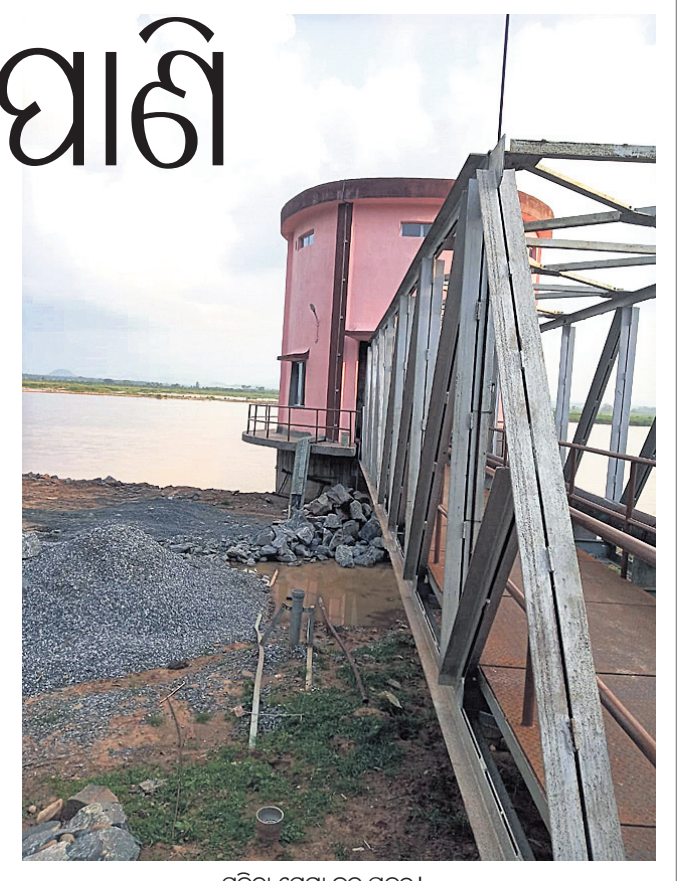
ସୁକିଆ ମେଗା ଲକ ପ୍ରକଳ୍ପ।

ନିର୍ଦ୍ଦେଶ ଦେଇଥିଲେ। ଏହି ଅର୍ଥରେ ଓଏମ୍‌ସିଏଡିସି ଗଠିତ ହୋଇଛି। ଓଏମ୍‌ସିଏଡିସି ଅର୍ଥକୁ ମୁଖ୍ୟତଃ ବୋର୍ଡ ଅଧିକାରରେ ଏବଂ ଓଭରସାଇଟ ଅଧିକାରରେ ଅନୁମୋଦନ ନେଇ ୭ଟି କ୍ଷେତ୍ରରେ ବ୍ୟୟ କରାଯିବା ପାଇଁ ସ୍ଥିର କରାଯାଇଛି। ଏଥିରେ ପାନାୟ ଲକ ଯୋଗାଣ, ଶିକ୍ଷା (ପ୍ରଶିକ୍ଷଣ ଏବଂ କୌଶଳ ବିକାଶ), ସାକ୍ଷ୍ୟ (ଅଜ୍ଞାନଘାତ କେନ୍ଦ୍ର ସମେତ), ଜୀବନ ଚାଳିକା, ଗ୍ରାମ୍ୟ ସଂଯୋଗାଳନ, ପରିବେଶ ସୁରକ୍ଷା ଓ ପ୍ରକୃଷ୍ଟ ନିୟନ୍ତ୍ରଣ, କଳ ସଂରକ୍ଷଣ ଓ ଭୂତଳ ଜଳ ଚିରାଜ ରହିଛି। ଏହିକ୍ରମରେ ଖଣି ପ୍ରଭାବିତ ଅନୁଗୋଳ, ମୟୂରଭଞ୍ଜ, କୋରାପୁଟ, ଯାଜପୁର, ସୁନ୍ଦରଗଡ଼ ଓ କେନ୍ଦୁଝର ଜିଲ୍ଲାରେ ୨୦୧୮ରୁ ପର୍ଯ୍ୟାୟକ୍ରମେ ୨୦ଟି ମେଗା ଲାଇନ୍‌ଗାଣା ପ୍ରକଳ୍ପ ନିର୍ମାଣାଧୀନ ରହିଛି। ୧୯୭୫-୬