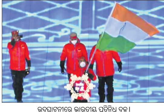
ଉଦ୍‌ଘାଟନାରେ ଭାରତୀୟ ପ୍ରତିନିଧି ଦଳ ।

ବେଙ୍ଗଳେ, ୪୧୨ (ସପ୍ତ) କରୋନା ସଂକ୍ରମଣ ଆଶଙ୍କା ଏବଂ ଆମେରିକା ଓ ବ୍ରିଟେନ ସମେତ କେତେକ ପାଶ୍ଚାତ୍ୟ ରାଷ୍ଟ୍ରର କୃତନୈତକ ବର୍ଜନ ସତ୍ତ୍ୱେ ଶୁକ୍ରବାରଠାରୁ ଆରମ୍ଭ ହୋଇଛି ବେଙ୍ଗଳେ ଓଷ୍ଠର ଅଲିମ୍ପିକ୍ସ । ଓଲିମ୍ପିକ୍ ଆଲୋକମାଳା ଓ ଆରମ୍ଭସମ୍ବନ୍ଧିତ ମଧ୍ୟରେ ରାଷ୍ଟ୍ରପତି ଜି ଜିନପିଙ୍ଗ୍ ଓ ଅନ୍ତର୍ଜାତୀୟ ଅଲିମ୍ପିକ୍ କମିଟି ସଭାପତି ଥୋମାସ ବ୍ୟାଟ୍ଟେ ଆଗମନ ସହ ଉଦ୍‌ଘାଟନା ଉତ୍ସବ ଆରମ୍ଭ ହୋଇଥିଲା । ବେଙ୍ଗଳେ ପ୍ରଥମ ସହର ଭାବେ ଉଭୟ ଶୀତକାଳୀନ ଓ ଗ୍ରୀଷ୍ମକାଳୀନ ଅଲିମ୍ପିକ୍ ଆୟୋଜନ କରିବାର ଗୌରବ ଅର୍ଜନ କରିଛି । ଉଦ୍‌ଘାଟନା ଉତ୍ସବରେ ଯୋଗ ଦେଇଥିବା ବିଶ୍ଵ ନେତାମାନଙ୍କ ମଧ୍ୟରେ ରୁଷ୍ଟିଆ ରାଷ୍ଟ୍ରପତି କ୍ଲିମିନ୍ ଗ୍ରେଡିନ ଅନ୍ୟତମ ଥିଲେ । ଇଭେଣ୍ଟର