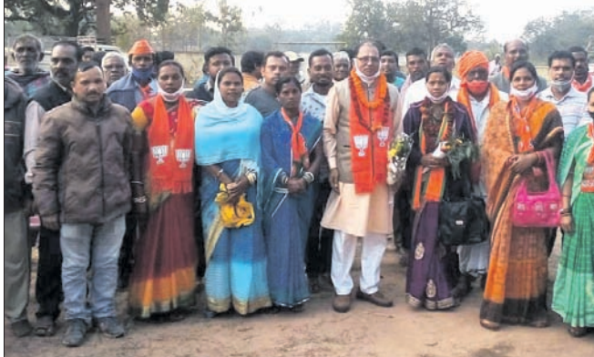
୧୫ ନଂ. କୋନ୍ରେ ଭାଜପା ପ୍ରାଥୀଙ୍କ ପ୍ରଚାର।