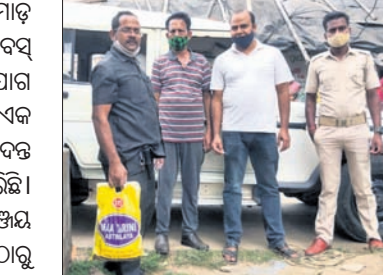
ତଦନ୍ତ କରିବାକୁ ଆସିଥିବା ଅଧିକାରୀ।