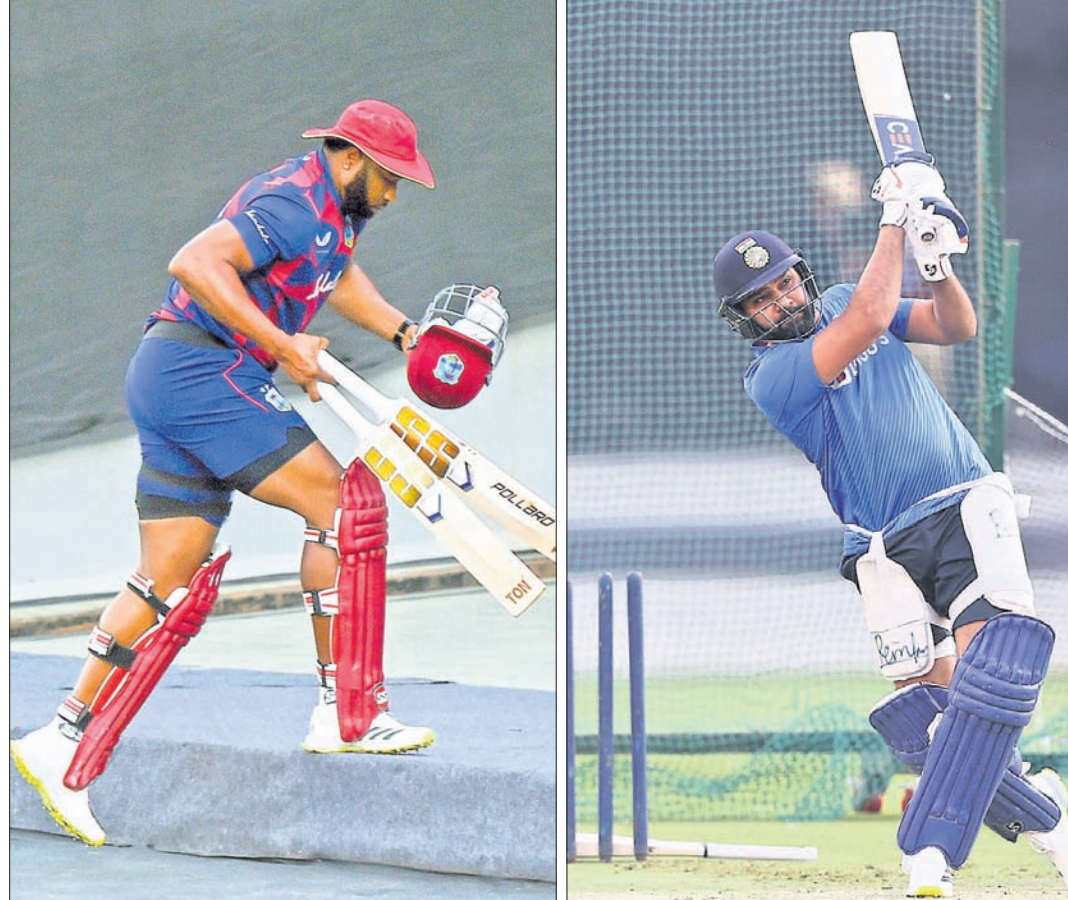
ଅଭ୍ୟାସ ଅବସରରେ ପ୍ରେସ୍ ଟିମ୍ ସମ୍ମୁଖେ ଦଳ ମଧ୍ୟରେ ଚିତ୍ରଗ୍ରହଣ କରାଯାଇଛି।

ପୁରୀ, ନଗର ସେତୁର ନିକଟସ୍ଥ କ୍ରୀଡ଼ା ସ୍ଥଳରେ ଭାରତ ଓ ଇଣ୍ଡିଆନ୍ ପ୍ରେସ୍ ଟିମ୍ ସମ୍ମୁଖେ ଦଳ ମଧ୍ୟରେ ଚିତ୍ରଗ୍ରହଣ କରାଯାଇଛି। ଦିନକିଆ ଖେଳ ପାଇଁ ଭାରତୀୟ ଦଳରେ ୧୫ଜଣ ଖିଲାରୀଙ୍କ ନାମ ଘୋଷଣା କରାଯାଇଛି। ଏଥିରେ ୧୦ଜଣ ଖିଲାରୀଙ୍କ ନାମ ଘୋଷଣା କରାଯାଇଛି ଏବଂ ୫ଜଣ ଖିଲାରୀଙ୍କ ନାମ ଘୋଷଣା କରାଯାଇଛି। ଏହାପରେ ୧୦ଜଣ ଖିଲାରୀଙ୍କ ନାମ ଘୋଷଣା କରାଯାଇଛି ଏବଂ ୫ଜଣ ଖିଲାରୀଙ୍କ ନାମ ଘୋଷଣା କରାଯାଇଛି। ଏହାପରେ ୧୦ଜଣ ଖିଲାରୀଙ୍କ ନାମ ଘୋଷଣା କରାଯାଇଛି ଏବଂ ୫ଜଣ ଖିଲାରୀଙ୍କ ନାମ ଘୋଷଣା କରାଯାଇଛି।