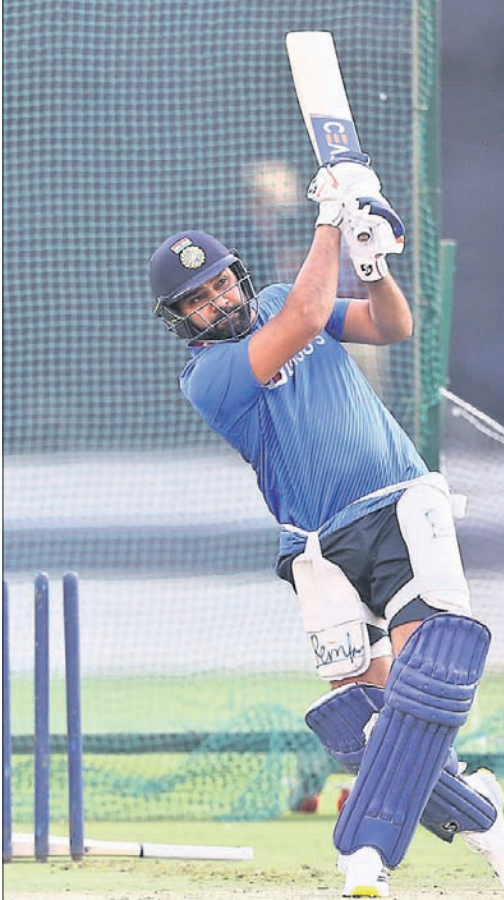
ଅଭ୍ୟାସ ଅବସରରେ ଫ୍ରେଣ୍ଡ୍‌ସ୍ ଟିମ୍ମର ଅଧିନାୟକ କିରନ ପୋଲାଟ୍ ଏବଂ ଭାରତ ଅଧିନାୟକ ରୋହିତ ଶର୍ମା।

କିରନ ପୋଲାଟ୍ ଏବଂ ରୋହିତ ଶର୍ମା ଉପସ୍ଥାପନା କରୁଥିବା ଦିନିକିଆ ମ୍ୟାଚ୍ ପାଇଁ ଉପସ୍ଥାପନା କରାଯାଇଛି।