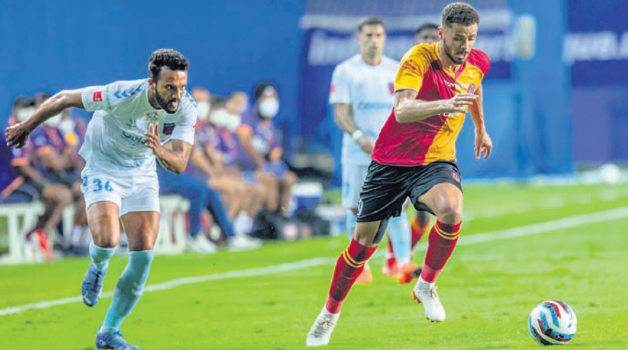
ଓଡ଼ିଶା ଏସିଏ ଓ ଇଣ୍ଡିଆନ ସୁପରଲିଗ୍ ମଧ୍ୟରେ ଯୋଗଦାନ ଅନୁଷ୍ଠିତ ଆଇଏସ୍‌ଏଲ୍ ମ୍ୟାଚ ।

ଗୋଲ ପରିଶୋଧ କରିପାରି ନ ଥିଲା । ୧୫ ମ୍ୟାଚରୁ ୬ ବିଜୟ, ୩ ଡ୍ର ଓ ୬ ପରାଜୟ ସହ ଓଡ଼ିଶା ଏସିଏ ୨୧ ପଏଣ୍ଟରେ ପହଞ୍ଚିବା ସହ ଚେନ୍ନାଇ ୬୫ ପଏଣ୍ଟରେ ଉପରାଜ୍ୟ ହୋଇଛି । ପୂର୍ବରୁ ଏହି ଦଳ ୮ମ ସ୍ଥାନରେ ଥିଲା । ଅନ୍ୟପକ୍ଷରେ ଇଣ୍ଡିଆନ ସୁପରଲିଗ୍ ୧୬ ମ୍ୟାଚରୁ ୧ ବିଜୟ, ୬ ଡ୍ର ଓ ୮ ପରାଜୟ ସହ ୧୦ ପଏଣ୍ଟରେ ଅପରିବର୍ତ୍ତିତ ରହିଛି । ଫଳରେ ୧୧ ଦଳବିଶିଷ୍ଟ ଚେନ୍ନାଇ ଇଣ୍ଡିଆନ ସୁପରଲିଗ୍ କେବଳ ନଅଇଞ୍ଚୋ ମୁନାଇରେ ଉପରକୁ ୧୦ମ ସ୍ଥାନରେ ରହିଛି ।