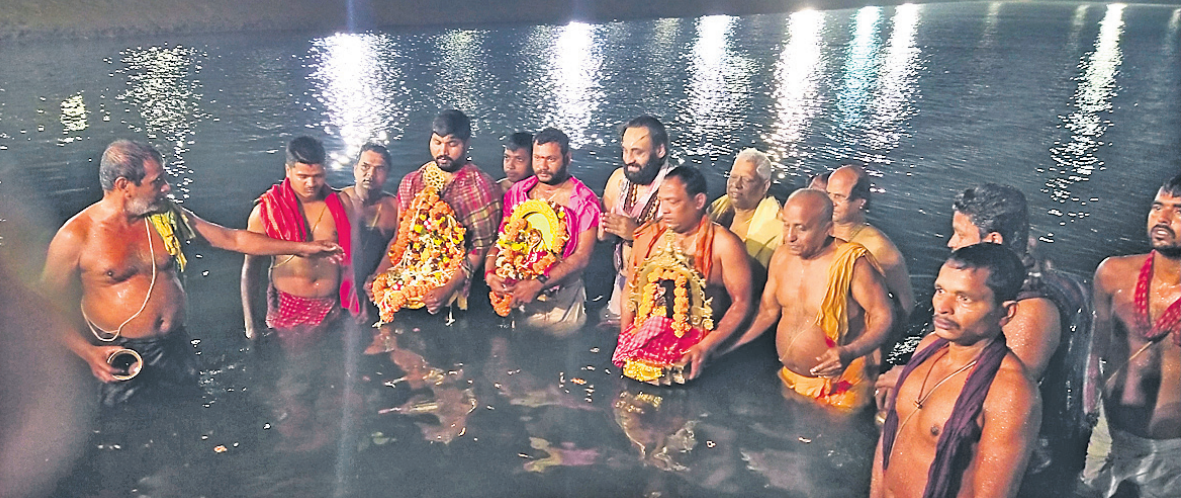
ଚନ୍ଦ୍ରଭାଗା ଚାପି ପୁଷ୍କରିଣୀରେ ସେବାୟତମାନେ ମାଠାକୁରଙ୍କୁ ବୁଡ଼ ପକାଇ ନୀତିକାନ୍ତି କରୁଛନ୍ତି।

କୋଣାର୍କ, ୭/୨ (ଡି.ଏନ.ଏ.) ପୂର୍ବ ବର୍ଷ ଭଳି ଚଳିତବର୍ଷ ମଧ୍ୟ କରୋନା କଟକଣା ଯୋଗୁଁ ଦିନା ଶ୍ରଦ୍ଧାଳୁରେ ମାଘସପ୍ତମୀ ବୁଡ଼ ସମାପନ ହୋଇଛି। ସୋମବାର ଭୋର ରାତି ୪ଟାରେ ଚନ୍ଦ୍ରଭାଗା ଚାପି ଜଳରେ ତିନି ଠାକୁରଙ୍କ ମହାସ୍ନାନ ପରେ ସେବାୟତମାନେ ବୁଡ଼ ପକାଇଥିଲେ। ପୂର୍ବ ନିର୍ଦ୍ଧାରିତ କାର୍ଯ୍ୟସୂଚୀ ଅନୁଯାୟୀ, ରବିବାର ରାତି ୧୦ଟାରେ ମାଧୁପୁର ଗ୍ରାମର ବାବା ତ୍ରିବେଣୀଶ୍ୱର, କୁରୁଜଙ୍ଗ ଗ୍ରାମର ବାବା ଦକ୍ଷିଣେଶ୍ୱର ଓ ସନ୍ତପୁର ଗ୍ରାମର ବାବା ଜଣାଣେଶ୍ୱରଙ୍କ ଚଳନ୍ତି ପ୍ରତିମା ନିକ ନିକ ଆସ୍ଥାନକୁ ବିମାନରେ ବିତ୍ତ କରିଥିଲେ। ତିନି ଠାକୁର ବର୍ଣ୍ଣାତ୍ମ୍ୟ ଶୋଭାଯାତ୍ରାରେ ବଜାର ପରିକ୍ରମା କରିବା ପରେ ଏନ୍-ଏସି କାର୍ଯ୍ୟାଳୟ, ତହସିଲ କାର୍ଯ୍ୟାଳୟ, ଆଇବିରେ ପୂଜାର୍ଚ୍ଚନା