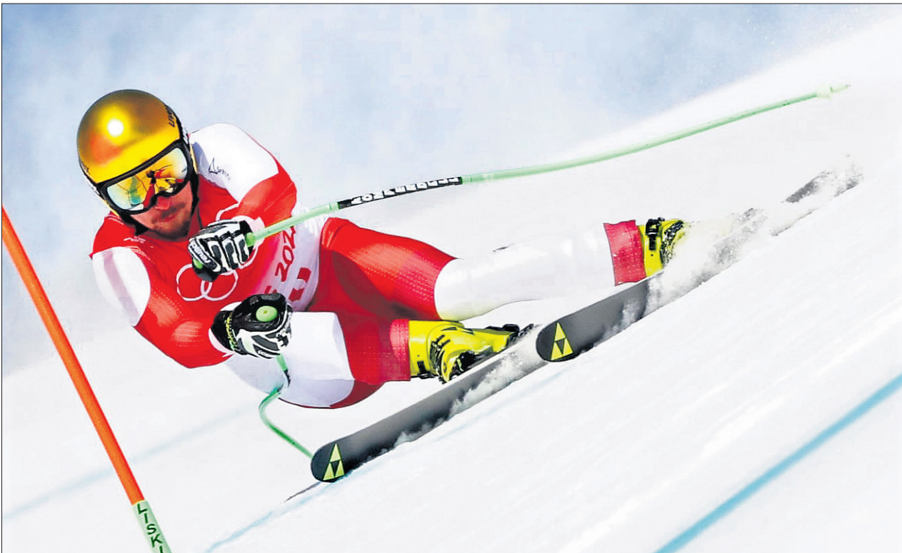
ପୁରୁଷ ଡାଉନହିଲ ରେସ୍ ଅଦସରରେ ଅଷ୍ଟ୍ରିଆର ମ୍ୟାକ୍ ଫ୍ରାଜା ।