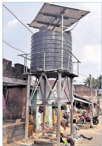
ଅଟକ ହୋଇ ପଡ଼ିଥିବା ସୌର ପାନୀୟ ଜଳ ପ୍ରକଳ୍ପ।

ସୌର ପାନୀୟ ଜଳ ପ୍ରକଳ୍ପ ଘାପନ କରାଯାଇଥିଲା। କାର୍ଯ୍ୟକ୍ରମ ହେବାର ୩ ମାସ ପରେ ଉକ୍ତ ପ୍ରକଳ୍ପଟି ଅଟକ ହୋଇପଡ଼ିଥିବା ଗ୍ରାମବାସୀଙ୍କ ସ୍ୱରୁ ଜଣାପଡ଼ିଛି। ଏଥିପ୍ରତି ବିଭାଗୀୟ ଉଚ୍ଚ କର୍ତ୍ତୃପକ୍ଷ ଓ ବ୍ଲକ ପ୍ରଶାସନ ଦୃଷ୍ଟି ଦେବାକୁ ଦାବି ହେଉଛି। ଆଗକୁ ପ୍ରାଣୀଗୁଣ୍ଡ ଆସୁଥିବାରୁ ରୁଚିତ ଅଟକ ଥିବା ସୌର ପାନୀୟ ଜଳ ପ୍ରକଳ୍ପଟିକୁ କାର୍ଯ୍ୟକ୍ରମ କରିବା ଦିଗରେ ଜିଲା ପ୍ରଶାସନ ଦୃଷ୍ଟି ଦେବାକୁ ଦାବି ହେଉଛି।