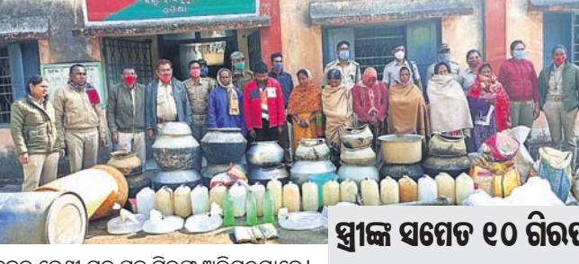
ଜବତ ଦେଖା ମଦ ସହ ଗିରଫ ଅଭିଯୁକ୍ତମାନେ।