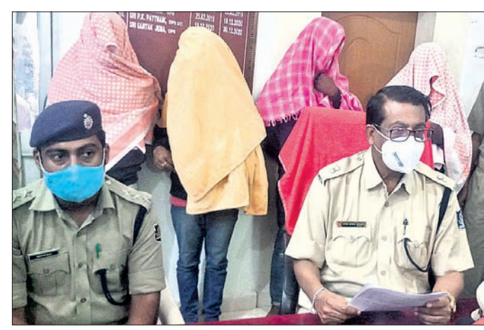
ଖବରଦାତା ସମ୍ମିଳନୀରେ ଅଭିଯୁକ୍ତଙ୍କୁ ହାତର କରାଯାଇଛି।