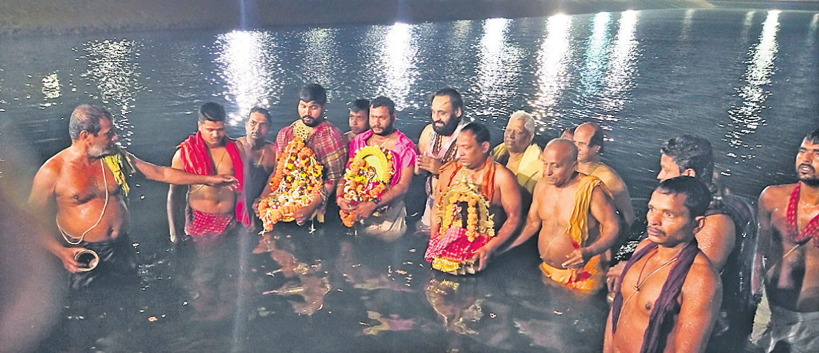
ଚନ୍ଦ୍ରଭାଗା ଚାପି ପୁଷ୍କରିଣୀରେ ସେବାୟତମାନେ ମାଠାକୁରଙ୍କୁ ବୁଡ଼ ପକାଇ ନୀତିକାନ୍ତି କରୁଛନ୍ତି।

କୋଣାର୍କ, ୭/୨(ବି.ଏନ.ଏ.) ପୂର୍ବ ବର୍ଷ ଭଳି ଚଳିତବର୍ଷ ମଧ୍ୟ କରୋନା କଟକଣା ଯୋଗୁଁ ଦିନା ଶ୍ରଦ୍ଧାଳୁରେ ମାଘସପ୍ତମୀ ବୁଡ଼ ସମାପନ ହୋଇଛି।