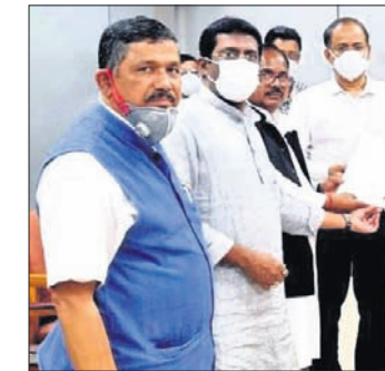
ରାଜ୍ୟ ନିର୍ବାଚନ କମିଶନରୁ ଉଦ୍ଦେଶ୍ୟରେ ଦାବିପତ୍ର ଦେଉଛନ୍ତି ଭାଜପା ନେତୃତ୍ୱ।

ବିଜେଡିର ମନ୍ତ୍ରୀ ଓ ନେତାଙ୍କ ପ୍ରତ୍ୟକ୍ଷ ପ୍ରରୋଚନାରେ ସରକାରୀ କର୍ମଚାରୀମାନେ ଶାସକ ଦଳ ସପକ୍ଷରେ ପ୍ରଚାର କରୁଛନ୍ତି। ଏଭଳି ଘଟଣାର ଭିତ୍ତି ଗଣମାଧ୍ୟମରେ ଭାଇରାଲ ହେଇଥିଲେ ମଧ୍ୟ ରାଜ୍ୟ ନିର୍ବାଚନ କମିଶନ ନୀରବଦ୍ରଷ୍ଟ୍ୟା ସାଜିଥିବା ଭାଜପାର ପ୍ରତିନିଧି ଦଳ ଅଭିଯୋଗ କରିଛନ୍ତି। ଭାଜପାର ଏକ ପ୍ରତିନିଧି ଦଳ ସୋମବାର ରାଜ୍ୟ ନିର୍ବାଚନ କମିଶନକୁ ଭେଟି ଅଭିଯୋଗ କରିଛନ୍ତି, ବାବଦରେ ଅଭିଯୋଗ ସତ୍ତ୍ୱେ କମିଶନ କୌଣସି କାର୍ଯ୍ୟାନୁଷ୍ଠାନ ନେଇନାହାନ୍ତି। ଆଗାମୀ ଦିନ ନିର୍ବାଚନ ପାଇଁ ପୌରାଧ୍ୟକ୍ଷ ସଂରକ୍ଷଣକୁ ନେଇ ହୋଇଥିବା ଏକ ବଡ଼ ଚଞ୍ଚଳକା ସାମ୍ନାକୁ ଆସିଛି। ସୁଦରଗଡ଼ ଜିଲାର ବାରିପଦ୍ମପୁର ସ୍ତ୍ରୀନିଧିପାଳିକା ୮୦ ପ୍ରତିଶତ ଆଦିବାସୀ ବହୁଳ ଏବଂ ୩ଟି ଖଣ୍ଡି ଅଣସଂରକ୍ଷିତ ହୋଇଥିବା ବେଳେ ଅନ୍ୟ ସମସ୍ତ ଏଫ୍ଟିଆଇ ପାଇଁ ସଂରକ୍ଷିତ ପଦ୍ମ ବିଜେଡି ଆଧାରରେ ଅଣସଂରକ୍ଷିତ ଭାବେ ପ୍ରକାଶ ପାଇଛି ବୋଲି ଭାଜପା