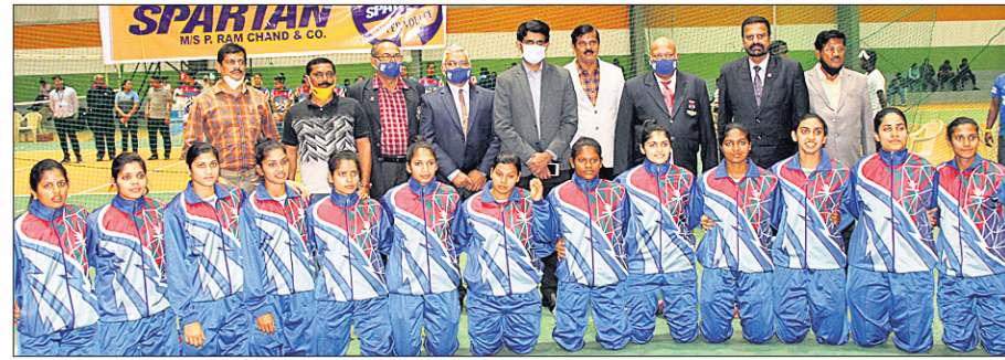
ଉଦ୍ଘାଟନା କାର୍ଯ୍ୟକ୍ରମରେ ଅତିଥିକ ଗହଣରେ ଓଡ଼ିଶା ମହିଳା ଭଲିବଲ ଦଳର ଖେଳାଳିମାନେ।

ଭୁବନେଶ୍ଵର, ୭/୨ (କ୍ରୀଡ଼ା ପ୍ରତିନିଧି) କିର୍ ବିଶ୍ଵବିଦ୍ୟାଳୟର ବିଜୁ ପଟ୍ଟନାୟକ ଜନତୋର ଷ୍ଟାଡ଼ିୟମରେ ୭୦ତମ ଜାତୀୟ ଭଲିବଲ (ମହିଳା/ପୁରୁଷ) ଚାମ୍ପିୟନଶିପ୍ ସୋମବାର ଉଦ୍ଘାଟିତ ହୋଇଛି। ଭଲିବଲ ଫେଡେରେଶନ ଅଫ ଇଣ୍ଡିଆ (ଭିଏଫଆଇ) ଓ ଓଡ଼ିଶା ଭଲିବଲ ଆସୋସିଏଶନ (ଓଭିଏ)ର ମିଳିତ ଆରମ୍ଭକର୍ତ୍ତାଙ୍କୁ ଉଦ୍ଘାଟନା କାର୍ଯ୍ୟକ୍ରମରେ ଅତିଥିକ ଗହଣରେ ଓଡ଼ିଶା ମହିଳା ଭଲିବଲ ଦଳର ଖେଳାଳିମାନେ।