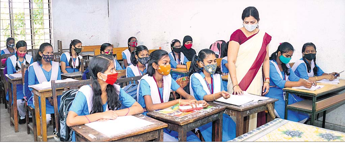
ସୋମବାର ସ୍କୁଲ ଖୋଲିବା ପରେ କଟକ ରେଭେନ୍ସା ସରକାରୀ ବାଦିକା ଉଚ୍ଚ ବିଦ୍ୟାଳୟରେ ପିଲାମାନେ ପାଠ ପଢୁଛନ୍ତି।