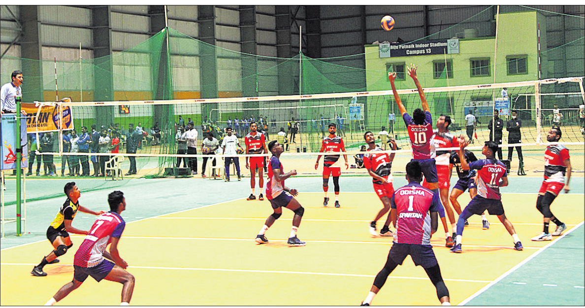
କିର୍ ବିଶ୍ଵବିଦ୍ୟାଳୟର ବିଜୁ ପଟ୍ଟନାୟକ ଜନତୋର ଷ୍ଟାଡ଼ିୟମରେ ଆରମ୍ଭ ହୋଇଥିବା ଜାତୀୟ ସିନିୟର ଭଲିବଲ ଉଦ୍ଘାଟିତ ସୋମବାର ଓଡ଼ିଶା-ବିହାର ପୁରୁଷ ବିଭାଗ ମ୍ୟାଚ ।