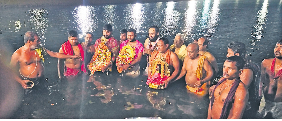
ଚନ୍ଦ୍ରଭାଗା ଚୀର୍ଡ଼ ପୁଷ୍ପରିଣାରେ ସେବାୟତମାନେ ୩୦୧କ୍ରମେ ବୁଡ଼ ପକାଇ ନୀତିକାନ୍ତି କରୁଛନ୍ତି।

କୋଣାର୍କ, ୭/୨(ଭି.ଏନ.ଏ.) ପୂର୍ବ ବର୍ଷ ଭଳି ଚଳିତବର୍ଷ ମଧ୍ୟ କରୋନା କଟକଣା ଯୋଗୁଁ ବିନା ଶ୍ରଦ୍ଧାଳୁରେ ମାଘସପ୍ତମୀ ବୁଡ଼ ସମାପନ ହୋଇଛି।