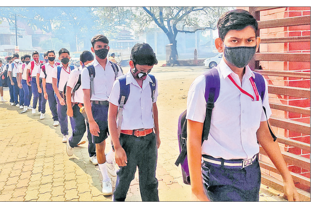
ଅନୁଗୋଳ ଉଚ୍ଚ ବିଦ୍ୟାଳୟ ଭିତରୁ ଛାତ୍ରମାନେ ପ୍ରବେଶ କରୁଛନ୍ତି।