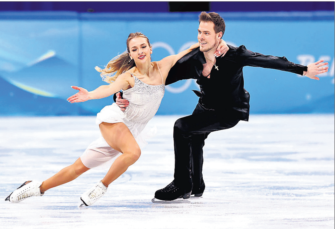
ବେଙ୍ଗାଳୀରେ ଚାଲିଥିବା ଓଡ଼ିଶା ଅଲିମ୍ପିକ୍ସର ଯୋଗଦାନ ଫିଗର ଡ୍ୟାନ୍ସରେ ଦୁଇ ପ୍ରତିଯୋଗୀ କଳାକୌଶଳ ପ୍ରଦର୍ଶନ କରୁଛନ୍ତି ।