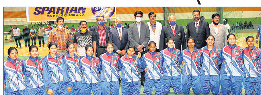
ଉଦ୍‌ଘାଟନୀ କାର୍ଯ୍ୟକ୍ରମରେ ଅତିଥିକ ଗହଣରେ ଓଡ଼ିଶା ମହିଳା ଭଲିବଲ ଦଳର ଖେଳାଳିମାନେ ।

ଭୁବନେଶ୍ୱର, ୭/୨ (କ୍ରୀଡ଼ା ପ୍ରତିଷ୍ଠା) କିର୍ ବିଦ୍ୟାଳୟର ବିଦୁଳ ପଟ୍ଟନାୟକ ଇନ୍ଦୋର ଷ୍ଟାଡ଼ିୟମରେ ୭୦ତମ ଜାତୀୟ ଭଲିବଲ (ମହିଳା/ପୁରୁଷ) ଚାମ୍ପିୟନଶିପ୍ ଯୋଜନାରେ ଉଦ୍‌ଘାଟିତ ହୋଇଛି । ଭଲିବଲ ଫେଡେରେଶନ ଅଫ ଇଣ୍ଡିଆ (ଭିଏଫଆଇ) ଓ ଓଡ଼ିଶା ଭଲିବଲ ଆସୋସିଏଶନ (ଓଭିଏ)ର ମିଳିତ ଆରୋହଣରେ