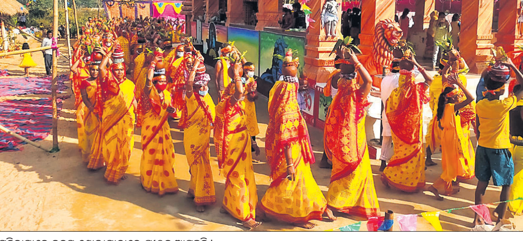
ମହିଳାମାନେ କଳସ ଶୋଭାଯାତ୍ରାରେ ପାଠକୁ ଆସୁଛନ୍ତି।