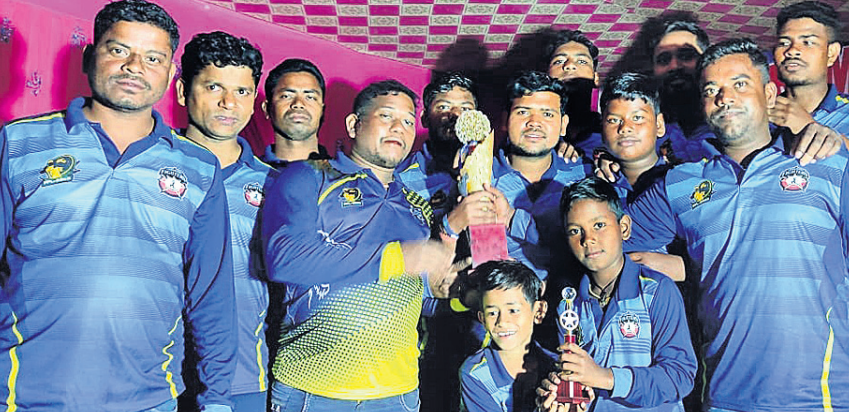
ଚାମ୍ପିୟନ ବିଜୟ ଡ୍ୱାରିୟର୍ସ ଦଳର ଖେଳାଳିମାନେ ଗ୍ରୁପ୍ ସହ ।

ପୁରୁଣା ଭୁବନେଶ୍ୱର, ୭/୨ (ପି.ଟି.): ସ୍ଥାନୀୟ କୁକୁଡ଼ା ଘାଲ ପାଟଣା ଖେଳପଡ଼ିଆରେ ଅନୁଷ୍ଠିତ ପାଟଣା ପ୍ରମିୟର ଲିଗରେ ବିଜୟ ଡ୍ୱାରିୟର୍ସ ଚାମ୍ପିୟନ ହୋଇଛି । ୬ ଓଭରବିଶିଷ୍ଟ ଏହି ଚୁନାବଳୀରେ ୪ଟି ଦଳ ଭାଗ ନେଇଥିଲେ । ଏଥିରେ ୬ଟି ଲିଗ୍, ୨ଟି କ୍ୱାଲିଫାୟର ଓ ଗୋଟିଏ ଫାଇନାଲ ମ୍ୟାଚ ଖେଳାଯାଇଥିଲା । ଫାଇନାଲ ମ୍ୟାଚ୍‌ରେ ଅର୍ଜୁନ ଫାଲଗର୍ସ ପ୍ରଥମେ ବ୍ୟାଟିଂ କରି ନିର୍ଦ୍ଧାରିତ ଓଭରରେ ୪୫ ରନ୍ କରିଥିଲା । ଜବାବରେ ବିଜୟ ଡ୍ୱାରିୟର୍ସ ୫.୩ ଓଭରରେ ୪୬ ରନ୍ କରି ବିଜୟ ଲାଭ କରିବା ସହ ଚାମ୍ପିୟନ ହୋଇଥିଲା । ସାମାଜିକ କର୍ମୀ