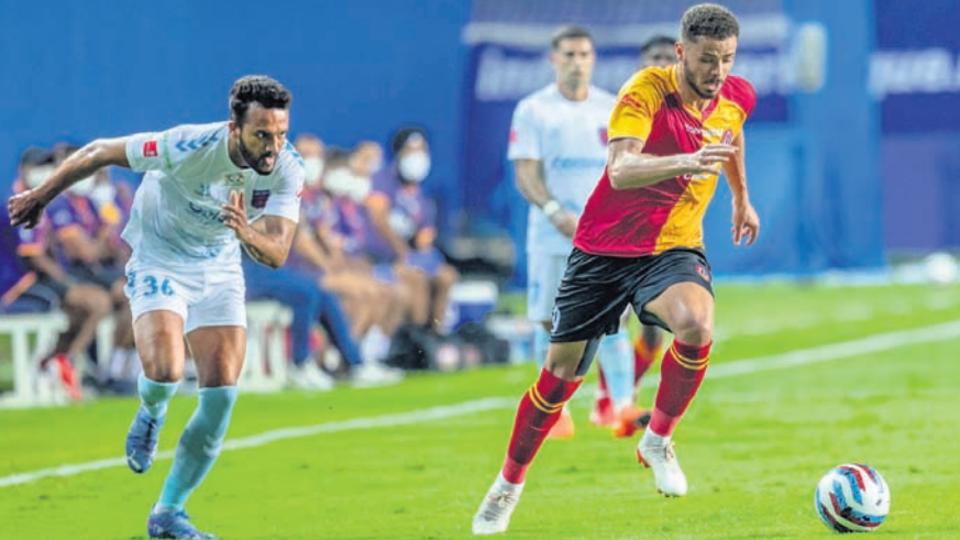
ଓଡ଼ିଶା ଏସିଏ ଓ ଇଣ୍ଡିଆନ ସୁପରଲିଗ୍ ମଧ୍ୟରେ ଯୋଗଦାନ ଅନୁଷ୍ଠିତ ଆଇଏସ୍‌ଏଲ୍ ମ୍ୟାଚ ।