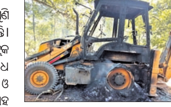
ମାଓବାଦୀ ପୋଡ଼ି ଦେଇଥିବା ଜେସିବି।

କନ୍ଧମାଳ ଜିଲ୍ଲାରେ ମାଓବାଦୀମାନେ ପୁଣି ସେମାନଙ୍କ ଉପସ୍ଥିତ କାହିଁକି କରିଛନ୍ତି। ସୋମବାର ରାତିରେ ପିରିଲିଆ ବ୍ଲକ୍ କିଆପୁଣ୍ଡାରେ ରାସ୍ତା ନିର୍ମାଣକୁ ବିରୋଧ କରି ଏକ ଠିକା ସଂଘର ଜେସିବି ଓ ପୋକଲିନ୍ ପୋଡ଼ିଛନ୍ତି। ଏଥିସହ ସେଠାରେ ପୋଷ୍ଟର, ବ୍ୟାନର ମାରିଛନ୍ତି। ନିର୍ବାଚନ ପାଖେଇ ଆସୁଥିବାରୁ ମାଓବାଦୀଙ୍କ ଏପରି ଲକ୍ଷ୍ୟକାଣ୍ଡ ଲୋକଙ୍କ ମଧ୍ୟରେ ଆତଙ୍କ ଖେଳାଇ ଦେଇଛି। ମାଣ୍ଡିପଡ଼ା ଠାରୁ କନ୍ଧମାଳ ପର୍ଯ୍ୟନ୍ତ ରାଜ୍ୟ ରାଜପଥ ନିର୍ମାଣ ଚାଲିଛି। ଦୀର୍ଘଦିନ ହେଲା ଏକ ଠିକାସଂଘ ଏହି କାର୍ଯ୍ୟ କରୁଛି। ସୋମବାର ମଧ୍ୟରାତ୍ରିରେ ମାଓବାଦୀମାନେ କିଆପୁଣ୍ଡା ପାଖରେ ପହଞ୍ଚି ଉକ୍ତ ରାସ୍ତା କାମରେ ଲାଗିଥିବା ଏକ ଜେସିବି ଏବଂ ପୋକଲିନ୍ ମେଶିନରେ ନିଆଁ