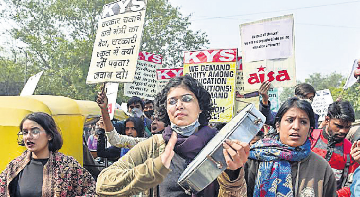
ଦିଲ୍ଲୀ ଯୁନିଭର୍ସିଟି ଖୋଲିବା ଦାବିରେ ବିଭିନ୍ନ ଛାତ୍ର ସଙ୍ଗଠନର ସଭ୍ୟମାନେ ମଙ୍ଗଳବାର ଦୁଆଦିଲ୍ଲୀରେ ବିକ୍ଷୋଭ ପ୍ରଦର୍ଶନ କରୁଛନ୍ତି।