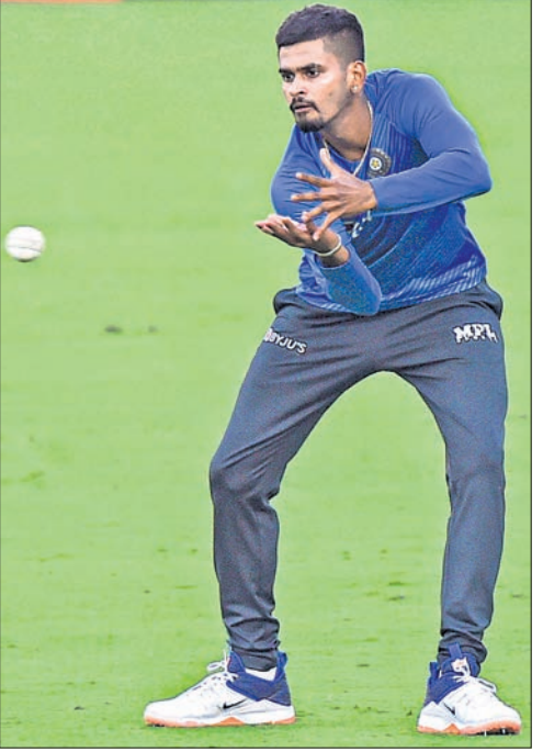
ମଙ୍ଗଳବାର ଟ୍ରେନିଂକୁ ଓହ୍ଲାଇଥିବା ଶିଖର ଧାଡ଼ନ ଓ ଶ୍ରେୟାସ ଆୟାର।

ଅହମଦାବାଦ, ୮୧୨ (ପି.ଟି.): ଗତ ସପ୍ତାହରେ କୋଭିଡ୍-୧୯ରେ ସଂକ୍ରମିତ ହୋଇଥିବା ଭାରତର ସିନିୟର ଓପନର ଶିଖର ଧାଡ଼ନ ଓ ବ୍ୟାଟର ଶ୍ରେୟାସ ଆୟାର ମଙ୍ଗଳବାର ଟ୍ରେନିଂ ଆରମ୍ଭ କରିଛନ୍ତି। ଦୁଇଙ୍କର ଚେଷ୍ଟା ରିପୋର୍ଟ ନେରେଟିଭ୍ ଆସିଥିବାବେଳେ ଆଇସୋଲେଶନ ପରିସ୍ଥିତି ସମାପ୍ତ ହୋଇଛି। ବୁଲ୍ ଖେଳାଳି