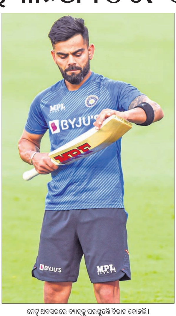
ନେତୃ ଅବସରରେ ବ୍ୟାଟ୍‌କୁ ପରଖୁଛନ୍ତି ବିରାଟ କୋହଲି।