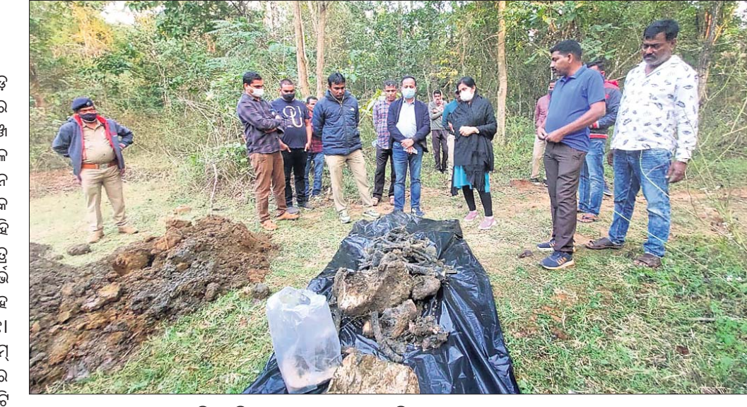
ଘଟଣାସ୍ଥଳରେ ଜାଲମୁତାସ୍ତ୍ର ଏକ୍ସପ୍ଟିଭ୍ ଟିମ୍ ନିୟମିତ ଅଧିକାରୀ ତଦନ୍ତ କରୁଛନ୍ତି।

ହାତୀ ମୃତ୍ୟୁକୁ ନେଇ ପୁଣି ଚର୍ଚ୍ଚାରେ ଆଠଗଡ଼ ବନଖଣ୍ଡ। ହାତୀ ମୃତ୍ୟୁ ପାଇଁ କର୍ତ୍ତବ୍ୟରେ ଅବହେଳା ଅଭିଯୋଗରେ ଆଠଗଡ଼ ରେଞ୍ଜ ଅଧିକାରୀ ନିଲମିତ ହୋଇଥିବାବେଳେ ସେହି ଆଠଗଡ଼ ବନଖଣ୍ଡ ଅଧୀନ ନରସିଂହପୁର ଖେଡ଼ ରେଞ୍ଜରୁ ପୁଣି ଏକ ହାତୀ ମୃତ୍ୟୁ ଘଟଣା ସାମ୍ନାକୁ ଆସିଛି।