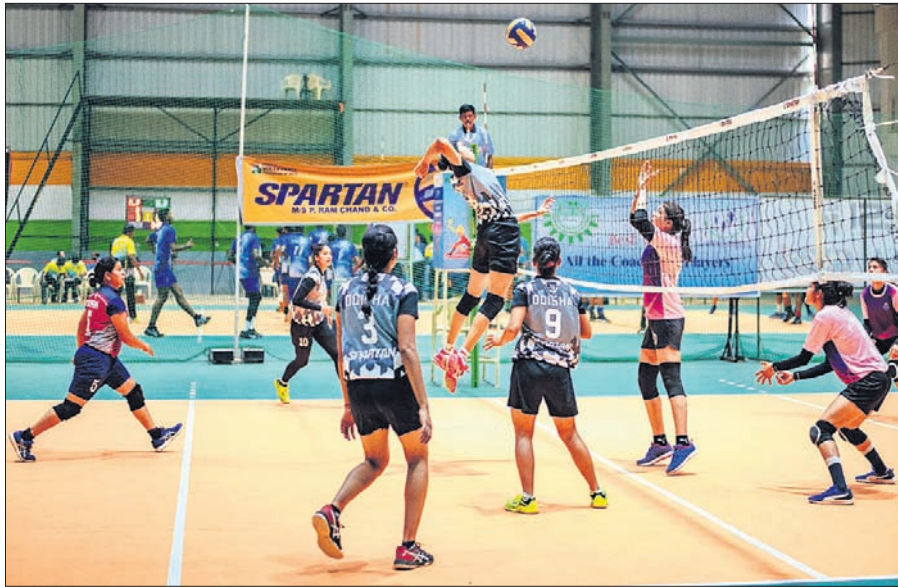
ଜାତୀୟ ସିନିୟର ଭଲିବଲ୍‌ରେ ମଙ୍ଗଳବାର ଓଡ଼ିଶା ଓ ଉତ୍ତରାଖଣ୍ଡ ମଧ୍ୟରେ ଅନୁଷ୍ଠିତ ମହିଳା ବିଭାଗ ମ୍ୟାଚ।

ଆଗାମୀ ଦିନରେ ରାଜ୍ୟ ଭିତ୍ତିରେ ଅନ୍ତର୍ଜାତୀୟ ପ୍ରତିଯୋଗିତାରେ ଭାଗନେବା ପଥ ପରିଷ୍କାର ହୋଇଛି। ସ୍କି ଓ ସ୍କୋରୋର୍ଡ଼ ଉତ୍ତରା ଗଡ଼ାଣିଆ ନୟାଦେବୀ ଟ୍ରାକ୍‌ରେ ନିଜର ସବୁଜନ ବକାୟ ରଖି ସବୁ ବାଧାବିଘ୍ନକୁ ଅନାୟାସରେ ଅତିକ୍ରମ କରିଥିବାକୁ ଅଯୋଗ୍ୟ ଘୋଷିତ ନ ହୋଇ ସଫଳତାର ସହ ଫିନିଶ୍ ପଏଣ୍ଟରେ ସେ ପ୍ରତିଯୋଗିତାକୁ ଉଦଘାଟନ କରିଥିଲେ।