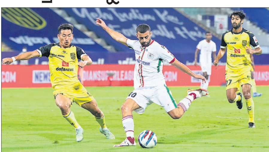
ହାଇଦ୍ରାବାଦ-ଏଟିକେ ମୋହନବାଗାନ ମ୍ୟାଚର ଏକ ସଂଘର୍ଷପୂର୍ଣ୍ଣ ସୁହାର।

ବାଲୋଲି, ୮୧୨: ଇଣ୍ଡିଆନ୍ ସୁପରଲିଗ୍ (ଆଇଏସ୍‌ଏଲ୍)ର ମଙ୍ଗଳବାର ଅନୁଷ୍ଠିତ ମ୍ୟାଚରେ ଏଟିକେ ମୋହନବାଗାନ ଟେକ୍ସାସ ଟ୍ୟୁରନ୍ସ ହାଇଦ୍ରାବାଦ୍ ଏଫସିକୁ ୨-୧ ଗୋଲରେ ପରାସ୍ତ କରିଛି। ଏଥିସହ ଏଟିକେ ପଏଣ୍ଟ ଟେକ୍ସାସ ଟ୍ୟୁରନ୍ସ ଟ୍ରଫିରେ ଫେରିଛି। ଚାମ୍ପିୟନଶିପ୍ ମ୍ୟାଚର ପ୍ରଥମାର୍ଦ୍ଧ ଖେଳାଳିମାନେ ରହିଥିଲେ। ୫୨ତମ ମିନିଟରେ ଲିଷ୍ଟନ କୋଲକୋ