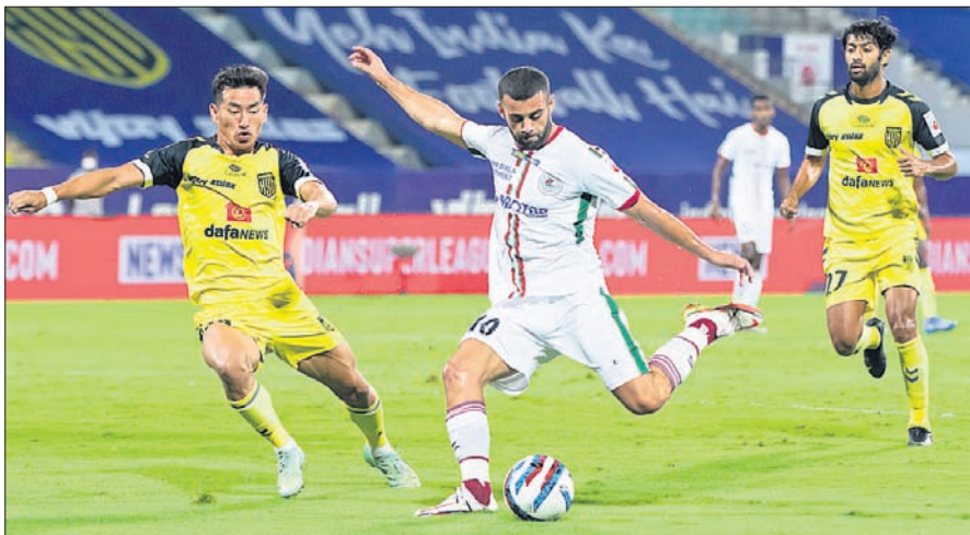
ହାଇଦ୍ରାବାଦ-ଏଟିକେ ମୋହନବାଗାନ ମ୍ୟାଚର ଏକ ସଂଗ୍ରହପୂର୍ଣ୍ଣ ସୁହର୍।

ବାଲେଶ୍ଵର, ୮୧୨: ଇତିଆନ ସୁପରଲିଗ୍ (ଆଇଏସ୍‌ଏଲ୍)ର ମଙ୍ଗଳବାର ଅନୁଷ୍ଠିତ ମ୍ୟାଚରେ ଏଟିକେ ମୋହନବାଗାନ ଟେରୁଲ ଟମ୍ପର ହାଇଦ୍ରାବାଦ୍ ସଂଘର୍ଷକୁ ୨-୧ ଗୋଲରେ ପରାସ୍ତ କରିଛି। ଏଥିସହ ଏଟିକେ ପଦ୍ମ ଟେରୁଲର ଚମ୍-୪କୁ ଫେରିଛି। ଚାନ୍ଦ୍ର ସଂଗ୍ରହପୂର୍ଣ୍ଣ ମ୍ୟାଚର ପ୍ରଥମାର୍ଦ୍ଧରେ ଲୋଲଗୁନ୍ୟ ରହିଥିଲା। ୫୬ତମ ମିନିଟରେ କୋଲକୋ