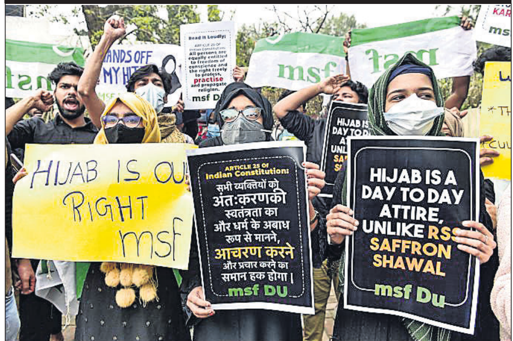
କର୍ନାଟକରେ ହିଜାବ ବିବାଦକୁ ନେଇ ବିଶୋଧ କରୁଛନ୍ତି।