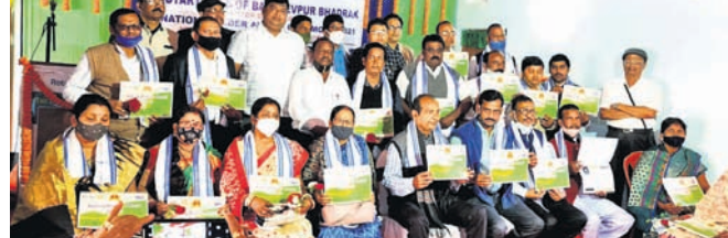
ଉତ୍ତରରେ ସମ୍ବର୍ଦ୍ଧିତ ଶିକ୍ଷକମାନେ।

ଭଦ୍ରକ ଜିଲ୍ଲା ବାସୁଦେବପୁର ରୋଡ଼ ଉପରେ ୨୦ ଶିକ୍ଷକଙ୍କୁ ସମ୍ବର୍ଦ୍ଧିତ କରିବା ପାଇଁ ଏକ ଆର୍ଡର୍ ଉତ୍ତର ଗ୍ରହଣ କରାଯାଇଛି।