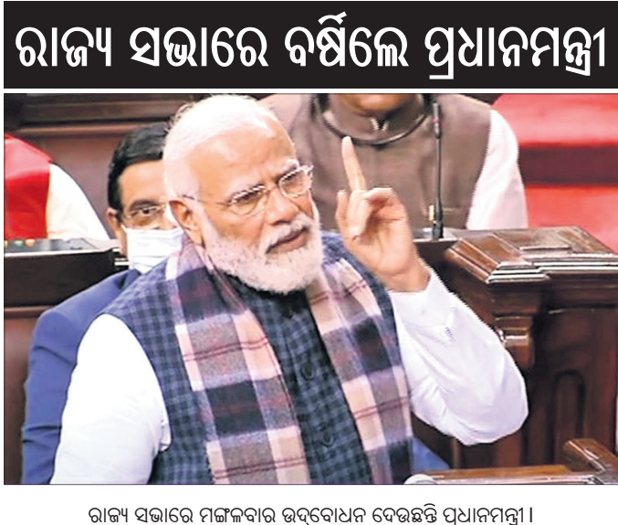
ରାଜ୍ୟ ସଭାରେ ମଙ୍ଗଳବାର ଉଦ୍ଘୋଷଣା କରିଥିବା ପ୍ରଧାନମନ୍ତ୍ରୀ ।

କଂଗ୍ରେସ ଏକ ଗଣତନ୍ତ୍ର ବିରୋଧୀ ପାର୍ଟି । ମୁଖ୍ୟ ବିରୋଧୀ ଦଳ ପାର୍ଲିାମେଣ୍ଟର ରାଜନୀତି ଉପରେ ବିଶ୍ୱାସ କରେ । କଂଗ୍ରେସ ସଂଘୀୟ ବ୍ୟବସ୍ଥାକୁ ବଳିଦେଇଛି ବୋଲି ପ୍ରଧାନମନ୍ତ୍ରୀ ନରେନ୍ଦ୍ର ମୋଦି ମଙ୍ଗଳବାର କଡ଼ା ସମାଲୋଚନା କରିଛନ୍ତି ।