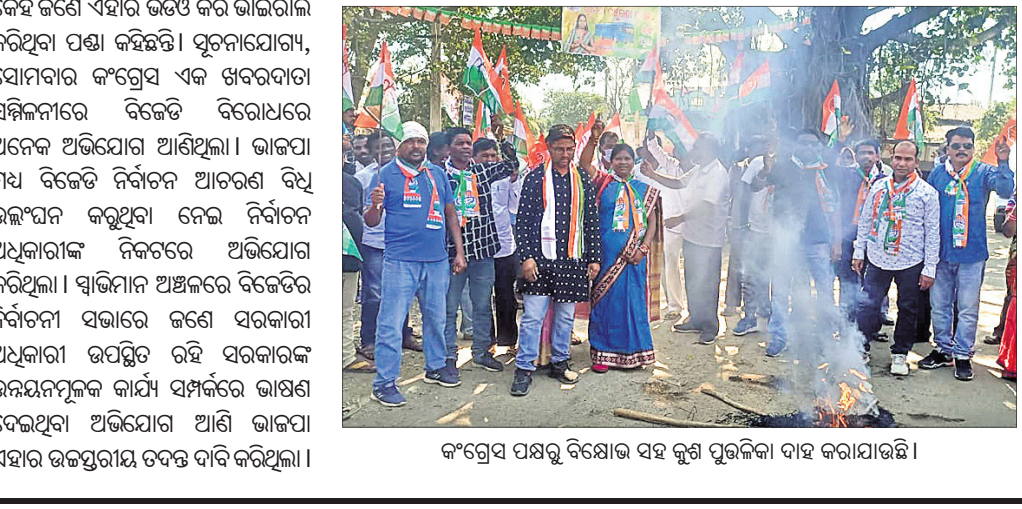
କଂଗ୍ରେସ ପକ୍ଷରୁ ବିକ୍ଷୋଭ ସହ କୁଣ୍ଡ ପୁଢ଼ଲିକା ଦାହ କରାଯାଇଛି ।