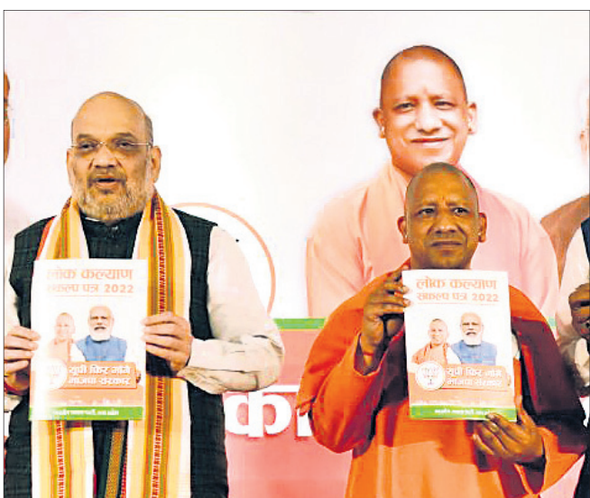
ଭାଜପା ଲୋକ କଲ୍ୟାଣ ସଂକଳ୍ପପତ୍ର ଉଦ୍ଘାଟନ କରୁଛନ୍ତି ସ୍ଵରାଷ୍ଟ୍ରମନ୍ତ୍ରୀ ଅମିତ୍ ଶାହା ଓ ମୁଖ୍ୟମନ୍ତ୍ରୀ ଯୋଗୀ ଆଦିତ୍ୟନାଥ ।

ଭାରତ ପ୍ରଦେଶ ବିଧାନସଭାର ପ୍ରଥମ ପର୍ଯ୍ୟାୟ ନିର୍ବାଚନକୁ ମାତ୍ର ୨ ଦିନ ବାକି ଥିବାବେଳେ ଶାସକ ଭାଜପା ଏବଂ ବିରୋଧୀ ସମାଜବାଦୀ ପାର୍ଟି ଭୋଟରଙ୍କୁ ଆକର୍ଷିତ କରିବା ପାଇଁ