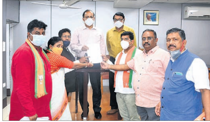
ରାଜ୍ୟ ନିର୍ବାଚନ କମିଶନଙ୍କ ଉଦ୍ଦେଶ୍ୟରେ ଦାବିପତ୍ର ପ୍ରଦାନ କରୁଛନ୍ତି ଭାଜପା ନେତୃତ୍ୱ ।

ଭାଜପା ପ୍ରତିନିଧି ଦଳ ବାଦି କରିଛି । ମଙ୍ଗଳବାର ଭାଜପା ଚରମକୁ ରାଜ୍ୟ ନିର୍ବାଚନ କମିଶନଙ୍କ ନିକଟରେ ତଥ୍ୟ ଓ ପ୍ରମାଣ ସହିତ ଅଭିଯୋଗ କରାଯିବା ସହ ଏହି ଘଟଣାର ବିହୀତ କାର୍ଯ୍ୟାନୁଷ୍ଠାନ ଲାଗି ଦାବି କରାଯାଇଛି । ଭାଜପା ଅଭିଯୋଗ କରିଛି, ମାଜକାନଗିରି ଜିଲ୍ଲା ପରିଷଦ କୋର୍ଟ୍-୩ ଗୁମୁଖୀ ପଞ୍ଚାୟତରେ ଏକ ନିର୍ବାଚନ ସଭାରେ ଶାସକ ବିଜେଡି ନେତୃତ୍ୱ ସୋଲାଇଖାଲି ଟଙ୍କା ବାଣ୍ଟି ଦଳୀୟ ପ୍ରାର୍ଥୀଙ୍କୁ ଭୋଟ ଦେବାକୁ ନିର୍ଦ୍ଦେଶ ଦେଇଛନ୍ତି । ସେହିପରି ପୁରୀ ଜିଲ୍ଲା କାକଟପୁର ନିର୍ବାଚନମଣ୍ଡଳରେ କୋର୍ଟ୍-୬ରେ ମଧ୍ୟ ବିଜେଡି କାର୍ଯ୍ୟକର୍ମୀମାନେ ଧମକତମକ ଦେଇ ଭୋଟରଙ୍କୁ ଭୟଭୀତ କରିବାର ଦୃଶ୍ୟ ଭାଇରାଲ ହୋଇଛି । ଏହି ୨ ଘଟଣାରେ ଶାସକ ଦଳ କାର୍ଯ୍ୟକର୍ମୀଙ୍କ ଆଚରଣ ବିଧି ଭଙ୍ଗିବାରୁ ଭାଇରାଲ ହେଉଛି । ତଥାପି କୌଣସି କାର୍ଯ୍ୟାନୁଷ୍ଠାନ ଗ୍ରହଣ କରାଯାଉନାହିଁ ବୋଲି ନିର୍ବାଚନ କମିଶନଙ୍କ ନିକଟରେ ଦାବି କରାଯାଇଛି ।