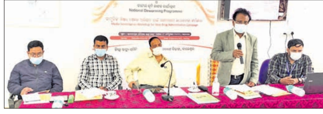
କର୍ମଶାଳାରେ ଜିଲ୍ଲା ପ୍ରଶାସନିକ ଅଞ୍ଚଳର ଅଧ୍ୟକ୍ଷ ଉପାଧ୍ୟକ୍ଷ ପଦାଧିକାରୀଙ୍କ ସହିତ କର୍ମଚାରୀଙ୍କ ସମ୍ମାନ ସମ୍ପର୍କରେ ଆଲୋଚନା ହେଉଛି।

ଉତ୍ତରପୋଖରୀ ଜିଲ୍ଲାରେ ଦୁର୍ଘଟଣାରେ ଶିଳ୍ପୀ ତମ୍ବୁଧରଙ୍କ ମୃତ୍ୟୁ ହୋଇଛି। ଚଳିତକାଳୀନ ଶିଳ୍ପୀଙ୍କୁ ସୁରକ୍ଷା ଦେବା ପାଇଁ ପଦକ୍ଷେପ ଗ୍ରହଣ କରାଯାଇଛି।