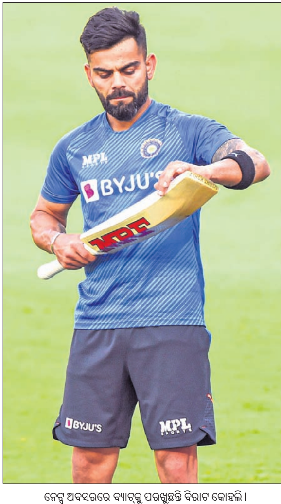
ନେଟ୍ ଅବସରରେ ବ୍ୟାଟ୍‌କୁ ପରଖୁଛନ୍ତି ବିରାଟ କୋହଲି ।

ରହିବ। ସେ କ୍ୟାମ୍ପରେ ୭୧ତମ ଶତକ ପାଇଁ ୨ ବର୍ଷରୁ ଊର୍ଦ୍ଧ୍ଵ ସମୟଧରି ଅପେକ୍ଷା କରିଛନ୍ତି। ଭାରତୀୟ ବୋଲିଂ ଲାଲ୍‌ଡ଼ିଆରେ ମଧ୍ୟ ପରିବର୍ତ୍ତନ ସମ୍ଭାବନା ସାଶା। ତେବେ ବାମହାତୀ ଶିନର କୁଲଦୀପ ଯାଦବଙ୍କୁ ଯଦି ଦଳରେ ନିଆଯାଏ ତେବେ ଚହଲ କିମ୍ପ ସୁନ୍ଦରଙ୍କ ମଧ୍ୟରୁ କେହି ବାହାରେ ରହିପାରନ୍ତି। ଅନ୍ୟପକ୍ଷରେ ଫ୍ରେସ୍‌ଇଣ୍ଡିଆ ଏହାର ବ୍ୟାଟିଂରେ ସୁଧାର ଆଣିବାକୁ ପ୍ରୟାସ କରିବ। ଗତ ୧୬ ମ୍ୟାଚ ମଧ୍ୟରୁ ଦଳ ୧୦ଟିରେ ପୁରା ୫୦ ଓଭର ବ୍ୟାଟିଂ କରି ପାରିନାହିଁ। ଜିନ