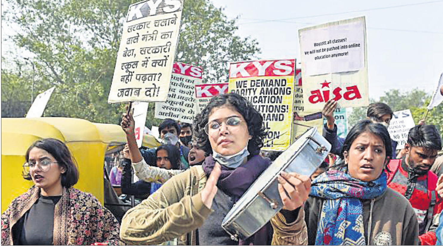
ଦିଲ୍ଲୀ ଯୁନିଭର୍ସିଟି ଖୋଲିବା ଦାବିରେ ବିଭିନ୍ନ ଛାତ୍ର ସଙ୍ଗଠନର ସଭ୍ୟମାନେ ମଙ୍ଗଳବାର ଦୁଆଦିଲ୍ଲୀରେ ବିକ୍ଷୋଭ ପ୍ରଦର୍ଶନ କରୁଛନ୍ତି।

ନୀରବରେ ବସିଯାଇଛି । ଏହି ହତ୍ୟାକାଣ୍ଡରେ ଗୃହ ରାଷ୍ଟ୍ରମନ୍ତ୍ରୀଙ୍କ ସମେତ ଶାସକ ଦଳର ବହୁ ପ୍ରଭାବଶାଳୀ ମନ୍ତ୍ରୀ ଓ ନେତାଙ୍କ ସମ୍ପୃକ୍ତି ଥିବା ଯୋଗୁଁ ତଦନ୍ତ ପ୍ରକ୍ରିୟାକୁ ବୁର୍ଲକ କରାଯାଇଛି ବୋଲି ଭାଙ୍ଗିବା ଅଭିଯୋଗ କରିଛି।