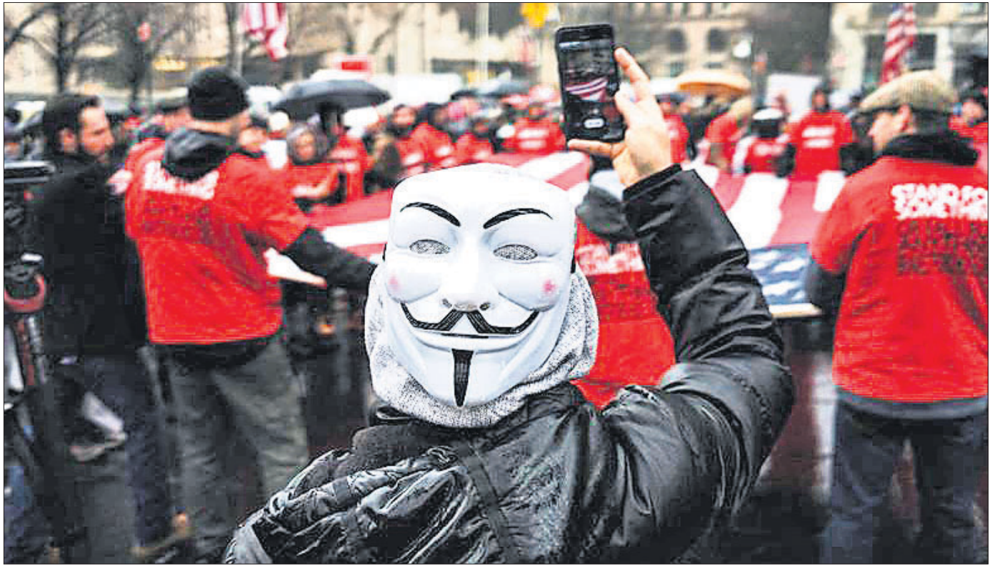
ଆମେରିକାରେ ପୁନିସିଦ୍ଧାନ୍ତ କର୍ମଚାରୀଙ୍କ ପାଇଁ ଚିକାଗୋରୁ ବାଧ୍ୟତାମୂଳକ କରାଯାଇଥିବା ଗୁମାସତ୍ ସିଟି ହଲ୍ ବାହାରେ ଭାଙ୍ଗି ବିରୋଧୀଙ୍କ ବିଶୋଧ ପ୍ରଦର୍ଶନ।

ନ୍ୟୁଆହଲୀ, ୮୨: ଭାରତର ନିରାପତ୍ତା, ସାମ୍ବିଭାବଣା ପ୍ରତି ଏବଂ ଅଣଶାନ୍ତ ପ୍ରତି ବିପଦ ସୃଷ୍ଟି କଲେ ଭଲି ଏବଂ ନିୟମ, ଶିକ୍ଷା ଓ ନୈତିକତା ବିରୋଧୀ କାର୍ଯ୍ୟ କରୁଥିବା ଖବରଦାତାମାନଙ୍କ ସମ୍ବନ୍ଧରେ ଯୁଦ୍ଧର ଛାତ୍ରମାନଙ୍କୁ ପ୍ରସ୍ତୁତ କରାଯାଇଛି।