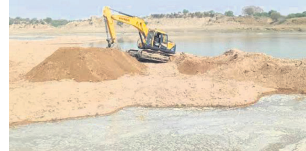
ପାଟଣା ତହସିଲ ଅଞ୍ଚଳରେ ବେଆଇନ ବାଲି ଉତ୍ତରନ ଚାଲିଛି।

ପାଟଣା ତହସିଲ ଅଞ୍ଚଳରେ ବେଆଇନ ବାଲି ଉତ୍ତରନ ଚାଲିଛି। ଏହା ପାଇଁ ପୋଲିସ ଦ୍ୱାରା କାର୍ଯ୍ୟକ୍ରମ ଆରମ୍ଭ ହୋଇଛି।