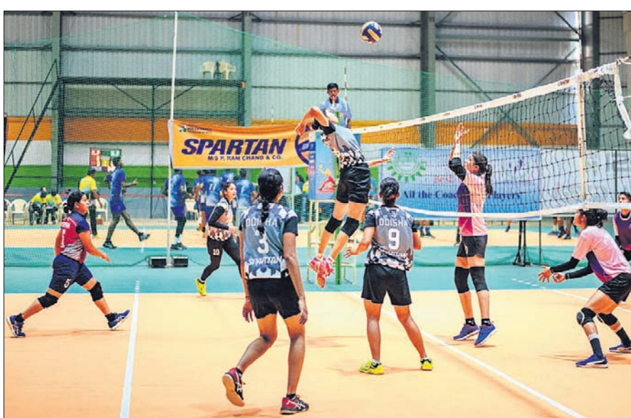
ଜାତୀୟ ସିନିୟର ଭଳିଭଳରେ ମଙ୍ଗଳବାର ଓଡ଼ିଶା ଓ ଉତ୍ତରାଖଣ୍ଡ ମଧ୍ୟରେ ଅନୁଷ୍ଠିତ ମହିଳା ବିଭାଗ ମ୍ୟାଚ ।