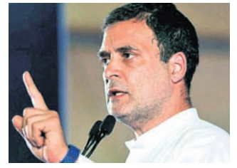
କଂଗ୍ରେସ ନେତା ରାଷ୍ଟ୍ରପତିଙ୍କୁ ଗାଣ୍ଡୀ ମତ୍ତୁରୁସୃଷ୍ଟି ପ୍ରସଙ୍ଗ ଉଲ୍ଲେଖ କରିଛନ୍ତି ।

ପ୍ରଧାନମନ୍ତ୍ରୀ ନରେନ୍ଦ୍ର ମୋଦି କଂଗ୍ରେସକୁ ଭୟ କରୁଛନ୍ତି । ସେଥିପାଇଁ ସେ ପାଲିମେଣ୍ଟରେ ନିଜ ବକ୍ତବ୍ୟରେ କେବଳ କଂଗ୍ରେସକୁ ସମାଲୋଚନା କରିଛନ୍ତି ବୋଲି ରାଷ୍ଟ୍ରପତିଙ୍କୁ ଗାଣ୍ଡୀ ମତ୍ତୁରୁସୃଷ୍ଟି ପ୍ରସଙ୍ଗ ଉଲ୍ଲେଖ କରିଛନ୍ତି । ପ୍ରଧାନମନ୍ତ୍ରୀ ମୋଦି ୨ଟି ଭାରତ ସ୍ୱୃଷ୍ଟି କରିଛନ୍ତି । ଗୋଟିଏ ଅତ୍ୟନ୍ତ ଧନୀ ଭାରତ ଓ ଅନ୍ୟତମ ଗରିବ । ସେହିପରି ମୋଦି ଦେଶର ସାମାଜିକ ସଂସ୍କାରକୁ ଧ୍ୟାନ ଦେବାକୁ କୁହୁଛନ୍ତି । ତୁଟାଘରେ ଭାରତକୁ ବିପଦ ଭିତରକୁ ଠେଲିଦେଉଛନ୍ତି । ଦେଶର ଦେବାଳିଆ ବହିଷ୍କାର ପାଇଁ ତାଙ୍କୁ ଓ ପାକିସ୍ତାନକୁ ଏକାଠି କରିଥିବା ରାଷ୍ଟ୍ରକୁ କହିଥିବାବେଳେ ପ୍ରଧାନମନ୍ତ୍ରୀ ଏହା