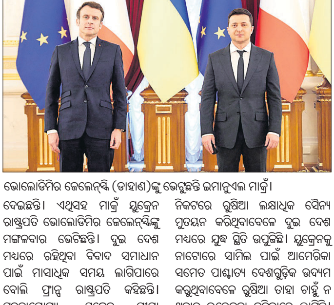
ଭୋଲୋଡିମିର ଜେଲେନ୍ସ୍କି (ବାହାରେ) ଉପସ୍ଥାପନ କରୁଥିବା ମାକ୍ଟ୍ର।