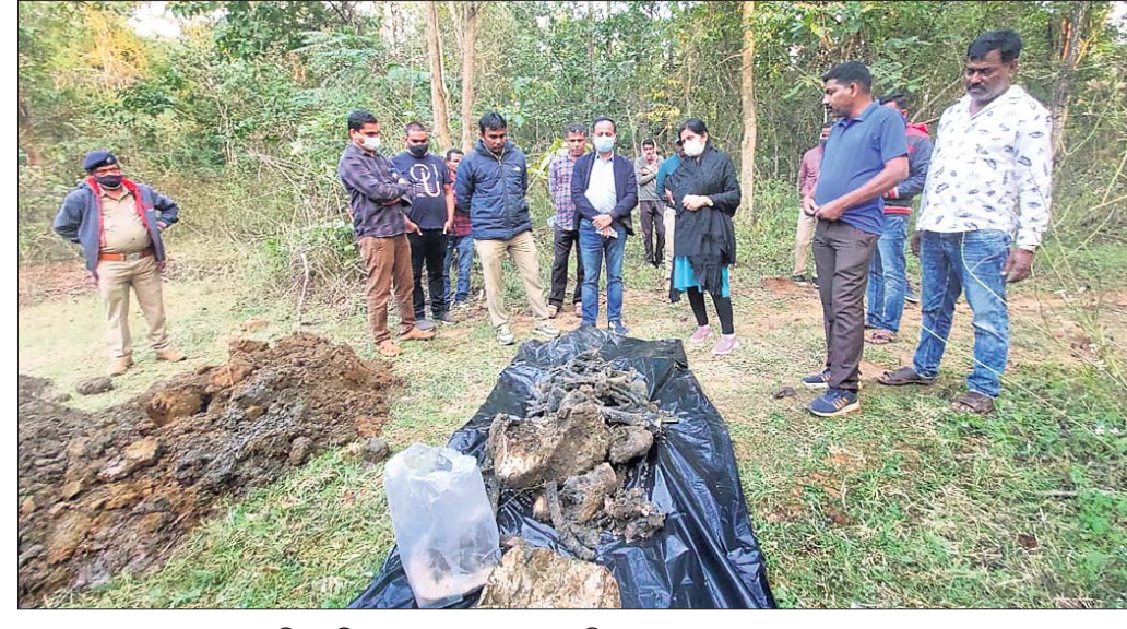
ଘଟଣାସ୍ଥଳରେ ଜାଲମୁତାସ୍ତ୍ର ଏକ୍ସପ୍ଟିଭ୍ ଟିମ୍ ନିୟମିତ ଅଧିକାରୀ ତଦନ୍ତ କରୁଛନ୍ତି।

ହାତୀ ମୃତ୍ୟୁକୁ ନେଇ ପୁଣି ଚର୍ଚ୍ଚାରେ ଆଠଗଡ଼ ବନଖଣ୍ଡ। ହାତୀ ମୃତ୍ୟୁ ପାଇଁ କର୍ତ୍ତବ୍ୟରେ ଅବହେଳା ଅଭିଯୋଗରେ ଆଠଗଡ଼ ରେଞ୍ଜ ଅଧିକାରୀ ନିଲମ୍ବିତ ହୋଇଥିବାବେଳେ ସେହି ଆଠଗଡ଼ ବନଖଣ୍ଡ ଅଧୀନ ନରସିଂହପୁର ଖେଡ଼ ରେଞ୍ଜରୁ ପୁଣି ଏକ ହାତୀ ମୃତ୍ୟୁ ଘଟଣା ସାମ୍ନାକୁ ଆସିଛି।