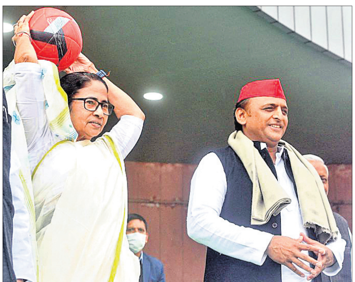
ଲକ୍ଷ୍ନୌରେ ଏକ ଭର୍ଚୁଆଲ ରାଲିବେଳେ ପଶ୍ଚିମବଙ୍ଗ ମୁଖ୍ୟମନ୍ତ୍ରୀ ମମତା ବାନାର୍ଜୀଙ୍କ ସହ ଏସ୍ପି ଅଧ୍ୟକ୍ଷ ଅଖିଳେଶ ଯାଦବ ।

ଭାରତ ପ୍ରଦେଶ ବିଧାନସଭାର ପ୍ରଥମ ପର୍ଯ୍ୟାୟ ନିର୍ବାଚନକୁ ମାତ୍ର ୨ ଦିନ ବାକି ଥିବାବେଳେ ଶାସକ ଭାଜପା ଏବଂ ବିରୋଧୀ ସମାଜବାଦୀ ପାର୍ଟି ଭୋଟରଙ୍କୁ ଆକର୍ଷିତ କରିବା ପାଇଁ