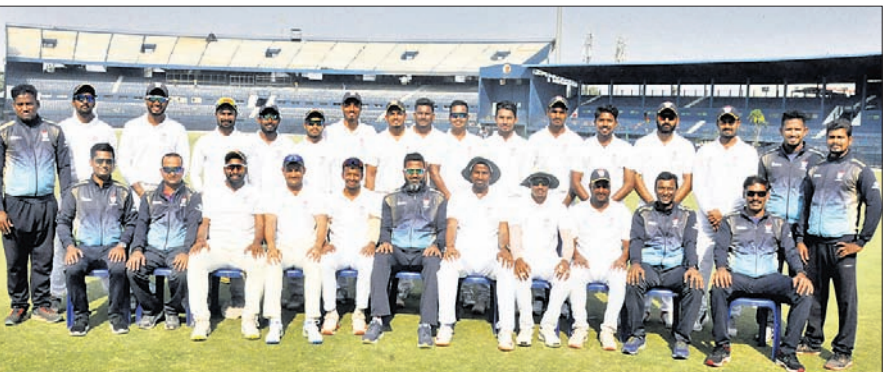
ରଣଜୀ ଟ୍ରଫି ଖେଳିବା ପାଇଁ ଗୁରୁବାର ଅହମଦାବାଦ ଯାତ୍ରା କରିଥିବା ଓଡ଼ିଶା ଦଳ ।