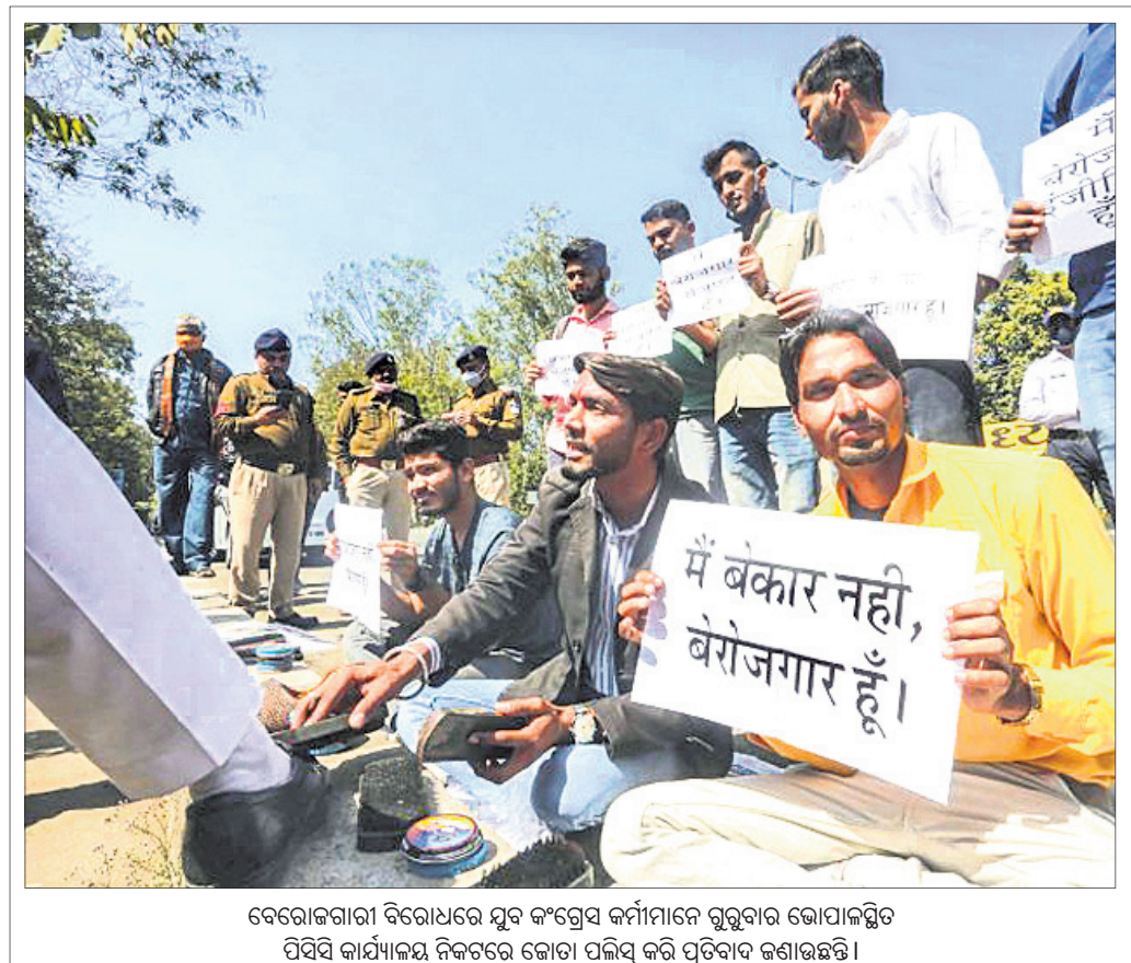
ବେରୋଜଗାରୀ ବିରୋଧରେ ଯୁବ କଂଗ୍ରେସ କର୍ମୀମାନେ ଗୁରୁବାର ଭୋପାଳସ୍ଥିତ ପିପିସି କାର୍ଯ୍ୟାଳୟ ନିକଟରେ ଭୋଟା ପଲିସ୍ କରି ପ୍ରତିବାଦ ଜଣାଇଛନ୍ତି।

ପରେ ସୁପ୍ରିମକୋର୍ଟର ଜଣେ ପୂର୍ବତନ ବିଚାରପତି, ଜଣେ ସାମାଜିକ କାର୍ଯ୍ୟକର୍ତ୍ତାଙ୍କ ସମେତ ୬ ଜଣିଆ ଚର୍ଚ୍ଚରେ ପ୍ରଶ୍ନମାନଙ୍କ ଦ୍ୱାରା ଯୌନ ନିର୍ଯାତନାର ଶିକାର ହୋଇଥିବା ନେଇ ମାତ୍ର ୭ଜଣେ ମାମଲା ସାମ୍ନାକୁ ଆସିଥିଲା।