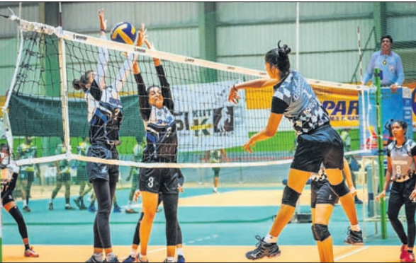
ଓଡ଼ିଶା ଓ ହରିୟାଣା ମହିଳା ଦଳ ମଧ୍ୟରେ ଅନୁଷ୍ଠିତ ମ୍ୟାଚ୍ ଆନ୍ଧ୍ର ପ୍ରଦେଶ ବିପକ୍ଷରେ ବିଜୟୀ ଓଡ଼ିଶା ପୁରୁଷ ଭଲିବଲ୍ ଦଳ କର୍ମଚାରୀଙ୍କ ଗହଣରେ।