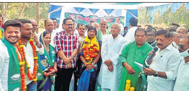
କାର୍ଯ୍ୟକ୍ରମରେ ଉପସ୍ଥିତ ବିଜେଡି ନେତା ଓ ଅନ୍ୟମାନେ ।