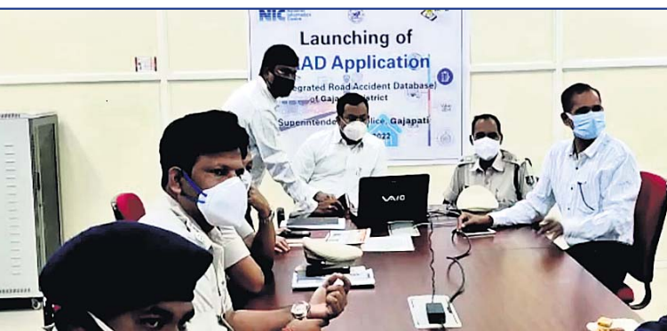
ମୋବାଇଲ ଆପର କାର୍ଯ୍ୟକାରୀତା ସମ୍ପର୍କରେ ଆଲୋଚନା କରାଯାଇଛି ।

ପାରଳାଖେମୁଣ୍ଡି, ୧୦/୨ (ଡି.ଏନ୍.ଏ.) ନିରାପରା ନିମନ୍ତେ ପଦକ୍ଷେପ ନିଆଯାଇପାରିବ । ଜାତୀୟ ସୂଚନା ଓ ପ୍ରଯୁକ୍ତି କେନ୍ଦ୍ର (ଏନଆଇସି) ଏହି ଆପ ପ୍ରସ୍ତୁତ କରିଛି । ସତରଠରୁ ଯୋଗାଣ ନିମନ୍ତେ ମୁଖ୍ୟତଃ ପୋଲିସ, ରାଜ୍ୟ ତଥା ଜାତୀୟ