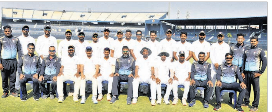
ରଣଜୀ ଟ୍ରଫି ଖେଳିବା ପାଇଁ ଗୁରୁବାର ଅହମଦାବାଦ ଯାତ୍ରା କରିଥିବା ଓଡ଼ିଶା ଦଳ।