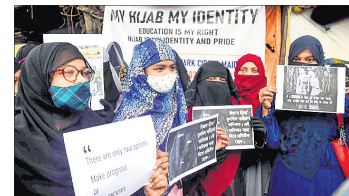
କୋଲକାତାରେ ମୁସଲମାନ ମହିଳାମାନେ ବୁର୍ଖା ଓ ହିଜାବ ପିନ୍ଧି କର୍ନାଟକର ନିକ ସମ୍ପ୍ରଦାୟର ଛାତ୍ରାଳୟ ସପକ୍ଷରେ ବିକ୍ଷୋଭ କରୁଛନ୍ତି।

ଓଡ଼ିଶାରେ ବିଧାନ ପରିଷଦ ଗଠନ ଲାଗି ୨୦୧୫ ଜାନୁୟାରୀ ୭ରେ ରାଜ୍ୟ ସରକାର ଏକ ୫ ଜଣିଆ କମିଟି ଗଠନ କରିଥିଲେ। ଉକ୍ତ କମିଟି ବିଧାନ ପରିଷଦ ଥିବା ବିଭିନ୍ନ ରାଜ୍ୟ ଗପୁକରି ରିପୋର୍ଟ ପ୍ରଦାନ ମଧ୍ୟ କରିଥିଲା। ଏହାପରେ କ୍ୟାବିନେଟ୍ ବୈଠକରେ ବିଧାନ ପରିଷଦ ଗଠନ ଲାଗି ସଂକଳ୍ପକୁ ଅନୁମୋଦନ ମିଳିଥିଲା। ୨୦୧୮ ସେପ୍ଟେମ୍ବର ୬ ତାରିଖରେ ବିଧାନସଭାରେ ଏ ସଂକଳ୍ପ ସଂକଳ୍ପ ମଧ୍ୟ ପାରିତ ହୋଇଥିଲା। ଓଡ଼ିଶା ବିଧାନସଭା ଦ୍ୱାରା ସଂକଳ୍ପ ପାରିତ ଓ ଭାରତୀୟ ସମ୍ବିଧାନର ଧାରା ୧୬୯ର ଉପଧାରା(୧) ଅନୁସାରେ ସଂସଦର ଅନୁମୋଦନ ପାଇଁ କ୍ୟାବିନେଟ୍ରେ ଉକ୍ତ ପ୍ରସ୍ତାବ ଗୃହୀତ ହୋଇଥିଲା। ଭାଜପା ଓ କଂଗ୍ରେସ ସଦସ୍ୟଙ୍କ ହତବୋଧ ସତ୍ତ୍ୱେ ବିଧାନ ପରିଷଦ ସଂକଳ୍ପ ସପକ୍ଷରେ ମୋଟ ୧୦୪ ଖଣ୍ଡ ଭୋଟ ପଡ଼ି ଏହାକୁ ପାରିତ କରାଯାଇଥିଲା। ହେଲେ ଏହି ସଂକଳ୍ପ ପାରିତ ହେବାର ସାତେ ୩ ବର୍ଷ ପରେ ମଧ୍ୟ କେଉଁ କାରଣ ପାଇଁ କେନ୍ଦ୍ର ସରକାରଙ୍କ ନିକଟକୁ ପଠାଯାଇ ନାହିଁ ତାହା ଏବେ ବଡ଼ ପ୍ରଶ୍ନବାଚୀ ସୃଷ୍ଟି କରିଛି। ଏପରି କି ଏହି ସଂକଳ୍ପ କେନ୍ଦ୍ର ନିକଟକୁ ନ ପଠାଇ ସଂସଦରେ ବିଜେତ ସଦସ୍ୟମାନେ କିପରି ଏହାକୁ ଅନୁମୋଦନ ଦେବା