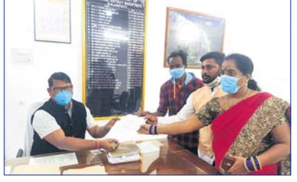
ବାବିପତ୍ର ପ୍ରଦାନ କରାଯାଇଛି ।

ପାରଳାଖେମୁଣ୍ଡି, ୧୦/୨ (ଡି.ଏନ୍.ଏ.) ଗଜପତି ଜିଲା ରାୟଗଡ଼ ବ୍ଲକ ଲାଇଲାଳ ପଞ୍ଚାୟତ ଅଧୀନ ଏଣ୍ଟ୍ରି ଗ୍ରାମବାସୀ ମୌଳିକ ସୁବିଧା ପାଇବାକୁ ବଞ୍ଚିତ ଥିବାରୁ ପ୍ରଶାସନର ଦ୍ୱାରସ୍ଥ ହୋଇଛନ୍ତି । ବଣପାହାଡ଼ ଘେରା ଏହି ଗ୍ରାମରେ ବିକାଶର କୌଣସି ଛାପ ନାହିଁ । ସମସ୍ୟାକୁ ନେଇ ବାରମ୍ବାର