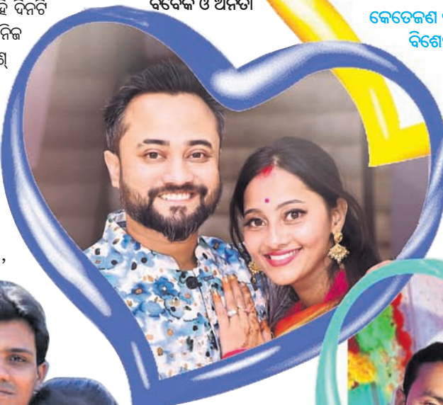
ବିବେକ ଓ ଅନିତା