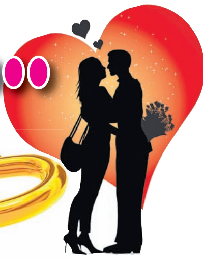
ବାପକର ଓ ଅଲିଭା