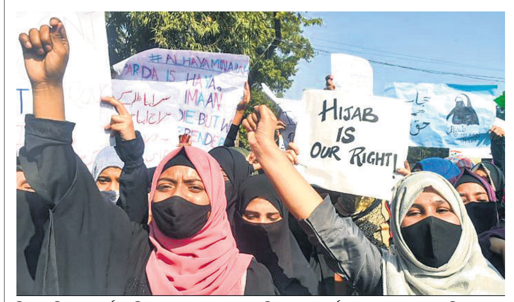
ହିଜାବ ପରିଧାନକୁ ସମର୍ଥନ କରି କୋଲକାତାରେ ପୁସ୍ତକମାନ ମହିଳାମାନେ ଘୁମାଉ ଦେଖାଇ ଦେଉଛନ୍ତି।

ନୂଆଦିଲ୍ଲୀ, ୧୨/୧: କୋଭିଡ୍ ଦୈନିକ ସଂକ୍ରମଣ କମିଥିବାରୁ ବିଧାନସଭା ନିର୍ବାଚନ ହେଉଥିବା ୫ ରାଜ୍ୟରେ ପ୍ରଚାର ନିୟମକୁ କୋହଳ କରାଯାଇଛି। ଉତ୍ତରପ୍ରଦେଶରେ ଗୋଟିଏ ପର୍ଯ୍ୟାୟ ନିର୍ବାଚନ ଶେଷ ହୋଇଥିବାବେଳେ ଅନ୍ୟ ପର୍ଯ୍ୟାୟଗୁଡ଼ିକ ପାଇଁ କୋହଳ ପ୍ରଚାର ନିୟମ ଲାଗୁ ହେବ।