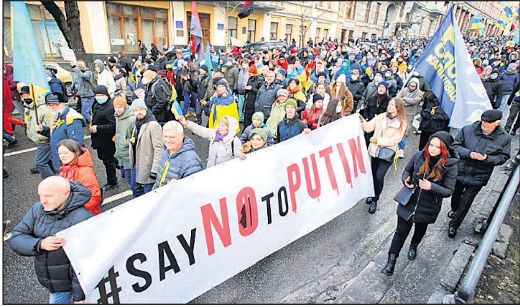
ରୁଷିଆର ସମସ୍ୟ ଆକ୍ରମଣ ବିରୋଧରେ ସୁକ୍ଷ୍ମକରାସୀ ବିରୋଧ କରୁଛନ୍ତି।

ଝଟକ୍ରମ ସାମାଜିକ ନିକଟରେ ରୁଷିଆ ସୈନ୍ୟ ୩ ପକ୍ଷ ଘେରି ରହିଛନ୍ତି। ବିନା ନେତୃତ୍ୱରେ ମସ୍କୋ ଯେ କୌଣସି ସମୟରେ ଆକ୍ରମଣ କରିପାରେ। ତେଣୁ ୪୮ ଘଣ୍ଟା ମଧ୍ୟରେ ସମସ୍ତ ଆମେରିକୀୟ ସୂକ୍ଷ୍ମକର ଛାଡ଼ି ଦେବାକୁ ନିମନ୍ତ୍ରଣ କରାଯାଇଛି।