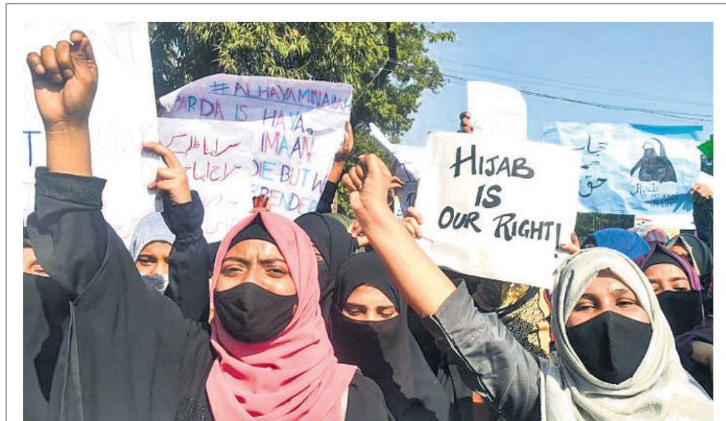
ହିଜାବ ପରିଧାନକୁ ସମର୍ଥନ କରି କୋଲକାତାରେ ପୂର୍ବଲମ୍ପାନ ମହିଳାମାନେ ପୂଜାର୍ଚ୍ଚନା ଦେଖାଇ ଦେଖାଇଛନ୍ତି।

ନୂଆଦିଲ୍ଲୀ, ୧୨.୨.୧୯: କୋଭିଡ୍ ଦୈନିକ ସଂକ୍ରମଣ କମିଥିବାକୁ ବିଧାନସଭା ନିର୍ବାଚନ ହେଉଥିବା ୫ ରାଜ୍ୟରେ ପ୍ରଚାର ନିର୍ଦ୍ଦେଶ କୋହଳ କରାଯାଇଛି।