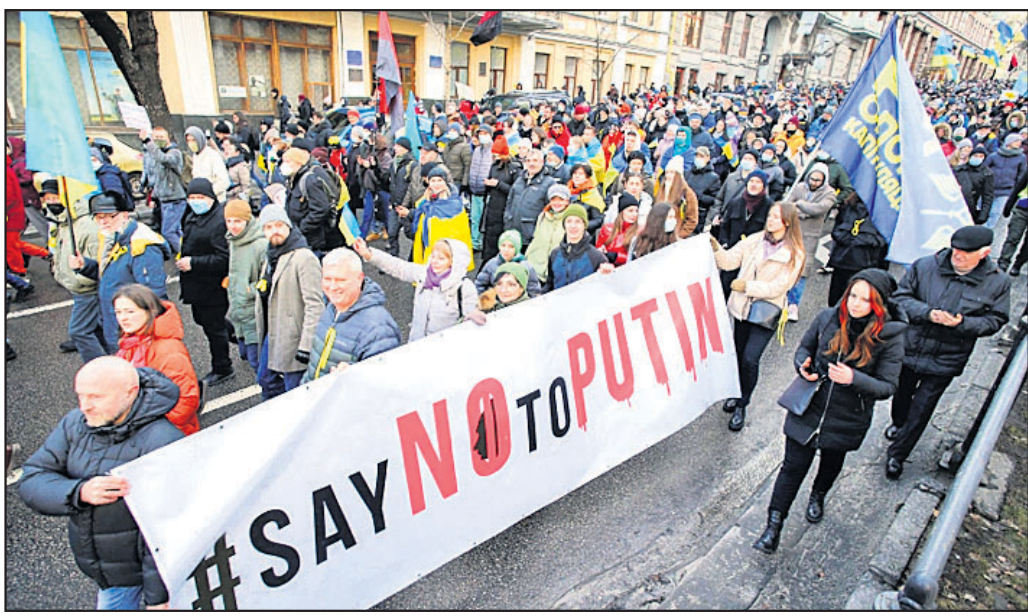
ରୁଷିଆର ସମସ୍ୟ ଆକ୍ରମଣ ବିରୋଧରେ ମୁକ୍ତଦେବାସୀ ବିକ୍ଷୋଭ କରୁଛନ୍ତି।

ନୂଆଦିଲ୍ଲୀ, ୧୨.୨.୧୯: କର୍ମଚାରୀଙ୍କ ହିଜାବ ବିବାଦକୁ ନେଇ ଅଧ୍ୟକ୍ଷଙ୍କୁ ମନ୍ତ୍ରଣ୍ୟ ଦେବାକୁ ଅନୁରୋଧ କରିବାକୁ ନିଷ୍ପତ୍ତି ହୋଇଛି। ଅଧ୍ୟକ୍ଷଙ୍କୁ ମନ୍ତ୍ରଣ୍ୟ ଦେବାକୁ ଅନୁରୋଧ କରିବାକୁ ନିଷ୍ପତ୍ତି ହୋଇଛି। ଅଧ୍ୟକ୍ଷଙ୍କୁ ମନ୍ତ୍ରଣ୍ୟ ଦେବାକୁ ଅନୁରୋଧ କରିବାକୁ ନିଷ୍ପତ୍ତି ହୋଇଛି।