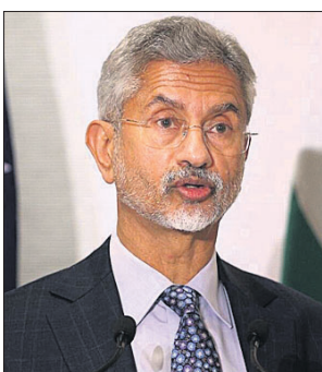
କ୍ୱାଟ ଟେଓକରେ କହିଲେ