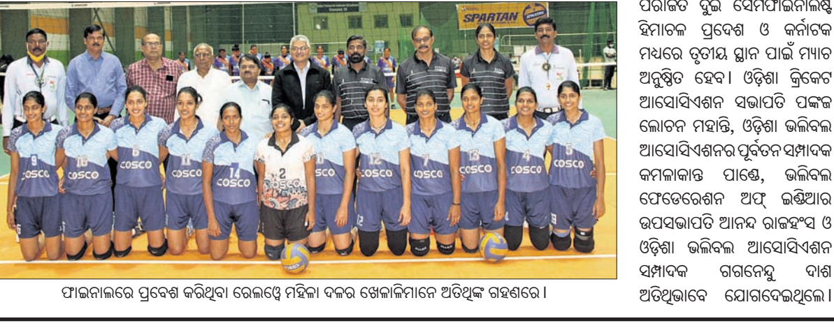
ଫାଇନାଲରେ ପ୍ରବେଶ କରିଥିବା ରେଲ୍ୱେ ମହିଳା ଦଳର ଖେଳାଳିମାନେ ଅତିଥିକ ରହିଛନ୍ତି ।

ଭକ୍ତ ମହିଳା ଓ ପୁରୁଷ ବିଭାଗ ଫାଇନାଲରେ ରେଲ୍ୱେ ଦଳ ପ୍ରବେଶ କରିଛି। ରେଲ୍ୱେ ଦଳ ପୁରୁଷ ବିଭାଗ ସେମିଫାଇନାଲରେ