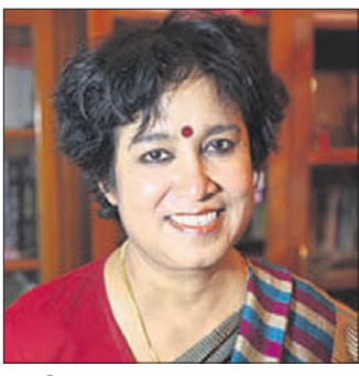
ନୂଆଦିଲ୍ଲୀ, ୧୨.୨.୧୯: ବାଲେଶ୍ୱରୀ

ନୂଆଦିଲ୍ଲୀ, ୧୨.୨.୧୯: ବାଲେଶ୍ୱରୀ ତଦ୍ୱଳିମା ନିର୍ଦ୍ଦେଶ ଦେବାକୁ ଅଧିକାରୀଙ୍କୁ ସୂଚନା ଦିଆଯାଇଛି।