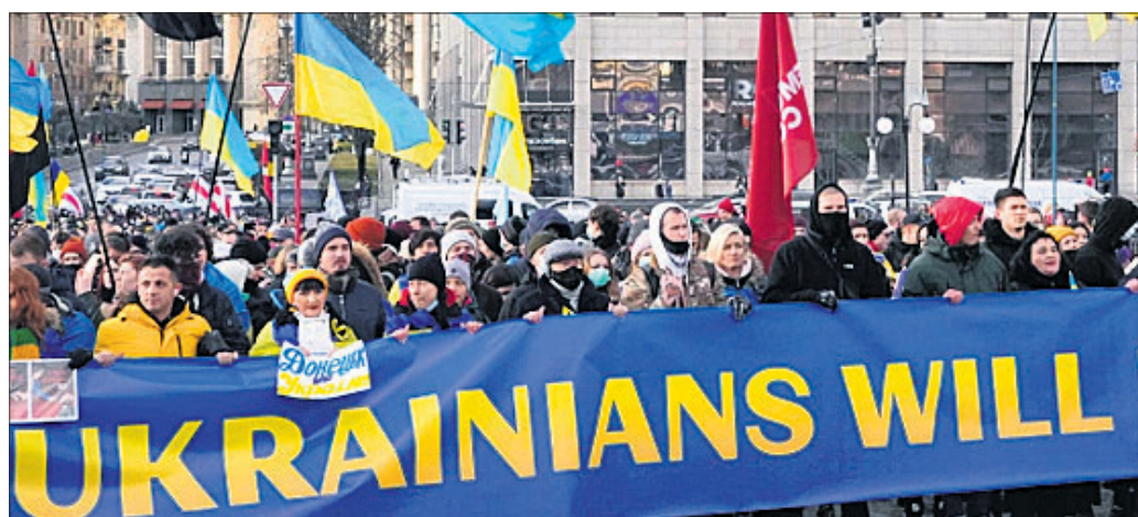
ୟୁକ୍ରେନ୍ ଆକ୍ରମଣ ଯୋଜନା ବିରୋଧରେ ୟୁକ୍ରେନ୍‌ବାସୀଙ୍କ ପ୍ରତିବାଦ ଶୋଭାଯାତ୍ରା ।

ଫାସେ, ୧୩୨ ୟୁକ୍ରେନ୍ ଓ ରୁଷିଆ ମଧ୍ୟରେ ୟୁକ୍ରେନ୍ ଗଣତନ୍ତ୍ର ଶନିବାର ଆମେରିକା ରାଷ୍ଟ୍ରପତି ଜୋ ବାଇଡେନ୍ ଏବଂ ରୁଷିଆ ପ୍ରତିପକ୍ଷ ଭୂତିମିତ ପୂର୍ବନିର୍ଦ୍ଧାରିତ ମଧ୍ୟରେ ୬୨ ମିନିଟ୍ ଧରି ହୋଇଥିବା ଆଲୋଚନା ଫଳପ୍ରସ୍ତ ହୋଇପାରିନାହିଁ।