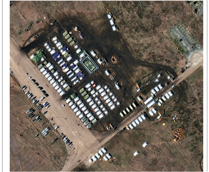
ଓକ୍‌ଟ୍ୟାବ୍ରାସ୍‌କୋୟେ ଏୟାର ଫିଲ୍ଡରେ ରୁଷିଆ ସୈନ୍ୟ ଓ ୟୁକ୍ ସରଜ୍ଞାମ।

କାର୍ଯ୍ୟକ୍ରମ ଚାଲିଥିବା ଦେଖାଯାଇଛି। କ୍ରିମିଆର ଉତ୍ତରପଶ୍ଚିମ ଉପକୂଳରେ ଥିବା ସ୍ଥାନରେ ସହର ନିକଟରେ ରୁଷିଆ ସୈନ୍ୟ ପହଞ୍ଚିଛନ୍ତି।