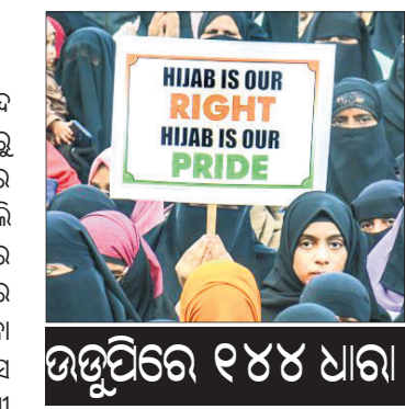
ଉତ୍ତୁପିରେ ୧୪୪ ଧାରା

ରାଓ କହିଛନ୍ତି। ସୂଚନାଯୋଗ୍ୟ, ହିଜାବ ବିବାଦ ପ୍ରଥମେ ଉତ୍ତୁପି ସହରରେ ଆରମ୍ଭ ହୋଇ କୁନ୍‌ପୁର ଓ ରାଜ୍ୟର ଅନ୍ୟ ଭାଗକୁ ବ୍ୟାପିଥିଲା।