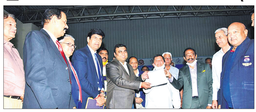
ଭିଏପିଆଇ ଓ ସୁରୋଷୋର୍ ଇଣ୍ଡିଆ ମଧ୍ୟରେ ହୋଇଥିବା ଚୁକ୍ତି ସମ୍ପର୍କରେ କର୍ମକର୍ତ୍ତା ସୂଚନା ଦେଉଛନ୍ତି।

ଭୁବନେଶ୍ୱର, ୧୪୧୮ (ବ୍ରାହ୍ମା ପ୍ରତିନିଧି): ଇଣ୍ଡିଆନ ଭଲିବଲ ଲିଗ୍ (ଆଇଭିଏଲ)ର ସର୍ବପ୍ରଥମ ସଂସ୍କରଣ ଚଳିତ ବର୍ଷ ଜୁନ-ଜୁଲାଇରେ ଆୟୋଜନ ହେବା ସମ୍ଭାବନା ରହିଛି। ଏହି ପ୍ରତିଯୋଗିତାକୁ ଆୟୋଜନ ପାଇଁ ଭଲିବଲ ଫେଡେରେଶନ୍ ଅଫ ଇଣ୍ଡିଆ (ଭିଏପିଆଇ)ର ପାର୍ଟନର ହୋଇଛି ସୁରୋଷୋର୍ ଇଣ୍ଡିଆ (ଡିଭିଏଲ) ନେତୃତ୍ୱରେ ପ୍ରମୁଖ ଶାସ୍ତ୍ରାୟତ୍ତ (ଏକ ପ୍ରମୁଖ ଭଲିବଲ ଲିଗ୍ ପାଇଁ ପ୍ରମୁଖ ପାଇବାକୁ ଯାଉଥିବା ଏହି ପ୍ରତିଯୋଗିତା ପ୍ରତି ସମର୍ଥନ ଭଲିବଲ କନଫେଡେରେଶନ୍ ଓ ଅନ୍ତର୍ଜାତୀୟ ଭଲିବଲ ଫେଡେରେଶନ୍ (ଏସପିଆଇଭି)ର ସମର୍ଥନ ରହିଛି। ଦେଶର ବିଭିନ୍ନ