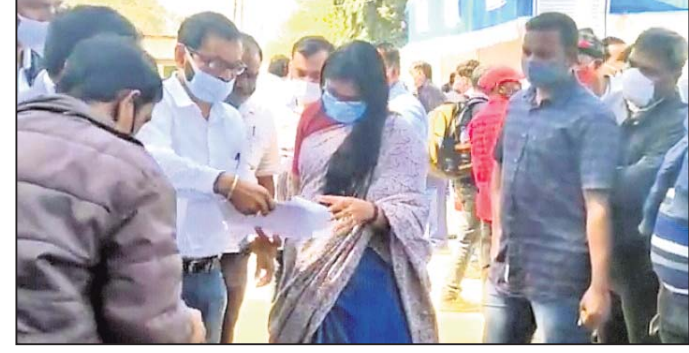
ଜିଲାପାଳ କ.ନୂଆଗାଁ ବ୍ଲକ୍ କାର୍ଯ୍ୟାଳୟରେ ତଦାରଖ କରୁଛନ୍ତି ।

କନ୍ଧମାଳ ଜିଲାରେ ପ୍ରଥମ ପର୍ଯ୍ୟାୟରେ ଆସନ୍ତା ୧୬ ତାରିଖରେ ବାଲିଗୁଡ଼ା ଏବଂ କ.ନୂଆଗାଁ ବ୍ଲକ୍ରେ ଭୋଟ ଗ୍ରହଣ କରାଯିବ । ୨ ବ୍ଲକ୍ରେ ୩୬୦ଟି ବୁଥରେ ଭୋଟର ସେବାନିକ ମତ ଦାବ୍ୟପ୍ରା କରିବେ । ସେମାନଙ୍କ ଏସବୁ ବୁଥକୁ ପୋଲିଂ ପାର୍ଟି ଯାଇଛନ୍ତି । କର୍ମଚାରୀଙ୍କ ଦାବି ଅନୁସାରେ ୨୯ଟି ପୂର୍ବରୁ ସେମାନଙ୍କୁ ଭୋଟ ଗ୍ରହଣ କେନ୍ଦ୍ର ପଠାଇ ଦିଆଯାଇଛି । ପୋଲିଂ ପାର୍ଟି ରହିବା ଲାଗି ପ୍ରଶାସନ ପକ୍ଷରୁ ସମସ୍ତ ସୁବିଧା କରାଯାଇଛି । ଯେଉଁଠି ପାଣି ନାହିଁ ସେଠାରେ ଷୋକର ଯୋଗେ ପାଣି ବ୍ୟବସ୍ଥା ହୋଇଛି । ସେହିପରି ସମ୍ବେଦନଶୀଳ ଓ ଅତି ସମ୍ବେଦନଶୀଳ ବୁଥ ଉପରେ କଡ଼ା ନଜର