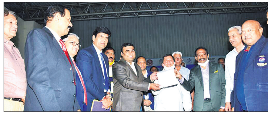
ଭିଏପିଆଇ ଓ ମୁରୋସୋର୍ ଇଣ୍ଡିଆ ମଧ୍ୟରେ ହୋଇଥିବା ଚୁକ୍ତି ସମ୍ପର୍କରେ କର୍ମକର୍ତ୍ତା ସୂଚନା ଦେଉଛନ୍ତି।

ଭୁବନେଶ୍ୱର, ୧୪୧୨ (ବ୍ରାହ୍ମା ପ୍ରତିନିଧି): ଇଣ୍ଡିଆନ ଭଲିବଲ ଲିଗ୍ (ଆଇଭିଏଲ)ର ସର୍ବପ୍ରଥମ ସଂସ୍କରଣ ଚଳିତ ବର୍ଷ ଜୁନ-ଜୁଲାଇରେ ଆୟୋଜନ ହେବା ସମ୍ଭାବନା ରହିଛି। ଏହି ପ୍ରତିଯୋଗିତାକୁ ଆୟୋଜନ ପାଇଁ ଭଲିବଲ ଫେଡେରେଶନ୍ ଅଫ ଇଣ୍ଡିଆ (ଭିଏପିଆଇ)ର ପାର୍ଟନର ହୋଇଛି ମୁରୋସୋର୍ ଇଣ୍ଡିଆ (ଡିଭିଏଲ) ନେତୃତ୍ୱରେ ପ୍ରମୁଖ ଶାସ୍ତ୍ରାଳୟ (ଦେଶରେ ଏକ ପ୍ରମୁଖ ଭଲିବଲ ଲିଗ୍ ପାଇଁ ପ୍ରମାଣ ପାଇବାକୁ ଯାଉଥିବା ଏହି ପ୍ରତିଯୋଗିତା ପ୍ରତି ଏସିଆନ ଭଲିବଲ କନଫେଡେରେଶନ ଓ ଅନ୍ତର୍ଜାତୀୟ ଭଲିବଲ ଫେଡେରେଶନ (ଏସିଆଇଭିଏଲ)ର ସମର୍ଥନ ରହିଛି। ଦେଶର ବିଭିନ୍ନ