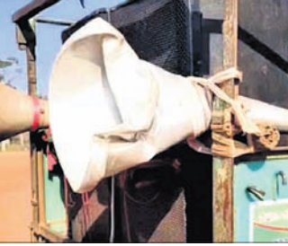
ଭଙ୍ଗାଯାଇଥିବା ପ୍ରଚାର ଗାଡ଼ି ଓ ମାଇକ୍।