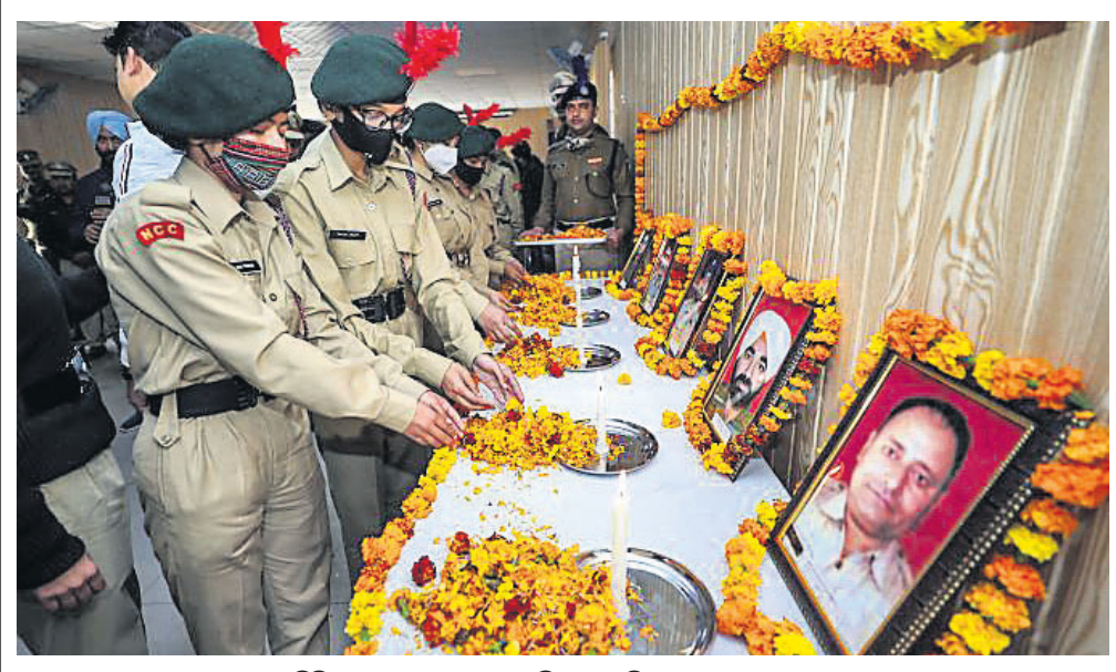
କମ୍ପୁରେ ପୂଜାପା ଶହାଦକୁ ଏନ୍ଦିସି କ୍ୟାଡେଟ୍ମାନେ ଶ୍ରଦ୍ଧାଞ୍ଜଳି ଦେଉଛନ୍ତି।

ହାଇଦ୍ରାବାଦ, ୧୪୧୨: ଅଯୋଧ୍ୟା ରାମ ଜନ୍ମଭୂମି ବିବାଦ ୨୦୧୯ ନଭେମ୍ବରରେ ସୁପ୍ରିମକୋର୍ଟଙ୍କ ଦ୍ଵାରା ସମାଧାନ ହେବା ପରେ ଏବେ ହନୁମାନ ଜନ୍ମସ୍ଥାନକୁ ନେଇ ନୂଆ ବିବାଦ ଦେଖାଦେଇଛି। ତେବେ ଏହି ବିବାଦ ଦୁଇ ଧର୍ମ ମଧ୍ୟରେ ରୁଚିତ୍ଵ, ବରଂ ଦୁଇ ହିନ୍ଦୁ ଟ୍ରଷ୍ଟ ମଧ୍ୟରେ ହୋଇଛି। ଆକ୍ରମଣକାରୀ ଓ କର୍ମାଚକର ଦୁଇଟି ହିନ୍ଦୁ ଟ୍ରଷ୍ଟ ହନୁମାନଙ୍କ ଜନ୍ମଭୂମି ଭିନ୍ନ ଭିନ୍ନ ସ୍ଥାନରେ ବୋଲି ଦାବି କରୁଛନ୍ତି। ଆକ୍ରମଣକାରୀ ଟ୍ରଷ୍ଟମାଲ୍ଲା ଚିତ୍ତୁପତି ଦେବସ୍ଥାନମ୍ (ଚିତ୍ତି) ଚିତ୍ତୁମାଲ୍ଲା ହିଲ୍ସ ଅଞ୍ଚଳରେ ଅଛି। ଚିତ୍ତୁପତି ଏକ ମନ୍ଦିର ଓ ପର୍ଯ୍ୟଟନ ସ୍ଥଳ ନିର୍ମାଣ ପାଇଁ ବ୍ୟବସାୟ ଉପରେ ଯୋଜନା କରୁଛି। ଗତବର୍ଷ ରାମନବମୀରେ ଭକ୍ତ ସ୍ଥାନକୁ ହନୁମାନଙ୍କ ଜନ୍ମସ୍ଥାନ ଭାବେ ଅଭିଷେକ କରାଯାଇଥିଲା। ତେବେ କର୍ମାଚକର ଶ୍ରୀ ହନୁମନ୍ଦ୍ ଜନ୍ମଭୂମି ଚାପିକ୍ଷେତ୍ର ଏଥିରେ ସହମତ ରୁହନ୍ତୁ। ଟ୍ରଷ୍ଟ କହିବା ଅନୁଯାୟୀ, ବାଲ୍ମୀକି ରାମାୟଣରେ ହନୁମାନ କିଷ୍କିନ୍ଧୀର ଅଞ୍ଚଳରେ ଜନ୍ମଗ୍ରହଣ କରିଥିବା ଉଲ୍ଲେଖ ରହିଛି। ଏହା ହାଣ୍ଡି ନିକଟବର୍ତ୍ତୀ ରୁକ୍ମଭଦ୍ରା ନଦୀକୂଳରେ ଅବସ୍ଥିତ। ବିବାଦର ସମାଧାନ ଲାଗି ଗତବର୍ଷ ମେ'ରେ ଆଲୋଚନା ହୋଇଥିଲେ