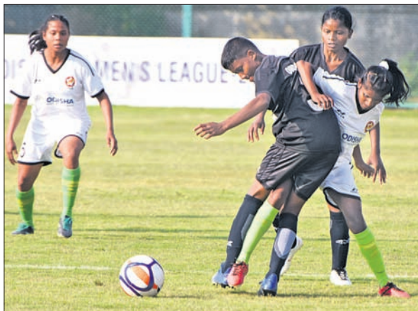
କ୍ୟାପିଟାଲ ଗ୍ରାଉଣ୍ଡରେ ଓଡ଼ିଶା ପୋଲିସ ଓ ସାଲ-ଏସ୍‌ସିଏମ୍‌ସିରେ ଅନୁଷ୍ଠିତ ମ୍ୟାଚ ।

ଭୁବନେଶ୍ୱର, ୧୪୧୨ (କ୍ରୀଡ଼ା ପ୍ରତିନିଧି) ରାଜ୍ୟ ସରକାରଙ୍କ କ୍ରୀଡ଼ା ବିଭାଗ ଓ ଫୁଟବଲ ଆସୋସିଏସନ ଅଫ ଓଡ଼ିଶା (ଫାଓ)ର ମିଳିତ ଆରମ୍ଭକାରରେ ଚାଲିଥିବା ଓଡ଼ିଶା ଓପେନ ଲିଗ୍ (ଓଡ଼ିଶା ଓପେନ)ର ୨ଟି ମ୍ୟାଚ ଯୋଗ୍ୟରେ ଅନୁଷ୍ଠିତ