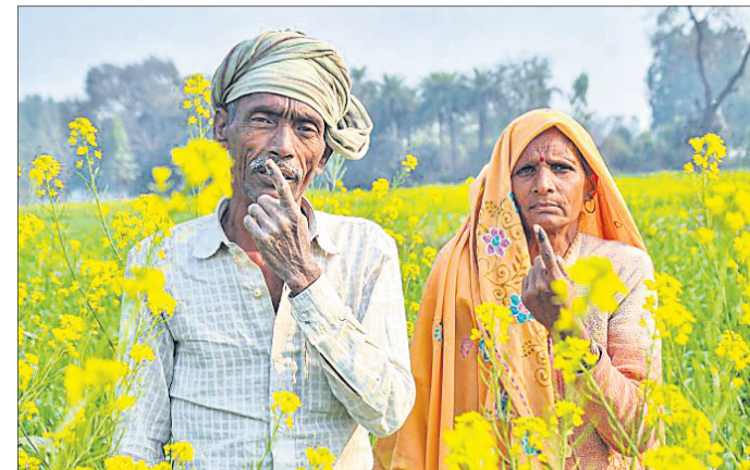
ଉତ୍ତର ପ୍ରଦେଶର ମୋରାଦାବାଦରେ ମତଦାନ ପରେ ଶୋଭିଷ୍ଟ ଖେତରେ ଛିଡ଼ାହୋଇ ଅନୁଜିତ ଅଭିଭାବନା କାଳିକିନ୍ଦ୍ର ଦେଖାଉଛନ୍ତି କୃଷକ ଦମ୍ପତି।

କୋଭିଡ଼ କଟକଣା ଓ କଡ଼ା ସୁରକ୍ଷା ବନ୍ଦୋବସ୍ତ ମଧ୍ୟରେ ସୋମବାର ଉତ୍ତରାଖଣ୍ଡ ବିଧାନସଭାର ୭୦ ଓ ଗୋଆର ୪୦ ଆସନରେ ନିର୍ବାଚନ ଶେଷ ହୋଇଛି। ଏହି ଦୁଇ ରାଜ୍ୟରେ ଯଥାକ୍ରମେ ୬୨.୫% ଓ ୬୮.୯୪% ମତଦାନ ହୋଇଛି। ସେହିପରି ଉତ୍ତର ପ୍ରଦେଶରେ ହିତାୟ ପର୍ଯ୍ୟାୟରେ ୫୫ ଆସନରେ ହୋଇଥିବା ନିର୍ବାଚନରେ ୬୦.୪୪ ପ୍ରତିଶତ ଭୋଟ ପାଇଁ କରାଯାଇଥିବା ନିର୍ବାଚନ କମିଶନଙ୍କ ସୂଚନୁ ପ୍ରକାଶ। ରାଜନୈତିକ ଦୃଷ୍ଟିରୁ ଗୁରୁତ୍ୱପୂର୍ଣ୍ଣ ଯୁପିର ସାହରନପୁର, ବିକ୍ଟୋରୀ, ମୋରାଦାବାଦ, ସମଲ, ରାମପୁର, ଆମରୋହା, ବଦାୟୁଁ ବରେଲି ଏବଂ ଶାହଜହାନପୁର ଜିଲାର ୫୫ ଆସନରେ ନିର୍ବାଚନ ହୋଇଛି। ତେବେ ମୁସଲମାନ ସଂଖ୍ୟାବହୁଳ ତଥା ଭାବେ ପରିଚିତ ବିକ୍ଟୋରୀ, ସମଲ ଓ ସାହରନପୁର ଜିଲାର ୮ ସମ୍ବନ୍ଧନଶୀଳ ନିର୍ବାଚନମଣ୍ଡଳ ଉପରେ ସମଗ୍ର ନଜର ରହିଥିଲା। ୨୦୧୭ ନିର୍ବାଚନରେ ଏହି ୫୫ ଆସନକୁ ଭାଜପାକୁ ୩୮, ଏସପି ୧୫ ଏବଂ କଂଗ୍ରେସକୁ ୨ ଆସନରେ ସଫଳତା ମିଳିଥିଲା। ଏସପି ଚିକେଟନର ବିଜୟ ହୋଇଥିବା ୧୦ ପ୍ରାର୍ଥୀ ମୁସଲମାନ ହୋଇଥିବାରୁ ଏଥର ପୁଞ୍ଜାମନ୍ତ୍ରୀ ଯୋଗା ଆଦିତ୍ୟନାଥ ଓ ସ୍ୱରାଜ୍ୟମୁଖୀ ଅମିତ୍ ଶାହା ଅଧ୍ୟକ୍ଷ ଅଣ୍ଟାକେଶ ଯାଦବଙ୍କ ଦୁର୍ଗ ଭେଦ କରିବାକୁ ଯଥାସମ୍ଭବ ଉଦ୍ୟମ