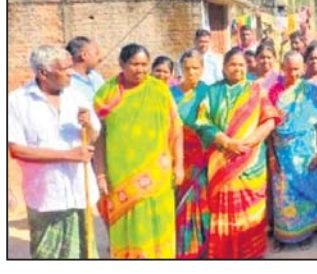
ଭୋଟ ବର୍ଜନ ଚେତାବନୀ ଦେଇଥିବା ପରିବାର ।

ପାରଳାଖେମୁଣ୍ଡି, ୧୫୧୨ (ଡି.ଏନ.ଏ.) ଗଜପତି ଜିଲା ରୁମ୍ମା ବ୍ଲକ୍ ଅନ୍ତର୍ଗତ ଭାଦ୍ରା ଗ୍ରାମ ପଞ୍ଚାୟତର ଖାଡ଼ି ନଂ ୯ର ୪୧ ପରିବାରର ଜମି ପତ୍ତା ନ ଥିବା ଅଭିଯୋଗ କରିଛନ୍ତି । ୧୯୬୦ରୁ ଏପର୍ଯ୍ୟନ୍ତ ୯୯ ଖାଡ଼ିର ୪୧ ପରିବାର ଏହି ସ୍ଥାନରେ ରହୁଛନ୍ତି । ହେଲେ ଏମାନଙ୍କ କୌଣସି