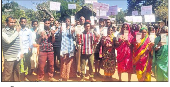
ଏକାଠି ହୋଇଥିବା ଗ୍ରାମବାସୀ ।

ବାଲିଗୁଡ଼ା ଉପଖଣ୍ଡ ଅନ୍ତର୍ଗତ କ.ନୂଆଗାଁ ବ୍ଲକ୍ରେ ସାଧନପତା ଗ୍ରାମପଞ୍ଚାୟତର ୬ ଖାଡ଼ିବାସୀ ତଥା ବିଧାୟକଙ୍କ ଗାଁରେ ଭୋଟ ବର୍ଜନ ପାଇଁ ଚେତାବନୀ ଦେଇଛନ୍ତି । ନୂତନ ପଞ୍ଚାୟତ ଗଠନ ଓ ମୌଳିକ ସମସ୍ୟାର ସମାଧାନ ପାଇଁ ଆଗାମୀ ତ୍ରିପୁରାୟ ନିର୍ବାଚନ ବର୍ଜନ କରିବେ । ନନ୍ଦାହା ସମେତ ୬ ଖାଡ଼ିବାସୀଙ୍କ କହିବାନୁସାରେ, ପୂର୍ବରୁ ପଞ୍ଚାୟତ ସମୟରେ କୁହୁଡ଼ୁଲା ଗ୍ରାମପଞ୍ଚାୟତରେ ଥିଲେ । ସାଧନପତା ପଞ୍ଚାୟତ ଗଠନ ବେଳେ ଗ୍ରାମବାସୀଙ୍କୁ ନ ଜଣାଇ ସାଧନପତା ଗ୍ରାମପଞ୍ଚାୟତରେ ମିଶାଇ ଦିଆଗଲା । ଏ ନେଇ ଗ୍ରାମବାସୀ କ.ନୂଆଗାଁ ବିଡିଓ, ବାଲିଗୁଡ଼ା ଉପଜିଲାପାଳ, ପୁଣ୍ୟ ଶାସନ