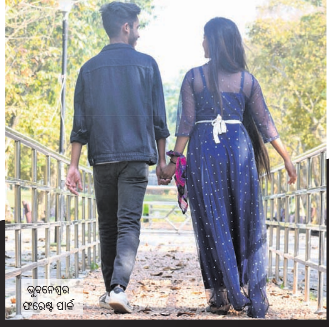
ଭୁବନେଶ୍ୱର ଫରେଷ୍ଟ ପାର୍କ

ଭୁବନେଶ୍ୱର, ୧୪୧୨ (ବୁଧବାର) - ଭାଲେଣ୍ଟାଇନ୍ ଡେ' ପାଇଁ ସୋମବାର ରାଜଧାନୀ ସମେତ ସାରା ରାଜ୍ୟରେ ପ୍ରେମର ପରିବେଶ ବାରି ହୋଇ ପଡିଥିଲା। ପାର୍କଠାରୁ ଆରମ୍ଭ କରି ମନ୍ଦିର, ଶବ୍ଦିଂ ମଲ୍, ପର୍ଯ୍ୟଟନସ୍ଥଳୀ, ସମୁଦ୍ରକୂଳ ସବୁଆଡ଼େ ପ୍ରେମ ପକ୍ଷୀଙ୍କୁ ଦେଖିବାକୁ ମିଳିଥିଲା। ସାଙ୍ଗହୋଇ ବୁଲୁଥିବା ଯୁବାପିତା ସହ ସମୟ ବିତାଇବା ପ୍ରୟୋଗକୁ ହାତଛଡ଼ା କରି ନ ଥିଲେ। ଯା'ରି ଭିତରେ 'ବି ମାର୍କ ଭାଲେଣ୍ଟାଇନ୍' କହି ପରସ୍ପରକୁ ପ୍ରପୋଜ୍ ମଧ୍ୟ କରିଥିଲେ। ପ୍ରେମକୁ ପାଥେୟ କରି ସାରା ଜୀବନ କାଟିବା ସହ ଭବିଷ୍ୟତ ପାଇଁ ସୁନେଲି ସ୍ୱପ୍ନ ଦେଖୁଥିଲେ ପ୍ରେମୀଯୁଗ୍ମକ।