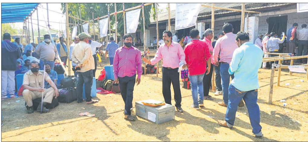
ମତଦାନ କେନ୍ଦ୍ରକୁ ଯିବା ପାଇଁ ପୋଲିଂ ପାର୍ଟି ପ୍ରସ୍ତୁତ ହେଉଛନ୍ତି।

ତ୍ରିପୁରାୟ ପଞ୍ଚାୟତ ନିର୍ବାଚନ ପାଇଁ ପ୍ରଥମ ପର୍ଯ୍ୟାୟ ପ୍ରଚାର ସୋମବାର ଶେଷ ହୋଇଛି। ପ୍ରଥମ ପର୍ଯ୍ୟାୟରେ ଖୋର୍ଦ୍ଧା ଜିଲାର ଗାଙ୍ଗା ଓ ବୋଲଗଡ଼ ବ୍ଲକରେ ଭୋଟ ଗ୍ରହଣ କରାଯିବ।