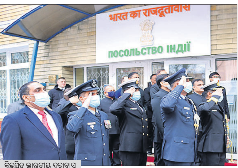
କିଭସ୍ଥିତ ଭାରତୀୟ ଦୂତାବାସ

ୟୁକ୍ରେନ୍ ପ୍ରସଙ୍ଗରେ ରୁଷିଆକୁ ଘେରିବାକୁ ଉଦ୍ୟମ କରୁଛନ୍ତି ନାଗୋ ଦେଶ। ଆମେରିକା ଓ ପାଶ୍ଚାତ୍ୟ ଦେଶ ମସ୍କୋ ଉପରେ ଗାପ ପକାଉଥିବାବେଳେ ରୁଷିଆ କିଭ ଛାଡ଼ିବାକୁ ନାରାଜ। ବାରମ୍ବାର ଶାନ୍ତି ଉଦ୍ୟମ ବିଫଳ ହେଉଥିବାକୁ ଯୁଦ୍ଧ ଆଶଙ୍କା ଘନେଇଛି। ଏହି ପ୍ରସଙ୍ଗରେ ଭାରତ କାହାକୁ ସମର୍ଥନ କରିବ ଏବଂ କାହା ବିରୋଧରେ ବାହାରିବ ସେ ନେଇ ବହୁ ଉପଲବ୍ଧି। ରୁଷିଆ ଭାରତର ଏକ ବହୁ ରାଷ୍ଟ୍ର। ଭାରତକୁ ୫୦%ରୁ ଅଧିକ ପ୍ରତିରକ୍ଷା ସାମଗ୍ରୀ ରୁଷିଆ ଯୋଗାଇଛି। ସେପଟେ ବିବାଦରେ ରୁଷିଆକୁ ସମର୍ଥନ କରି ଆମେରିକା କିମ୍ବା ପାଶ୍ଚାତ୍ୟ ଦେଶ ସହ ସମ୍ପର୍କ ଖରାପ କରିବାକୁ ଚାହଁବ ନାହିଁ ଭାରତ। ଜାନୁୟାରୀ ୩୧ରେ ଜାତିସଂଘ ସୁରକ୍ଷା ପରିଷଦରେ ଯୁକ୍ରେନ୍ ପ୍ରସଙ୍ଗରେ ଭାରତ ଭୋଟ ଦେବାକୁ ବିରତ ରହିଥିଲେ ହେଁ ନାରବତା ମଧ୍ୟ ସମାଧାନ ନୁହେଁ। ତେଣୁ ଯୁଦ୍ଧ ସ୍ଥିତି ସଂଶୋଧନକୁ ପ୍ରଧାନମନ୍ତ୍ରୀ ନରେନ୍ଦ୍ର ମୋଦିଙ୍କୁ ସଚେତାର