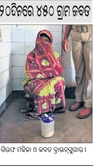
ଗିରଫ ମହିଳା ଓ ଜରତ ବ୍ରାଉନସୁଗାର।