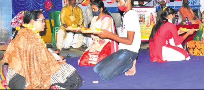
ଯୋଗ ଦେବାଦ୍ର ସେବା ସମିତିର ପୁରୀ ଶାଖା ପକ୍ଷରୁ ଯୋଗଦାନ ପ୍ରକାଶିତ ରଜମାଧର ମାତୃପିତୃ ପୂଜନ ଦିବସ ପାଳନ କରାଯାଇଛି।

ଅନ୍ୟପକ୍ଷେ ନିର୍ବାଚନ ସମୟରେ କୌଣସି ଦଳକୁ ନିର୍ବାଚନ ପାଇଁ ପ୍ରସ୍ତୁତ ହେବାକୁ ଦିଲ୍ଲୀପ କୁମାର ସାହି କହିଛନ୍ତି।