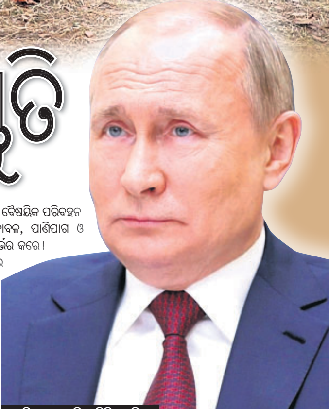
ୟୁକ୍ରେନ୍ ରାଷ୍ଟ୍ରପତି ଭ୍ଲାଡ଼ିମିର୍ ପୁଟିନ୍