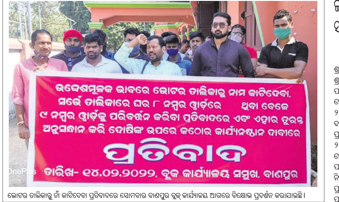
ଭୋଟର ତାଲିକାରୁ ନାଁ କାଟିଦେବା ପ୍ରତିବାଦରେ ସୋମବାର ବାଣପୁର ବ୍ଲକ କାର୍ଯ୍ୟାଳୟ ଆଗରେ ଦିକ୍ଷୋଳ ପ୍ରଦର୍ଶନ କରାଯାଇଛି।

ନିରୀକାରପୁର, ୧୫୧୨ (ଡି.ଏନ୍.ଏ.): ତ୍ରିପୁରାୟ ପଞ୍ଚାୟତ ନିର୍ବାଚନ ପରିପ୍ରେକ୍ଷାରେ ଖୋର୍ଦ୍ଧା ପୋଲିସ ପକ୍ଷରୁ ବ୍ୟାପକ ବ୍ୟବସ୍ଥା କରାଯାଇଛି।