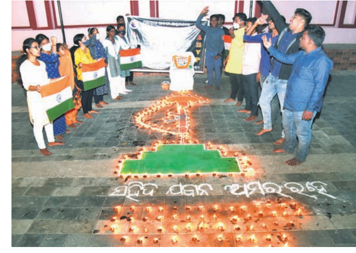
୨୦୧୯ ପୁଲ୍ଡ଼ାମା ଆତଙ୍କବାଦୀ ଆକ୍ରମଣରେ ଶହୀଦ ଯବାନଙ୍କ ସ୍ମୃତି ଭବେଶ୍ୟରେ ଏଭିଭିପି ଓ ଭୁବନେଶ୍ୱର ଜିଲା ଭାଜପା ଯୁବମୋର୍ଚ୍ଚା ପକ୍ଷରୁ ରାମ ମନ୍ଦିର ସମ୍ମୁଖରେ ଦୀପା ଜାଳି ଶ୍ରଦ୍ଧାଞ୍ଜଳି ଅର୍ପଣ କରାଯାଇଛି।