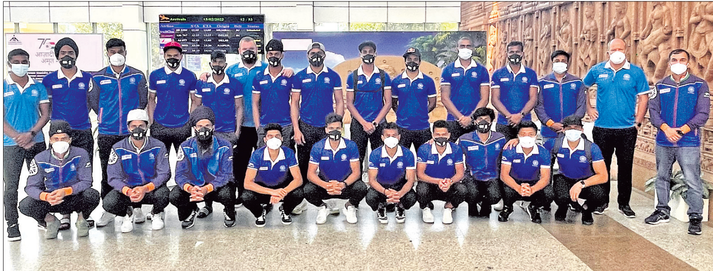
ଏମ୍ପାଇଭର୍ ପ୍ରୋ ଲିଗ୍ ଖେଳିବା ପାଇଁ ମଙ୍ଗଳବାର ଭୁବନେଶ୍ୱରରେ ପହଞ୍ଚିଥିବା ଭାରତୀୟ ପୁରୁଷ ହକି ଦଳ ।