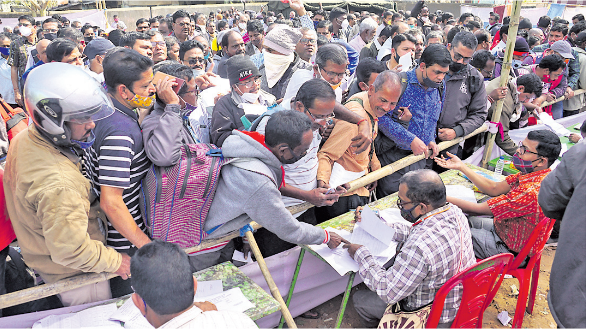
ପଞ୍ଚାୟତ ଭୋଟ ପାଇଁ ରୁପସ୍ତୁତିକୁ ଯିବା ପୂର୍ବରୁ କଟକ ସଦର ବ୍ଲକ୍ ଅଧିକାରୀଙ୍କୁ ମଙ୍ଗଳା ପୋଲି' କର୍ମଚାରୀଙ୍କ ଭିଡ଼।