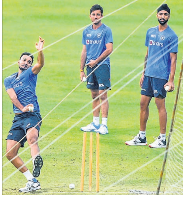
ନେଟ୍‌ରେ ବୋଲିଂ କରୁଛନ୍ତି ଭାରତୀୟ ଦ୍ରୁତ ବୋଲର ହର୍ଷଲ ପଟେଲ ।

କୋଲକାତା, ୧୫୧୨ (ପି.ଟି.) ରୋହିତ ଶର୍ମାଙ୍କ ନେତୃତ୍ୱାଧୀନ ଭାରତ ଓ ଭ୍ରମଣକାରୀ ଫ୍ରେଣ୍ଡ୍‌ସ୍ ଟି-୨୦ ସିରିଜ୍ ଏଠାରେ ବୁଧବାରଠାରୁ ଆରମ୍ଭ ହେବ । ଟି-୨୦ ବିଶ୍ୱକପ୍ ଆଉ ୮ମାସ ସମୟ ରହିଛି । ଏଥିପାଇଁ ଦଳର କମିନେଶନ ଟିଆରି କରିବାକୁ ପଡ଼ିବ । ସେ ଦୃଷ୍ଟିରୁ ଏହି ସିରିଜ୍ ଘରୋଇ ଦଳ ପାଇଁ ଗୁରୁତ୍ୱପୂର୍ଣ୍ଣ । ଗତ ଟି-୨୦ ବିଶ୍ୱକପ୍ ଅଣ୍ଟୋବେର-ନଭେମ୍ବରରେ ସଂଯୁକ୍ତ ଆରବ ଏମିରେଟ୍ସ (ୟୁଏଇ)ରେ ହୋଇଥିଲା । ଭାରତକୁ ଫେଭରାଇଟ୍ ବିବେଚନା କରାଯାଉଥିଲେ ମଧ୍ୟ ଗ୍ରୁପ୍ ପର୍ଯ୍ୟାୟରୁ ବିବାଦ ନେଇଥିଲା । ଦଳର ଖେଳାଳି କମିନେଶନ ଠିକ୍ ନ ଥିବାରୁ ଏହି ଦଶା ଭୋଗିବାକୁ ପଡ଼ିଥିଲା ବୋଲି କୁହାଯାଉଛି ।