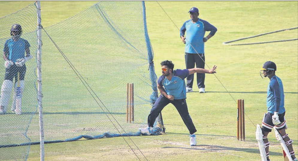
କଟକର ବାରବାଟୀ ଷ୍ଟାଡ଼ିୟମରେ ମଙ୍ଗଳବାର ବେଙ୍ଗାଲ ରଣଜୀ ଟ୍ରଫି ଦଳର ଅଭିଯାପ ।