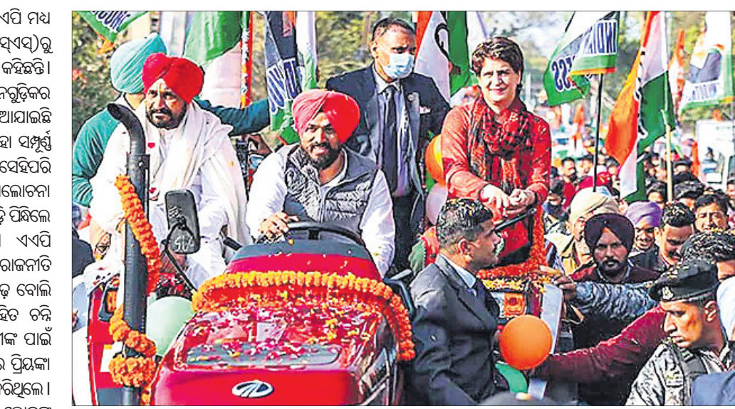
କଂଗ୍ରେସ ନେତ୍ରୀ ପ୍ରିୟଙ୍କା ଗାନ୍ଧୀ ଭଦ୍ରା ଓ ପଞ୍ଜାବ ମୁଖ୍ୟମନ୍ତ୍ରୀ ଗ୍ରାହକରେ ବସି ରୁପନଗର ଜିଲ୍ଲାର ରାଜି କରୁଛନ୍ତି।

ପଞ୍ଜାବ ବିଧାନସଭା ନିର୍ବାଚନକୁ ଆଉ ୪ ଦିନ ବାକି ଥିବାବେଳେ ସେଠାରେ ପ୍ରଚାର କୋର୍ସ୍‌ରେ ହୋଇଛି। କଂଗ୍ରେସ ସାଧାରଣ ସମ୍ପାଦକ ପ୍ରିୟଙ୍କା ଗାନ୍ଧୀ ଭଦ୍ରା ମଙ୍ଗଳବାର ଦଳୀୟ ପ୍ରାର୍ଥୀଙ୍କ ପାଇଁ ପ୍ରଚାରରେ ସାମିଲ ହେବା ସହ ଭାଜପା ଏବଂ ଆମ୍ ଆମ୍ ଆମ୍ ଆମ୍ ଆମ୍ (ଏଏପି)କୁ କଡ଼ା ସମାଲୋଚନା କରିଛନ୍ତି। ଏମାନେ ଗୋଟିଏ ମୁଦ୍ରାର ଦୁଇଟି ପାର୍ଶ୍ୱ ଭଳି। ଭାଜପା ପୂର୍ବରୁ ଗୁଜରାଟ ମତେଲର ପ୍ରଚାର କରୁଥିଲା। ଏବେ ଏଏପି ଆବାହକ ଅରବିନ୍ଦ କେକ୍‌ରୈଞ୍ଜଲ ଦିଲ୍ଲୀ ମତେଲ ଉପରେ ପ୍ରଚାର ଚଳାଇଛନ୍ତି। ତେବେ ଏହି ମତେଲ ସମ୍ପର୍କ ବିଫଳ ବୋଲି ପ୍ରିୟଙ୍କା କହିଛନ୍ତି। ମୁଖ୍ୟମନ୍ତ୍ରୀ ଚରଣଜିତ୍ ସିଂଙ୍କ ସହ ଗ୍ରାହକରେ ଯାଇ ପ୍ରିୟଙ୍କା ରୁପନଗର ଜିଲ୍ଲାର ଜନସମ୍ପର୍କ ଅଭିଯାନରେ ସାମିଲ ହୋଇଥିଲେ। ଭାଜପା ଏବଂ ଏଏପି ଲୋକଙ୍କୁ ନୂଆ ବ୍ରାଣ୍ଡର ରାଜନୀତି ପ୍ରତିଶ୍ରୁତି ଦେଇ