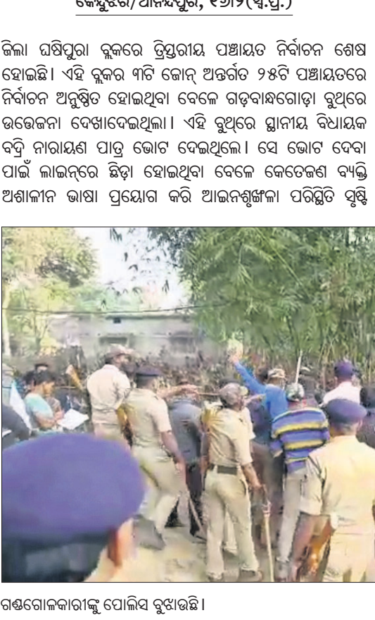
ଗଞ୍ଜଗୋଳକାରୀଙ୍କୁ ପୋଲିସ୍ ବୁଝାଇଛି।

ବିଧାୟକ ବନ୍ଦି ନାରାୟଣ ପ୍ରାଣୀଙ୍କୁ ଆକ୍ଷେପରୁ ୨ ଗୋଷ୍ଠୀ ମୁହାଁମୁହିଁ ବେଲସୁନ୍ଦରୀରେ ବୁଧ ରିଟିଂ ଅଭିଯୋଗ