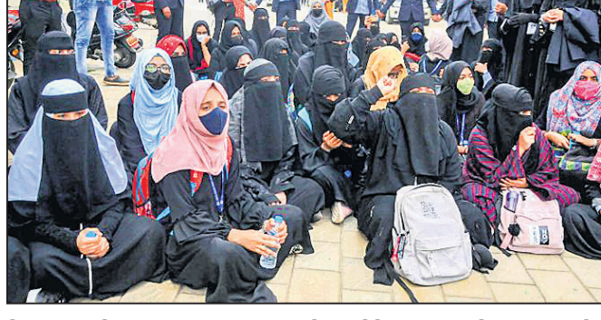
ବିକ୍ରମଗାଲୁରୁରୁ ଏକ କଲେଜ କ୍ୟାମ୍ପସରେ ହିଜାବ ପିନ୍ଧିବାକୁ ନିଷିଦ୍ଧ କରାଯାଇଛି। ତଥା ମହିଳାମାନେ ପିନ୍ଧୁଥିବା ଚୁଡ଼ି ଉପରେ ରୋକ ଲାଗାଇବାପରିବା କି? ଯଦି ତାହା ହୋଇପାରିବନି ତେବେ...

ସେ ଅଦାଲତରେ କହିଛନ୍ତି। ଗୁରୁବାର ପୁଣି ଏହି ପ୍ରସଙ୍ଗରେ କୋର୍ଟରେ ଶୁଣାଣି ହେବ। ଅନ୍ୟପକ୍ଷରେ ହିଜାବ ପ୍ରସଙ୍ଗରେ ଆଧିକାରକାରୀଙ୍କ ଉପରେ କୋହଳ ନୀତି ଆମେରିକା ନାହିଁ ବୋଲି କର୍ମଚକ ଗୃହ ମନ୍ତ୍ରୀ ଆରଗା ଜ୍ଞାନେନ୍ଦ୍ର କହିଛନ୍ତି।