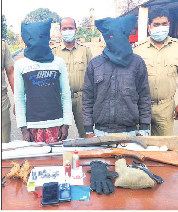
ଗିରଫ ୨ ଅଭିଯୁକ୍ତ, ଜବତ ବସ୍ତୁ ଓ ଅନ୍ୟ ସାମଗ୍ରୀ।