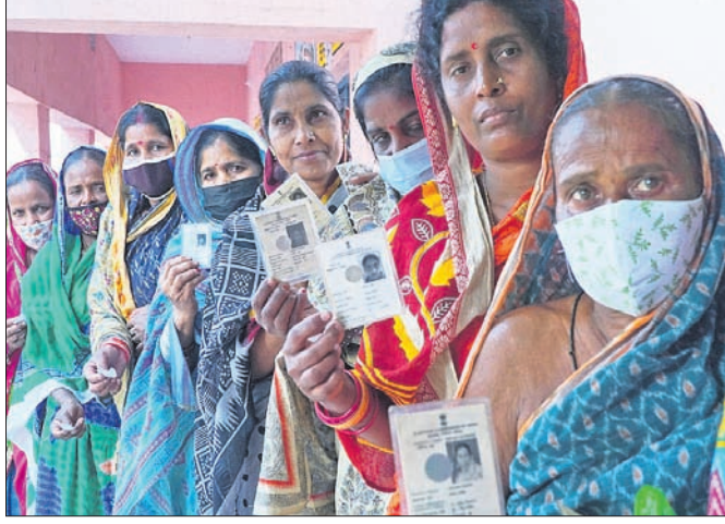
ଅନୁଗୋଳ ବ୍ଲକର ଏକ ବୁଥରେ ଭୋଟ୍ ଦେବାକୁ ମତଦାତାଙ୍କ ଧାଡ଼ି।

ତ୍ରିପୁରାୟ ପଞ୍ଚାୟତ ନିର୍ବାଚନ ପ୍ରଥମ ପର୍ଯ୍ୟାୟ ମତଦାନ ଅନୁଗୋଳ ଜିଲ୍ଲାର ଅନୁଗୋଳ ଓ ବଞ୍ଚିପାଳ ବ୍ଲକରେ ବୁଧବାର ଶେଷ ହୋଇଛି। ଦୁଇ ବ୍ଲକରେ ମୋଟ୍ ୯୪୪ ବୁଥରେ ଶାନ୍ତିପୂର୍ଣ୍ଣ ଭାବେ ଭୋଟ୍ ଗ୍ରହଣ