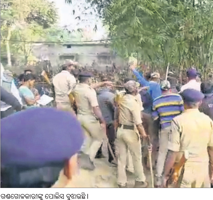
ଗଞ୍ଜବୋକକାରୀଙ୍କୁ ପୋଲିସ୍ ବୁଝାଇଛି।