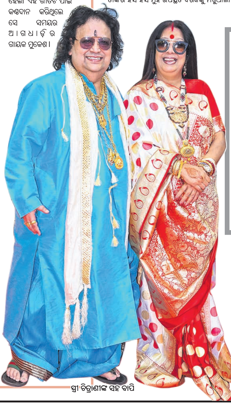
ସ୍ୱୀ ଚିତ୍ରାଶାଳ ସହ ବାପି

‘ନନ୍ଦା ଶିକାରୀ’ରୁ ଆରମ୍ଭ ସଙ୍ଗୀତ କ୍ଷେତ୍ରରେ ନିଜର ପରିଚୟ ସୃଷ୍ଟି କରିବାକୁ ବାପି ଲାହିରା ଜନ୍ମସ୍ଥାନ ଛାଡ଼ି ବନ୍ଦେ ଆସିଥିଲେ । ସେତେବେଳେ ତାଙ୍କର ବୟସ ଥିଲା ମାତ୍ର ୧୯ ବର୍ଷ । ୧୯୭୩ରେ ବଲିଉଡ଼ରେ ମ୍ୟୁଜିକ କମ୍ପୋଜିଟନ ପାଇଁ ପ୍ରଥମ ସୁଯୋଗ ମିଳିଥିଲା । ତଳଜିତ୍ତି ଥିଲା ‘ନନ୍ଦା ଶିକାରୀ’ । ତାଙ୍କ ଦ୍ୱାରା ସ୍ୱର ସଂଯୋଜିତ ଏହି ଫିଲ୍ମର ପ୍ରଥମ ଗୀତଟି ଥିଲା ‘ତୁ ହି ମୋର ଚାନ୍ଦ’ । ଖାସ୍ କଥା ହେଲା ଏହି ଗୀତଟି ପାଇଁ କଣ୍ଠଦାନ କରିଥିଲେ ସେ ସମୟର ଅ.ଗ.ଧ.ଢି.ର ଗାୟକ ମୁକେଶ ।