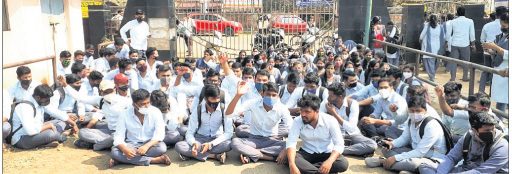
ଛାତ୍ରୀଛାତ୍ରୀମାନେ ଧାରଣାରେ ବସିଛନ୍ତି।