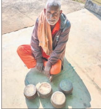
ଖଞ୍ଜିଣୀ ସହ ଚିରଫ ହୋଇଥିବା ବ୍ୟକ୍ତି।