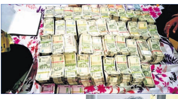
ଚକ୍ରାଭ ହୋଇଥିବା ଘର ଏବଂ କବଚ ଟଙ୍କା ।

ନିମାପଡ଼ା(ଡିଏନଏ)/ଭୁବନେଶ୍ୱର, ୧୬/୨(ବୁଧବାର) ପ୍ରସବ ପୂର୍ବରୁ ନେଇଥିଲେ ୫ ହଜାର । ପରେ ଆଉ ୩ ହଜାର ଟଙ୍କା ଲାଞ୍ଚ ଗ୍ରହଣ କରୁଥିବାବେଳେ ଭିଜିଲାନ୍ସ ହାତରେ ଧରାପଡ଼ିଲେ ତାଙ୍କୁ ଗିରଫ କରାଯାଇଛି ।