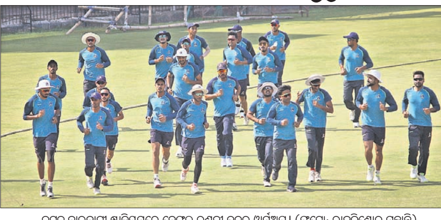
କଟକ ବାରବାଟୀ ସ୍ଥାପନାରେ କେଳା ରଖଣ ଦଳର ଉପାଧିପତି ।

ଭାରତୀୟ କ୍ରିକେଟର ମେଡିଆ ଟ୍ରଷ୍ଟ ଦ୍ୱାରା ୨ ବର୍ଷ ବ୍ୟବଧାନରେ ପ୍ରତ୍ୟାବର୍ତ୍ତନ କରିବାକୁ ଯାଉଛି । କୋଲକାତା ସହ ପ୍ରଥମ ମ୍ୟାଚ ଖେଳିବେନି ମ୍ୟାକ୍‌ଡୁୱେଲ ।