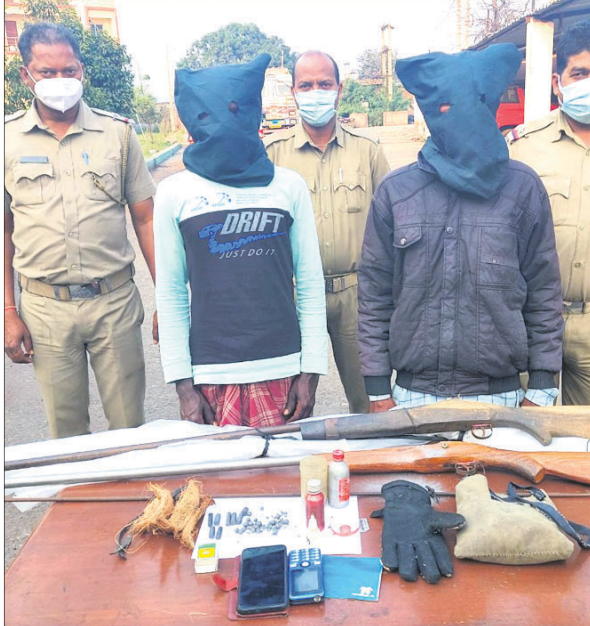
ଗିରଫ ୨ ଅଭିଯୁକ୍ତ, ଜବତ ବସ୍ତୁ ଓ ଅନ୍ୟ ସାମଗ୍ରୀ।