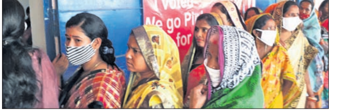
ଚଢ଼ିଆ ବ୍ଲକ ସାଥୀପଡ଼ିପାଟଣାଠାରେ ପିକ୍ ବୁଥରେ ମହିଳାଙ୍କ ଲାଗି ଧାଡ଼ି।

ହିନ୍ଦୋଳ ବ୍ଲକର ୪ ଜିଲ୍ଲା ପରିଷଦ କୋର୍ଡ଼ ଓ ୩୫ ପଞ୍ଚାୟତରେ ମୋଟ୍ ୪୪୫ ବୁଥ ପର୍ଯ୍ୟାୟ ମତଦାନ ଶେଷ ହୋଇଛି। ଏହି ପର୍ଯ୍ୟାୟରେ ହିନ୍ଦୋଳ ଓ ଚଢ଼ିଆ ବ୍ଲକରେ ଭୋଟ୍‌ଗ୍ରହଣ ହୋଇଥିଲା।