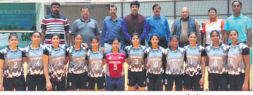
ପଶ୍ଚିମବଙ୍ଗୀୟ ହରାଇବାପରେ ଓଡ଼ିଶା ମହିଳା ଭଲିବଲ ଦଳର ଖେଳାଳିମାନେ କର୍ମକର୍ତ୍ତାଙ୍କ ଗହଣରେ ।

ଭଲିବଲ ବିଭାଗରେ ଅନୁଷ୍ଠିତ ଅନ୍ୟ ମ୍ୟାଚରେ ତାମିଲନାଡୁ ୩-୨ (୨୫-୧୯, ୧୭-୨୫, ୨୦-୨୫, ୨୫-୨୩, ୧୭-୧୫) ସେଟ୍‌ରେ ହରିୟାଣାକୁ ଏବଂ ରାଜସ୍ଥାନ ୩-୦ (୨୬-୨୫, ୨୫-୨୧, ୨୫-୧୭) ସେଟ୍‌ରେ କେରଳକୁ ହରାଇ ଦେଖିଲା । ପ୍ରକାଶପାଠ୍ୟ ଯେ, ଜୁମାରୁ ୩ ବର୍ଷ ପାଇଁ ଜାତୀୟ ସିନିୟର ଭଲିବଲ ପ୍ରତିଯୋଗିତାରେ ସଫଳ ଆୟୋଜନ ପରେ କିଏ ପରିସରରେ ପ୍ରଥମଥରପାଇଁ ସମ୍ମାନଜନକ ଫେଡେରେଶନ୍ କପ୍ ଭଲିବଲ ଟୁର୍ନାମେଣ୍ଟ ଅନୁଷ୍ଠିତ ହେଉଛି ।