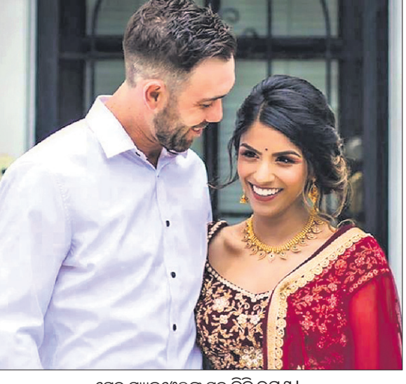
ଭୁବନେଶ୍ୱରରେ ପ୍ରଥମ ମ୍ୟାକ୍‌ଡୁୱେଲ ସହ ଭିଟି ରମଣ ।