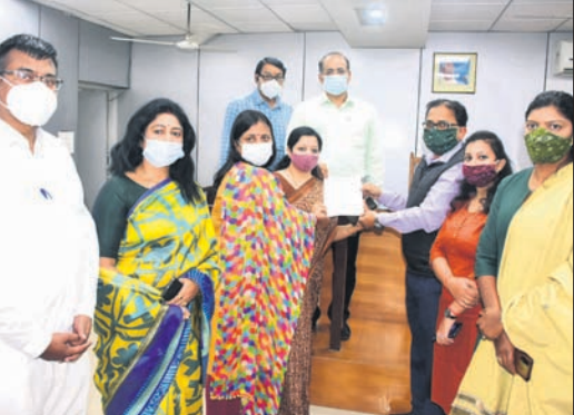
ନିର୍ବାଚନ ହିଂସା ନେଇ ଭିନ୍ନ ଭିନ୍ନ ସମୟରେ ପରସ୍ପର ବିରୋଧରେ ନିର୍ବାଚନ କମିଶନଙ୍କ ନିକଟରେ ଭାଜପା ବିଜେଡିର ଅଭିଯୋଗ।