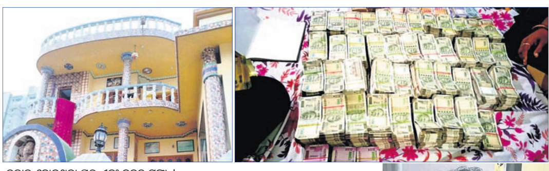
ଚଢ଼ାଇ ହୋଇଥିବା ଘର ଏବଂ ଜବତ ଚକା ।