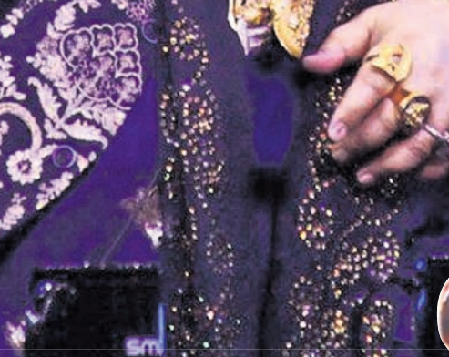
ଆଲ ଆମ ଏ ଡିଷ୍କୋ ଡ୍ୟାନ୍ସର