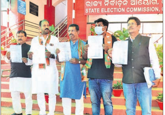
ନିର୍ବାଚନ ହିଂସା ନେଇ ଭିନ୍ନ ଭିନ୍ନ ସମୟରେ ପରସ୍ପର ବିରୋଧରେ ନିର୍ବାଚନ କମିଶନଙ୍କ ନିକଟରେ ଭାଜପା ବିଜେଡିର ଅଭିଯୋଗ।