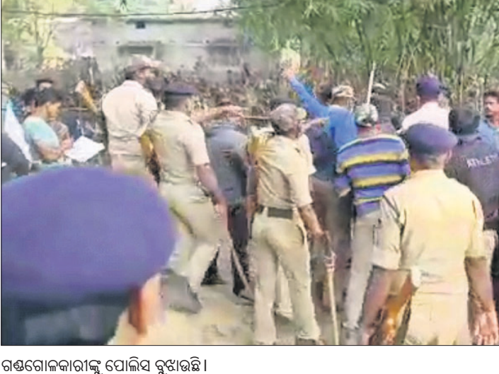
ଗଣଭୋକକାରୀଙ୍କୁ ପୋଲିସ ବୁଝାଇଛି।