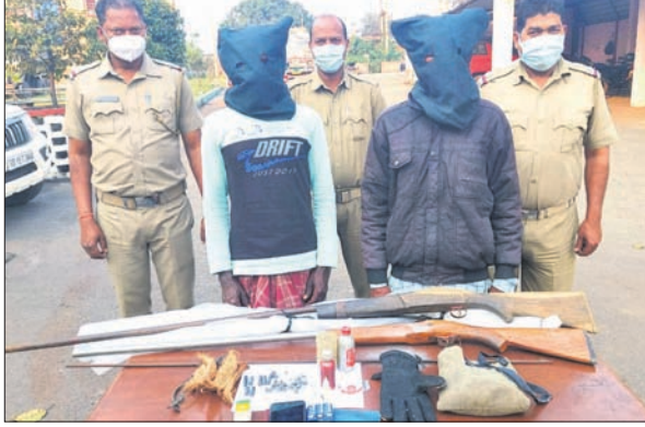
ଗିରଫ ୨ ଅଭିଯୁକ୍ତ, ଜବତ ବସ୍ତୁକ ଓ ଅନ୍ୟ ସାମଗ୍ରୀ।