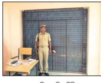
ଖୁଞ୍ଜା ରୁମ୍‌ରେ ପୋଲିସ୍ ଜରି ରହିଛି ।

ଶେରଗଡ଼ ବୁକ୍ସରେ ବୁଧବାର ମତଦାନ ସରିଛି । ପୋଲିଂ ଅଧିକାରୀମାନଙ୍କ ଠାରୁ ଗ୍ରହଣ କରାଯାଇଥିବା ଭୋଟବାକ୍ସ ଗୁଡ଼ିକ ଖୁଞ୍ଜା ରୁମ୍‌ରେ ନେଇ ମାଲିଖେତ୍ର ଓ ପୋଲିସ୍ ଉପସ୍ଥିତିରେ ସଫା କରାଯାଇଛି ।