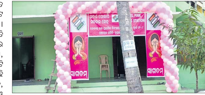
ଛତ୍ରପୁର ବୁକ୍ସରେ ଏକ ପିକ୍ ବୁଥ୍ । ପ୍ରସ୍ତୁତ ହୋଇଛି । ନିର୍ବାଚନ ପରିଚାଳନା ହୋଇଛି । ମୋଟ ୫,୨୮, ୦୮୬ ଜଣ ଲାଗି ୧୨୩୮ ପୋଲିଂ ପାର୍ଟି ନିୟୋଜିତ ଭୋଟର ସେମାନଙ୍କ ମତ ସାଧ୍ୟତା କରିବେ ।