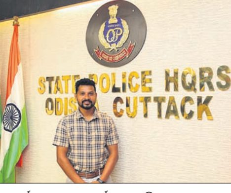
ଗୋକିଓ ଅଲିମ୍ପିକ୍ସରେ ଗୋଟିଏ ପଦକ ବିଜୟୀ ଭାବେ ଯୋଗଦେଇଥିବା ବୀରେନ୍ଦ୍ର।