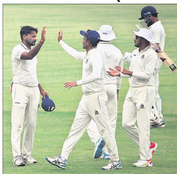
ବରୋଦା ଦଳର ଏକ ଉଇକେଟ ପତନରେ ଉଲ୍ଲସିତ ବେଙ୍ଗାଲ ଖେଳାଳି।

ଭୁବନେଶ୍ୱର, ୧୭/୨ (ଗ୍ରୀତା ପ୍ରତିନିଧି): କଟକର ବାରବାଟୀ ସ୍ଥାଡ଼ିୟମରେ ଗୁରୁବାର ବରୋଦା ଓ ବେଙ୍ଗାଲ ଏକିଟ ଗ୍ରୁପ୍ 'ବି' ରଣଜୀ ଟ୍ରଫି କ୍ରିକେଟ ମ୍ୟାଚ ଆରମ୍ଭ ହୋଇଛି। ଟ୍ୱେଣ୍ଟି ହାରି ପ୍ରଥମେ ବ୍ୟାଟିଂ ଆମନ୍ତ୍ରଣ ପାଇଥିବା ବରୋଦା ପ୍ରଥମ ଇନିଂସରେ ୧୮୧ ରନରେ ଅଲଆଉଟ ହୋଇଛି। ଦଳ