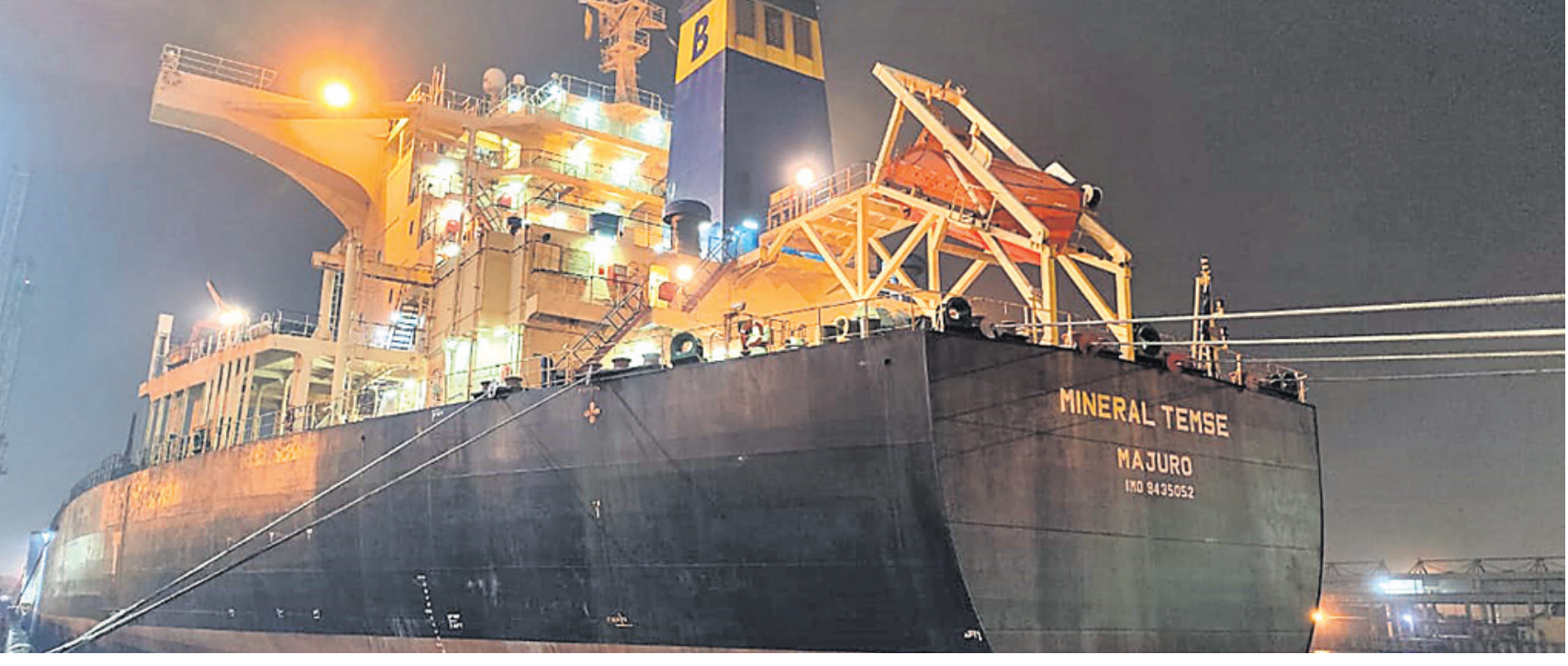
ପାରାଦୀପ ବନ୍ଦରରେ ଲାଗିଥିବା ବୃହତ୍ ଜାହାଜ ଏମ୍.ଭି. ମିନେରାଲ।