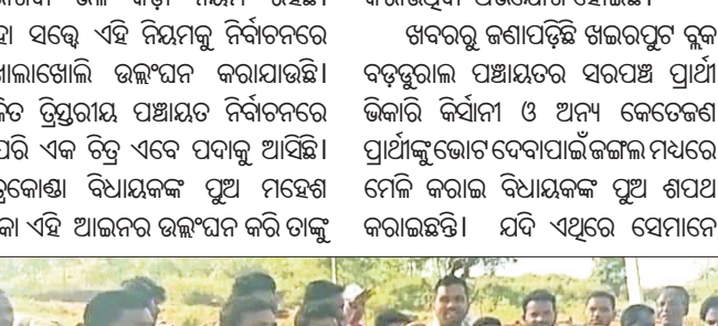
ଜଙ୍ଗଲରେ ଆୟୋଜିତ ହୋଇଥିବା ଶପଥପାଠ କାର୍ଯ୍ୟକ୍ରମ।