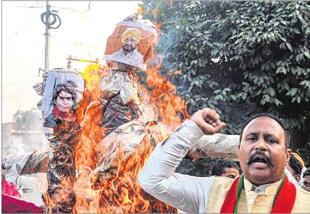
ଜଳନ୍ଧରରେ ସମାଜବାଦୀ ପାର୍ଟି କର୍ମୀମାନେ ଗୁରୁବାର ଏଆଇସିସି ସାଧାରଣ ସମାବେଶ ପ୍ରସ୍ତୁତ କରିବା ପାଇଁ ଗାନ୍ଧୀ ଭଦ୍ରା ଓ ପଞ୍ଜାବ ମୁଖ୍ୟମନ୍ତ୍ରୀ ଚରଣଜିତ ସିଂ ଚରିଙ୍କ କୁଶପୂଜାକାମୀ ଦାୟ କରୁଛନ୍ତି।