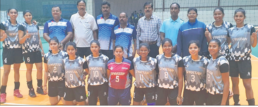
ଓଡ଼ିଶା ଭଲିବଲ ଆସୋସିଏସନ କର୍ମକର୍ତ୍ତାଙ୍କ ସହ ମହିଳା ଭଲିବଲ ଦଳର ଖେଳାଳିମାନେ ।

ଭୁବନେଶ୍ୱର, ୧୮।୨ (କ୍ରୀଡ଼ା ପ୍ରତିନିଧି): ଫେଡେରେଶନ କପ୍ ଏବଂ ଜାତୀୟ ଭଲିବଲ ଉତ୍ସାହରେ ଓଡ଼ିଶା ମହିଳା ଦଳ ପ୍ରଥମଥର ପାଇଁ ଓଡ଼ିଶା ଭଲିବଲ ଆସୋସିଏସନ (ଓଭିଏ) ଆନୁକୂଲ୍ୟରେ କିରୀ ବିଜୁ ପଟ୍ଟନାୟକ ଇନ୍‌ଡୋର ସ୍ପୋର୍ଟସ୍ ଫାଇଲ୍ଡରେ ଫେଡେରେଶନ କପ୍ ଭଲିବଲ ଚୁନାବଳୀର ଶୁଭକାରୀ ପ୍ରାରମ୍ଭ ପାଠ୍ୟପୁସ୍ତକ ମାଧ୍ୟମରେ ହିମାଚଳ ପ୍ରଦେଶକୁ ୩-୦ (୨୫-୧୬, ୨୫-୨୨, ୨୫-୧୫) ସେଟ୍ରେ ହରାଇ ଓଡ଼ିଶା ଏହି ସଫଳତା ପାଇଛି । ପୂର୍ବରୁ ଓଡ଼ିଶା ମହିଳା ଦଳ