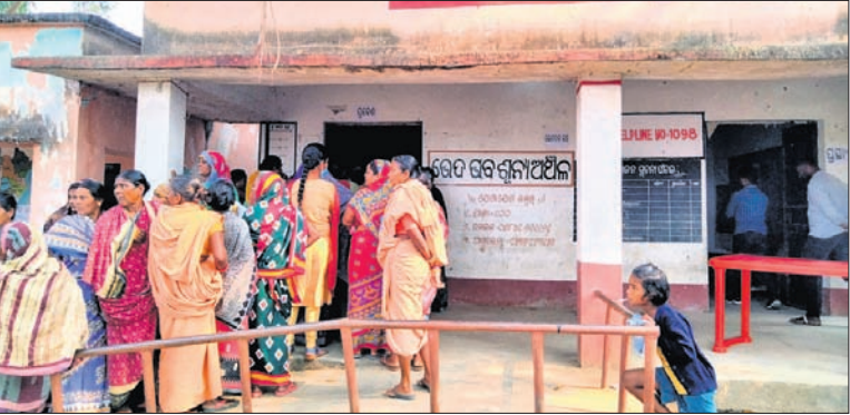
ବୌଦ୍ଧ ଜିଲ୍ଲା ବାଉଁଶୁଣୀ ଅଞ୍ଚଳର ଏକ ମତଦାନ କେନ୍ଦ୍ରରେ ଶୁକ୍ରବାର ଭୋଗରମାନେ ଧଡ଼ିରେ ଛିଡ଼ା ହୋଇଛନ୍ତି।