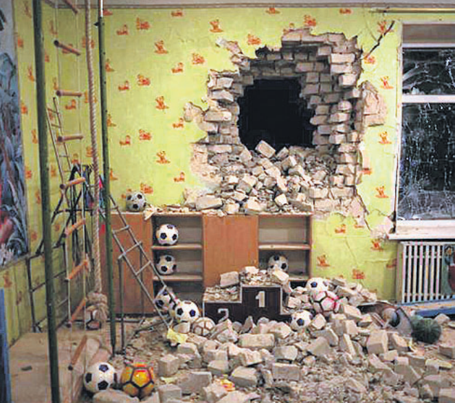
ୟୁକ୍ରେନ୍ ସେନାର ଜଣେ ଅଧିକାରୀଙ୍କ ମତରେ ରୁଷିଆ ସୈନ୍ୟଙ୍କ ଆକ୍ରମଣରେ ସାମାଜିକ ସ୍ଵାଧିନିଆ ଲୁହାନ୍‌ସ୍‌ସ୍‌ଏକ୍ସ୍ ଏକ କିଶରଗର୍ଭେନ୍ ସ୍ଵଳ୍ପ ଧୂସ୍ଵିଧିସ୍ତ ହୋଇଯାଇଛି।

ୟୁକ୍ରେନ୍ ସାମାଜିକ ବିପ୍ଳବ ସୈନ୍ୟ ମୁତୟନ କରି ସାରା ବିଶ୍ଵର ମୁକ୍ତବ୍ୟାପୀ ବଢ଼ାଇ ଦେଇଥିବା ରୁଷିଆ ମୁନିକ୍ ସୁରକ୍ଷା ସମ୍ମିଳନୀ (ଏନ୍‌ଏସ୍‌ଏକ୍ସ୍‌)କୁ ବର୍ଜନ କରିଛି। କର୍ମାନୀର ମୁନିକ୍ ସହରରେ ଶୁକ୍ରବାର ଆରମ୍ଭ ହୋଇଥିବା ଏହି ତିନିଦିନିଆଁ ସମ୍ମିଳନୀରେ ୟୁକ୍ରେନ୍ ସରକାର ଉପରେ ସବୁ ଦେଶର ଫୋକସ୍ ରହିଛି। ଏଥିରେ ଶତାଧିକ ମନ୍ତ୍ରୀ ଓ ୩୦୦ରୁ ଅଧିକ ରାଷ୍ଟ୍ରମୁଖ୍ୟ ଯୋଗଦେବାର କାର୍ଯ୍ୟକ୍ରମ ରହିଛି। କର୍ମାନୀ ଚାନ୍ସେଲର ଓଲାଫ୍ ଷ୍ଟୋଲ୍ଟ୍ ଏବଂ ଆମେରିକା ଉପରାଷ୍ଟ୍ରପତି କମଲା ହାରିସ୍ ମଧ୍ୟ ସମ୍ମିଳନୀରେ ସାମିଲ ହୋଇଛନ୍ତି। ତେବେ ରୁଷିଆର ଅନୁପସ୍ଥିତି ସମସ୍ତଙ୍କୁ ଚଳିତ କରିଛି। ଏନ୍‌ଏସ୍‌ଏକ୍ସ୍‌ରେ ୧୪ ବର୍ଷ ଧରି ଅଧ୍ୟକ୍ଷତା କରିଆସୁଥିବା ଉଲ୍ଲଗେଙ୍ଗ୍ ଇଷ୍ଟିଙ୍ଗେର୍ ଏହାକୁ ଦୁର୍ଭାଗ୍ୟଜନକ ବୋଲି ଅଭିହିତ କରିଛନ୍ତି।