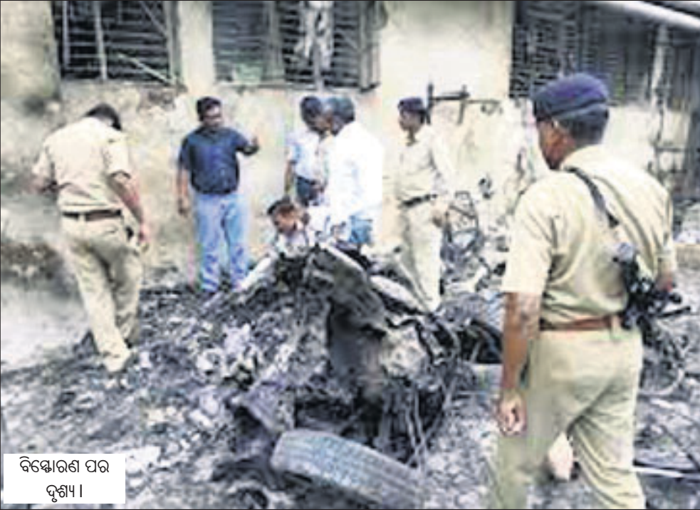
ବିସ୍ଫୋରଣ ପର ଦୃଶ୍ୟ।