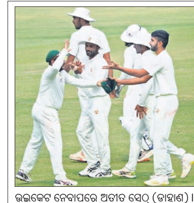
ଉତ୍ତରାଖଣ୍ଡ ନେତାପରେ ଅଟାଏ ସେଟ୍ (ତାହା) ।