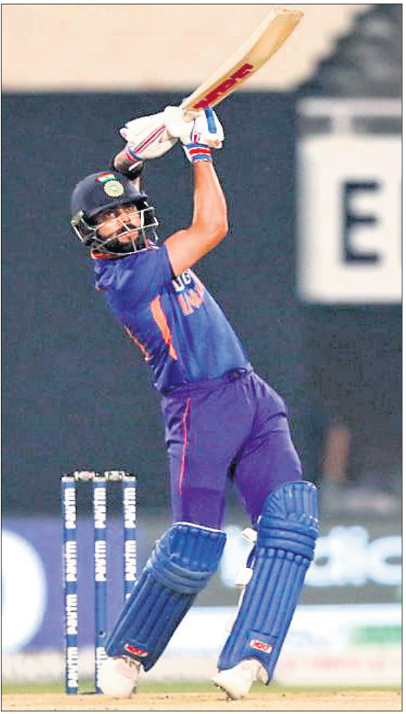
ଶର୍ବ ଖେଳିବା ଅବସରରେ ବିରାଟ କୋହଲି।

କୋଲକାତା, ୧୮/୨ ଫ୍ଲୋରୀଡ଼ିଂ ବିପକ୍ଷରେ ୧୨୦ ରନର ବିଜୟ ହୋଇଛି ଚିନ୍ତା ଲକ୍ଷ୍ୟ। ଶୁକ୍ରବାର ଅନୁଷ୍ଠିତ ସିରିଜର ଦ୍ଵିତୀୟ ମ୍ୟାଚରେ ଭାରତ ୮ ରନରେ ଫ୍ଲୋରୀଡ଼ିଂକୁ ପରାସ୍ତ କରିଛି। ଭାରତ ୨୦ ଓଭରରେ ୫ ଉଇକେଟ ହରାଇ ୧୮୬ ରନ କରିଥିଲା। ନିକୋଲସ ପୁରନ ଓ ରୋଜମାନ ପଞ୍ଜେଲଙ୍କ ବିଶ୍ଵାସୀଳ ବ୍ୟାଟିଂ ସହ ଫ୍ଲୋରୀଡ଼ିଂ ୨୦ ଓଭରରେ ୩ ଉଇକେଟ ହରାଇ ୧୭୮ ରନ କରିବାକୁ ସକ୍ଷମ ହୋଇଥିଲା। ୧୮୬ ରନ ବିଜୟ ଲକ୍ଷ୍ୟ ନେଇ ପଞ୍ଜେଲଙ୍କୁ ଉଦ୍ଘୋଷଣା କରି ଫ୍ଲୋରୀଡ଼ିଂ ଓପନିଂ ଯୋଡ଼ିରେ ୩୪ ରନ ସଂଗ୍ରହ କରିଥିଲା। କାଏଲ ମେୟର୍ସ (୯ ରନ)ଙ୍କୁ ଆଉଟ କରି ଭାରତକୁ ପ୍ରଥମ ସଫଳତା ଦେଇଥିଲେ ଯୁକ୍ତବେସ୍ଟ ଚନ୍ଦ୍ରକାନ୍ତ। ଅନ୍ୟତମ ଓପନର ବ୍ରେଣ୍ଡନ କିଙ୍ଗଙ୍କୁ ଆଉଟ କରିଥିଲେ ଯୁକ୍ତବେସ୍ଟ ଚନ୍ଦ୍ରକାନ୍ତ। କିଙ୍ଗ୍ ୩୦ ବଲ୍ରେ ୨୨ ରନ କରିଥିଲେ। ନିକୋଲସ ପୁରନ ଓ ରୋଜମାନ ପଞ୍ଜେଲ ଦ୍ଵୟର ସହ ଭାରତୀୟ ବୋଲରଙ୍କୁ ମୁକାବିଲା କରି ଫ୍ଲୋରୀଡ଼ିଂର ବିଜୟ ସମ୍ଭାବନା ଉଜ୍ଜୀବିତ କରିଥିଲେ। ତୃତୀୟ ଉଇକେଟ ଯୋଡ଼ିରେ ରୁହେଁ ୬୦ ବଲ୍ରେ ୧୦୦ ରନ ଯୋଗ କରିଥିଲେ। ପୁରନ ୪୧ ବଲ୍ରେ ୫ ଚୋକା ଓ ୩ ଉକା ସହାୟତାରେ ୬୨ ରନ କରି