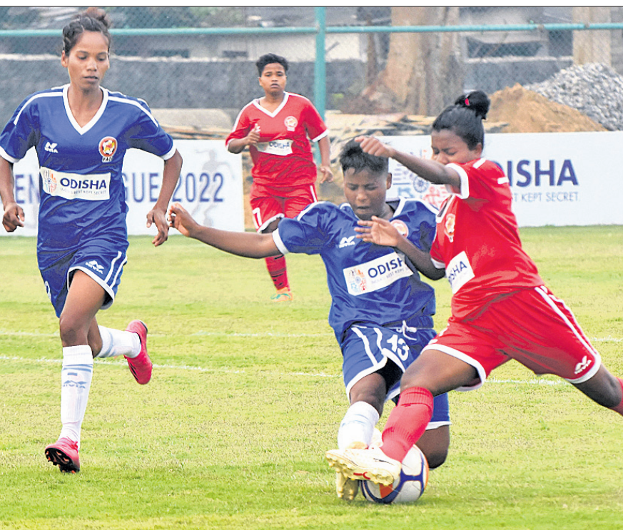
କ୍ୟାପିଟାଲ ଗ୍ରାଉଣ୍ଡରେ ଶୁକ୍ରବାର ଓଡ଼ିଶା ପୋଲିସ୍ ଓ ରାଉଲିଂ ସ୍ପୁଡେଃ ମଧ୍ୟରେ ଅନୁଷ୍ଠିତ ମ୍ୟାଚ।

୧-୦ ଗୋଲରେ ଲକ୍ଷକୋଷ୍ଠ ରେଲଫ୍ରେଜ୍ ପରାସ୍ତ କରିଛି। ଏଠାରେ ଅପରାହ୍ନରେ ଅନୁଷ୍ଠିତ ଓଡ଼ିଶା ଓମେନ୍ସ ଲିଗ୍ ମ୍ୟାଚରେ ଓଡ଼ିଶା ପୋଲିସ୍ ଦୁହେଁ ୬-୦ ଗୋଲରେ ରାଉଲିଂ ସ୍ପୁଡେଃ କ୍ଲବ୍କୁ ହରାଇ ଦେଇଛି। କଳିଙ୍ଗ କ୍ଷୁଦ୍ଧିତମରେ ଅନୁଷ୍ଠିତ ମ୍ୟାଚରେ ସ୍କୋର୍ସ ଓଡ଼ିଶା ୩-୦ ଗୋଲରେ ଓଡ଼ିସି କ୍ଲବ୍କୁ ପରାସ୍ତ କରିଛି। ୨୦ ତାରିଖରେ କଳିଙ୍ଗ କ୍ଷୁଦ୍ଧିତମରେ ସାଇ ଏସ୍ଟିସି-ସ୍କୋର୍ସ ଓଡ଼ିଶା, କ୍ୟାପିଟାଲ ଗ୍ରାଉଣ୍ଡରେ ଓଡ଼ିଶା ପୋଲିସ୍-ଲକ୍ଷକୋଷ୍ଠ ରେଲଫ୍ରେ ଓ ରାଉଲିଂ ସ୍ପୁଡେଃ-ଓଡ଼ିସି କ୍ଲବ୍ ମଧ୍ୟରେ ମ୍ୟାଚ ଖେଳାଯିବ।