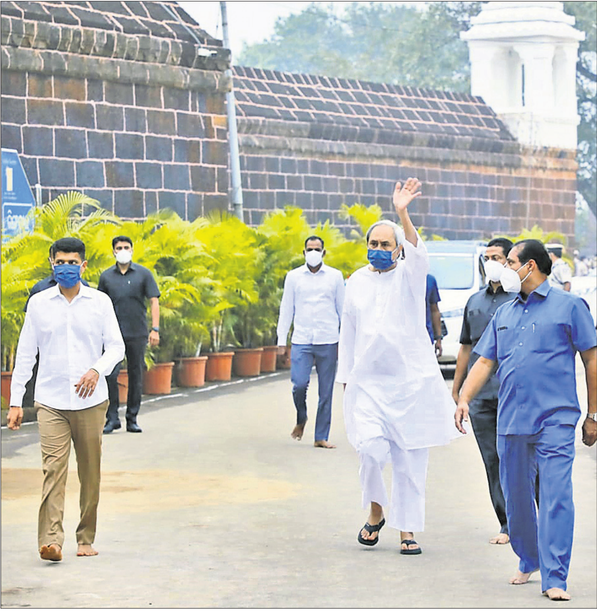
ଶୁକ୍ରବାର ସନ୍ଧ୍ୟାରେ ଭୁବନେଶ୍ୱର ଲିଙ୍ଗରାଜ ମନ୍ଦିରକୁ ଦର୍ଶନ ପାଇଁ ଆସିଥିବା ପୁଖ୍ୟମନ୍ତ୍ରୀ ନବୀନ ପଟ୍ଟନାୟକ । ନିକଟରେ ଅଛନ୍ତି ୫-ଟି ସଚିବ ଭି.କେ.ପାଣିଆଁ ।