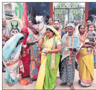
ଭାଜପା ପ୍ରାର୍ଥୀ ପ୍ରଚାର କରୁଛନ୍ତି ।