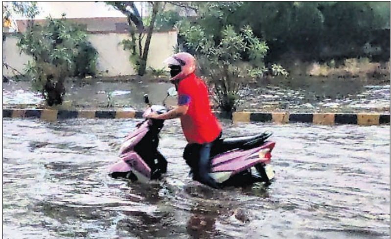
ଭୁବନେଶ୍ୱରରେ ରବିବାର ଅପରାହ୍ଣରେ ହୋଇଥିବା ପ୍ରବଳ ବର୍ଷାରେ ଶିଶୁଭବନ ଛକରୁ ଏୟାରପୋର୍ଟ ରାସ୍ତାରେ ଆଣ୍ଟୁସ ପାଣିର ପୁଅ।

ଭୁବନେଶ୍ୱର, ୨୦୧୨ (ସ.ପ୍ର.): ଅନୁଗୋଳ ଜିଲ୍ଲା ଜରପଡ଼ା ଥାନା ଅଞ୍ଚଳର ଜଣେ ନାବାଲିକାଙ୍କୁ ବଳାକ୍ଳାର ଉଦ୍ୟମ ନେଇ ରବିବାର ଉତ୍ତର ପ୍ରାନ୍ତର ପ୍ରକାଶ ପାଇଛି।