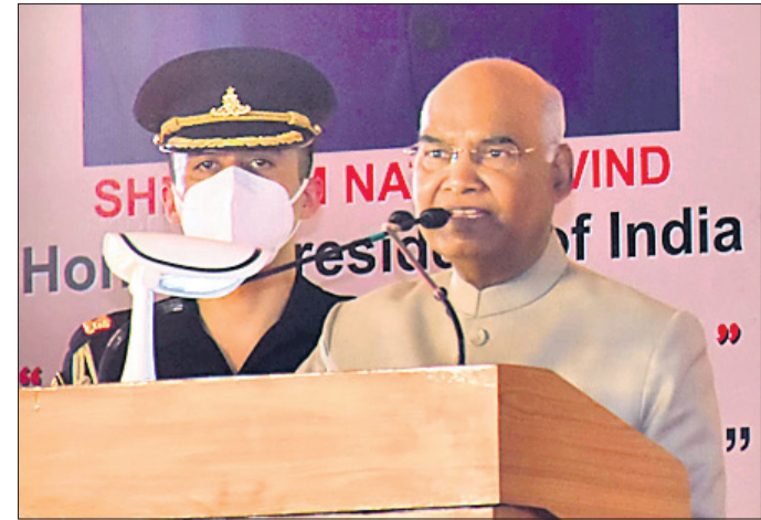
ରାଷ୍ଟ୍ରପତି ରାମନାଥ କୋବିନ୍ଦ ଉଦ୍‌ଘୋଷଣା ଦେଉଛନ୍ତି।

ପଞ୍ଚାୟତ ଭୋଟ ■ ବିତିତ, ଖବରଦାତାଙ୍କୁ ଆକ୍ରମଣ ■ ପୋଲିସକୁ ପାଣି ପାଇବ୍ରେ ମାଡ଼ ■ ଭୋଟ ଗାନ୍ଧୀରେ ପାଣି ଭର୍ତ୍ତି କଲେ ଦୁର୍ଭିକ୍ଷ ■ ଭୋଟ ଗାନ୍ଧୀ ଭୋଲନେଲେ ଡକାରିଆ ■ ଗୃହ ବ୍ୟକ୍ତିଙ୍କ ନାଁରେ ଘଟଣାକୁ ନେଇ ଭିତ୍ତିଭଙ୍ଗ