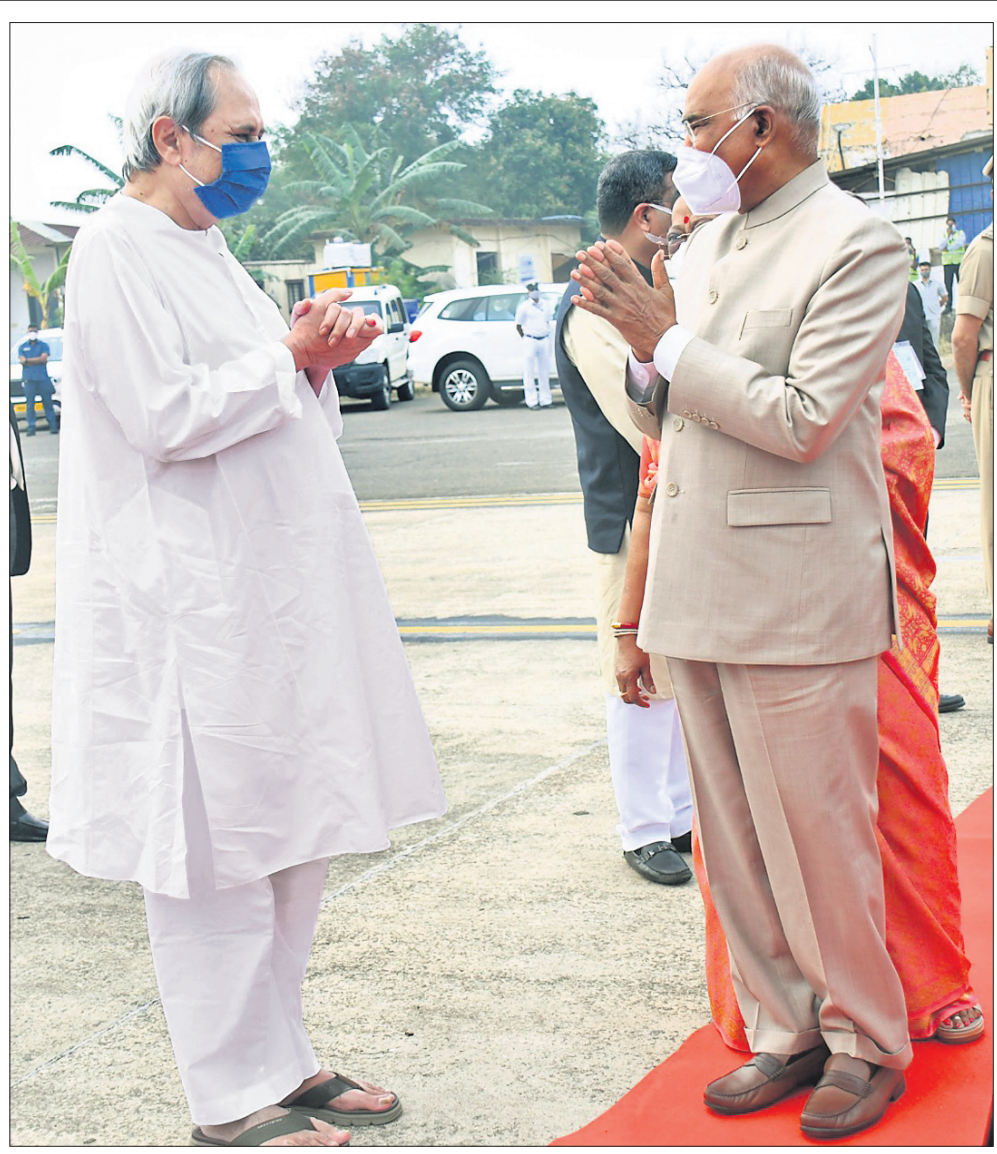
୨ ଦିନିଆ ଓଡ଼ିଶା ଗସ୍ତରେ ଆସିଥିବା ରାଷ୍ଟ୍ରପତି ରାମନାଥ କୋବିନ୍ଦଙ୍କୁ ରବିବାର ଭୁବନେଶ୍ୱର ବିମାନବନ୍ଦରରେ ମୁଖ୍ୟମନ୍ତ୍ରୀ ନବୀନ ପଟ୍ଟନାୟକ ବିଦାୟ ଦେଉଛନ୍ତି।