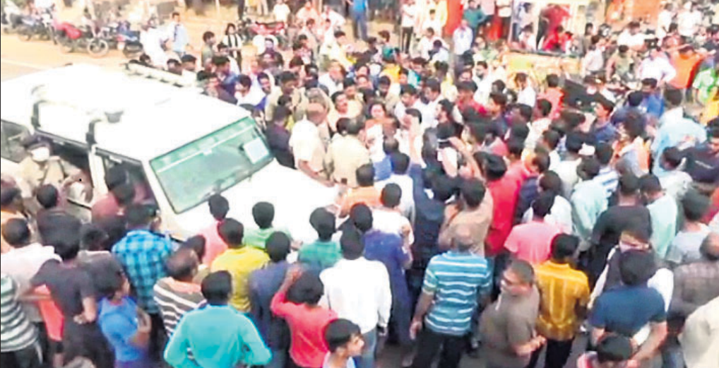
ଇଟାମାଟି ଥାନା ସମ୍ମୁଖରେ ରାସ୍ତାବୋକୋ କରାଯାଇଛି ।