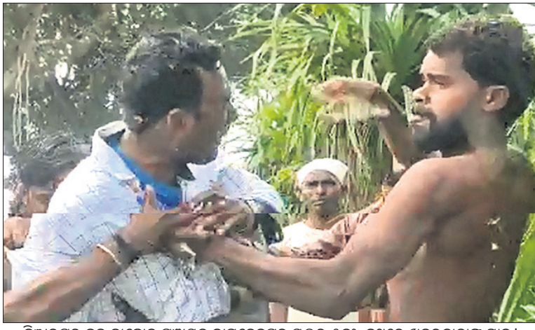
ବିଜ୍ଞାନପୁର ରୁକ୍ ବାଲୋକ ପଞ୍ଚାୟତ ବାମଦେବପୁର ସ୍କୁଲର ୨୯ ନଂ. ରୁଥରେ ଖବରଦାତାଙ୍କୁ ମାଡ଼।

ପଞ୍ଚାୟତ ଭୋଟ ■ ବିତିତ, ଖବରଦାତାଙ୍କୁ ଆକ୍ରମଣ ■ ପୋଲିସକୁ ପାଣି ପାଇବ୍ରେ ମାଡ଼ ■ ଭୋଟ ଗାନ୍ଧୀରେ ପାଣି ଭର୍ତ୍ତି କଲେ ଦୁର୍ଭିକ୍ଷ ■ ଭୋଟ ଗାନ୍ଧୀ ଭୋଲନେଲେ ଡକାରିଆ ■ ଗୃହ ବ୍ୟକ୍ତିଙ୍କ ନାଁରେ ଘଟଣାକୁ ନେଇ ଭିତ୍ତିଭଙ୍ଗ