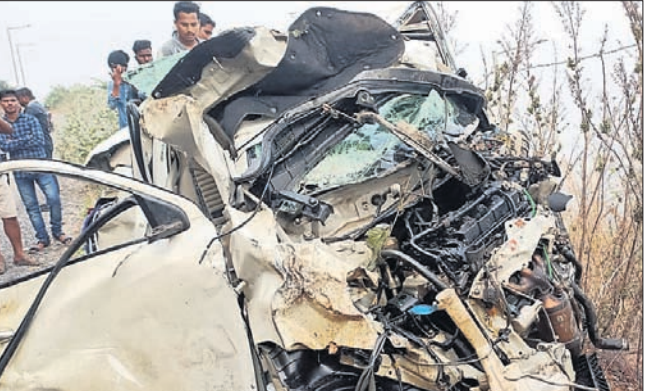
ଚୁରମାର୍ ହୋଇଯାଇଥିବା କାର୍ ।

ନୟାଗଡ଼ ଅଫିସ/ରଣପୁର, ୨୦୧୨(ସ.ପ୍ର.) : ରବିବାର ନୟାଗଡ଼ ଜିଲ୍ଲାର ମା'ମଣିନାଗ ପାହାଡ଼ରୁ ଏକ କାର୍ ୧୫କାରରୁ ଉର୍ଦ୍ଧ୍ୱ ପୁର୍ବ ଚଳୁଥିବା ବେଳେ ଖସି ପଡ଼ିଛି । ତେବେ ପାହାଡ଼ରେ ଥିବା ଏକ ବଡ଼ ଗଛ ଯୋଗୁ ୬ ଯାତ୍ରୀଙ୍କ ଜୀବନ ରକ୍ଷା ପାଇଛି । କିନ୍ତୁ କାରଟି ଚୁରମାର୍ ହୋଇ ଯାଇଛି । ଏହି ଦୁର୍ଘଟଣାରେ ୪ ଜଣ ଆହତ ହୋଇଛନ୍ତି । ସେମାନଙ୍କ ମଧ୍ୟରୁ ୨ଜଣଙ୍କ ଅବସ୍ଥା ଗୁରୁତର ରହିଛି । ମିଳିଥିବା ସୂଚନା ଅନୁଯାୟୀ, ଖୋର୍ଦ୍ଧା