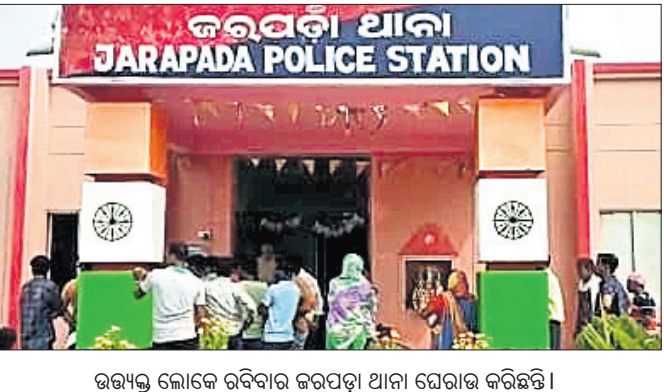
ଉତ୍ତର ଭୋକେ ରବିବାର ଜରପଡ଼ା ଥାନା ଘେରାଇ କରିଛନ୍ତି।