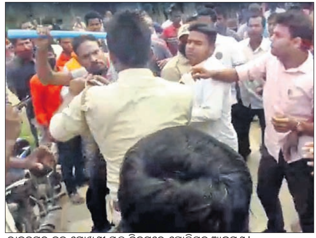
ରାଜନଗର ରୁକ୍ ଗୋଖଣୀ ସ୍କୁଲ ନିକଟରେ ପୋଲିସକୁ ଆକ୍ରମଣ।