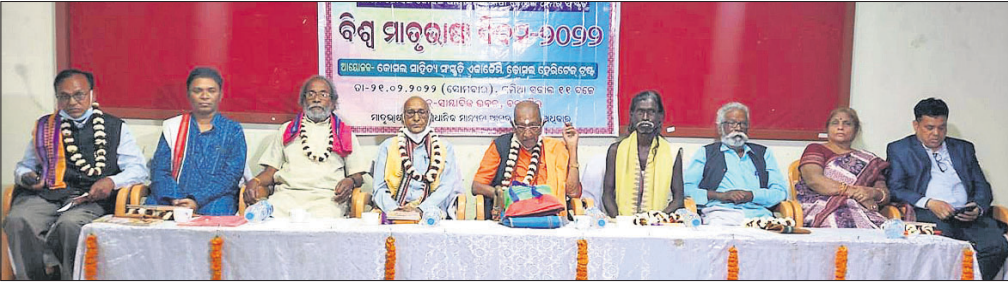
ବିଶ୍ୱ ମାତୃଭାଷା ଦିବସ ଅବସରରେ ବଲାଙ୍ଗୀରରେ ଆୟୋଜିତ ସଭାରେ ମଞ୍ଚାସୀନ ଅଭି୍ୟୁକ୍ତ

କୋସଳା ଭାଷା, ସାହିତ୍ୟ ଓ ସଂସ୍କୃତିକୁ ନେଇ ବିଶ୍ୱସ୍ତରରେ ସମ୍ମାନ ଓ ଆଦର ମିଳୁଛି। ବିଭିନ୍ନ ଭାଷାରେ ଅନୁବାଦ କରାଯାଇଛି। ଖୋଦ୍ କେନ୍ଦ୍ର ଓ ରାଜ୍ୟ ସରକାର ଏହି ଭାଷାର କବି, ଲୋକକୁ ମର୍ଯ୍ୟାଦାଜନକ ସମ୍ମାନରେ ସମ୍ମାନିତ କରୁଛନ୍ତି।