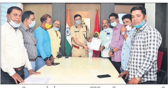
ଉତ୍କଳ ସାମ୍ପାଦନିକ ସଂଘ କର୍ମକର୍ମୀମାନେ ସୋମବାର ଡିଜିପିଙ୍କୁ ଭେଟି ସ୍ୱାଗତପତ୍ର ପ୍ରଦାନ କରୁଛନ୍ତି।

ରୁଝି, ବିଗତ କିଛି ବର୍ଷ ହେବ ରାଜ୍ୟରେ ସାମ୍ପାଦନିକମାନେ କ୍ରମାଗତ ଆକ୍ରମଣର ଶିକାର ହେଉଛନ୍ତି। କେତେକ ଘଟଣାରେ କାର୍ଯ୍ୟାନୁଷ୍ଠାନ ନିଆଯାଉଥିଲେ ମଧ୍ୟ ତାହା ଦୃଢ଼ ଓ ଦୃଷ୍ଟାନ୍ତମୁକ୍ତ ନ ହେଉଥିବାରୁ ଆକ୍ରମଣକାରୀଙ୍କ ମନୋବଳ ଦୃଢ଼ି ପାଉଛି।