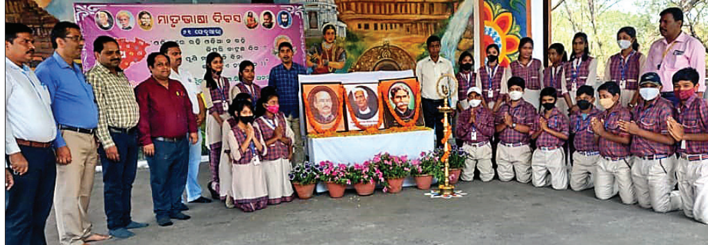
ଉଦ୍‌ଘାଟନା ଅବସରରେ ଉପସ୍ଥିତ ଅତିଥି ଓ ଅନ୍ୟମାନେ।

ଅତିଥି ଭାବେ ଯୋଗଦେଇ ଓଡ଼ିଆ ସାହିତ୍ୟର ପ୍ରଫୁଲ୍ଲତା ସାଧକମାନଙ୍କୁ ଶ୍ରଦ୍ଧାଞ୍ଜଳି ଅର୍ପଣ ସହ ଓଡ଼ିଆ ଭାଷା ପ୍ରତି ଗୁରୁତ୍ୱ ଏବଂ ବିଷ୍ଣୁ ମାଡ଼ୁଭାଷାର ସମ୍ବର୍ଦ୍ଧନାତନ୍ତ୍ର ନେଇ ପ୍ରତିଷ୍ଠିତ ସଂସ୍କୃତି ତଥା ପରମ୍ପରାକୁ ସମୃଦ୍ଧି କରିବା ପାଇଁ ଆହ୍ୱାନ ଦେଇଥିଲେ।