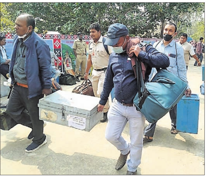
କିଶୋରନଗରର ଏକ ବୁଥ୍ ପୋଲିସ୍ ପାର୍ଟି ଯାଞ୍ଚିଛନ୍ତି।