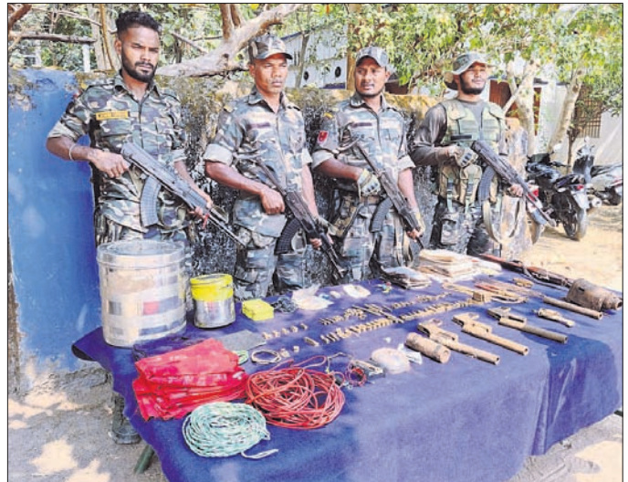
ଜବତ ହୋଇଥିବା ମାଓବାଦୀ ସାମଗ୍ରୀ।