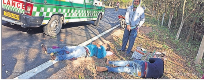
ଗୁରୁତରଙ୍କୁ ୧୦୮ ଆମ୍ବୁଲାନ୍ସ କର୍ମଚାରୀମାନେ ନେତେକାଳ ନେଉଛନ୍ତି।

ଛେତିପଦା, ୨୧।୨ (ସ୍ୱ.ପ୍ର.): ଛେତିପଦା-ଜରପଡା ପୂର୍ବ ଦିଗର ରାସ୍ତାର ଗୁରୁପୁରୁ ଘାଟିରେ ଏକ ଯାତ୍ରାବାହୀ ଅଟୋ ଓଲଟି ୩ ଜଣ ଶ୍ରମିକ ଗୁରୁତର ହୋଇଛନ୍ତି। ଘଟଣାଗୁଡ଼ିକରେ ଆଠମଲ୍ଲିକ ସତ୍ୟବାଦୀପୁର ଗ୍ରାମର ୬୦ ବର୍ଷୀୟ ଏକ ପାଠ୍ୟପୁସ୍ତକ ଅଟୋ ସାହାଯ୍ୟରେ ପାଳକହତ୍ୟା ପାଇଁ ଚାଲିଥିବା ମାମଲାକୁ କାମ କରିବାକୁ ଯାଉଥିଲେ।