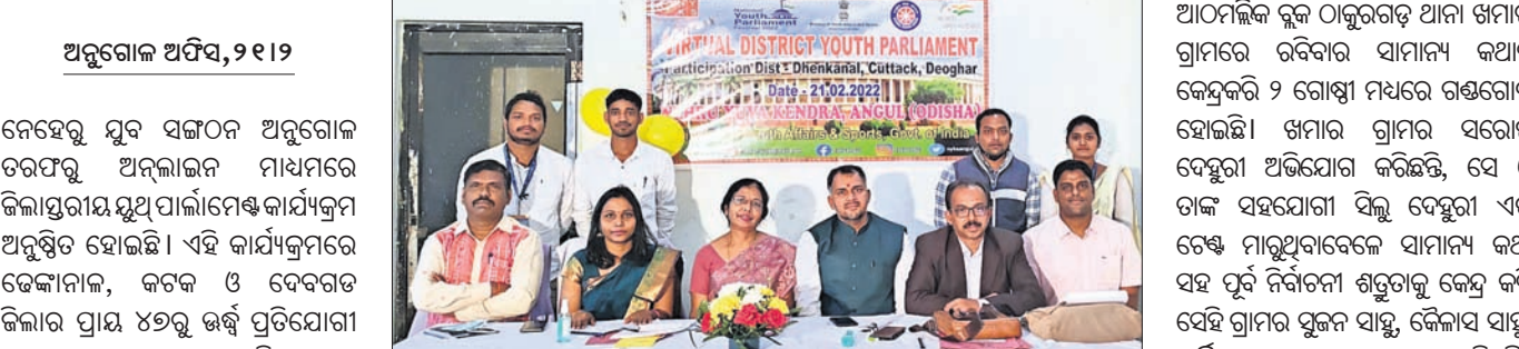
ଯୁଥ୍ ପାର୍ଲାମେଣ୍ଟର ଉପସ୍ଥିତ ଅତିଥିମାନେ।

ଅନୁଗୋଳ ଅଫିସ, ୨୧।୨: ନେହେରୁ ଯୁବ ସଙ୍ଗଠନ ଅନୁଗୋଳ ତରଫରୁ ଅନୁଲାଇନ ମାଧ୍ୟମରେ ଜିଲ୍ଲାସ୍ତରୀୟ ଯୁଥ୍ ପାର୍ଲାମେଣ୍ଟ କାର୍ଯ୍ୟକ୍ରମ ଅନୁଷ୍ଠିତ ହୋଇଛି। ଏହି କାର୍ଯ୍ୟକ୍ରମରେ ଡେ଼ଙ୍କାନାଳ, କଟକ ଓ ଦେବଗଡ଼ ଜିଲାର ପ୍ରାୟ ୪୬୭ ଉର୍ଦ୍ଧ୍ୱ ପ୍ରତିଯୋଗୀ ଯୋଗଦେଇଥିଲେ।