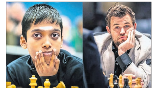
ଆର୍. ପ୍ରଜ୍ଞାନନ୍ଦ ଓ ମାଗ୍ସ କାର୍ଲସେନ।

ଭୁବନେଶ୍ୱର, ୨୧।୨ (ପି.ଟି.): ଘରୋଇ ମାଟିରେ ଫ୍ରେସ୍‌କୋର ବିପକ୍ଷ ସିରିଜ୍ ୩-୦ରେ ଜିନିଷ ସୁଲଭ ବିଜୟ ହାସଲ କରିବା ପରେ ଭାରତ ସଦ୍ୟ ପ୍ରକାଶିତ ଆଇସିସି ପୁରୁଷ ଅନ୍ତର୍ଜାତୀୟ ଚିତ୍ର ଚମ୍ପିୟନ ଚାଲିକାର ଶୀର୍ଷ ସ୍ଥାନ ଅଧିକାର କରିଛି। ରୋହିତ ଶର୍ମାଙ୍କ ଦଳ ରବିବାର ଅନୁଷ୍ଠିତ ଫ୍ରେସ୍‌କୋର ବିପକ୍ଷ ସିରିଜ୍ ଚୂଡ଼ା ଚଢ଼ା ଅନ୍ତର୍ଜାତୀୟ ଚିତ୍ରରେ ୧୭୦ରେ ବିଜୟ ଲାଭ କରିଥିଲା। ଭାରତ ବର୍ତ୍ତମାନ ଲଂକାଙ୍କୁ ହରାଇ ଚିତ୍ର ଚମ୍ପିୟନ ରାଜ୍ୟ ପ୍ରଥମ ସ୍ଥାନ ଦଖଲ କରିନେଇଛି। ପୂର୍ବରୁ ଭାରତ ୨୦୧୭ରେ ନୟାଗଡ଼ ସ୍ଥାନରେ ହିଁ ହାସଲ କରିଥିଲା। ଦଳ ଦୁଇମାସରୁ ସାମାନ୍ୟ ଅଧିକ କିଛି ଦିନ ଏହି ସ୍ଥାନ ବଜାୟ ରଖିପାରିଥିଲା। ଲଂକା ପଛକୁ ଯାଆନ୍ତେ ନାହିଁ,