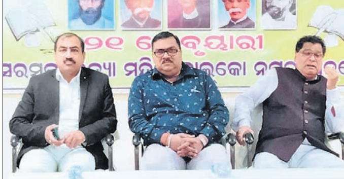
ବିଷ୍ଣୁ ମାଡ଼ୁଭାଷା ଦିବସ ଅବସରରେ ଉପସ୍ଥିତ ଅତିଥିମାନେ।