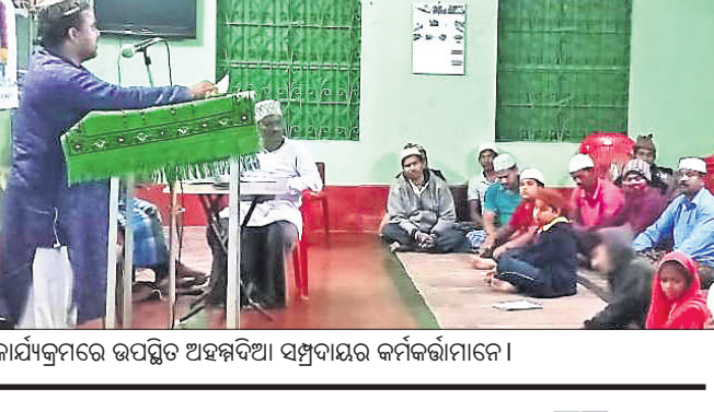
କାର୍ଯ୍ୟକ୍ରମରେ ଉପସ୍ଥିତ ଅହମ୍ମଦୀୟ ସମ୍ପ୍ରଦାୟର କର୍ମକର୍ମୀମାନେ।

ପୁତ୍ର ହେବାର ଆଶୀର୍ବାଦ ପ୍ରଦାନ କରିଥିଲେ। ଲକ୍ଷ୍ମଣ ବାଣୀ ଅନୁପାୟା, ୧୯୮୯ ଜାନୁଆରୀ ୧୨ରେ ହଜରତ ମିର୍ଜା ବସିରୁଦ୍ଦିନ ମହମ୍ମଦ ଅହମ୍ମଦ ନାମରେ ଉକ୍ତ ଶିଶୁପୁତ୍ର ଜନ୍ମ ହୋଇଥିଲା। ପରେ ସେ ଅହମ୍ମଦୀୟ ସମ୍ପ୍ରଦାୟର ସ୍ଵୀକୃତ ଉତ୍ତରାଧିକାରୀ ହୋଇଥିଲେ। ତାଙ୍କ ଉଦ୍ୟମରେ ବିଶ୍ଵ ୨୦୦ରୁ ଉର୍ଦ୍ଧ୍ଵ ବେଶରେ ସମ୍ପ୍ରଦାୟ ପ୍ରସାର ଲାଭ କରିଛି ବୋଲି ସଭାପତି ଅଲୋକପାତ କରିଥିଲେ। ଅହମ୍ମଦୀୟ ମୁସଲିମ ଜମାତର ପ୍ରତିଷ୍ଠାତା ହଜୁର ମିର୍ଜାଗୁଲା ମହମ୍ମଦ ସାହେବ ୧୯୮୭ରେ ହୋଇଥିବାପୁରଠାରେ ୪୦ଦିନ ଧରି କଠୋର ସାଧନା କରିଥିଲେ। ୧୮୮୮ ଫେବୃଆରୀ ୨୦ରେ ଲକ୍ଷ୍ମଣ ତାଙ୍କୁ ଏକ ଅଧ୍ୟାଧାରଣ