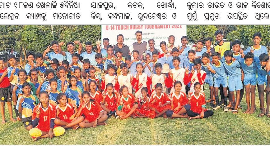
ଅତିଥି ଓ କର୍ମଚାରୀଙ୍କ ସମେତ ରାଜ୍ୟ ଟିମ୍ମର ଖେଳାଳି ଓ ବାଳକ ରଗ୍‌ବୀ ଖେଳାଳି।

ଭୁବନେଶ୍ୱର, ୨୨୧୨ (ବି.ଟି.): ଭୁବନେଶ୍ୱର ଟାଇଟଲ... ଓଡ଼ିଶା ରାଜ୍ୟ ଟିମ୍ମର ଅଂଶିକାରୀ ଭାବେ ଓଡ଼ିଶା ଟିମ୍ମରେ ସାମିଲ ହୋଇଛନ୍ତି।