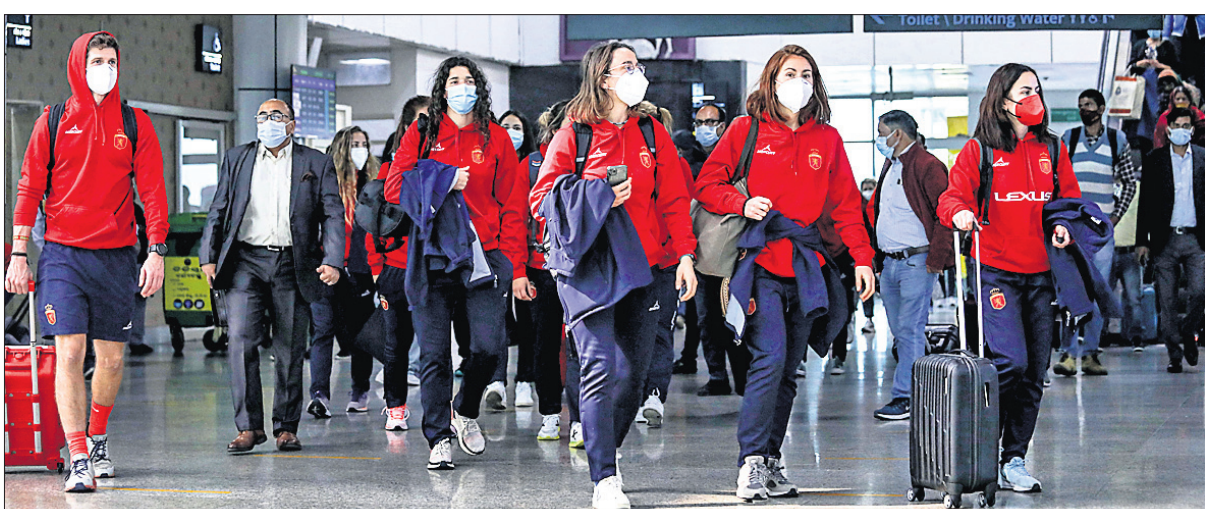
ଏସ୍‌ଆଇଏସ୍ ପ୍ରୋ ଲିଗ୍ ଖେଳିବା ପାଇଁ ମଙ୍ଗଳବାର ଭୁବନେଶ୍ୱରରେ ପହଞ୍ଚିଥିବା ଷ୍ଟେନ ମହିଳା ହକି ଦଳ।