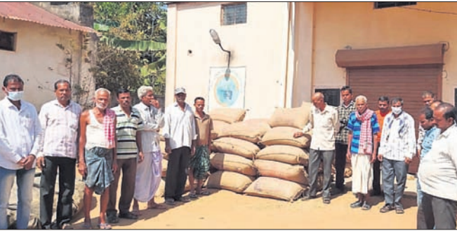
ମଞ୍ଜୁ ଆସିଥିବା ଚାଷୀମାନେ ଧାନ ବସ୍ତା ଧରି ଅପେକ୍ଷା କରିଛନ୍ତି।

କଣିହାଁ, ୨୨୧୨ (ଡି.ଏନ.ଏ.): ଅନୁଗୋଳ ଜିଲା କଣିହାଁ ବ୍ଲକ ବାଲିପଣି ସମ୍ପର୍କରେ ଥିବା ସର୍ବିଆର ଏଟିଏମ୍ ଚୋରି କରାଯାଇଛି।