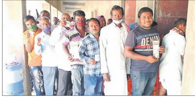
କିଶୋରନଗର ବ୍ଲକ ଶରଧାପୁଣ୍ଡା ପ୍ରାଥମିକ ବିଦ୍ୟାଳୟ ବୃକ୍ଷରେ ମତଦାନ ପାଇଁ ଭୋଟରଙ୍କ ଧାଡ଼ି।

ଅନୁଗୋଳ ଜିଲାରେ ୪ର୍ଥ ପର୍ଯ୍ୟାୟ ଭୋଟଗ୍ରହଣ ମଙ୍ଗଳବାର କିଶୋରନଗର ଓ ଡାକଚେର ବ୍ଲକରେ ସମାପନ ହୋଇଛି।