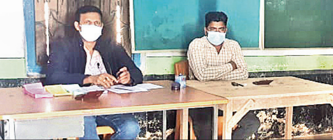
ପୋଲିଂ ବାସ୍ତିକରେ ଥିବା ଅଧିକାରୀ ଭୋଟରଙ୍କୁ ଅପେକ୍ଷା କରିଛନ୍ତି।

କାମାକ୍ଷାନଗର, ୨୨୧୨ (ଡି.ଏନ.ଏ.): ସ୍ଵାଧୀନତାର ଦୀର୍ଘ ୭୫ବର୍ଷ ପରେ ବି ସରକାରୀ ମିଳୁନି ସର୍ବନିମ୍ନ ମୌଳିକ ସୁବିଧା।