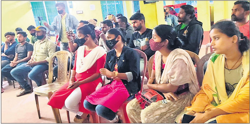
ବୈଠକରେ ବାଲିଆପାଳ ବେକାରି ସଂଘର କର୍ମକର୍ମୀ।

ଦକ୍ଷିଣ ବାଲିଆପାଳର ସମସ୍ତ ଉପକୂଳର ପ୍ରାୟ ୧୦୦ ମୁଦ୍ରାଧିକାରୀଙ୍କୁ ବନ୍ଦର ବିରୋଧୀ ଅସନ୍ତୋଷ ବେକାରି ସଂଘର ପ୍ରତିନିଧିତ୍ୱରେ ବାଲିଆପାଳ ବେକାରି ସଂଘ ପକ୍ଷରେ ପ୍ରତିନିଧିତ୍ୱ କରିବାକୁ ନିର୍ଦ୍ଦେଶ ଦିଆଯାଇଛି।