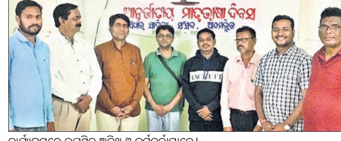
କାର୍ଯ୍ୟକ୍ରମରେ ଉପସ୍ଥିତ ଅତିଥି ଓ କର୍ମଚାରୀମାନେ।

ମାଧୁସୂତ, ୨୨୧୨ ଅଠମାଲିକର ଅଗ୍ରଣୀ ସାହିତ୍ୟ ଅନୁଷ୍ଠାନ ପଞ୍ଚାୟତ ସାହିତ୍ୟ ସଂସଦ ପକ୍ଷରୁ ବିଶ୍ଵ ମାତୃଭାଷା ଦିବସ ପାଳିତ ହୋଇଯାଇଛି।