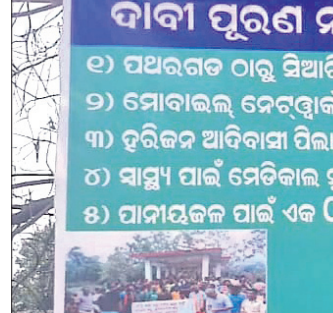
ଭୋଟ ବର୍ଦ୍ଧନ କରି ଗ୍ରାମବାସୀ ଲଗାଇଥିବା ପୋଷ୍ଟର।

ପକାଭାସ୍ତ୍ରା ନିର୍ମାଣ, ମୋବାଇଲ ନେଟୱାର୍କ ସେବା, ପ୍ରଥମରୁ ବ୍ୟବସ୍ଥା ଶ୍ରେଣୀ ଯାଏ ପାଠ ପଢ଼ୁଥିବା ଏସ୍‌ଏ/ଏସ୍‌ସି ପିଲାମାନଙ୍କ ଲାଗି ଏକ ଆଶ୍ରମ ବିଦ୍ୟାଳୟ ପ୍ରତିଷ୍ଠା କରାଯାଇଛି।