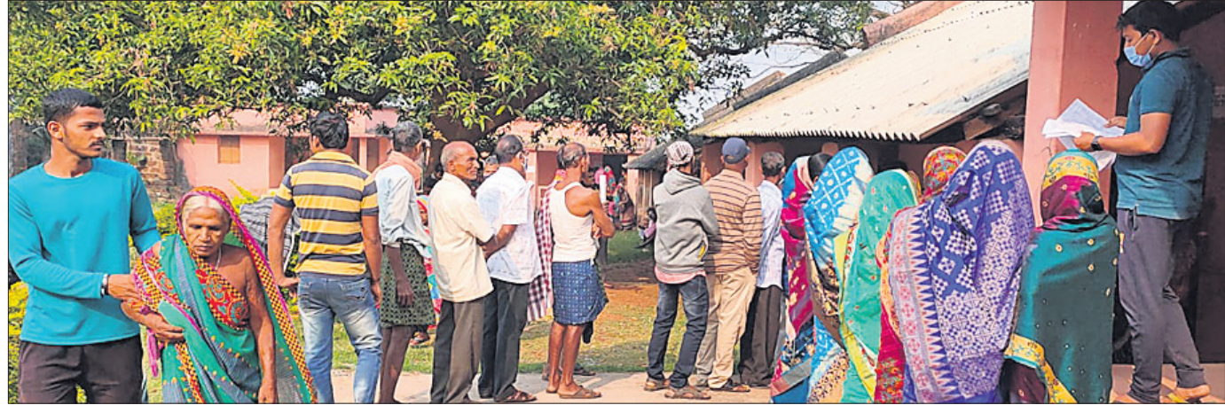
ଭୁବନ ବୁଧରେ ଏକ ବୁଧରେ ମତଦାନ ଲାଗି ଭୋଟରମାନେ ଧାଡ଼ି ବାନ୍ଧି ଛିଡ଼ା ହୋଇଥିବାବେଳେ ଜଣେ ବୁଦ୍ଧା ଭୋଟ ଦେଇ ଫେରୁଛନ୍ତି।