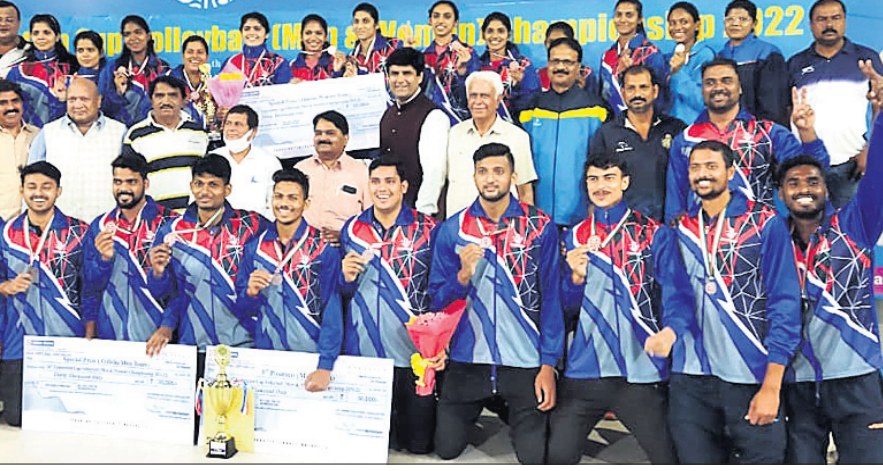
ଫେଡେରେଶନ କ୍ୟୁ ଭଲିବଲ ଟୁର୍ନାମେଣ୍ଟରେ ଟ୍ରୋଫି ପଦକ ଜିତିଥିବା ଓଡ଼ିଶା ଟିମ୍ମର ଖେଳାଳିମାନେ ଅତିଥିଙ୍କ ସମେତ।