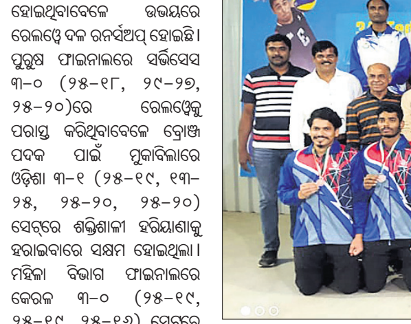
ଫେଡେରେଶନ କ୍ୟୁ ଭଲିବଲ ଟୁର୍ନାମେଣ୍ଟରେ ଟ୍ରୋଫି ପଦକ ଜିତିଥିବା ଓଡ଼ିଶା ଟିମ୍ମର ଖେଳାଳିମାନେ ଅତିଥିଙ୍କ ସମେତ।