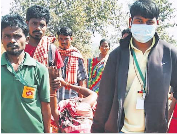
ଷ୍ଟେଡରରେ ଗର୍ଭବତୀଙ୍କୁ ନିଆଯାଇଛି।