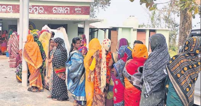
ଭୋଟ ଦେବା ପାଇଁ ଧାଡ଼ିରେ ମହିଳା।