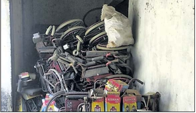
ଦିବ୍ୟାଙ୍ଗ ପାଇଁ ଆସିଥିବା ଉପକରଣ ପଡ଼ି ରହିଛି।