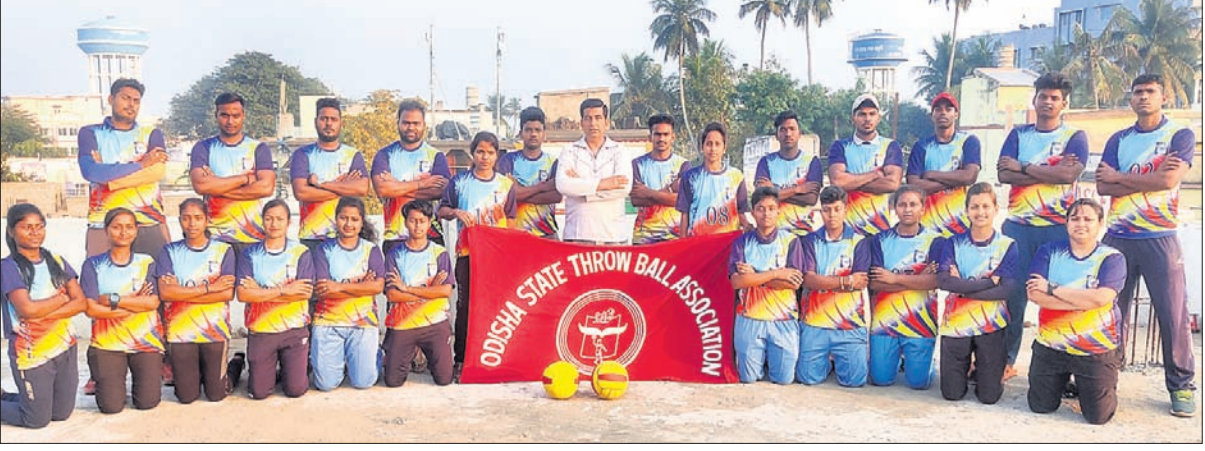
ଜାତୀୟ ସିନିୟର ଥ୍ରୋ ବଲ୍ ଚାମ୍ପିୟନଶିପରେ ଭାଗ ନେବାପାଇଁ ମନୋନୀତ ଓଡ଼ିଶା ମହିଳା ଓ ପୁରୁଷ ଦଳ।