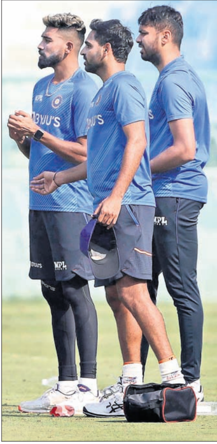
ରୁଧିରା ଅଭ୍ୟାସ ଅବସରରେ ଶ୍ରୀଲଙ୍କା ଚାଳକ କରୁଣାରତ୍ନ ଏବଂ ଭାରତୀୟ ଖେଳାଳି

ଭାରତ ଓ ଶ୍ରୀଲଙ୍କା ମଧ୍ୟରେ ୩ ମ୍ୟାଚ ବିଶିଷ୍ଟ ଟି୨୦ କ୍ରିକେଟ ସିରିଜ ଗୁରୁବାର ୧୦ରେ ଆରମ୍ଭ ହେବ। ଚଳିତ ବର୍ଷ ଆଇସିସି ଟି୨୦ ବିଶ୍ୱକପ ହେବାର ଥିବାରୁ ଭାରତ ନିକଟରେ ପରାସ୍ତାନିରାଧା କରିବାର ସୁଯୋଗ ରହିଛି। ନିକଟରେ ଶେଷ ହୋଇଥିବା ଫ୍ରେଜ୍‌କ୍ଷିଟ୍ ବିପକ୍ଷ ଟି୨୦ ସିରିଜକୁ ଭାରତ ୩-୦ରେ କ୍ଲିନ୍ ସ୍ୱଇପ୍ କରିଥିଲା। ସେହି ପ୍ରଦର୍ଶନ ବଜାୟ ରଖି ଶ୍ରୀଲଙ୍କା ବିପକ୍ଷରେ ଆଧିପତ୍ୟ ବିସ୍ତାର ଲକ୍ଷ୍ୟରେ ରହିଛି ରୋହିତ ଶର୍ମାଙ୍କ ନେତୃତ୍ୱାଧୀନ ଟିମ୍ ଲକ୍ଷିଆ। ଆସକ୍ତ ଅଲୋକର-ନଭେମ୍ବରରେ ଅଷ୍ଟ୍ରେଲିଆରେ ବିଶ୍ୱକପ ହେବାକୁ ଯାଉଥିବାରୁ ଭାରତ ଅଧିକରୁ ଅଧିକ ଖେଳାଳିଙ୍କୁ ସୁଯୋଗ ଦେବା ଲକ୍ଷ୍ୟରେ ରହିଛି। ପ୍ରତିଷ୍ଠିତ ଖେଳାଳି ବିରାଟ କୋହଲି, ରିଷଭ ପନ୍ତ, ଲୋକେଶ ରାହୁଲ ଓ ସୂର୍ଯ୍ୟକୂମାର ଯାଦବଙ୍କ ଅନୁପସ୍ଥିତିରେ ଇଶାନ କିଶନ, ରତ୍ନରାଜ ଗାଏକ୍ୱାଡ ଓ ସଞ୍ଜୁ ସାମସନଙ୍କ ପାଇଁ ଦକ୍ଷତା ଦେଖାଇବାର ସୁବର୍ଣ୍ଣ ସୁଯୋଗ ସୃଷ୍ଟି ହୋଇଛି।