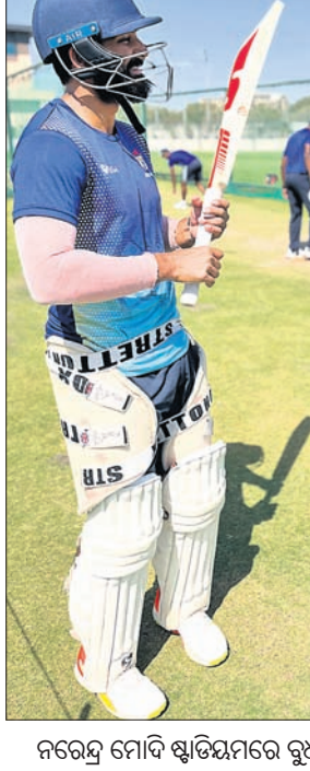
ନରେନ୍ଦ୍ର ମୋଦି ଷ୍ଟାଡିୟମରେ ରୁଧିରା ଓଡ଼ିଶା ଖେଳାଳିଙ୍କ ଅଭ୍ୟାସ।