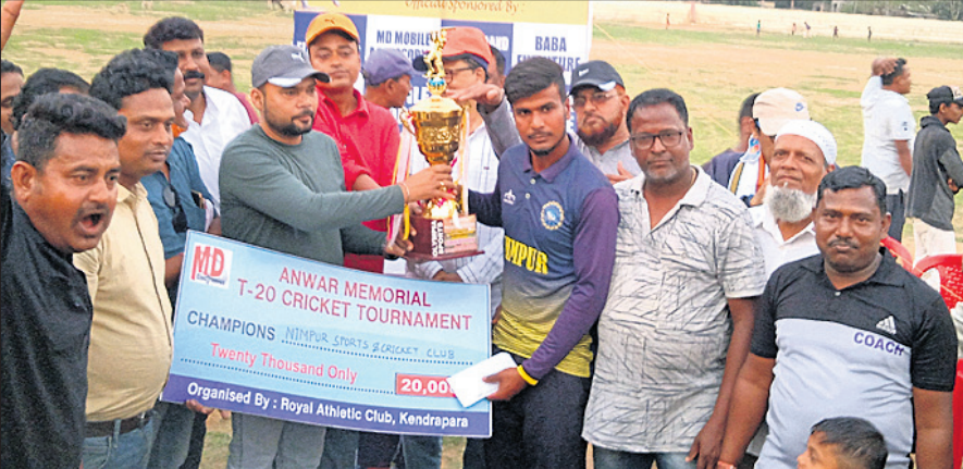
ଚାମ୍ପିୟନ ନିମାପୁର ସ୍ନୋର୍ଡ୍ କ୍ଲବ୍‌ରେ ଖେଳାଳିମାନେ ତ୍ରୁପି ସହ ଅତିଥିଙ୍କ ଗହଣଣାରେ।

କେନ୍ଦ୍ରାପଡ଼ା ଅପ୍ରେଲ, ୨୩୧୨ କେନ୍ଦ୍ରାପଡ଼ା ସହର ଚାଉଳ ସ୍ଥଳରେ ଗତ ୧୨ ତାରିଖରୁ ଆରମ୍ଭ ହୋଇଥିବା ଅନୁଷ୍ଠାନ ମେମୋରିଆଲ ଟି-୨୦ କ୍ରିକେଟ ଟୁର୍ନାମେଣ୍ଟ ରୁଧିରା ଶେଷ ହୋଇଛି। ପାଇନାଲ ମ୍ୟାଚରେ କଟକ ନିମାପୁର କ୍ରିକେଟ କ୍ଲବ୍ ୪ ଉଇଜେଟରେ ପାରାଦାସ କ୍ରିକେଟ କ୍ଲବକୁ ହରାଇ ଚାମ୍ପିୟନ ହୋଇଛି। ପାରାଦାସ କ୍ଲବ ପ୍ରଥମେ ବ୍ୟାଟିଂ କରି ୨୦ ଓଭରରେ ୮ ଉଇଜେଟ