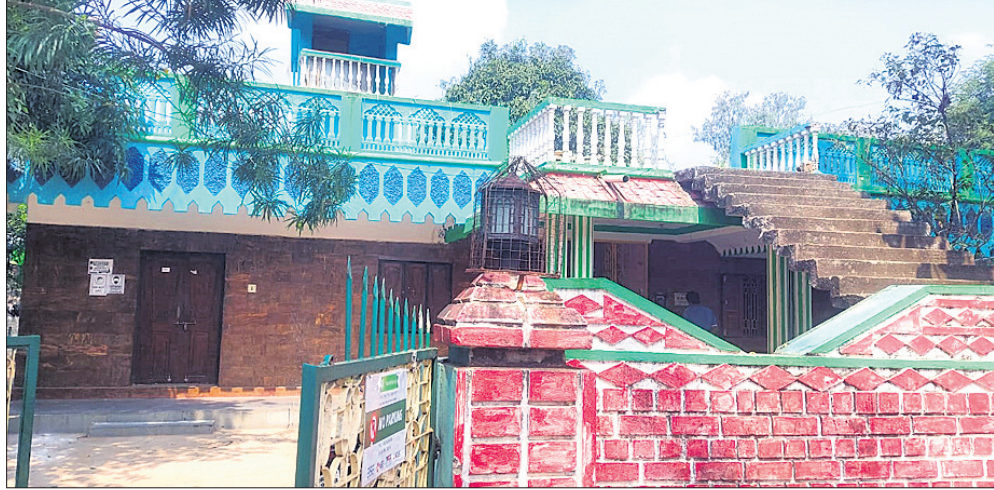
କାମାକ୍ଷାନଗରରେ ଥିବା ରମେଶଙ୍କ କୋଠା