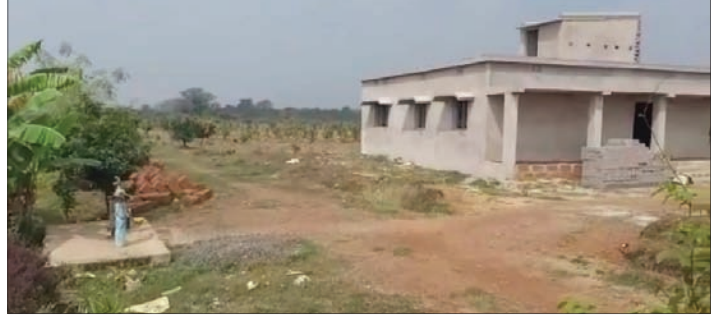
ଖମାର ନୂଆଗାଁରେ ଥିବା ଫାର୍ମ ହାଉସ୍