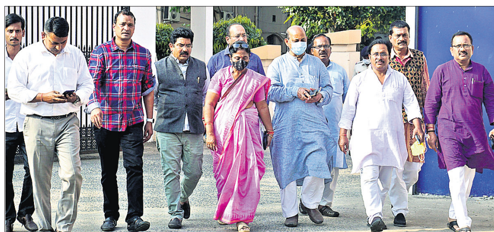
ଭାଜପା ପ୍ରତିନିଧିମଣ୍ଡଳୀ ଡିଡିପିଙ୍କୁ ଭେଟି ଫେରୁଛନ୍ତି।