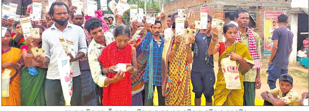
ଭୋଟ ଚାଲିବାର ନାଁ ନ ଥିବା ଧାଡ଼ିଆମ ଗ୍ରାମର ୨୫ ପରିବାର ପ୍ରତିବାଦ କରୁଛନ୍ତି।