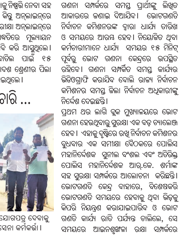
ସିବିଆଇ ଅଧିକାରୀଙ୍କୁ ଅଧିକାର ପ୍ରଦାନ କରାଯାଇଛି।

ରତ୍ନଭଞ୍ଜରୁ ଚୋରି ହେବାର ସମ୍ବାଦ ଲେଖା ଲାଗିଛି। ଆଜିର ରାଜ୍ୟରେ ସମସ୍ତ ଓ ସ୍ୱାଧୀନ ପ୍ରକାଶ କରିବାରେ ନିଷ୍ପତ୍ତି ହେବ ସେ ନେଇ ଏପର୍ଯ୍ୟନ୍ତ ସମ୍ପୂର୍ଣ୍ଣ ନିଷ୍ପତ୍ତି ନାହିଁ।