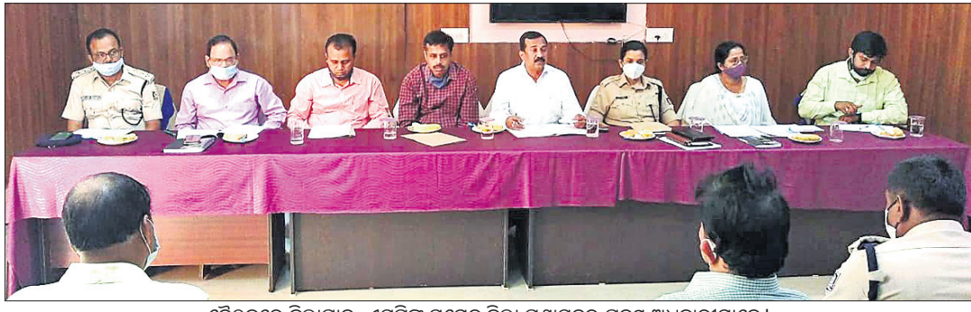
ବୈଠକରେ ଜିଲ୍ଲାପାଳ, ଏସପିଏ ସମେତ ଜିଲ୍ଲା ପ୍ରଶାସନର ପଦସ୍ଥ ଅଧିକାରୀମାନେ।