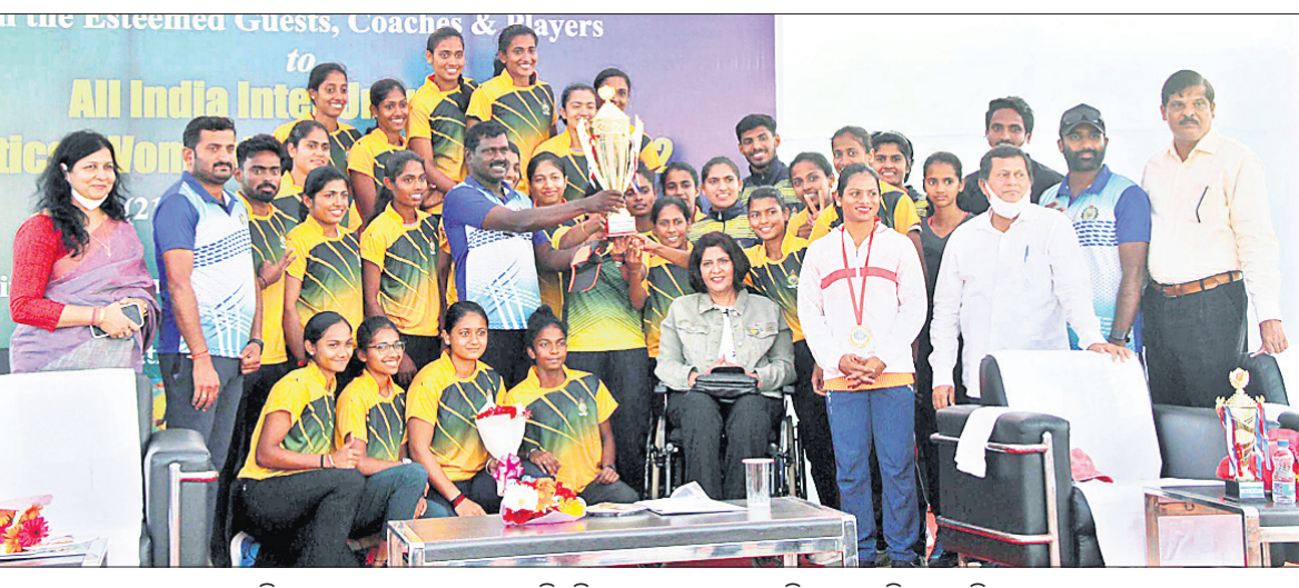
ଦଳଗତ ଚାମ୍ପିୟନ ହୋଇଥିବା ମାଙ୍ଗାଲୋର ବିଶ୍ୱବିଦ୍ୟାଳୟ ଦଳର ଖେଳାଳିମାନେ ଟ୍ରଫି ସହ ଅତିଥିଙ୍କ ଗହଣରେ ।

ଭୁବନେଶ୍ୱର, ୨୪।୨ (କ୍ରୀଡ଼ା ପ୍ରତିନିଧି): କିର୍ ବିଶ୍ୱବିଦ୍ୟାଳୟ ପରିସରରେ ୮୧ତମ ସର୍ବଭାରତୀୟ ଆନ୍ତର୍ଜାତୀୟ ବିଶ୍ୱବିଦ୍ୟାଳୟ ମହିଳା ଆଧୁନିକ ଚାମ୍ପିୟନସ୍ହିପ ଗୁରୁବାର ଉଦ୍‌ଘାଟିତ ହୋଇଛି । ଭାରତୀୟ ବିଶ୍ୱବିଦ୍ୟାଳୟ ସଂଘର ପ୍ରତ୍ୟକ୍ଷ ତତ୍ତ୍ୱାବଧାନ, କିର୍ ବିଶ୍ୱବିଦ୍ୟାଳୟ ସହଯୋଗରେ ଆୟୋଜିତ ଏହି ଚାମ୍ପିୟନସ୍ହିପରେ ମାଙ୍ଗାଲୋର ବିଶ୍ୱବିଦ୍ୟାଳୟ ୫୧ ପଦକ ସହ ଶ୍ରେଷ୍ଠ ବିବେଚିତ ହୋଇଥିବା ବେଳେ କାଳିକଟ ବିଶ୍ୱବିଦ୍ୟାଳୟ (୩୬.୫) ଦ୍ୱିତୀୟ ଓ ଲଭଲି ପ୍ରଫେସନାଲ ବିଶ୍ୱବିଦ୍ୟାଳୟ (୩୪) ତୃତୀୟ ସ୍ଥାନ ଅଧିକାର କରିଛନ୍ତି ।