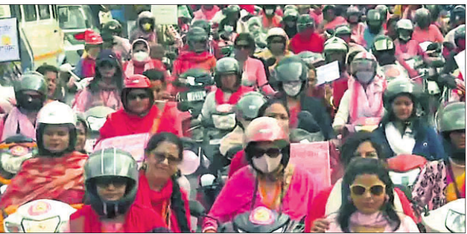
ବାରାଣାସୀରେ ଶିକ୍ଷୟିତ୍ରୀଙ୍କ ଗୋଲାପି ରାଲି ।

ଲକ୍ଷ୍ମୀ, ୨୪.୧.୨୧: ମତଦାନ ପାଇଁ ଲୋକଙ୍କୁ ସଚେତନ କରିବା ଉଦ୍ଦେଶ୍ୟରେ ଉତ୍ତର ପ୍ରଦେଶ ବାରାଣାସୀରେ ମହିଳାଙ୍କ ଦ୍ୱାରା 'ଗୋଲାପି ରାଲି' କରାଯାଇଛି । ଜିଲାର ବିଭିନ୍ନ ସ୍ଥଳରେ ଶିକ୍ଷୟିତ୍ରୀମାନେ ଏହି ରାଲିରେ ସାମିଲ ହୋଇଥିଲେ । ଶିକ୍ଷୟିତ୍ରୀମାନେ ଗୋଲାପି ରଙ୍ଗର ସୁନ୍ଦର ସାଙ୍କୁ ଗୋଲାପି ରଙ୍ଗର ଶାଢ଼ିଫିଏ ଏହି ରାଲିରେ ଯୋଗ ଦେଇଥିଲେ ।