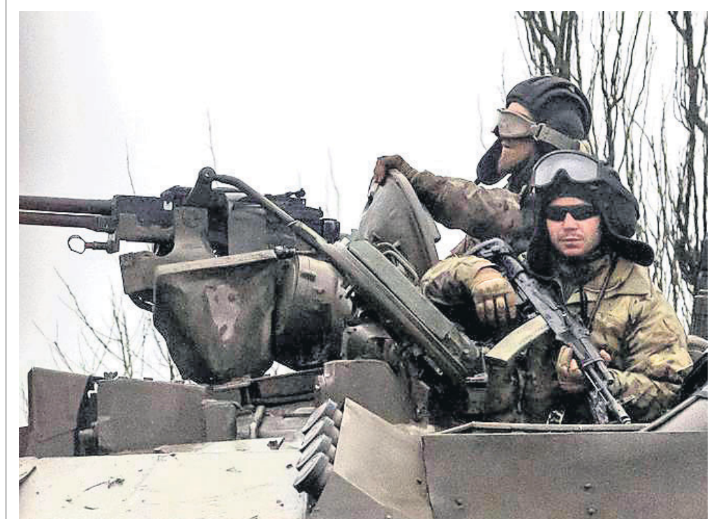
ରୁଷିଆ ରାଷ୍ଟ୍ରପତି ଭୁଦିମିର ପୁଟିନ୍ ସାମରିକ ଅଭିଯାନ ପାଇଁ ନିର୍ଦ୍ଦେଶ ଦେବା ପରେ ମାରିଉପୋଲ ସହରରେ ପ୍ରତିରକ୍ଷା ଲାଗି ୟୁକ୍ରେନ୍ ସେନାର ଯୁଦ୍ଧ ବ୍ୟାଙ୍କ ।