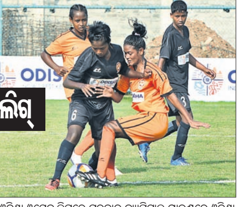
ଓଡ଼ିଶା ଓମେନ୍ସ ଲିଗ୍ରେ ଗୁରୁବାର କ୍ୟାପିଟାଲ ଗ୍ରାଉଣ୍ଡରେ ଓଡ଼ିଶା ପୋଲିସ୍ ଓ ରେଲଫେକ୍ସୁ ମଧ୍ୟରେ ଅନୁଷ୍ଠିତ ମ୍ୟାଚ୍ ।

ଓଡ଼ିଶା ଓମେନ୍ସ ଲିଗ୍ (ଓଡ଼ିଶା ସଂଘ) ଯୁବକ ଚୁନିମେଣ୍ଟରେ ଗୁରୁବାର ୩ଟି ମ୍ୟାଚ୍ ଅନୁଷ୍ଠିତ ହୋଇଛି । ଏଥିରେ ଓଡ଼ିଶା ପୋଲିସ୍, ସ୍ନୋର୍ସ୍ ଓଡ଼ିଶା ଓ ଓଜିପି କ୍ଲବ୍ ବିଜୟ ହାସଲ କରିଛି । କ୍ୟାପିଟାଲ ଗ୍ରା । ଉ ଓ ରେ ଅନୁଷ୍ଠିତ ମ୍ୟାଚ୍ରେ ଓଡ଼ିଶା ପୋଲିସ୍ ୪-୧ ଗୋଲରେ ଇଷ୍ଟକୋଷ୍ଟ ରେଲଫେକ୍ସୁ ପରାସ୍ତ କରିଛି । ଏହି ଗ୍ରାଉଣ୍ଡରେ ଆୟୋଜିତ ଅନ୍ୟ ଏକ ମ୍ୟାଚ୍ରେ ଓଜିପି ୨-୦ ଗୋଲରେ ରାଇଜିଂ ଷ୍ଟୁଡେଣ୍ଟସ୍ ହରାଇ ଦେଇଛି । କଳିଙ୍ଗ ଷ୍ଟାଡିୟମ ମ୍ୟାଚ୍ରେ ସ୍ନୋର୍ସ୍ ଓଡ଼ିଶା ୨-୧ ଗୋଲରେ ସାଲ ଏସ୍ପିସିକୁ ହରାଇ ଦେଇଛି ।