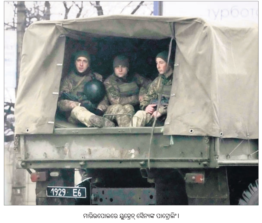
ମାରିଉପୋଲରେ ୟୁକ୍ରେନ୍ ସୈନ୍ୟଙ୍କ ପାଟ୍ରୋଲିଂ ।