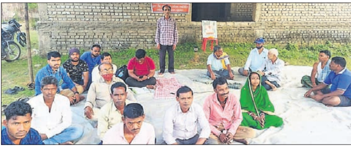
ବରା ବୁକ୍ ବାଉଁଶିଆ ପଞ୍ଚାୟତର ଲୋକେ ଭୋଟ ବର୍ଜନ କରିଛନ୍ତି ।