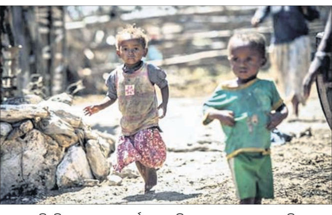
ବାଖଲ କରିଛନ୍ତି । ମହାରାଷ୍ଟ୍ରରେ ସର୍ବାଧିକ ୪,୯୫୨ ଶିଶୁ ରାସ୍ତାକଡ଼ରେ ବାସ କରୁଥିବା ରିପୋର୍ଟରେ ଦର୍ଶାଯାଇଛି । ସେହିପରି ଗୁଜରାଟରେ ୧,୯୯୦, ତାମିଲନାଡୁରେ ୧,୭୦୩, ଦିଲ୍ଲୀରେ ୧,୬୫୩ ଏବଂ ମଧ୍ୟପ୍ରଦେଶରେ ୧,୪୯୨

ଦେଶର ୧୭,୯୧୪ ଶିଶୁ ରାସ୍ତାକଡ଼ରେ ଜୀବନ ବିତାଉଛନ୍ତି । ସେମାନଙ୍କ ମୁଖ ଉପରେ ନା ଅଛି ଛାତ ନା ବାସ କରିବା ପାଇଁ ଅଛି ଉପଯୁକ୍ତ ସ୍ଥାନ । ଏହି ଶିଶୁଙ୍କ ପାଇଁ ରାସ୍ତାକଡ଼ ପାଲଟିଛି ଉଦୟ ଘର ଆଉ ଖେଳ ପଡ଼ିଆ । ଫଳରେ ରାସ୍ତାରେ ହିଁ ହଜିଯାଉଛି ଏହି ବାସସହା ଶିଶୁଙ୍କ ଶିଶୁବ । ଜାତୀୟ ଶିଶୁ ସୁରକ୍ଷା ଅଧିକାର ଆୟୋଗ (ଏନ୍ସିପିଆର୍କ) କି ସମ୍ପର୍କରେ ଏହି ତଥ୍ୟ ସାମ୍ବାଦିତ ହୋଇଛି । ରାସ୍ତାକଡ଼ରେ ବାସ କରୁଥିବା ଶିଶୁଙ୍କ ସ୍ଥିତି ସମାକ୍ଷା ପାଇଁ ଗତ ଜାନୁୟାରୀ ୧୭ରେ ସୁପ୍ରିମକୋର୍ଟ ଏନ୍ସିପିଆର୍କ ନିର୍ଦ୍ଦେଶ ଦେଇଥିଲେ । ସର୍ବୋଚ୍ଚ ଅଦାଲତଙ୍କ ନିର୍ଦ୍ଦେଶକ୍ରମେ ବାସସହୀନ ଶିଶୁଙ୍କ ସମ୍ପର୍କରେ କୋର୍ଟରେ ଏନ୍ସିପିଆର୍କ ରିପୋର୍ଟ