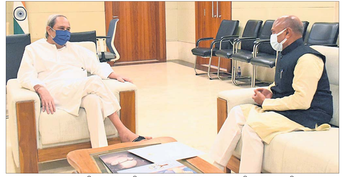
କେନ୍ଦ୍ର ଇସ୍ପାତ ମନ୍ତ୍ରୀ ରାମଚନ୍ଦ୍ର ପ୍ରସାଦ ସିଂ ଗୁରୁବାର ନବୀନ ନିବାସଠାରେ ମୁଖ୍ୟମନ୍ତ୍ରୀ ନବୀନ ପଟ୍ଟନାୟକଙ୍କୁ ଭେଟି ଆଲୋଚନା କରୁଛନ୍ତି।