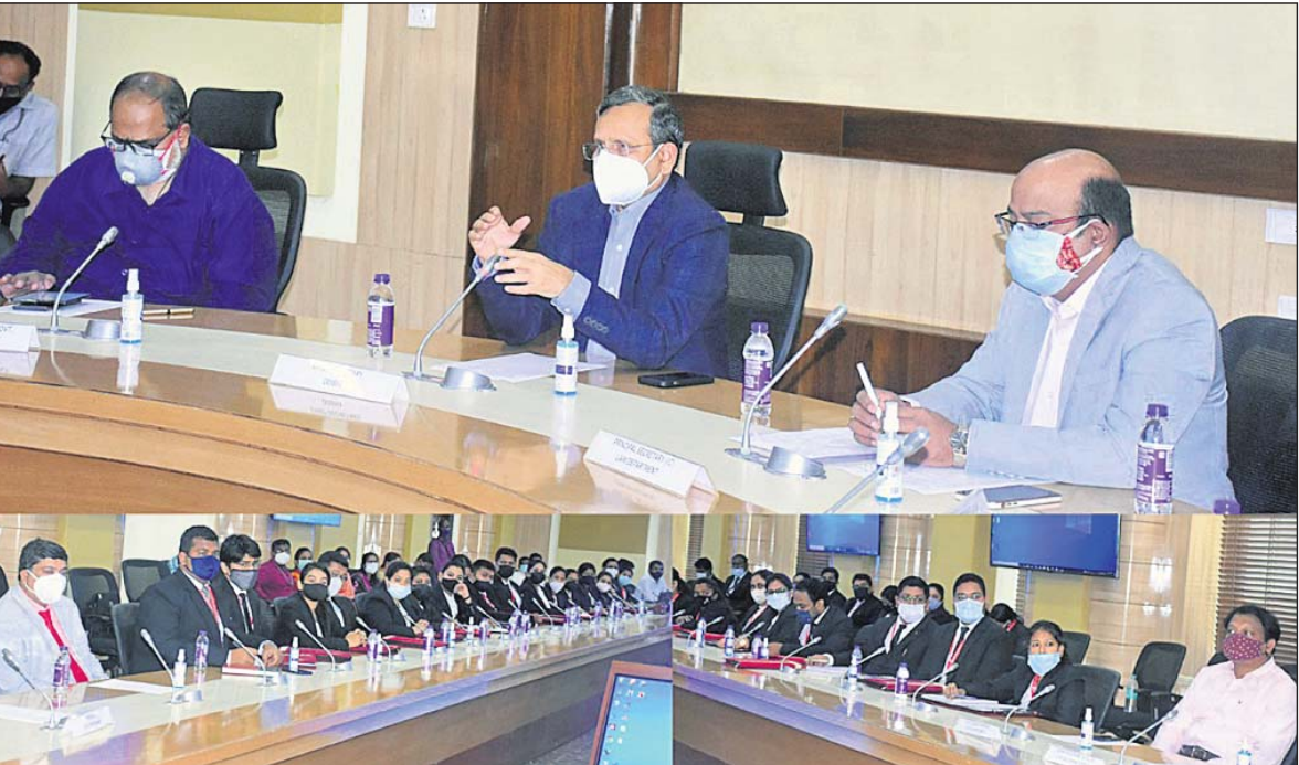
ଭୁବନେଶ୍ୱର, ୨୪୧୨ (ବୁଧବାର)

ନ୍ୟାୟିକ ସେବା ଶିକ୍ଷାନବିକାଙ୍କ ଦିନିକିଆ ଲୋକସେବା ଭବନ ପରିଦର୍ଶନ