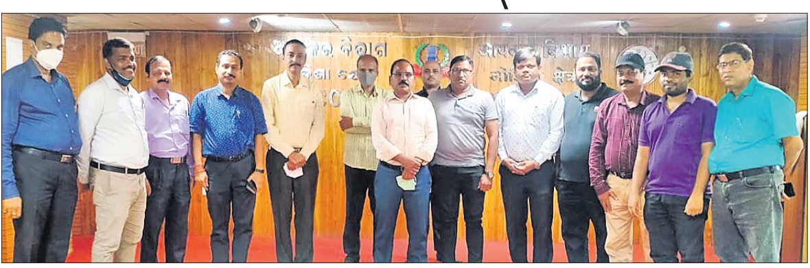
ଅତିଥିଙ୍କ ସହ ମନୋନୀତ ଓଡ଼ିଶା ଖେଳାଳି ।

ଭୁବନେଶ୍ୱର, ୨୪।୨ (କ୍ରୀଡ଼ା ପ୍ରତିନିଧି): ଦିଲ୍ଲୀର ଛତ୍ରସାଲ ଷ୍ଟାଡିୟମରେ ମାର୍ଚ୍ଚ ୧୦ରୁ ୧୬ ପର୍ଯ୍ୟନ୍ତ ହେବାକୁଥିବା ସର୍ବଭାରତୀୟ ସିଭିଲ୍ ସର୍ଭିସ୍ ଚେମ୍ପିୟନସ୍ହିପରେ ଓଡ଼ିଶାର ୬ ଖେଳାଳି ଅଂଶଗ୍ରହଣ କରିବେ । ଏହି ଖେଳାଳିମାନେ ନିଜ ନିଜ