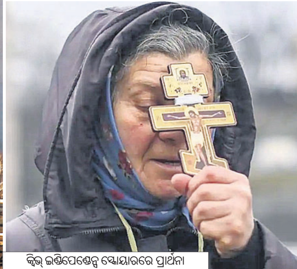
କିଛି ଲକ୍ଷ୍ମିପେଟେରୁ ଷ୍ଟୋଲ୍‌ରେ ପ୍ରାର୍ଥନା କରୁଛନ୍ତି ଶାନ୍ତିକାମୀ ମହିଳା ।

ନଭେମ୍ବରରେ କୁହୁଳିଥିବା ୟୁକ୍ରେନ୍ ସମ୍ବନ୍ଧରେ ଧୂଆଁ ଏବେ ଭୟାବହ ଯୁଦ୍ଧର ରୂପ ନେଇଛି। କୌଣସି କୃତନୈତିକ ଆଲୋଚନା କିମ୍ବା ଆମେରିକା-ପାଶ୍ଚାତ୍ୟ କଟକଣା ରୁଷିଆକୁ ୟୁକ୍ରେନ୍ ଉପରେ ଆକ୍ରମଣରୁ ଅଟକାଇ ପାରିନାହିଁ। ୟୁକ୍ରେନ୍ ଭିତରେ ପଶି ରୁଷିଆ ଧ୍ୱଂସନାକାମ ରଖିବାବେଳେ ଉଭୟ ପକ୍ଷର ଶତାଧିକ ସୈନ୍ୟ ନିହତ ହୋଇଛନ୍ତି। ଅନେକ ଯୁଦ୍ଧବାହନ ନଷ୍ଟ ହୋଇଛି; ବୁଲିଗୋଲା, ବୋମା ବର୍ଷଣ କାରିରହିଛି। ୟୁକ୍ରେନ୍‌ବାସୀ ଆତଙ୍କିତ ହୋଇ ପ୍ରାଣ ବିକଳରେ ଏଣେତେଣେ ପଳାୟନ କରୁଛନ୍ତି। ଦ୍ୱିତୀୟ ବିଶ୍ୱଯୁଦ୍ଧ ପରେ ୟୁରୋପ ଆଗରେ ଏହା ହେଉଛି ସବୁଠାରୁ ବଡ଼ ଚ୍ୟାଲେଞ୍ଜ, ଯାହାକୁ କେହି କେହି ତୃତୀୟ ବିଶ୍ୱଯୁଦ୍ଧର ପଦଧ୍ୱନି ଆଖ୍ୟା ଦେଉଛନ୍ତି।