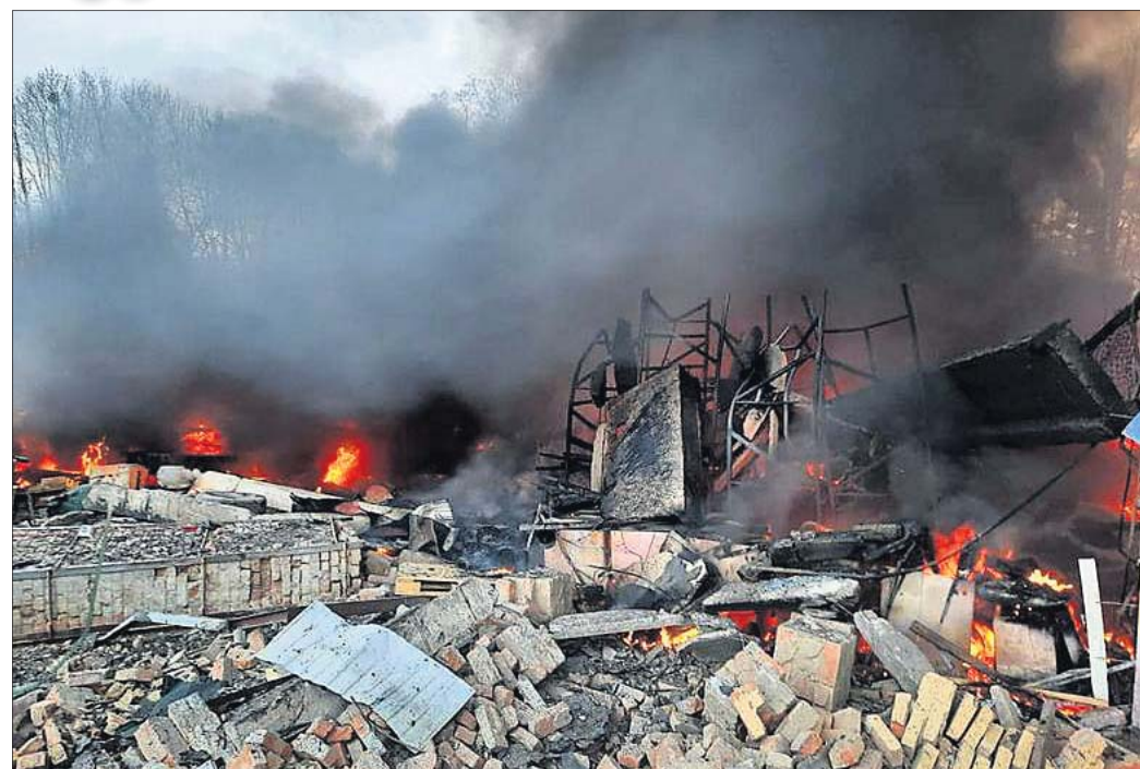
ରୁଷିଆର କ୍ଷେପଣାସ୍ତ୍ର ମାଡ଼ରେ କିଭ୍‌ସ୍ଥିତ ଯୁଦ୍ଧେନ୍‌ ଷ୍ଟେଟ୍ ବର୍ଡର ଗାର୍ଡ ସର୍ଭିସ୍ ଶିବିର କଳିପୋଡ଼ି ଛାରଖାର ହୋଇଯାଇଛି।