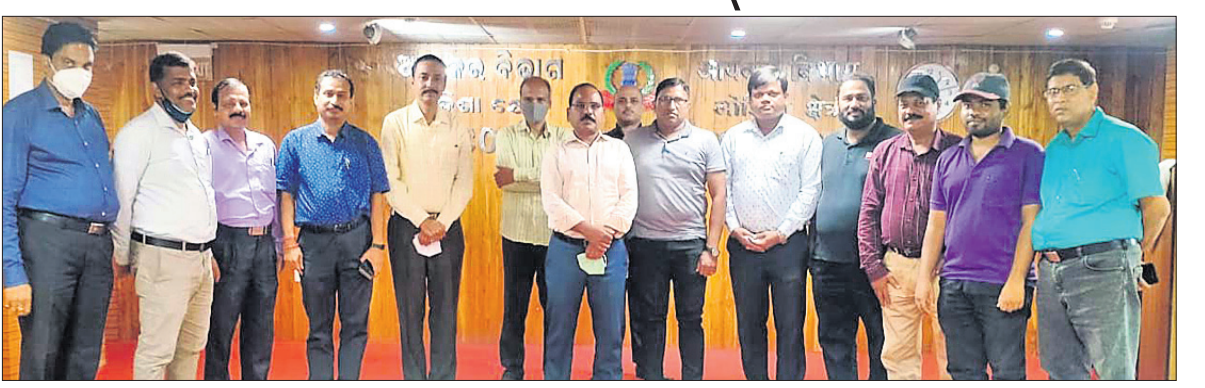
ଅତିଥିଙ୍କ ସହ ମନୋନୀତ ଓଡ଼ିଶା ଖେଳାଳି ।

ଭୁବନେଶ୍ଵର, ୨୪/୧୯ (କ୍ରୀଡ଼ା ପ୍ରତିନିଧି): ଦିଲ୍ଲୀର ଛତ୍ରସାଳ ଷ୍ଟାଡ଼ିୟମରେ ମାର୍ଚ୍ଚ ୧୦ରୁ ୧୭ ପର୍ଯ୍ୟନ୍ତ ହେବାକୁଥିବା ସର୍ବଭାରତୀୟ ସିଭିଲ୍ ସର୍ଭିସ୍ ଚେସ୍ ଚୁନିମେଣ୍ଟରେ ଓଡ଼ିଶାର ୬ ଖେଳାଳି ଅଂଶଗ୍ରହଣ କରିବେ। ଏହି ଖେଳାଳିମାନେ ନିଜ ନିଜ