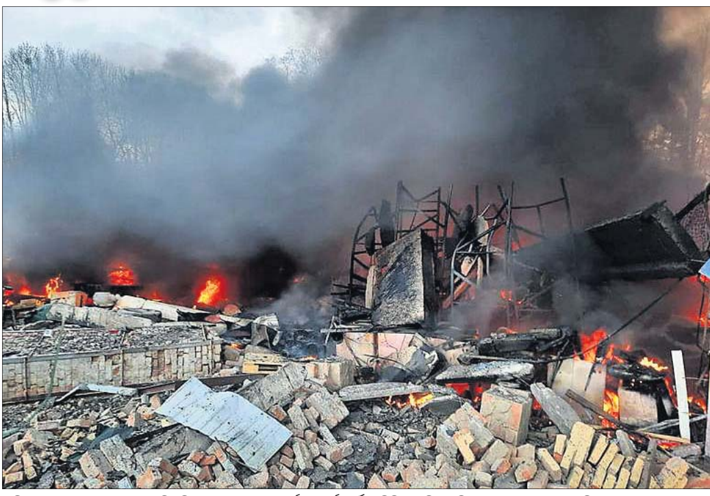
ରୁଷିଆର କ୍ଷେପଗାସ୍ତ୍ର ମାଡ଼ରେ କିଭୁରୁ ଯୁକ୍ରେନ୍ ସେନ୍ଦ୍ର ବର୍ତ୍ତର ଗାଡ଼ି ସର୍ବିସ୍ ଶିବର କଳିପୋଡ଼ି ଛାରଖାର ହୋଇଯାଇଛି।