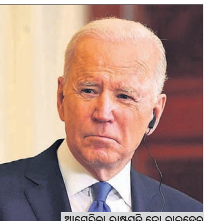
ଆମେରିକା ରାଷ୍ଟ୍ରପତି ଜୋ ବାଇଡେନ୍