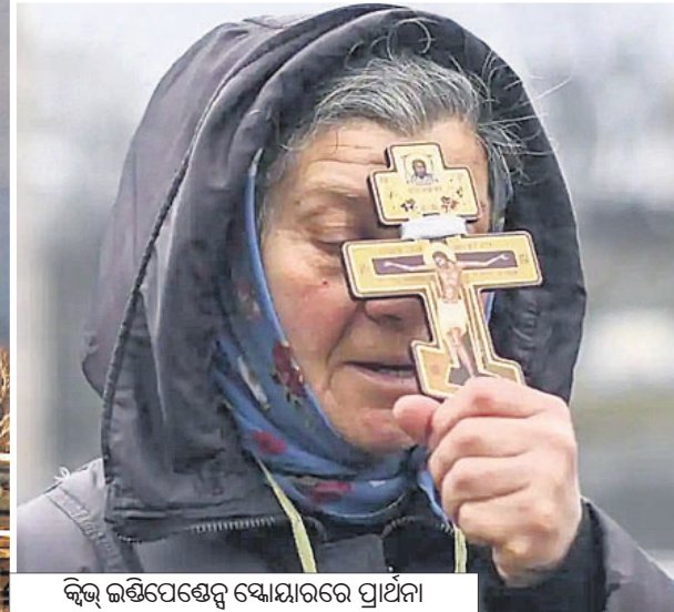
କିଛି ଲକ୍ଷ୍ମିପେଟେରୁ ଷୋୟାରରେ ପ୍ରାର୍ଥନା କରୁଛନ୍ତି ଶାନ୍ତିକାମୀ ମହିଳା ।

ନଭେମ୍ବରରେ କୁହୁଳିଥିବା ଯୁଦ୍ଧେନ୍ ସଙ୍କଟର ଧୂଆଁ ଏବେ ଭୟାବହ ଯୁଦ୍ଧର ରୂପ ନେଇଛି। କୌଣସି କୃତନୈତିକ ଆଲୋଚନା କିମ୍ବା ଆମେରିକା-ପାଶ୍ଚାତ୍ୟ କଟକଣା ରୁଷିଆକୁ ଯୁଦ୍ଧେନ୍ ଉପରେ ଆକ୍ରମଣରୁ ଅଟକାଇ ପାରିନାହିଁ। ଯୁଦ୍ଧେନ୍ ଭିତରେ ପଶି ରୁଷିଆ ଧ୍ୱଂସନାକାମ ରଖିବାବେଳେ ଉଭୟ ପକ୍ଷର ଶତାଧିକ ସୈନ୍ୟ ନିହତ ହୋଇଛନ୍ତି। ଅନେକ ଯୁଦ୍ଧବାହନ ନଷ୍ଟ ହୋଇଛି; ବୁଲିଗୋଲା, ବୋମା ବର୍ଷଣ କାରିରହିଛି। ଯୁଦ୍ଧେନ୍‌ବାସୀ ଆତଙ୍କିତ ହୋଇ ପ୍ରାଣ ବିକଳରେ ଏଣେତେଣେ ପଳାୟନ କରୁଛନ୍ତି। ଦ୍ୱିତୀୟ ବିଶ୍ୱଯୁଦ୍ଧ ପରେ ଯୁରୋପ ଆଗରେ ଏହା ହେଉଛି ସବୁଠୁ ବଡ଼ ଚ୍ୟାଲେଞ୍ଜ, ଯାହାକୁ କେହି କେହି ତୃତୀୟ ବିଶ୍ୱଯୁଦ୍ଧର ପଦଧ୍ୱନି ଆଖ୍ୟା ଦେଉଛନ୍ତି।