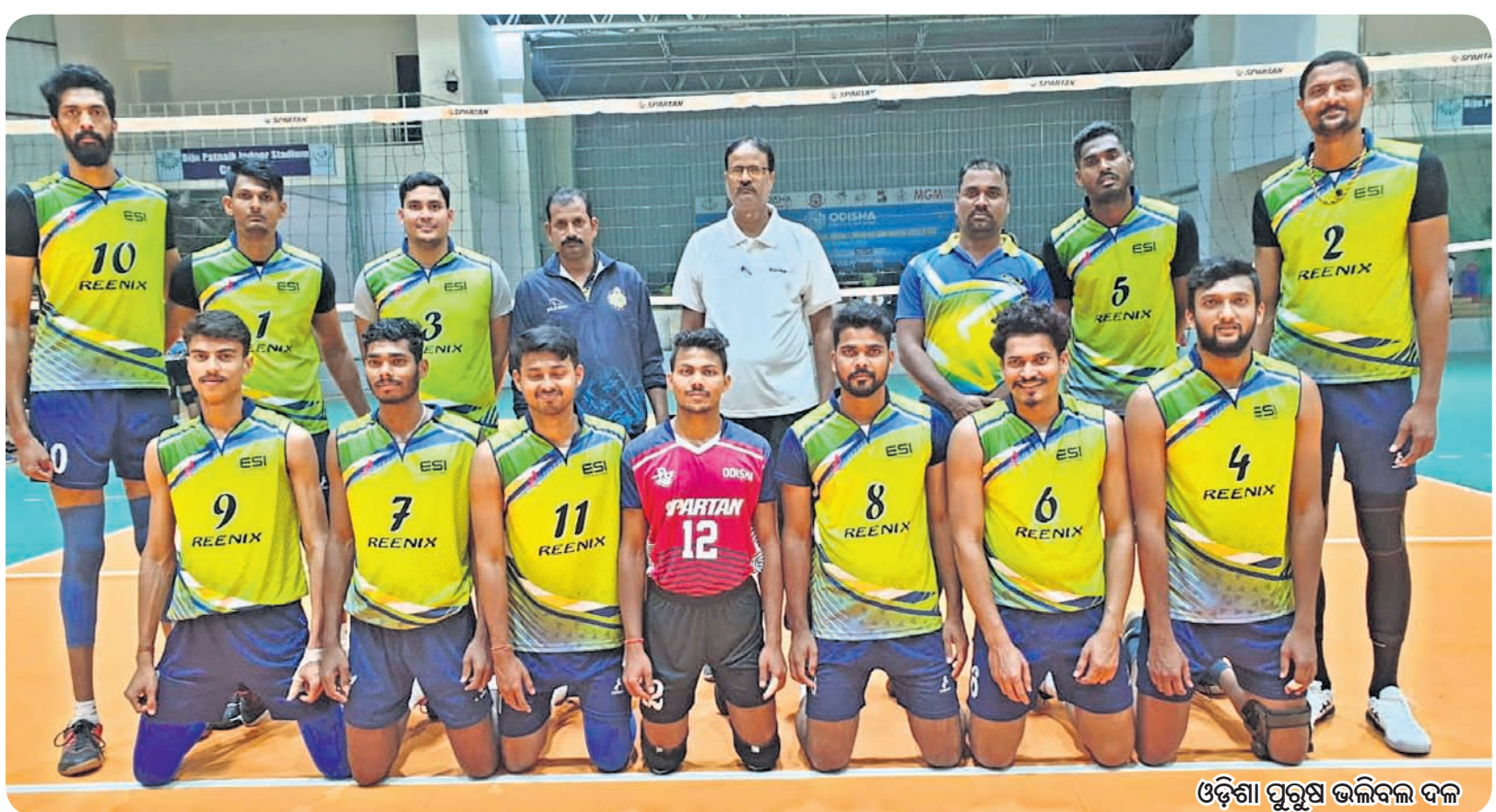
ଓଡ଼ିଶା ପୁରୁଷ ଭଲିବଲ ଦଳ