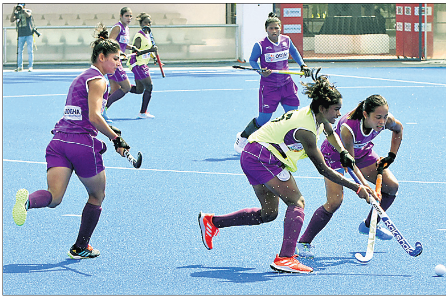
କଳିଙ୍ଗ ଷ୍ଟାଡିୟମରେ ରୁକୁବାର ଭାରତୀୟ ମହିଳା ହକି ଦଳର ଅଭ୍ୟାସ।