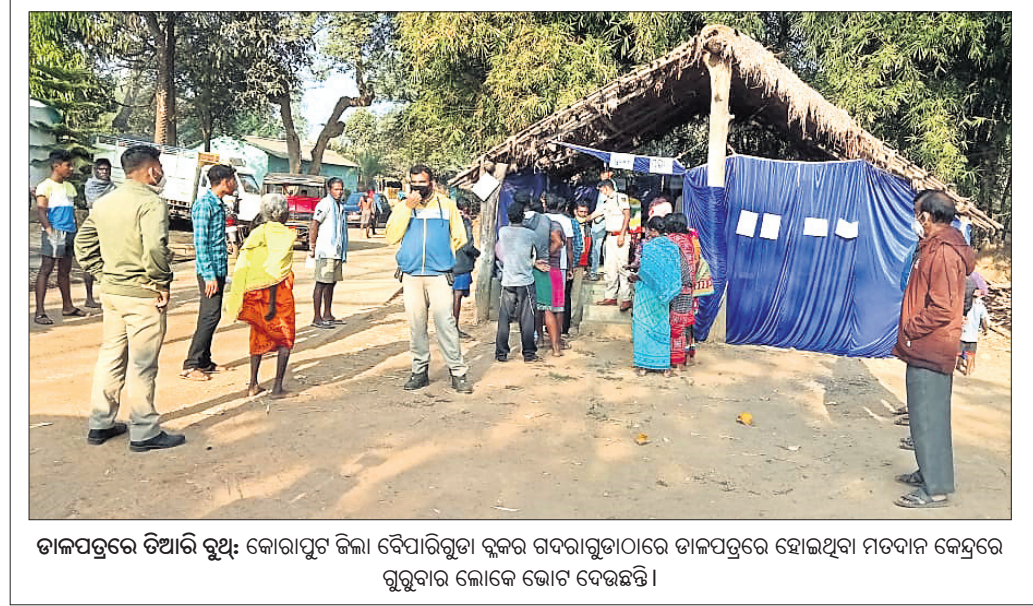
ତାଳପତ୍ରରେ ତିଆରି ବୁଝୁ: କୋରାପୁଟ ଜିଲ୍ଲା ବୈପାରିଗୁଡ଼ା ବ୍ଲକର ଗବରାଗୁଡ଼ାଠାରେ ତାଳପତ୍ରରେ ହୋଇଥିବା ମତଦାନ କେନ୍ଦ୍ରରେ ଗୁରୁବାର ଲୋକେ ଭୋଟ ଦେଉଛନ୍ତି ।