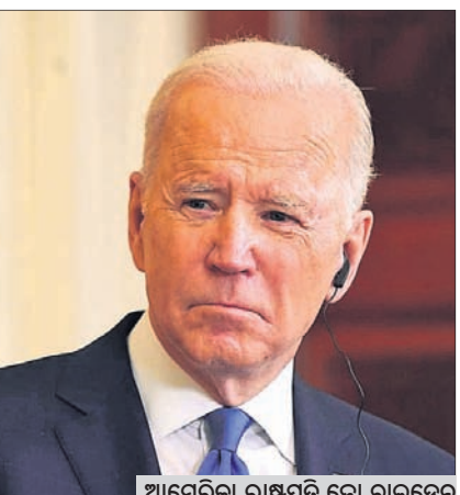
ଆମେରିକା ରାଷ୍ଟ୍ରପତି ଜୋ ବାଇଡେନ୍

ପୁଖପାତ୍ର ହୁଅ। ପୁଟିନ୍‌ଙ୍କ ମତବ୍ୟରୁ ବାରି ହେଉଛି। ହୁଆ କହିଛନ୍ତି, ରୁଷିଆର ପଦକ୍ଷେପକୁ ଆକ୍ରମଣ ଭାବେ ଅଭିହିତ କରା ନ ଯାଉ। ଉଭୟ ପକ୍ଷ ସଂଯମତା ରକ୍ଷା କରନ୍ତୁ। ସମସ୍ତ ଘଟଣା ଉପରେ ବାଜନା ନକର ରଖି। ପ୍ରତିରକ୍ଷା ଓ ବହିର୍ଦ୍ୱ୍ୟାପାର ବିଶେଷଜ୍ଞଙ୍କ ମତରେ ଆମେରିକା ଚାହିଁଥିଲେ ବିଶ୍ୱର ୧ ନମ୍ବର ରାଷ୍ଟ୍ର ଭାବେ ନିଜର ଉତ୍ତରଦାୟିତ୍ୱ ବୁଲାଇବାକୁ ଯାଇ ଯୁଦ୍ଧ ରୋକିପାରିଥାନ୍ତା। ଶକ୍ତିଶାଳୀ ପୁଟିନ୍‌ଙ୍କ ସେନା ଚୋନେନ୍‌ସ ଓ ଲୁହାନ୍‌ସ୍‌ସ ବଖଳ ପରେ ଆଗକୁ କେଉଁଆଡ଼କୁ ପୂର୍ଣ୍ଣାଙ୍ଗବେ ଶଶାପତ୍ନୁନାହିଁ। ତେଣୁ ଯୁରୋପୀୟ ସଂଘ(ଇୟୁ) ଏବଂ ନାଟୋର ତମାମ କୃତନୈତିକ ଉଦ୍ୟମ ବିଫଳ ହୋଇଥିବା ସଦ୍ୟ ଘଟଣାକ୍ରମ ସୂଚାଉଛି।