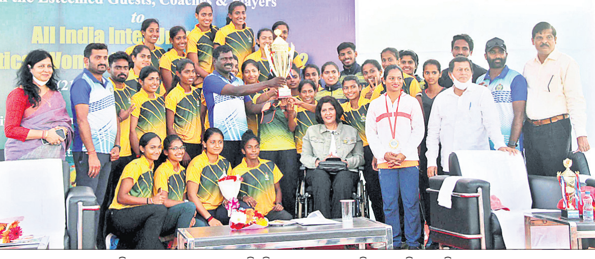
ଦଳଗତ ଚାମ୍ପିୟନ ହୋଇଥିବା ମାଙ୍ଗାଲୋର ବିଶ୍ୱବିଦ୍ୟାଳୟ ଦଳର ଖେଳାଳିମାନେ ଟ୍ରଫି ସହ ଅତିଥିଙ୍କ ଗହଣରେ ।

ଭୁବନେଶ୍ୱର, ୨୪।୨ (କ୍ରୀଡ଼ା ପ୍ରତିନିଧି): କିର୍ ବିଶ୍ୱବିଦ୍ୟାଳୟ ପରିସରରେ ୮୧ତମ ସର୍ବଭାରତୀୟ ଆନ୍ତର୍ଜାତୀୟ ବିଶ୍ୱବିଦ୍ୟାଳୟ ମହିଳା ଆଧିକାରିକ ଚାମ୍ପିୟନଶିପ୍ ଗୁରୁବାର ଉଦ୍‌ଘାଟିତ ହୋଇଛି । ଭାରତୀୟ ବିଶ୍ୱବିଦ୍ୟାଳୟ ସଂଘର ପ୍ରତ୍ୟକ୍ଷ ତତ୍ତ୍ୱାବଧାନ, କିର୍