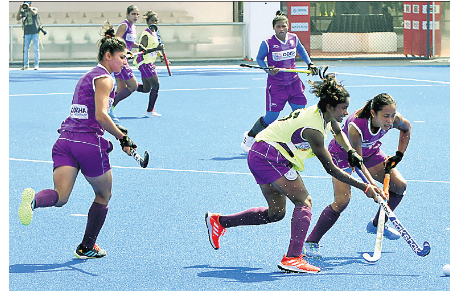
କଳିଙ୍ଗ ଷ୍ଟାଡିୟମରେ ଚୁରୁବାର ଭାରତୀୟ ମହିଳା ହକି ଦଳର ଅଭ୍ୟାସ ।