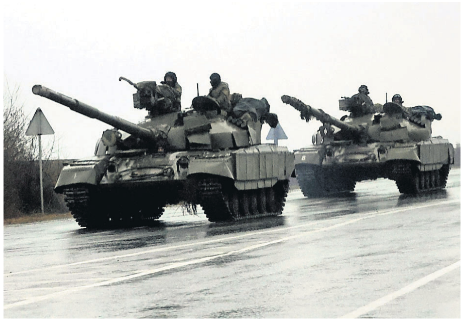
ପୂର୍ବ ୟୁକ୍ରେନର ଖରକିଭ୍ ଅଞ୍ଚଳରେ ପାଟ୍ରୋଲିଂ କରୁଛନ୍ତି ସଶସ୍ତ୍ର ୟୁକ୍ରେନ ସୈନ୍ୟ ।