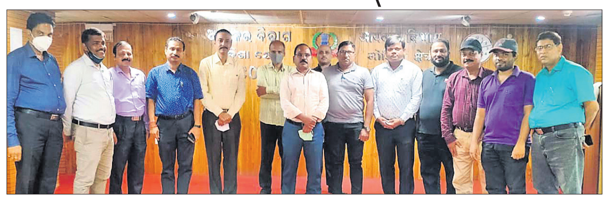
ଅତିଥିଙ୍କ ସହ ମନୋନୀତ ଓଡ଼ିଶା ଖେଳାଳି ।

ଭୁବନେଶ୍ୱର, ୨୪।୨ (କ୍ରୀଡ଼ା ପ୍ରତିନିଧି): ଦିଲ୍ଲୀର ଛତ୍ରସାଲ ଷ୍ଟାଡିୟମରେ ମାର୍ଚ୍ଚ ୧୦ରୁ ୧୬ ପର୍ଯ୍ୟନ୍ତ ହେବାକୁଥିବା ସର୍ବଭାରତୀୟ ସିଭିଲ୍ ସର୍ଭିସ୍ ଚେମ୍ପିୟନ୍‌ସରେ ଓଡ଼ିଶାର ୬ ଖେଳାଳି ଅଂଶଗ୍ରହଣ କରିବେ । ଏହି ଖେଳାଳିମାନେ ନିଜ ନିଜ