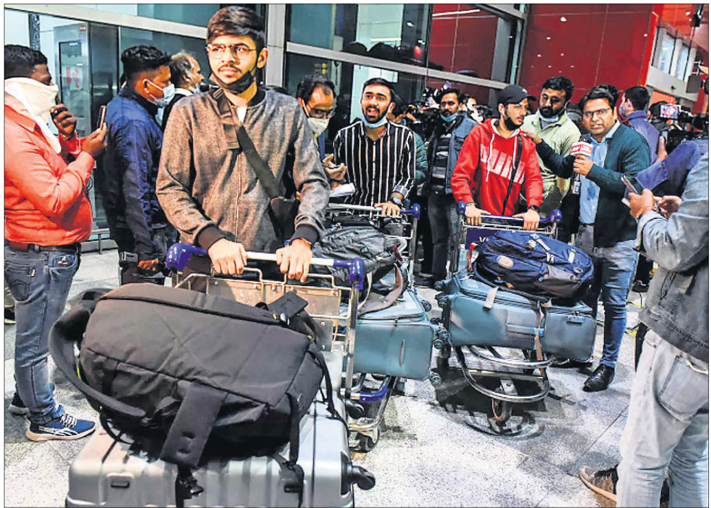
କିଭୁ ବିମାନବନ୍ଦରରେ ଭାରତୀୟ

ପଠାଯାଇଥିବାବେଳେ ଫୁକ୍ରେନରେ ଏୟାରବେସ୍ ବନ୍ଦ ହେବାର କାରଣକୁ ଖାଲି ବାମାନ ଭାରତ ଫେରିଆସିଥିଲା । ବିମାନ ଏଥିସହ ଦୂତାବାସ ସହ ସମ୍ପର୍କ ସ୍ଥାପନ କରୁଥିବା ହୋଇପଡ଼ିଛି ।