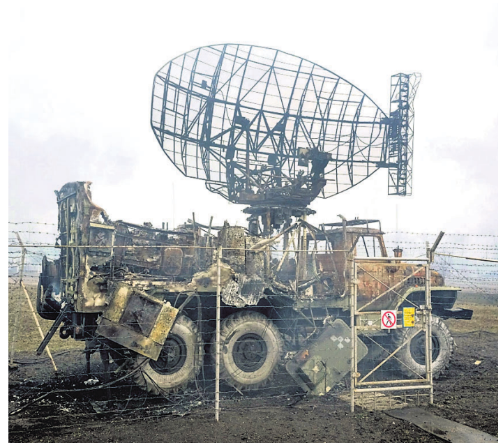
ରୁଷିଆ ଆକ୍ରମଣରେ ଧସ୍ତୁରିଥିବା ୟୁକ୍ରେନର ମାରିଉପୋଲସ୍ଥିତ ସେନା ଶିବିରର ରାତାର ସିଦ୍ଧି ।