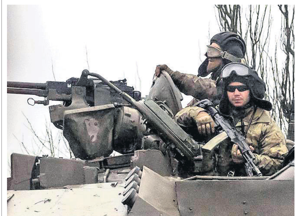
ରୁଷିଆ ରାଷ୍ଟ୍ରପତି ଭୁଟିନିର ପୁତ୍ର ସାମରିକ ଅଭିଯାନ ପାଇଁ ନିର୍ଦ୍ଦେଶ ଦେବା ପରେ ମାରିଉପୋଲ ସହରରେ ପ୍ରତିରକ୍ଷା ଲାଗି ୟୁକ୍ରେନ୍ ସେନାର ଯୁଦ୍ଧ ବ୍ୟାଙ୍କ ।