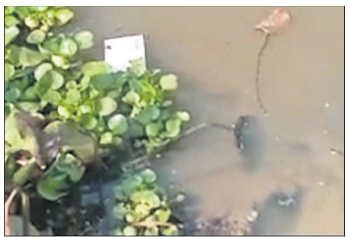
ହେମସାଗର ନଦୀରେ ଫିଙ୍ଗାଯାଇଥିବା ଭୋଟ ବାକ୍ସ ।

ରାଜ୍ୟରେ ତ୍ରିପୁରାୟ ପଞ୍ଚାୟତ ନିର୍ବାଚନର ଶେଷ ପର୍ଯ୍ୟାୟ ମତଦାନ ଗୁରୁବାର ହୋଇଯାଇଛି । ହେଲେ ପୂର୍ବ ପର୍ଯ୍ୟାୟ ନିର୍ବାଚନ ଭଳି ଏଥର ମଧ୍ୟ ମତଦାନ ସମୟରେ ବିଭିନ୍ନ ସ୍ଥାନରେ ରାଜନୈତିକ ହିଂସାକାଣ୍ଡ ଘଟିଛି । ଏପରି କି ବୁଝୁଗୁଡ଼ିକରେ ଭୋଟରମାନେ ଭୋଟ ଦେଉଥିବା ବେଳେ କେତେକ ଗୁରୁତ୍ୱପୂର୍ଣ୍ଣ ପଣି ଭୋଟ ବାକ୍ସରେ ପାଣି ଢାଳିଦେଇଥିବା ବେଳେ ଅନ୍ୟ କେଉଁଠି ଭୋଟବାକ୍ସକୁ ନେଇ ନିକଟସ୍ଥ ନଦୀରେ ଫିଙ୍ଗିଦେଇଛନ୍ତି । ଏଭଳି ହିଂସାମୁକ୍ତ ଘଟଣା କଟକ ଜିଲ୍ଲା ନିଆଳି ବ୍ଲକର ୩ଟି ପଞ୍ଚାୟତରେ ଦେଖିବାକୁ ମିଳିଛି । ନିଆଳି ବ୍ଲକର ୨୩ଟି ପଞ୍ଚାୟତରେ ୧୨, ୩୩, ୪୧୬ ଜଣ ଭୋଟର ରହିଛନ୍ତି । ୨୦, ୨୧, ୨୨, ୨୩ ନଂ. ୪ ଜିଲ୍ଲା ପରିଷଦ କୋନ୍ଡେର ୧୬ଜଣ ପ୍ରାର୍ଥୀ ଓ ୨୩ ପଞ୍ଚାୟତରେ ୮୩ ସରପଞ୍ଚ ପ୍ରାର୍ଥୀ ଓ ୬୨ ସମିତିସଭା ପ୍ରାର୍ଥୀ ପ୍ରତିଦ୍ୱନ୍ଦ୍ୱିତା କରୁଥିଲେ । ଗୁରୁବାର ନିର୍ଦ୍ଧାରିତ ସମୟରେ ଭୋଟ ଆରମ୍ଭ ହୋଇଥିବାବେଳେ