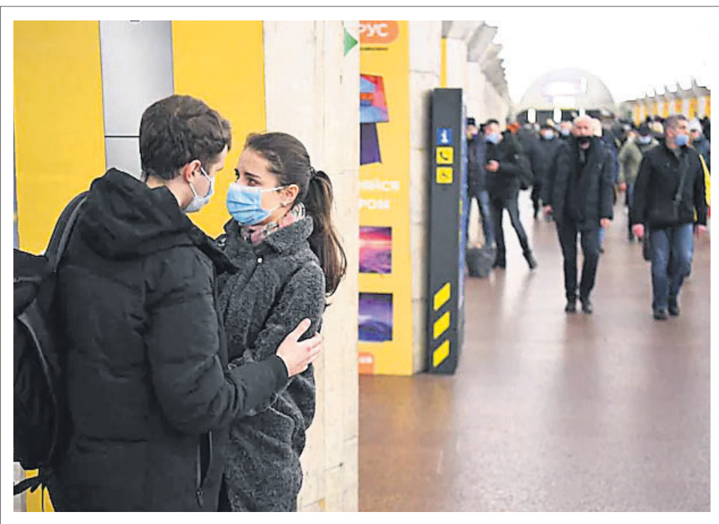
ପୁଟିନ୍ ଯୁଦ୍ଧେନ୍ ଆକ୍ରମଣ ପାଇଁ ନିର୍ଦ୍ଦେଶ ଦେବା ମାତ୍ରେ ଏସଫୁପିର ଜଣେ ଫତୋଗ୍ରାଫର ଏହି ଫଟୋ ଉଠାଇଥିଲେ। କିଭିତ୍ତି ଏକ ମେଟ୍ରୋ ଷ୍ଟେସନରେ ପଳାୟନ ପାଇଁ ଟ୍ରେନ୍‌କୁ ଅପେକ୍ଷା କରିଥିବା ଏହି ଯୋଡ଼ିକ ଫଟୋ ସୋସିଆଲ ମିଡ଼ିଆରେ ବହୁଳ ପ୍ରସାରିତ ହୋଇଛି। ଏହା ହେଉଛି ଯୁଦ୍ଧେନ୍‌ରେ ଅନିଶ୍ଚିତତା ମଧ୍ୟରେ ନାଗରିକଙ୍କ ପ୍ରତ୍ୟାହାର ମର୍ମବର୍ଣ୍ଣା ଚିତ୍ର।