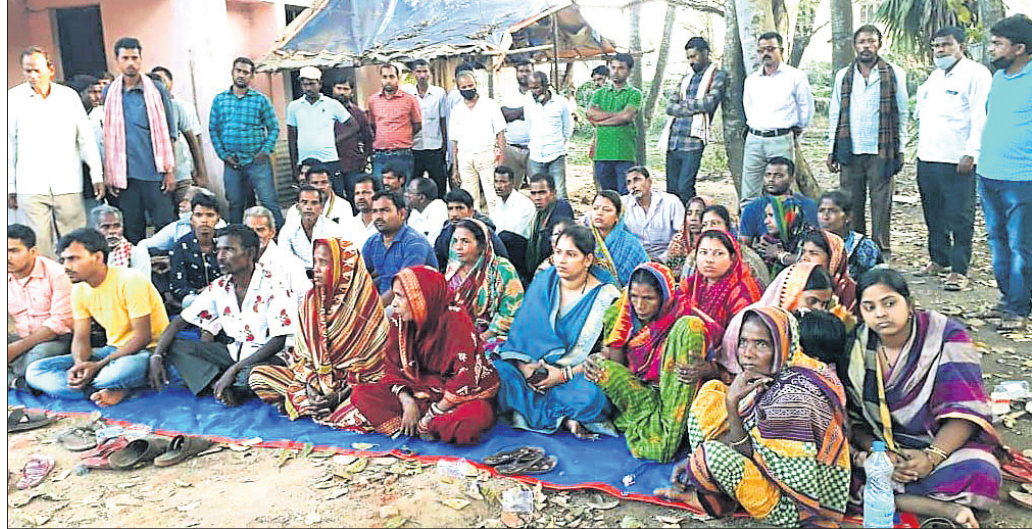
ଧୂସରୀ ବଜାରଠାରେ ଭାଜପା କର୍ମୀଙ୍କ ରାସ୍ତାରେକୋ ।

ଭଦ୍ରକ ଜିଲ୍ଲା ଧାମନଗର ବ୍ଲକରେ ଗୁରୁବାର ମତଦାନ ବେଳେ କେତେକ ବୁଝୁରେ ରିଟିଂ କରାଯାଇଥିବା ଅଭିଯୋଗ ହୋଇଛି । ଏପରିକି କିଛି ବୁଝୁରେ ଏହାକୁ ନେଇ ଭୁଲଗୋଷ୍ଠୀ ମଧ୍ୟରେ ମାର୍ଯ୍ୟ ହେଇଛି । ପ୍ରକାଶ ଯେ, ଅନୁନପୁର ପଞ୍ଚାୟତର ୩, ୪, ୮ ନଂ. ବୁଝୁରେ ସରପଞ୍ଚ ପ୍ରାର୍ଥୀଙ୍କ ଏକେଷ ଓ ପ୍ରକାଶିତ ଅଫିସରଙ୍କୁ ଆକ୍ରମଣ ସହ ପୋଲିସ ସମ୍ମୁଖରେ ରିଟିଂ କରାଯାଇଥିବା ଅଭିଯୋଗ ହୋଇଛି । ରିପୋଲିଂ ଦାବିରେ ଭାଜପା ସମର୍ଥକ କର୍ମୀମାନେ ଧୂସରୀ ବଜାର ଉପରେ ରାସ୍ତାରେକୋ କରିଥିଲେ । ପୋଲିଂ ଏକେଷଙ୍କ ସହଯୋଗୀମାନେ ମଧ୍ୟ ପ୍ରତି ଆକ୍ରମଣ କରିଛନ୍ତି । ଭୁଲଗୋଷ୍ଠୀ ମଧ୍ୟରେ ସଂଘର୍ଷ ଘଟି ଉତ୍ତମଭାଗରେ ୧୦ଜଣ ଆହତ ହୋଇଛନ୍ତି । ସେହିପରି କଟକାହିଁ ବିଡ଼ିଂକୁ ପୂଜ୍ଞ କରିବା ପାଇଁ କର୍ମୀମାନଙ୍କ ନିକଟରେ ଭାଜପା ଦାବି କରିଛି ।