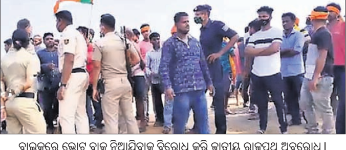
ବାଇକ୍ସରେ ଭୋଟ ବାକ୍ସ ନିଆଯିବାକୁ ବିରୋଧ କରି ଜାତୀୟ ରାଜପଥ ଅବରୋଧ ।

କରିଥିଲେ । ରାସ୍ତାରେକୋ କରିଥିଲେ । ରିଟିଂ କରିବା ଅଭିଯୋଗରେ ତୁରନ୍ତ ଭାଜପା ସମର୍ଥକ ସରପଞ୍ଚ ପ୍ରାର୍ଥୀଙ୍କୁ ଗିରଫ ପାଇଁ ଦାବି କରିଥିଲେ । ୪୮ ଘଣ୍ଟା ମଧ୍ୟରେ ଆକ୍ରମଣକାରୀଙ୍କୁ ଗିରଫ କରାଯିବ ବୋଲି ପୋଲିସ ପ୍ରତିଶ୍ରୁତି ଦେବା ପରେ ରାତିରେ ରାସ୍ତାରେକୋ ହଟିଥିଲା । ସେହିଭଳି ଭଜସାହି, ବମକୁରା, କାଶିମପୁରରେ ଭୋଟ ଗ୍ରହଣ କେନ୍ଦ୍ର ବାହାରେ ମାର୍ଯ୍ୟ ହେଇଛି । ଧୂସରୀ ଓ ଧାମନଗର ଧାନା ପକ୍ଷରୁ ୧୧ ପ୍ଲାଟୁନ ଫୋର୍ସ ମୁତୟନ କରାଯାଇଛି । ରିପୋର୍ଟ ଲେଖା ହେବା ସୁଦ୍ଧା ଏହିସବୁ ବିଜେଡି ସମର୍ଥକମାନେ ଧାମନଗର ଧାନା