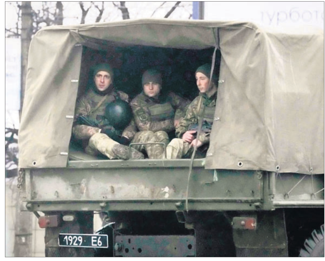
ମାରିଉପୋଲରେ ଯୁଦ୍ଧେନ୍ ସୈନ୍ୟଙ୍କ ପାଟ୍ରୋଲିଂ ।

ରୁଷିଆର ସାମରିକ ଆକ୍ରମଣକୁ ନିନ୍ଦା କରୁଛି। ଆନ୍ତର୍ଜାତିକ ଶାନ୍ତି ଓ ସ୍ଥିରତା ପ୍ରତି ଏହା ଏକ ଶକ୍ତ ସୂଚକ। - ରେସିସ୍ ଗାୟିସ୍ ଏର୍ଡୋଗାନ୍, ତୁର୍କୀ ରାଷ୍ଟ୍ରପତି