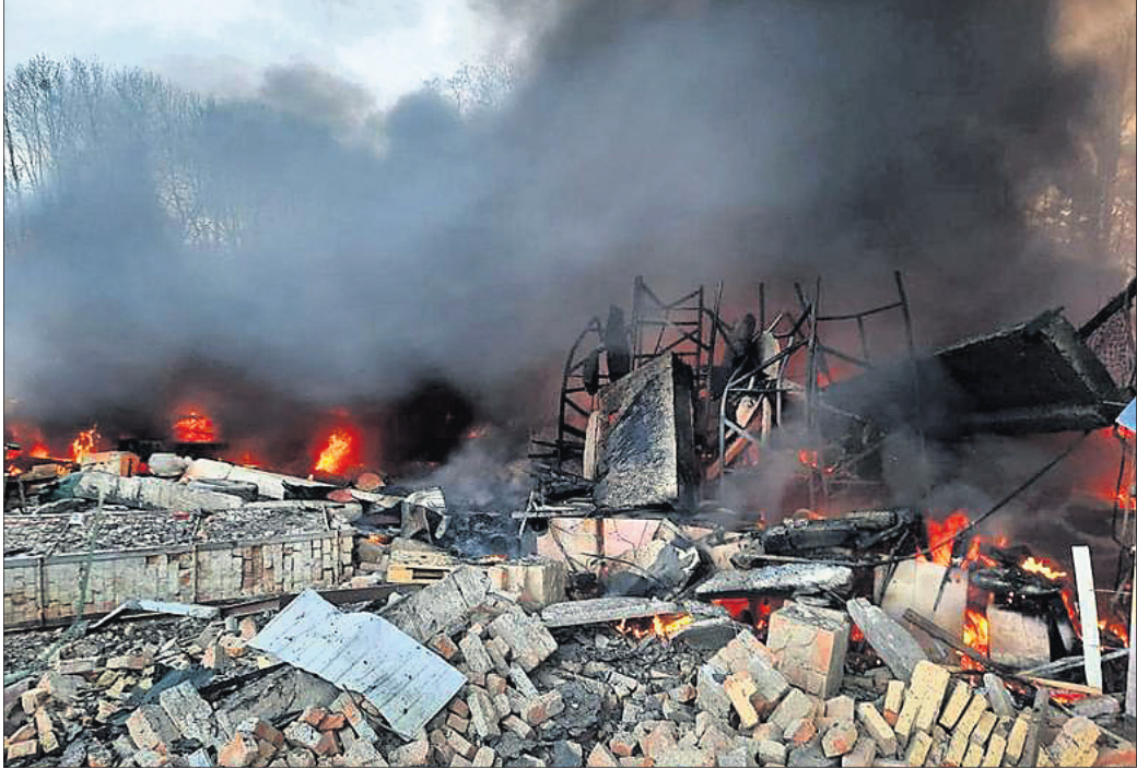
ରୁଷିଆର କ୍ଷେପଣାସ୍ତ୍ର ମାଡ଼ରେ କିଭ୍ରେ ୟୁକ୍ରେନ୍ ସ୍ଫେର୍ ବର୍ଡର ଗାର୍ଡ ସର୍ଭିସ୍ ଶିବିର କଳିପୋଡ଼ି ଛାରଖାର ହୋଇଯାଇଛି।

ଯାହା ଆଖିକା କରାଯାଉଥିଲା ତାହା ହେଲା। ଆମେରିକାର ଚେତାବନୀ ଓ ୟୁରୋପୀୟ ରାଷ୍ଟ୍ରଗୁଡ଼ିକର ଚାରିବକ୍ତୃତ୍ତ୍ୱ ଉପେକ୍ଷା ନ କରି ରୁଷିଆର ୟୁକ୍ରେନ୍ ଉପରେ ବଡ଼ ଧରଣର ଆକ୍ରମଣ କରିଛି ରୁଷିଆ। ରାଷ୍ଟ୍ରପତି ଭ୍ଲାଡିମିର ପୁଟିନ୍ଙ୍କ ନିର୍ଦ୍ଦେଶକ୍ରମେ ରୁଷିଆ ସୈନ୍ୟ ପଡ଼ୋଶୀ ୟୁକ୍ରେନ୍ରେ ଆକାଶମାର୍ଗରୁ ବୁହାକୁ ବୁହା ବୋମା ବର୍ଷା କରିଛନ୍ତି। ରୁଷିଆ ଆକ୍ରମଣରେ ୟୁକ୍ରେନ୍ ରାଜଧାନୀ କିଭ୍ ନିକଟସ୍ଥ ଆଇଭାନୋ-ଫ୍ରାଙ୍କିସ୍କ ଅନ୍ତର୍ଜାତୀୟ ବିମାନବନ୍ଦର ଓ ଅନ୍ୟ କେତେକ ଅଞ୍ଚଳ ଧ୍ୱସ୍ତବିଧ୍ୱସ୍ତ ହୋଇଯାଇଛି। ୟୁକ୍ରେନ୍ରେ ଆତଙ୍କର ବାତାବରଣ ଦୃଷ୍ଟି ହୋଇଥିବାବେଳେ କିଭ୍ ମଧ୍ୟ ଆତରଣୀୟ ପାଇଁ କବାବ ଦେଇଛି। ଏଥିରେ ଉଭୟ ପକ୍ଷଙ୍କ ଶତାଧିକ ସୈନ୍ୟ ମୃତାହତ ହୋଇଥିବା ଜଣାଯାଇଛି। ପୁଟିନ୍ଙ୍କ ଏହି ଘୃଷ୍ଣିକାହିନୀ ପଦକ୍ଷେପ ଭୂରାଜନୈତିକ ଘଟଣାକ୍ରମକୁ ବହୁଳ ଭାବେ ପ୍ରଭାବିତ କରିଛି। ରୁଷିଆର ଆକ୍ରମଣକୁ ଆମେରିକା ସମେତ ପାଶ୍ଚାତ୍ୟ ଦେଶଗୁଡ଼ିକ କଡ଼ା ନିନ୍ଦା କରିବା ସହ ଆଗକୁ ଆହୁରି କଠୋର କଚକଣା ଜାରି କରିବାକୁ ଚେତାବନୀ ଦେଇଛନ୍ତି। ଏଭଳି ସମୟରେ ଭାରତର ନିରପେକ୍ଷତା ନେଇ ୟୁକ୍ରେନ୍ ପ୍ରଶ୍ନ ଉଠାଇବା ସହ ପ୍ରଧାନମନ୍ତ୍ରୀ ନରେନ୍ଦ୍ର ମୋଦିଙ୍କ ହସ୍ତକ୍ଷେପ ଲୋଡ଼ିଛି। ମୋଦି