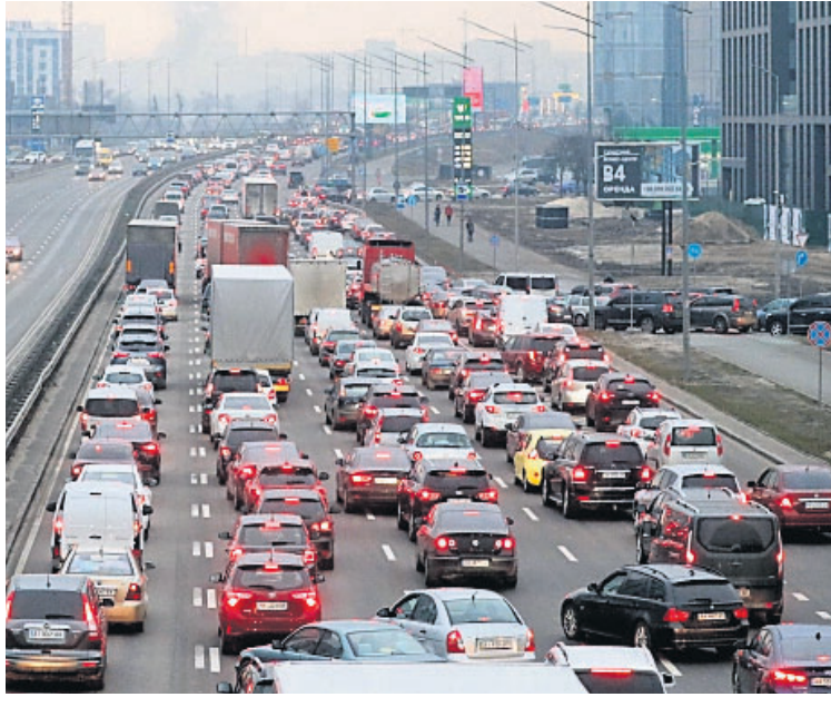
ଦିୱାରୁ ସ୍ଥାନୀୟ ଲୋକେ ପଳାୟନ ପାଇଁ ବାହାରିଥିବାବେଳେ ଭିଡରେ ଟ୍ରାଫିକ୍ ଜାମ୍ ।