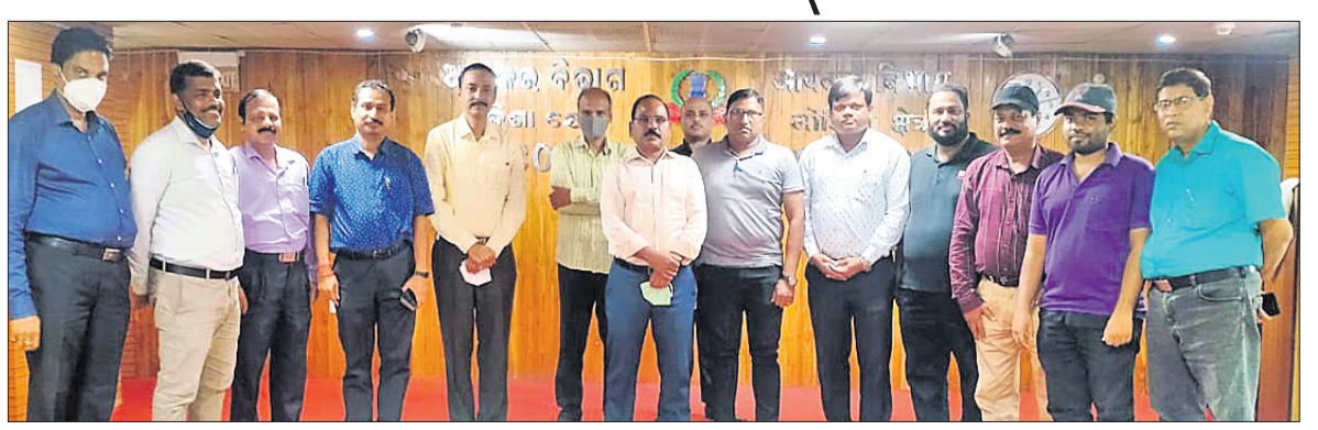
ଅତିଥିଙ୍କ ସହ ମନୋନୀତ ଓଡ଼ିଶା ଖେଳାଳି ।

ଭୁବନେଶ୍ୱର, ୨୪୧୨ (ଗ୍ରାହ୍ୟା ପ୍ରତିନିଧି): ଦିଲ୍ଲୀର ଛତ୍ରସାଲ ସ୍ମୃତିୟମ୍ରେ ମାର୍ଚ୍ଚ ୧୦ରୁ ୧୬ ପର୍ଯ୍ୟନ୍ତ ହେବାକୁଥିବା ସର୍ଭଭାରତୀୟ ସିଡିଲ ସର୍ଭସ ଚେସ୍ ରୁନିମେଣ୍ଟରେ ଓଡ଼ିଶାର ୬ ଖେଳାଳି ଅଂଶଗ୍ରହଣ କରିବେ । ଏହି ଖେଳାଳିମାନେ ନିଜ ନିଜ