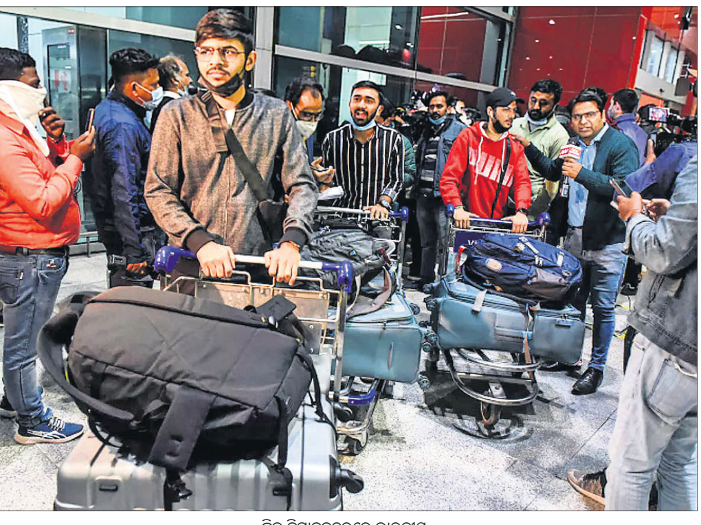
ଦିୱାରୁ ବିମାନବନ୍ଦରେ ଭାରତୀୟ

ପଠାଯାଇଥିବାବେଳେ ୟୁକ୍ରେନରେ ଏୟାରବେସ୍ ବନ୍ଦ ହେବର କାରଣରୁ ଖାଲି ବାମାନ ଭାରତ ଫେରିଆସିଥିଲା । ବିମାନ ଏଥିସହ ଦୂତାବାସ ସହ ସମ୍ପର୍କ ସ୍ଥାପନ କରୁଥିବା ହୋଇପାରିନାହିଁ । ୟୁକ୍ରେନରେ ଫସିଥିବା ୨୦ ହଜାର ଭାରତୀୟଙ୍କୁ ଉଦ୍ଧାର କରିବା ପାଇଁ କମିଶନାରି ବ୍ୟବସ୍ଥା କରାଯିବ ବୋଲି ବହିଷ୍କାର ପାଇଁ ମନୁଶାଲୟ ପକ୍ଷରୁ କୁହାଯାଇଛି । ତେବେ ଫସିଥିବା ଛାତ୍ରୀଛାତ୍ରୀଙ୍କୁ କଡ଼ାତ ଦେଇ ଭାରତ ଛାତ୍ରୀ ଆକାଶା କୁହାଯିବ ବୋଲି କହିଛନ୍ତି କେନ୍ଦ୍ର ସରକାର । ଯେଉଁ ଛାତ୍ରୀଛାତ୍ରୀକ ରହିବାରେ ଅସୁବିଧା ନାହିଁ ସେମାନଙ୍କ ପ୍ରତ୍ୟେକ ନିଜ ପାସପୋର୍ଟ ଏବଂ କମ୍ପ୍ୟୁଟର ଉପରେ ସାଥରେ ନେଇ ଯାତ୍ରା କରିବାକୁ ଦୂତାବାସ ପକ୍ଷରୁ କୁହାଯାଇଛି । ଯଦି ପବନର ଚୁକ୍ର ବେଗ କିମ୍ବା ବୋମା ଫୁଟିବା ଖ୍ରୀମ୍ କାରି ହୁଏ ତେବେ ସଙ୍ଗେସଙ୍ଗେ ନିକଟସ୍ଥ ବୋମା ମହାକୂପ ଥିବା ସ୍ଥାନକୁ ଚାଲିଯିବା ପାଇଁ ପରାମର୍ଶ ଦିଆଯାଇଛି ।