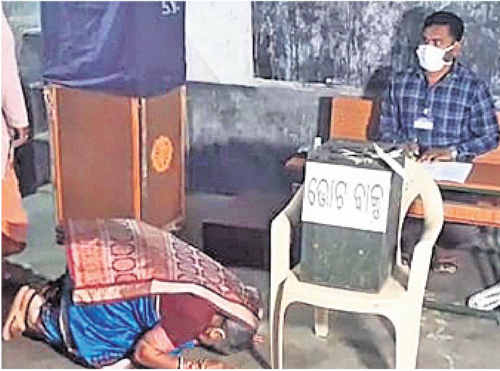
ଗଞ୍ଜାମ ଜିଲ୍ଲା ନଳଦଣ୍ଡ ପଞ୍ଚାୟତ ଚେରମାରିଆ ୧୫ ନମ୍ବର ବ୍ଲକ୍‌ରେ ଭୁବନେଶ୍ୱର ମତଦାନ ପରେ ଭୋଟବାକ୍ସକୁ ମୁଞ୍ଚିଆ ମାଲୁଆ ଆସିବା ଏବଂ ପ୍ରମାଣ ଦେଖାଯାଇଛି। (ରିପୋର୍ଟ: ପୃଷ୍ଠା-୨)