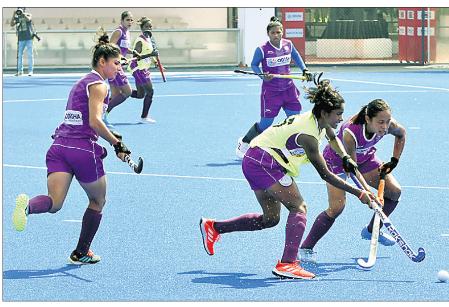
କଳିଙ୍ଗ ଷ୍ଟାଡିୟମରେ ଚୁରୁବାର ଭାରତୀୟ ମହିଳା ହକି ଦଳର ଅଭ୍ୟାସ।