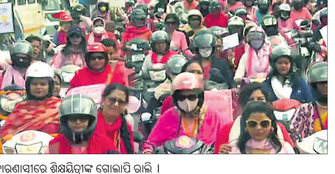
ବାରାଣାସୀରେ ଶିକ୍ଷୟିତ୍ରୀ ଗୋଲାପି ରାଲି ।

ମତଦାନ ପାଇଁ ଲୋକଙ୍କୁ ସଚକ୍ତ କରିବା ଉଦ୍ଦେଶ୍ୟରେ ଉତ୍ତର ପ୍ରଦେଶ ବାରାଣାସୀରେ ମହିଳାଙ୍କ ଦ୍ୱାରା 'ଗୋଲାପି ରାଲି' କରାଯାଇଛି । ଜିଲାର ବିଭିନ୍ନ ସ୍ଥଳରେ ଶିକ୍ଷୟିତ୍ରୀମାନେ ଏହି ରାଲିରେ ସାମିଲ ହୋଇଥିଲେ । ଶିକ୍ଷୟିତ୍ରୀମାନେ ଗୋଲାପି ରଙ୍ଗର ସୁନ୍ଦର ସାଙ୍କୁ ଗୋଲାପି ରଙ୍ଗର ଶାଢ଼ି ପିନ୍ଧି ଏହି ରାଲିରେ ଯୋଗ ଦେଇଥିଲେ ।