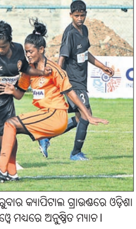
ଓଡ଼ିଶା ଓମେଟ୍ୱ ଲିଗ୍ରେ ରୁଦୁବାର କ୍ୟାପିଟାଲ ଗ୍ରାଉଣ୍ଡରେ ଓଡ଼ିଶା ପୋଲିସ ଓ ରେଲଓଡେ ମଧ୍ୟରେ ଅନୁଷ୍ଠିତ ମ୍ୟାଚ ।

ଭୁବନେଶ୍ୱର, ୨୪୧୨ (ଗ୍ରାହ୍ୟା ପ୍ରତିନିଧି) ଓଡ଼ିଶା ଓମେଟ୍ୱ ଲିଗ୍ (ଓଡିଏଲ୍) ପୁଡିବଲ୍ ରୁନିମେଣ୍ଟରେ ରୁଦୁବାର ୩ଟି ମଧ୍ୟାଠ ଅନୁଷ୍ଠିତ ହୋଇଛି । ଏଥିରେ ଓଡ଼ିଶା ପୋଲିସ, ସ୍ନୋର୍ଟ୍ ଓଡ଼ିଶା ଓ ଓଜିପି କ୍ଲବ୍ ବିଜୟ ହାସଲ କରିଛି । କ୍ୟାପିଟାଲ ଗ୍ରା । ଉ ଓ ରେ ଅନୁଷ୍ଠିତ ମ୍ୟାଚରେ ଓଡ଼ିଶା ପୋଲିସ ୪-୧ ଗୋଲରେ ଇଣ୍ଡିକୋଷ୍ଟ ରେଲଓଡେକୁ ପରାସ୍ତ କରିଛି । ଏହି ଗ୍ରାଉଣ୍ଡରେ ଆୟୋଜିତ ଅନ୍ୟ ଏକ ମ୍ୟାଚରେ ଓଜିପି ୨-୦ ଗୋଲରେ ରାଇଜିଂ ୟୁଥ୍ ଟେକ୍ସକୁ ହରାଇ ଦେଇଛି । କଳିଙ୍ଗ ୟୁଥ୍ ଟେକ୍ସ ମ୍ୟାଚରେ ସ୍ନୋର୍ଟ୍ ଓଡ଼ିଶା ୨-୧ ଗୋଲରେ ସାଲ ଏସ୍ପିଟିକ୍ସକୁ ହରାଇ ଦେଇଛି ।