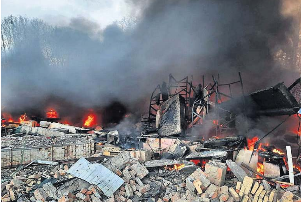
ରୁଷିଆର କ୍ଷେପଣାସୁ ମାଡ଼ରେ କିଭ୍ଝିତ ଯୁକ୍ତେନ୍ ଷ୍ଟେର୍ ବର୍ଡର ଗାର୍ଡ ସର୍ଭିସ୍ ଶିବର କଳିପୋଡ଼ି ଜାରଖାର ହୋଇଯାଇଛି।

ଚେତାବନୀ ଦେଇଛନ୍ତି। ଏଭଳି ସମୟରେ ଭାରତର ନିରପେକ୍ଷତାକୁ ନେଇ ଯୁକ୍ତେନ୍ ପ୍ରଶ୍ନ ଉଠାଇବା ସହ ପ୍ରଧାନମନ୍ତ୍ରୀ ନରେନ୍ଦ୍ର ମୋଦିଙ୍କ ହସ୍ତକ୍ଷେପ ଲୋଡ଼ିଛି। ମୋଦି