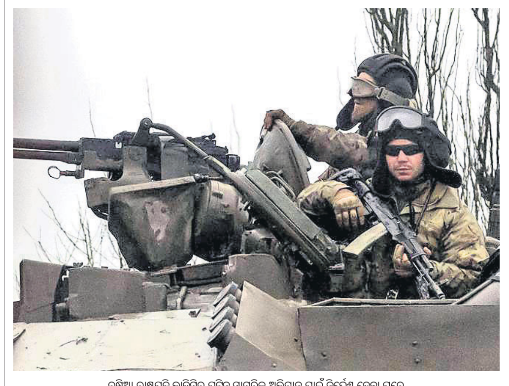
ରୁଷିଆ ରାଷ୍ଟ୍ରପତି ଭୁଦିମିର ପୁଟିନ୍ ସାମରିକ ଅଭିଯାନ ପାଇଁ ନିର୍ଦ୍ଦେଶ ଦେବା ପରେ ମାରିଉପୋଲ ସହରରେ ପ୍ରତିରକ୍ଷା ଲାଗି ୟୁକ୍ରେନ ସେନାର ଯୁଦ୍ଧ ବ୍ୟାଙ୍କ ।