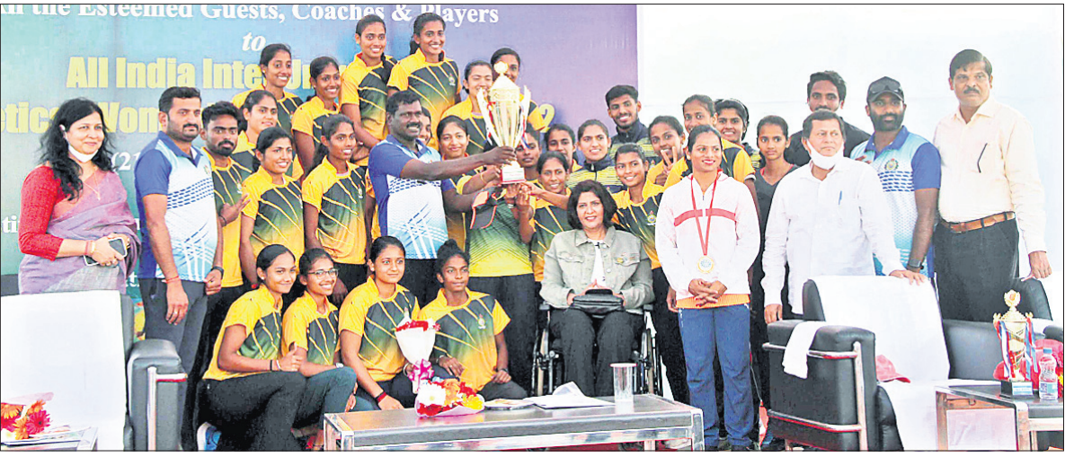
ଦକ୍ଷିଣତ ଚାମ୍ପିୟନ ହୋଇଥିବା ମାଙ୍ଗାଲୋର ବିଶ୍ୱବିଦ୍ୟାଳୟର ଡକ୍ଟର ଖେଳାଳିମାନେ ତୁ଼ି ସହ ଅତିଥିଙ୍କ ଗହଣରେ ।

ଭୁବନେଶ୍ୱର, ୨୪୧୨ (ଗ୍ରାହ୍ୟା ପ୍ରତିନିଧି): କି଼ ବିଶ୍ୱବିଦ୍ୟାଳୟ ପରିସରରେ ୮୧ତମ ସର୍ଭଭାରତୀୟ ଆନ୍ତର୍ଜାତୀୟ ବିଦ୍ୟାଳୟ ମହିଳା ଆଥିଲେଟିକ ଚାମ୍ପିୟନଶିପ୍ ରୁଦୁବାର ଉଦ୍ଘାଟିତ ହୋଇଛି । ଭାରତୀୟ ବିଶ୍ୱବିଦ୍ୟାଳୟ ସଂଘର ପ୍ରତ୍ୟକ୍ଷ ତତ୍ଵାବଧାନ, କି଼