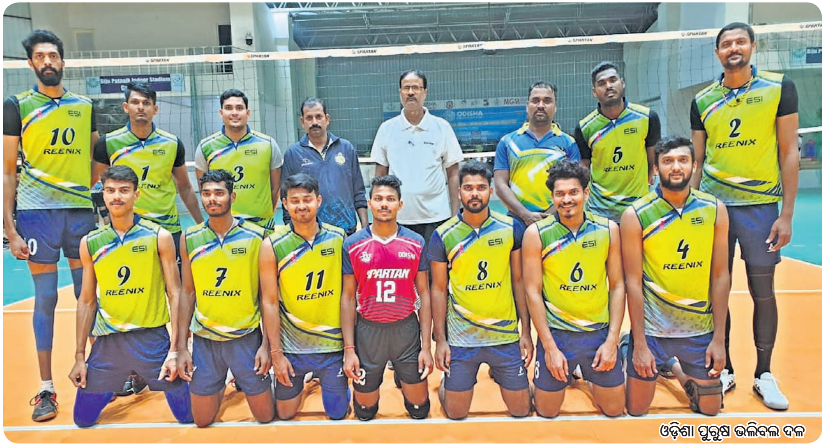
ଓଡ଼ିଶା ପୁରୁଷ ଭଲିବଲ ଦଳ