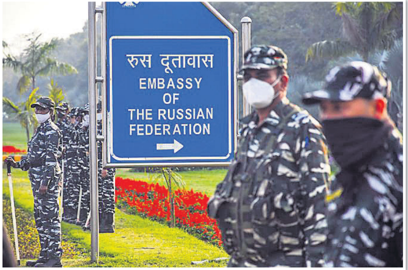
ନୂଆଦିଲ୍ଲୀସ୍ଥିତ ରୁଷିଆ ଦୂତାବାସ ବାହାରେ ରୁଷିୟ ସୁରକ୍ଷା ବଳଙ୍କ କଡ଼ା ପ୍ରହର।