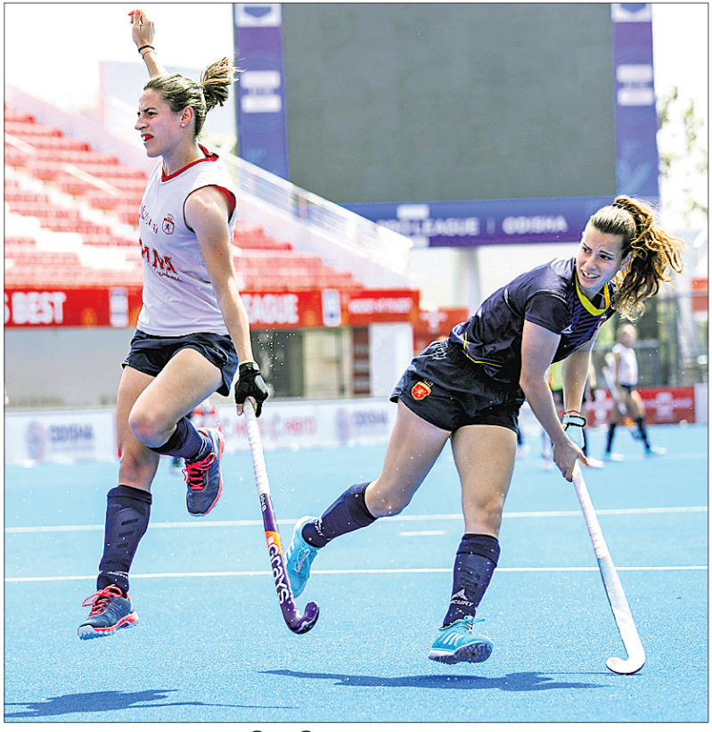
ଏଫଆଇଏଚ୍ ପ୍ରୋ ଲିଗ୍ ପାଇଁ କଳିଙ୍ଗ ଷ୍ଟାଡ଼ିୟମରେ ଶୁକ୍ରବାର ଭାରତୀୟ ପୁରୁଷ ଓ ସ୍ପେନ୍ ମହିଳା ହକି ଦଳର ଅଭ୍ୟାସ ।