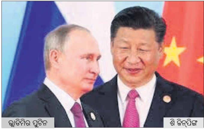
ଭୂତିମୂର୍ତ୍ତି ପୁଟିନ୍ ଶି ଜିନ୍‌ପିଙ୍ଗ

ବେକିଂ, ୨୫.୧: ଚାଇନା ରୁଷିଆକୁ ଖୋଲା ସମର୍ଥନ କରିଆସୁଥିଲା। ମୁଖ୍ୟ ଦ୍ୱାରା ମୁକ୍ତେନରେ ବ୍ୟାପକ ପରିବର୍ତ୍ତନ ଦେଖାଦେଇଛି। ଶୀତଳ ମୁଦ୍ଦର ମାନସିକତାକୁ ବର୍ତ୍ତନ କରି ମୁକ୍ତେନ ବାଦ୍ ଅନ୍ୟ ଦେଶଗୁଡ଼ିକ ସହ ସମ୍ପର୍କ ଓ ସେମାନଙ୍କ ସୁରକ୍ଷାକୁ ଫୋନ୍ ଯୋଗେ ମୁକ୍ତ ସମ୍ପର୍କରେ କଥା ହୋଇଛନ୍ତି। ଚାଇନା ଗଣମାଧ୍ୟମକୁ ମିଳିଥିବା ସୂଚନାମାନୁସାରେ ମୁକ୍ତେନ ସହ ବୁଝାମଣା କରି ଉପସ୍ଥିତ ବା ସମସ୍ୟାର ସମାଧାନ କରିବା ପାଇଁ ଜିନ୍‌ପିଙ୍ଗ ପରାମର୍ଶ ଦେଇଛନ୍ତି।