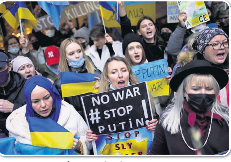
ତୁର୍କୀର ଇସ୍ତାନ୍ବୁଲସ୍ଥିତ ରୁଷିଆ କନସୁଲେଟ୍ ବାହାରେ ଯୁକ୍ରେନ୍ ସପକ୍ଷବାଦୀଙ୍କ ବିକ୍ଷୋଭ।