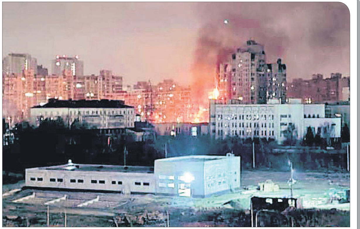
ସାଧାରଣ ଲୋକଙ୍କୁ ଟାର୍ଗେଟ୍ କରାଯିବ ନାହିଁ ବୋଲି କ୍ରେମ୍ଲିନ୍ ପକ୍ଷରୁ କୁହାଯାଇଥିବାବେଳେ ରୁଷିଆ ସୈନ୍ୟଙ୍କ ଆକ୍ରମଣରେ କିଭର କୋଠାଗୃହିକ ଜଳି ଉଠୁଛି। ଯୁକ୍ରେନ୍‌ବାସୀ ଏହାର ଫଟୋ ସୋସିଆଲ ମିଡିଆରେ ଶେୟାର କରିଛନ୍ତି।