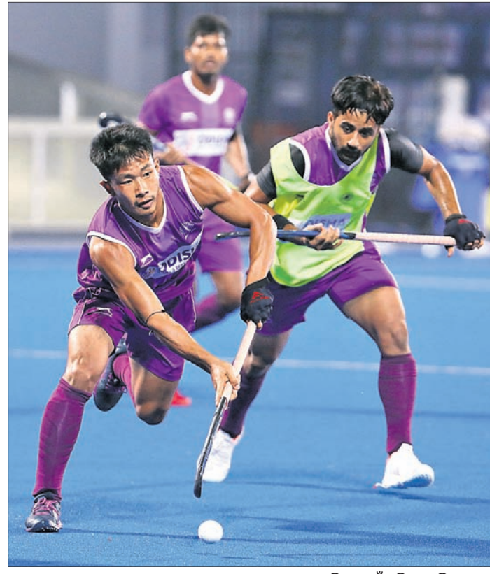
ଏଫଆଇଏଚ୍ ପ୍ରୋ ଲିଗ୍ ପାଇଁ କଳିଙ୍ଗ ଷ୍ଟାଡ଼ିୟମରେ ଶୁକ୍ରବାର ଭାରତୀୟ ପୁରୁଷ ଓ ସ୍ପେନ୍ ମହିଳା ହକି ଦଳର ଅଭ୍ୟାସ ।