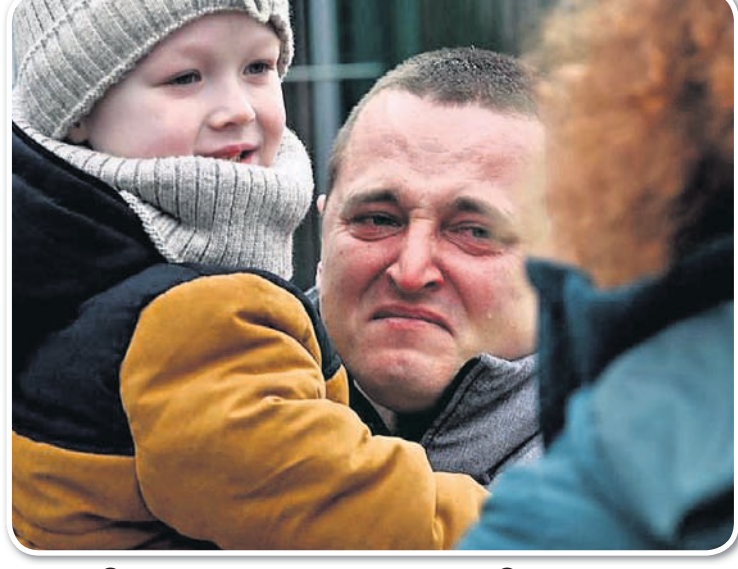
ରୁଷିଆ ସେନାର ଆକ୍ରମଣ ପରେ ଯୁକ୍ରେନ୍‌ରୁ ଯୋଗାଡ଼ିଆର ଉଦ୍‌ଲୋରେ ପହଞ୍ଚିଥିବା ଜଣେ ବ୍ୟକ୍ତି ନିଜ ଶିଶୁକୁ ଧରିଛନ୍ତି।