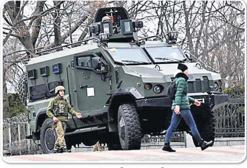
ୟୁକ୍ରେନ୍ ରାଜଧାନୀ କିଭ ରାସ୍ତାରେ ରୁଷିଆ ସୈନ୍ୟଙ୍କ ସହ ଯୁଦ୍ଧାସ୍ତ୍ର ଭର୍ତ୍ତି ଯାନ।