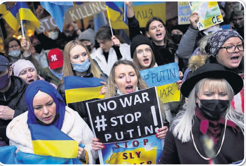
ତୁର୍କୀର ଇସ୍ତାନ୍ବୁଲସ୍ଥିତ ରୁଷିଆ କନସୁଲେଟ୍ ବାହାରେ ଯୁକ୍ରେନ୍ ସପକ୍ଷବାଦୀଙ୍କ ବିକ୍ଷୋଭ।