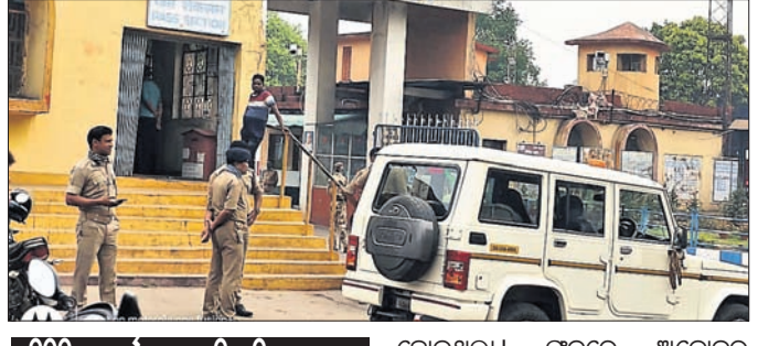
ଚିଟିପିଏସ୍ କର୍ମଚାରୀଙ୍କୁ ନିୟୁତ୍ତି, ରାଜସ୍ୱ ମରାମତି ଦାମରେ ଆୟୋଜନ ଚାକଚା

ଅନୁଗୋଳ ଜିଲ୍ଲା ତାଳଚେରରେ ଚାକଚେର ଅର୍ମାଲ ପାଞ୍ଚାୟତ (ଚିଟିପିଏସ୍)ର ଛତେଳ କର୍ମଚାରୀଙ୍କୁ ରୁଜୁର ନିୟୁତ୍ତି ଓ କଟକ-ସମ୍ବଲପୁର ୫୫୫୫୫ ଲୋଟ ଓ ପ୍ରଜାଳିତ ଅଫିସରଙ୍କୁ ନିୟୁତ୍ତି ଦିଆଯିବ।