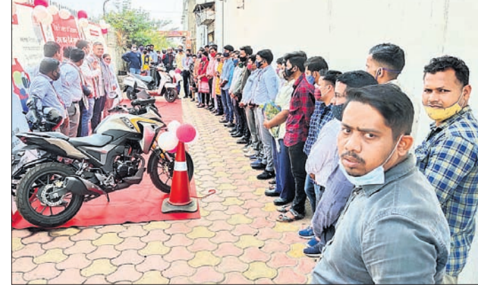
ସଚେତନତା କାର୍ଯ୍ୟକ୍ରମ ଅବସରରେ ଅତିଥି, କର୍ମକର୍ତ୍ତାଙ୍କ ସହ ଗ୍ରାହକମାନେ।

ଅନୁଗୋଳ ହୋଷ୍ଟା ମୋଟରଭାଜକେ ଏବଂ ସ୍ତ୍ରୀମାନଙ୍କୁ ଉପଯୁକ୍ତ ବିକ୍ରେତା ଲକ୍ଷ୍ମୀ ହୋଷ୍ଟାରେ ସଚେତନତା କାର୍ଯ୍ୟକ୍ରମ ଆରମ୍ଭ ହୋଇଛି।