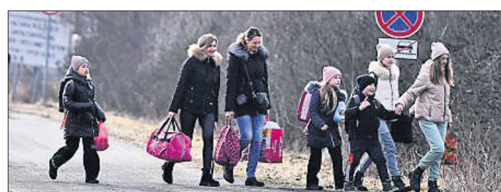
ୟୁଦ୍ଧ ଭୟରେ ୟୁକ୍ରେନର ଲୋକମାନେ ହଜ୍ଜେରି ସାମାନ୍ ପକାଇଯାଇଛନ୍ତି।

ରୁଷିଆର ୟୁକ୍ରେନ୍ ଆକ୍ରମଣ ଯୋଗୁଁ ଭାରତର ଗଭୀର ବୁଝାମଣା ରହିଛି। ଭାରତ ଓ ରୁଷିଆ ମଧ୍ୟରେ ସ୍ୱତନ୍ତ୍ର ଗଣନାତିକ ସହଯୋଗ ରହିଛି।