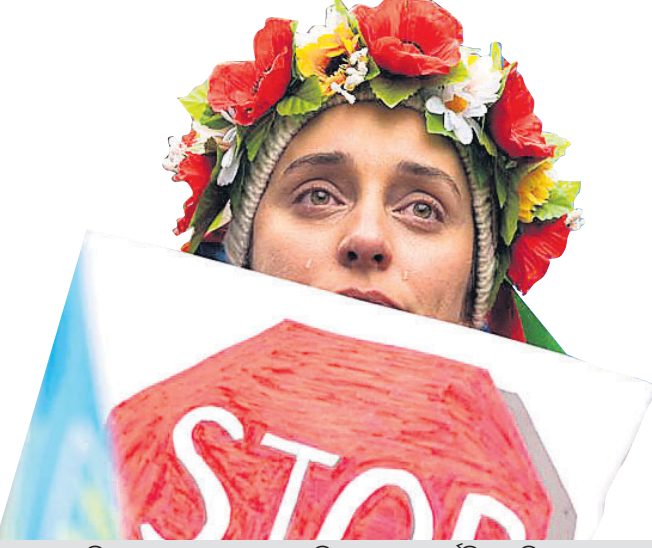
ରୁଷିଆର ଯୁକ୍ରେନ୍ ଆକ୍ରମଣ ପ୍ରତିବାଦରେ ନ୍ୟୁୟର୍କସ୍ଥିତ ଜାତିସଂଘ ପୃଷ୍ଠାକନ୍ଦ ବାହାରେ ବିକ୍ଷୋଭ ବେଳେ ଲେଖିକା କାଟେନା ବିଲିଆଭିଆ।