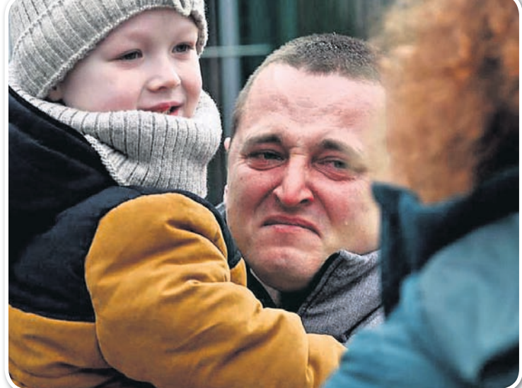
ରୁଷିଆ ସେନାର ଆକ୍ରମଣ ପରେ ଯୁକ୍ରେନ୍‌ରୁ ଘୋଡ଼ାକିଆର ଉଦ୍‌ଲୀରେ ପହଞ୍ଚିଥିବା ଜଣେ ବ୍ୟକ୍ତି ନିଜ ଶିଶୁକୁ ଧରିଛନ୍ତି।