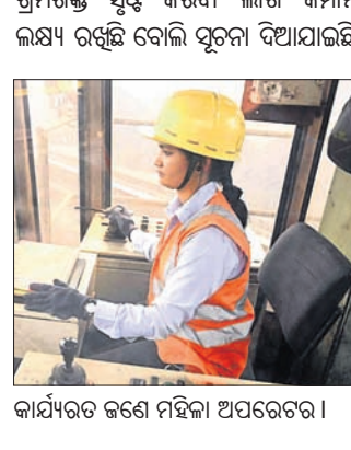
କାର୍ଯ୍ୟରତ ଜଣେ ମହିଳା ଅପରେଟର।

ଆବେଦନ ଖାରଜ, ୫ କୋଟି ଜରିମାନା ମୋଶାରି ଚଳାଇବାରେ ମହିଳା