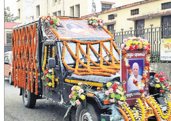
ଶୋଭାଯାତ୍ରାରେ ଅନୁଗୋଳରେ ପହଞ୍ଚିଥିବା ଦେବରାଜ ମରଣଗାର।

ଅନୁଗୋଳ ଜିଲ୍ଲାର ବର୍ଷାୟାନ କଂଗ୍ରେସ ନେତା ପୂର୍ବତନ ମନ୍ତ୍ରୀ ଦେବରାଜ ସାହୁଙ୍କ ବିୟୋଗରେ ଅନୁଗୋଳ ଜିଲ୍ଲା କଂଗ୍ରେସ କମିଟି ପକ୍ଷରୁ ଗଭୀର ଶୋକ ପ୍ରକାଶ କରାଯାଇଛି।