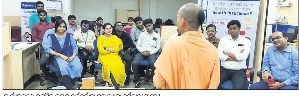
କାର୍ଯ୍ୟକ୍ରମରେ ଉପସ୍ଥିତ ଇତ୍ୟନ୍ କର୍ମକର୍ତ୍ତାଙ୍କ ସହ ବ୍ୟାଙ୍କ କର୍ମଚାରୀମାନେ।

ଅନୁଗୋଳ ଶାଖାରେ ରୁଜୁର 'ଲିଭ୍ ଗାଡ଼ା, ରିଭ୍ ଗାଡ଼ା' କାର୍ଯ୍ୟକ୍ରମ ଅନୁଷ୍ଠିତ ହୋଇପାରିଛି।