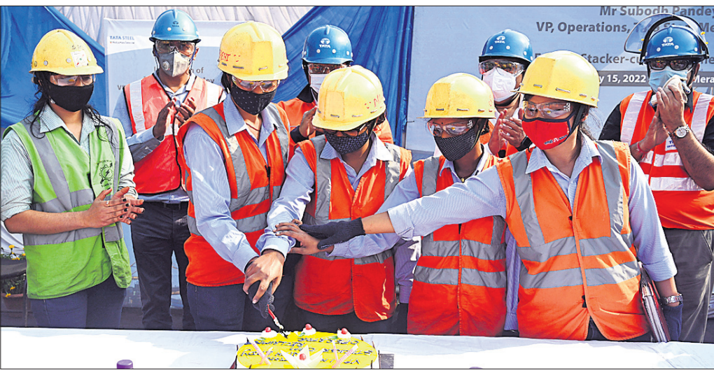
କମ୍ପାନୀରେ ନିଯୁକ୍ତ ପାଇଥିବା ମହିଳାମାନେ କେନ୍ଦ୍ର କାର୍ଯ୍ୟ ମନାଉଛନ୍ତି।