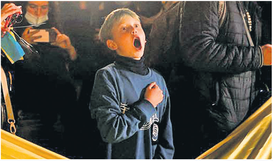
ସ୍ୱେନ୍‌ର ବାର୍ସିଲୋନାରେ ଯୁକ୍ରେନ୍‌ର ଜଣେ ଶରଣାର୍ଥୀଙ୍କ ପୁଅ ରୁଷିଆ ଆକ୍ରମଣକୁ ପ୍ରତିବାଦ କରି ନିଜ ଜାତୀୟ ସଙ୍ଗୀତ ଗାନ କରୁଛନ୍ତି।