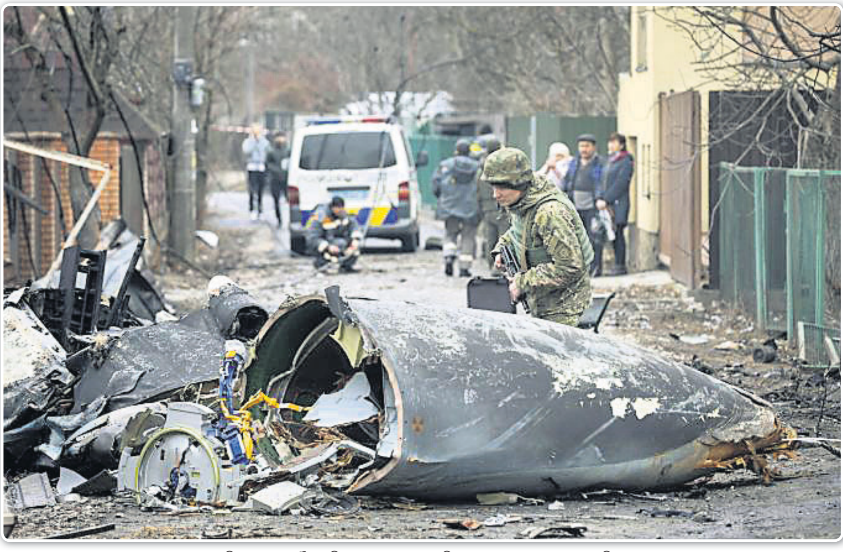
କିଭଳି ଯୁକ୍ରେନ୍ ସୈନ୍ୟ ରୁଷିଆ ବାୟୁସେନାର ଏକ ଯୁଦ୍ଧବିମାନର ଭଗ୍ନାବଶେଷକୁ ଅନୁଧ୍ୟାନ କରୁଛନ୍ତି।

ଲଗାତର ଦ୍ୱିତୀୟ ଦିନ ଧରି ଯୁକ୍ରେନ୍ ଉପରେ ଆକ୍ରମଣ ଜାରି ରଖିଛନ୍ତି ରୁଷିଆ। କେବଳ ପ୍ରତିପକ୍ଷ ସୈନ୍ୟ ବୃହତ୍ତି, ବରଂ ଯୁକ୍ରେନ୍‌ର ସାଧାରଣ ଲୋକଙ୍କୁ ମଧ୍ୟ ରାଷ୍ଟ୍ରପତି ଭାଣ୍ଡିଫିର ପୁଟିନ୍‌ଙ୍କ ସଶସ୍ତ୍ର ବଳ ଟାର୍ଗେଟ୍ କରୁଛନ୍ତି। କିଭଳି ସୁରକ୍ଷା ପାଇଁ ଜନତାଙ୍କୁ ୧୮,୦୦୦ ମେଟ୍ରିନ୍ ଗନ୍ ଦିଆଯାଇଥିବା ସେଠାକାର ସ୍ୱରାଷ୍ଟ୍ର ମନ୍ତ୍ରଣାଳୟ ପକ୍ଷରୁ କୁହାଯାଇଛି। ଯୁକ୍ରେନ୍ ରାଷ୍ଟ୍ରପତି ଭୋଲୋଡିମିର ଜେଲେନ୍ସ୍କି ତାଙ୍କୁ ପୁଟିନ୍‌ଙ୍କ ସେନା ହତ୍ୟା ପାଇଁ ସତରଞ୍ଜ କରୁଥିବା କହିଛନ୍ତି। ଇତିମଧ୍ୟରେ ଯୁରୋପୀୟ ସଂଘ ପୁଟିନ୍ ଓ ତାଙ୍କ ବହିର୍ବ୍ୟାପାର ମନ୍ତ୍ରୀ ସେରେଇ ଲାଭୋଭଙ୍କ ବିଦେଶରେ ଥିବା ସମ୍ପର୍କ ବାଜ୍ୟାପ୍ତ କରିବା ପାଇଁ ଅଣ୍ଟାଭିଡ଼ିଛି। ଯୁଦ୍ଧ ପ୍ରଭାବିତ ଯୁକ୍ରେନ୍ ଓ ସେଠାକାର ଅଧିବାସୀଙ୍କ କ୍ଷୋଭର ଚିତ୍ର ଭାଇରାଲ ହେବାରେ ଲାଗିଛି।