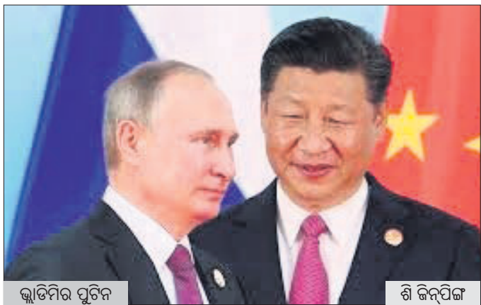
ଭୂତିମୂର୍ତ୍ତି ପୁଟିନ୍ ଶି ଜିନ୍‌ପିଙ୍ଗ

ମସ୍କୋ, ୨୫:୨: ଟ୍ରିଟିଗ ଏୟାରଲାଇନକୁ ରୁଷିଆ ବିମାନବନ୍ଦରରେ ଅବତରଣ କିମ୍ବା ଏହାର ବାୟୁସାମାନ୍ୟ ବ୍ୟବହାରକୁ ମସ୍କୋ ଅନୁମତି ଦେଇନାହିଁ। ରୁଷିଆର ସୁକ୍ରେନ୍ ଆକ୍ରମଣ ପରେ ଏହାର ବିମାନକୁ ଟ୍ରିଟିଗ ଏହାର ବାୟୁସାମାନ୍ୟ ନିଷେଧ କରିଥିଲା।