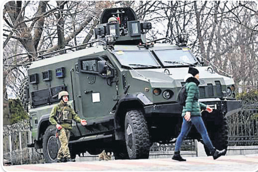
ୟୁକ୍ରେନ୍ ରାଜଧାନୀ କିଭ ରାସ୍ତାରେ ରୁଷିଆ ସୈନ୍ୟକ ସହ ଯୁଦ୍ଧାସ୍ତ୍ର ଭର୍ତ୍ତି ଯାନ।