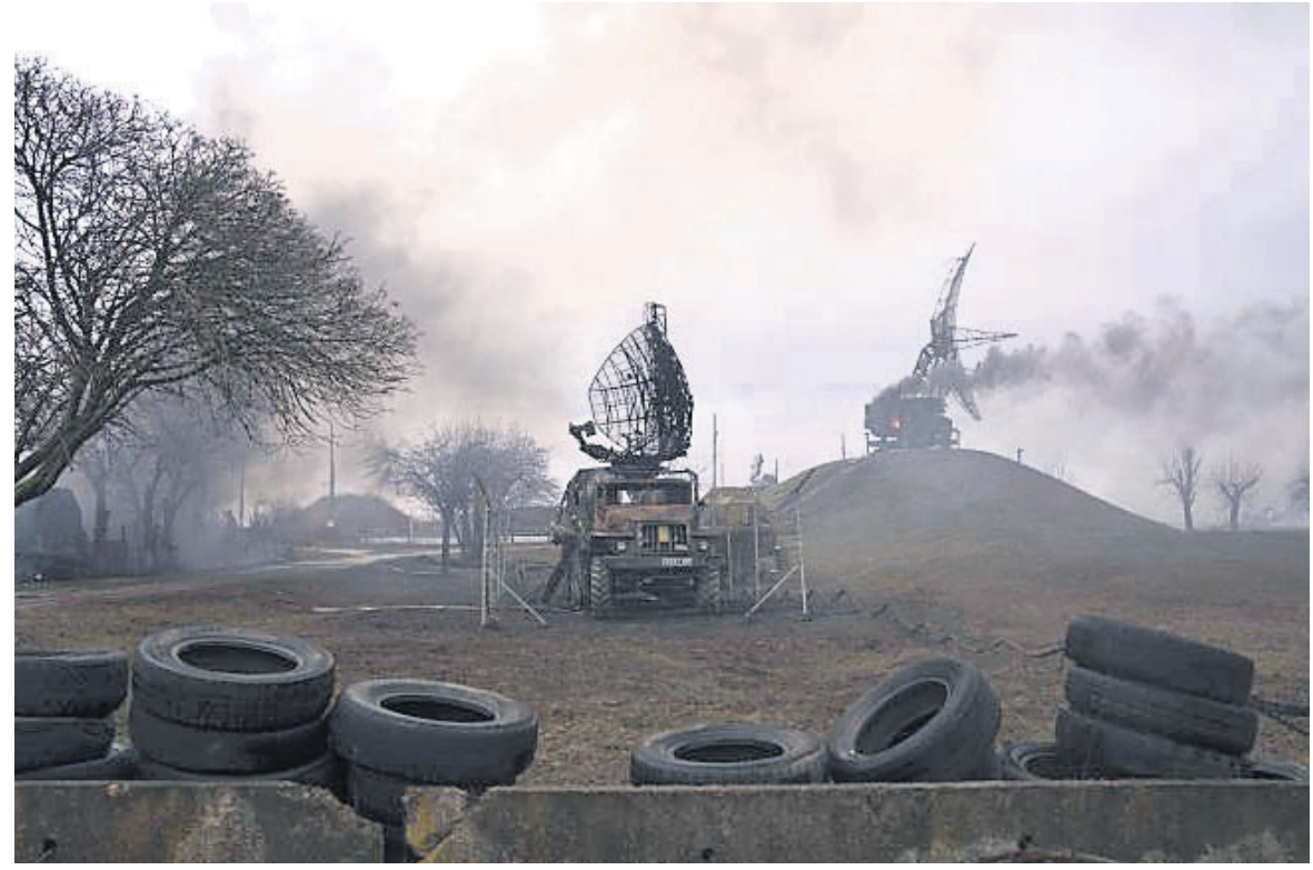
ୟୁକ୍ରେନ୍‌ର ମାରିଉପୋଲସ୍ଥିତ ବାୟୁସେନା ଶିବିରକୁ ରୁଷିଆର କ୍ଷେପଣାସ୍ତ୍ର ମାଡ଼ ପରେ ସେଠାରୁ ଧୂଆଁ ଉଠୁଛି।