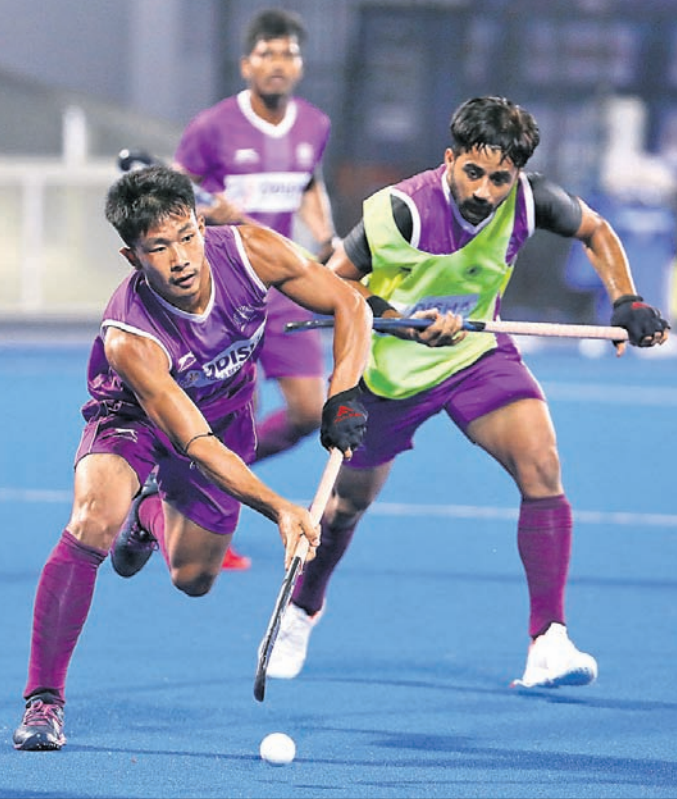
ଏଫଆଇଏଚ୍ ପ୍ରୋ ଲିଗ୍ ପାଇଁ କଳିଙ୍ଗ କ୍ଷୁଦ୍ରମରେ ଶୁକ୍ରବାର ଭାରତୀୟ ପୁରୁଷ ଓ ସ୍ପେନ୍ ମହିଳା ହକି ଦଳର ଅଭ୍ୟାସ।