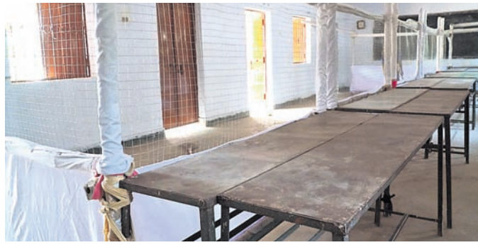
ଅନୁଗୋଳ ବ୍ଲକ ପିଟିସି ହାଇସ୍କୁଲରେ ଡେଇଁ ଗଣତି ପାଇଁ ଚେରୁଳ ପ୍ରସ୍ତୁତ।

ଅନୁଗୋଳ ଅଫିସ/ ବକ୍ଷା/ ଛେଡ଼ିପଦା, ୨୫.୧ (ଡି.ଏନ.ଏ.)