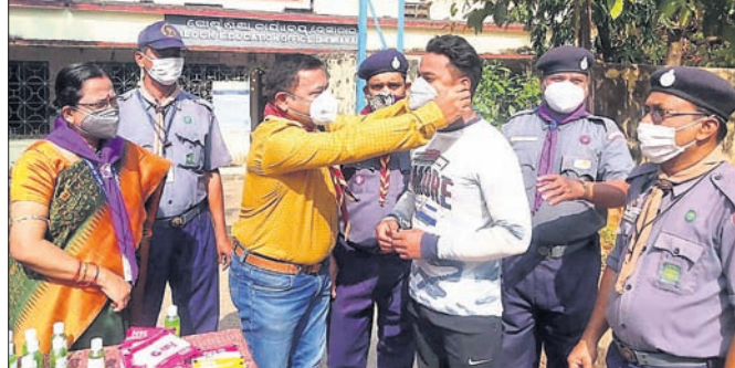
ଆଉଡ଼ ଓ ଗାଈକୁ ତରଫରୁ ଜଣେ ବ୍ୟକ୍ତିଙ୍କୁ ମାଝ ପିଣ୍ଡାଲି ସଚେତନ କରାଯାଇଛି।

ତେଜନୀଳ ଜିଲା ଭାରତ ଆଉଡ଼ ଓ ଗାଈକୁ ତରଫରୁ ଶୁକ୍ରବାର ଜନସାଧାରଣଙ୍କୁ ମାଝ ଓ ସାମାଜିକ ଉପାଦାନର ପାଇଁ ଯୋଗଦେଇ ଏହାକୁ ଉତ୍ସାହରେ କରିଥିଲେ।