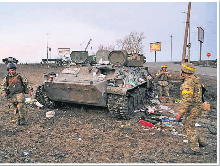
ଖର୍ଚ୍ଚଭରଣେ ରୁଷିଆର ଏକ ଯୁଦ୍ଧବାହନକୁ ଉଡ଼ାଇଦେଇଛନ୍ତି ଯୁକ୍ରେନ୍ ସୈନ୍ୟ।