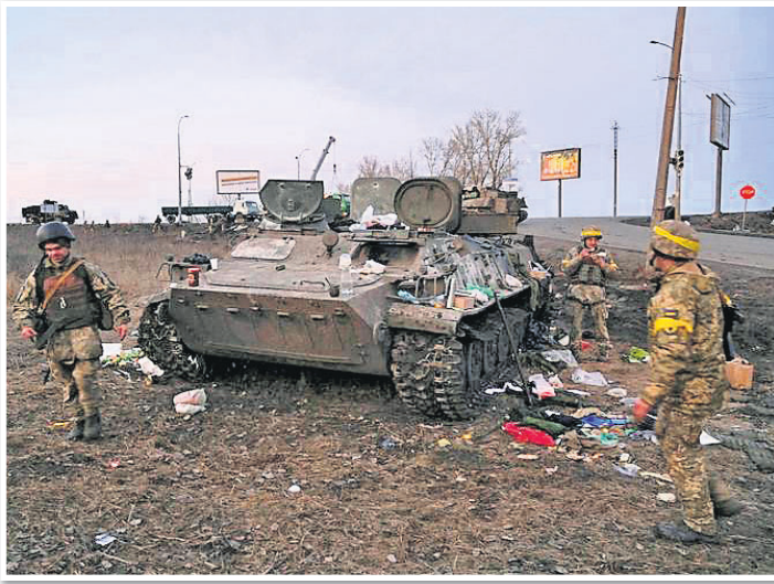
ଖର୍ଚ୍ଚଭରଣେ ରୁଷିଆର ଏକ ଯୁଦ୍ଧବାହନକୁ ଉଡ଼ାଇଦେଇଛନ୍ତି ଯୁକ୍ରେନ୍ ସୈନ୍ୟ।