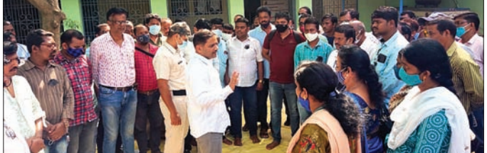
ଆନ୍ଦୋଳନରେ କର୍ମଚାରୀଙ୍କୁ ଜିଲାପାଳ ବୁଝାଖୁଣି କରୁଛନ୍ତି ।

ଆନ୍ଦୋଳନରେ ସାମିଲ ହୋଇ କାର୍ଯ୍ୟ ବନ୍ଦ କରିଥିଲେ । ଶୁକ୍ରବାର ଗଞ୍ଜାମ ଜିଲାପାଳ ବିଜୟ ଅମ୍ବୁଜାଙ୍କୁ ବୁକ୍ ଗସ୍ତରେ ଆସି ଧାରଣାରେ ବସିଥିବା କର୍ମଚାରୀଙ୍କୁ ବୁଝାଖୁଣି ନେଇଥିଲେ । ଆଗକୁ ଭୋଟ ଗଣତି ଥିବା ବେଳେ ଆନ୍ଦୋଳନ ପ୍ରତ୍ୟାହାର କରି କାର୍ଯ୍ୟରେ ଯୋଗ ଦେବାକୁ କହିଥିଲେ । କର୍ମଚାରୀଙ୍କ ପକ୍ଷରୁ ଜିଲାପାଳଙ୍କୁ ଏକ ଦାବିପତ୍ର ପ୍ରଦାନ କରାଯାଇ ଆନ୍ଦୋଳନ ପ୍ରତ୍ୟାହାର କରାଯାଇଥିଲା ।