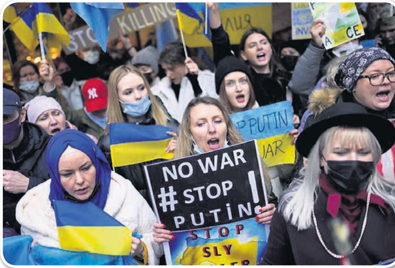
ତୁର୍କୀର ଇସ୍ତାନ୍ବୁଲସ୍ଥିତ ରୁଷିଆ କନସୁଲେଟ୍ ବାହାରେ ଯୁକ୍ରେନ୍ ସପକ୍ଷବାଦୀଙ୍କ ବିକ୍ଷୋଭ।