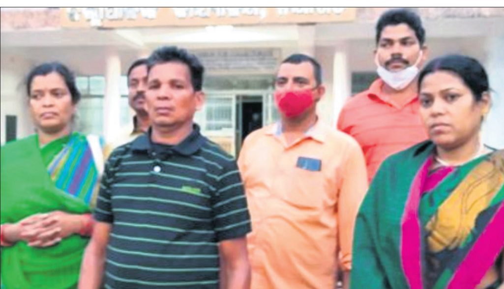
ୟୁକ୍ରେନ୍‌ରେ ଥିବା ଦୁଇ ଡାକ୍ତରୀ ଛାତ୍ରଙ୍କୁ ଫେରାଇ ଆଣିବା ପାଇଁ ଜିଲାପାଳଙ୍କୁ ନିବେଦନ କରିବାକୁ ଆସିଥିବା ପରିବାର ସଦସ୍ୟ ।