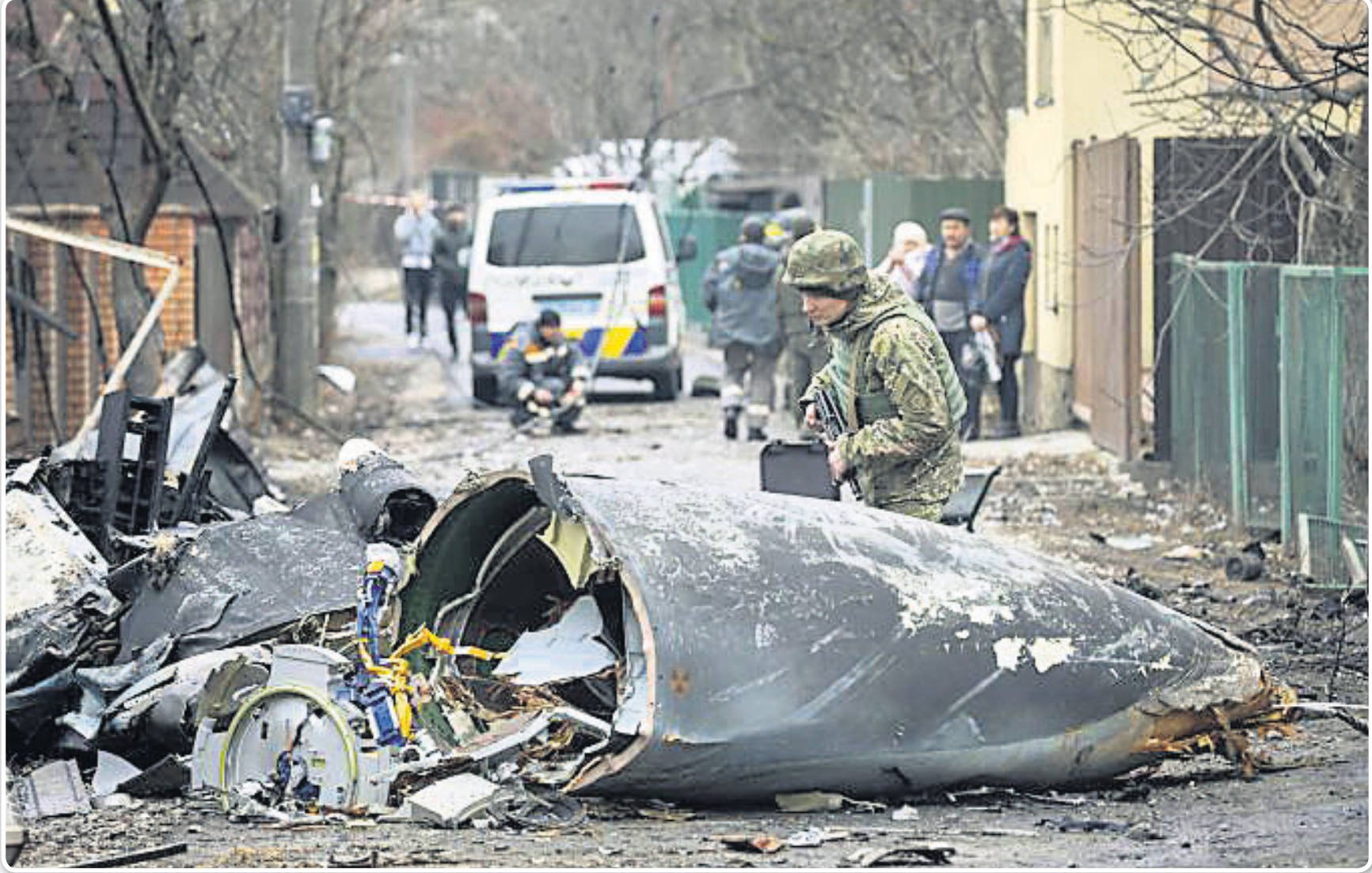
କିଭଳି ଯୁକ୍ରେନ୍ ସୈନ୍ୟ ରୁଷିଆ ବାୟୁସେନାର ଏକ ଯୁଦ୍ଧବିମାନର ଭଗ୍ନାବଶେଷକୁ ଅନୁଧ୍ୟାନ କରୁଛନ୍ତି।

ଲଗାତର ଦ୍ୱିତୀୟ ଦିନ ଧରି ଯୁକ୍ରେନ୍ ଉପରେ ଆକ୍ରମଣ ଜାରି ରଖିଛନ୍ତି ରୁଷିଆ। କେବଳ ପ୍ରତିପକ୍ଷ ସୈନ୍ୟ ବୃହତ୍ତି, ବରଂ ଯୁକ୍ରେନ୍‌ର ସାଧାରଣ ଲୋକଙ୍କୁ ମଧ୍ୟ ରାଷ୍ଟ୍ରପତି ଭାଷ୍ଟିନିର ପୁତ୍ରଙ୍କ ସଶସ୍ତ୍ର ବଳ ଟାର୍ଗେଟ୍ କରୁଛନ୍ତି। କିଭଳି ସୁରକ୍ଷା ପାଇଁ ଜନତାଙ୍କୁ ୧୮,୦୦୦ ମେଟ୍ରିନ୍ ଗନ୍ ଦିଆଯାଇଥିବା ସେଠାକାର ସ୍ୱରାଷ୍ଟ୍ର ମନ୍ତ୍ରଣାଳୟ ପକ୍ଷରୁ କୁହାଯାଇଛି। ଯୁକ୍ରେନ୍ ରାଷ୍ଟ୍ରପତି ଭୋଲୋଡିମିର ଜେଲେନ୍ସ୍କି ତାଙ୍କୁ ପୁତ୍ରଙ୍କ ସେନା ହତ୍ୟା ପାଇଁ ସ୍ୱତନ୍ତ୍ର କରୁଥିବା କହିଛନ୍ତି। ଇତିମଧ୍ୟରେ ଯୁରୋପୀୟ ସଂଘ ପୁତ୍ର ଓ ତାଙ୍କ ବହିଷ୍କାର ମନ୍ତ୍ରୀ ସେରେଇ ଲାଭୋଭଙ୍କ ବିଦେଶରେ ଥିବା ସମ୍ପର୍କ ବାଜ୍ୟାପ୍ତ କରିବା ପାଇଁ ଅଣ୍ଟାଭିଡ଼ିଛି। ଯୁଦ୍ଧ ପ୍ରଭାବିତ ଯୁକ୍ରେନ୍ ଓ ସେଠାକାର ଅଧିବାସୀଙ୍କ କ୍ଷୋଭର ଚିତ୍ର ଭାଇରାଲ ହେବାରେ ଲାଗିଛି।