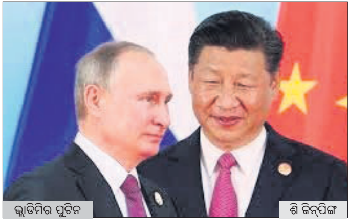
ଭୂତିମିତ ପୁଟିନ୍ ଶି ଜିନ୍‌ପିଙ୍ଗ

ମସ୍କୋ, ୨୫:୧୨: ବ୍ରିଟିଶ ଏୟାରଲାଇନ୍‌କୁ ରୁଷିଆ ବିମାନବନ୍ଦରରେ ଅବରୋଧ କିମ୍ବା ଏହାର ବାୟୁସାମାନ୍ୟ ବ୍ୟବହାରକୁ ମସ୍କୋ ଅନୁମତି ଦେଇନାହିଁ। ରୁଷିଆର ଯୁକ୍ତେନ୍ଦ୍ର ଆକ୍ରମଣ ପରେ ଏହାର ବିମାନକୁ ବ୍ରିଟେନ ଏହାର ବାୟୁସାମାନ୍ୟ ନିଷେଧ କରିଥିଲା।