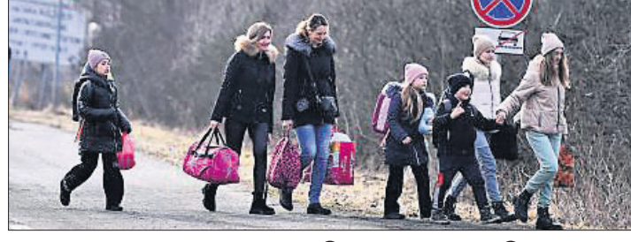
ୟୁକ୍ତେନ୍ଦ୍ରର ଭାରତୀୟଙ୍କୁ ଉଦ୍ଧାର ଉଦ୍ୟମ ପ୍ରକାଶ କରାଯାଇଛି।

ୟୁକ୍ତେନ୍ଦ୍ରର ଭାରତୀୟଙ୍କୁ ଉଦ୍ଧାର ଉଦ୍ୟମ ପ୍ରକାଶ କରାଯାଇଛି। ଭାରତୀୟମାନଙ୍କୁ ଧରି ନ୍ୟୁଦିଲ୍‌ହୀ ଫେରିବା ପ୍ରକାଶ କରାଯାଇଛି। ଏବଂ ହଜ୍ଜେରି ଦେଇ ଭାରତୀୟମାନଙ୍କୁ ଫେରାଇ ଆଣିବା ଉଦ୍ୟମ ହେଉଥିବା ଶୁକ୍ରବାର ଯୁକ୍ତେନ୍ଦ୍ରର ଭାରତୀୟ ଦୂତାବାସ ପକ୍ଷରୁ କୁହାଯାଇଛି।