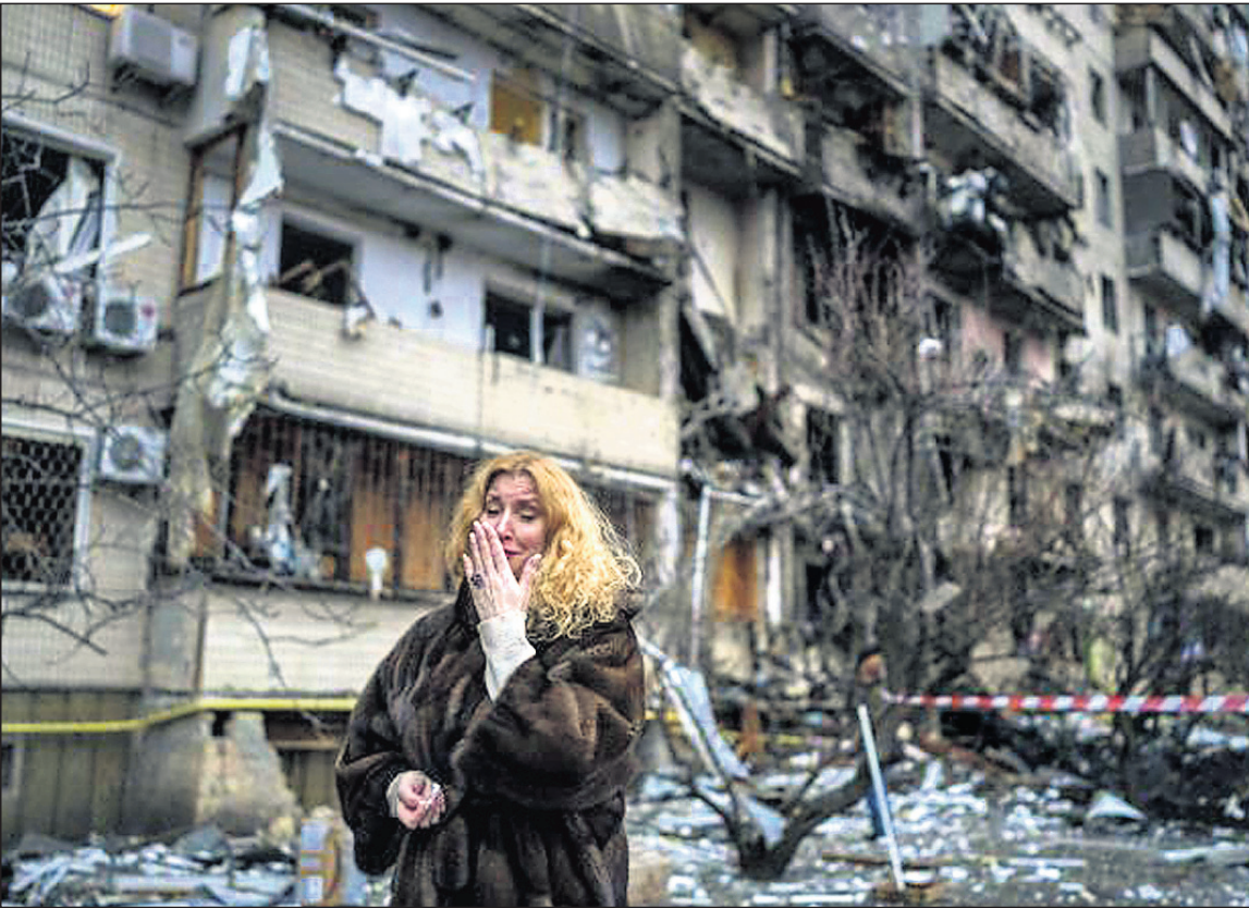
ରୁଷିଆ ଆକ୍ରମଣରେ ବିଧ୍ୱସ୍ତ କିଉରେ ବାସୀଙ୍କୁ ସହାୟତା ପରେ ଦୁଃଖରେ ଭାଙ୍ଗିପଡ଼ିଛନ୍ତି ଜଣେ ମୁଦତୀ ।

ୟୁକ୍ଲେନ୍ ରାଜଧାନୀ କିଉ ସମେତ ବିଭିନ୍ନ ଭାଗରେ ରୁଷିଆ ପକ୍ଷରୁ କ୍ରମାଗତ ବୃତୀୟ ଦିନ ଧରି ଆକ୍ରମଣ ଜାରି ରହିଛି । ଆକାଶମାର୍ଗରୁ ବୁଲ୍ ବୁଲୁ ହେଉଛି ଯେଉଁଠି ଓ ଉଡ଼େଇ ମାଡ଼ରେ ଯୁଦ୍ଧରୁ ଯୁଦ୍ଧ ହୋଇଯାଇଛି ଏହି ପୂର୍ବ ସୂଚନା ଦିଆଯାଇଛି । ପୁଟିନ୍ କିଉ ସେନା ଆଗରେ ଏକପ୍ରକାର ଅସହାୟ ହୋଇପଡ଼ିଛନ୍ତି ଯୁକ୍ଲେନ୍ ସହାୟତା । ତଥାପି ୟୁକ୍ଲେନ୍ ରାଷ୍ଟ୍ରପତି ଭୋଲୋଡିମିର ଜେଲେନ୍ସ୍କିଙ୍କ ମନୋବଳ ଭାଙ୍ଗିନାହିଁ । ରୁଷିଆ ସୈନ୍ୟକ ସହ ସେ ବୃତୀୟ ଦିନ ଧରି ଏକାକୀ ଲଢ଼ୁଥିବା ଏବଂ ଏଥିରେ ତାଙ୍କୁ ପାଶ୍ଚାତ୍ୟର କୌଣସି ସେନା ସହଯୋଗ କରି ନ ଥିବା ଭୋଲୋଡିମିର କହିଛନ୍ତି । ଏଭଳି ସମୟରେ ଶକ୍ତିଶାଳୀ ପୁଟିନ୍ ୟୁକ୍ଲେନ୍ ଅସହାୟ ସେନାକୁ ଆତ୍ମସମର୍ପଣ ପାଇଁ ଏକପ୍ରକାର ବାଧ୍ୟ କରିଛନ୍ତି । ସେମାନେ ଆତ୍ମସମର୍ପଣ କଲେ ଆଲୋଚନା କରାଯିବ ବୋଲି ପୁଟିନ୍ ସମ୍ଭବ କରିଛନ୍ତି । ପୁଟିନ୍ ଏଭଳି ଆକ୍ରମଣକୁ କାଟିବାପାଇଁ, ୟୁକ୍ଲେନ୍ ରାଷ୍ଟ୍ର (କିଉ) ଏବଂ ନର୍ଥ ଆଟଲାଣ୍ଟିକ୍ ଟ୍ରୀଟି ଅର୍ଗାନାଇଜେସନ (ନାଟୋ) ପକ୍ଷରୁ ଦୃଢ଼ ନିନ୍ଦା କରାଯାଇଛି । ଇତିମଧ୍ୟରେ ପୁଟିନ୍ ଚାଇନା ରାଷ୍ଟ୍ରପତି ଶି ଜିନ୍ପିଙ୍ଗଙ୍କ ସହ କଥା ହୋଇଛନ୍ତି । ୟୁକ୍ଲେନ୍ ସହ ଉଚ୍ଚସ୍ତରୀୟ ଆଲୋଚନା ପାଇଁ ସେ ପ୍ରସ୍ତୁତ ଥିବା ଚାଇନା ପ୍ରତିପକ୍ଷକୁ ଅବଗତ କରାଇଛନ୍ତି । ଜିନ୍ପିଙ୍ଗ ମଧ୍ୟ ଆପୋସ ଆଲୋଚନା କରିଆରେ ଫୁଲ୍-୪