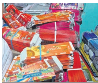
ନକଲି ଧୁପକାଠି ଓ ଖୋଳା

୨୫ ଲକ୍ଷ ଟଙ୍କାର ନକଲି ଧୁପକାଠି ଜବତ ମାଲିକଙ୍କ ସମେତ ୪ ଅଟକ