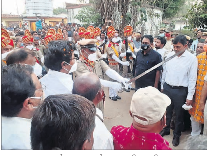
ଠାକୁରପଡ଼ା ଗ୍ରାମରେ ପାର୍ଥବ ଶରୀରକୁ ଗାର୍ଡ ଅଫ୍ ଅନର ଦିଆଯାଇଛି ।