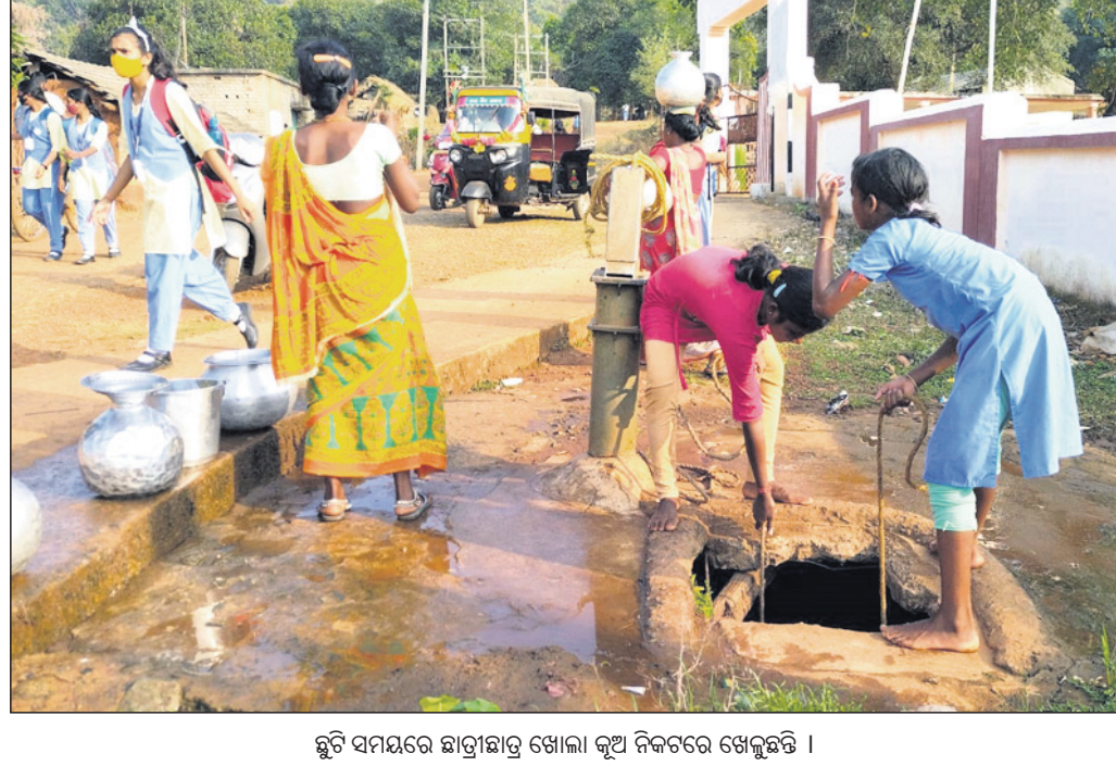
ଛୁଟି ସମୟରେ ଛାତ୍ରାଛାତ୍ରୀ ଖୋଲା କୂଅ ନିକଟରେ ଖେଳୁଛନ୍ତି ।