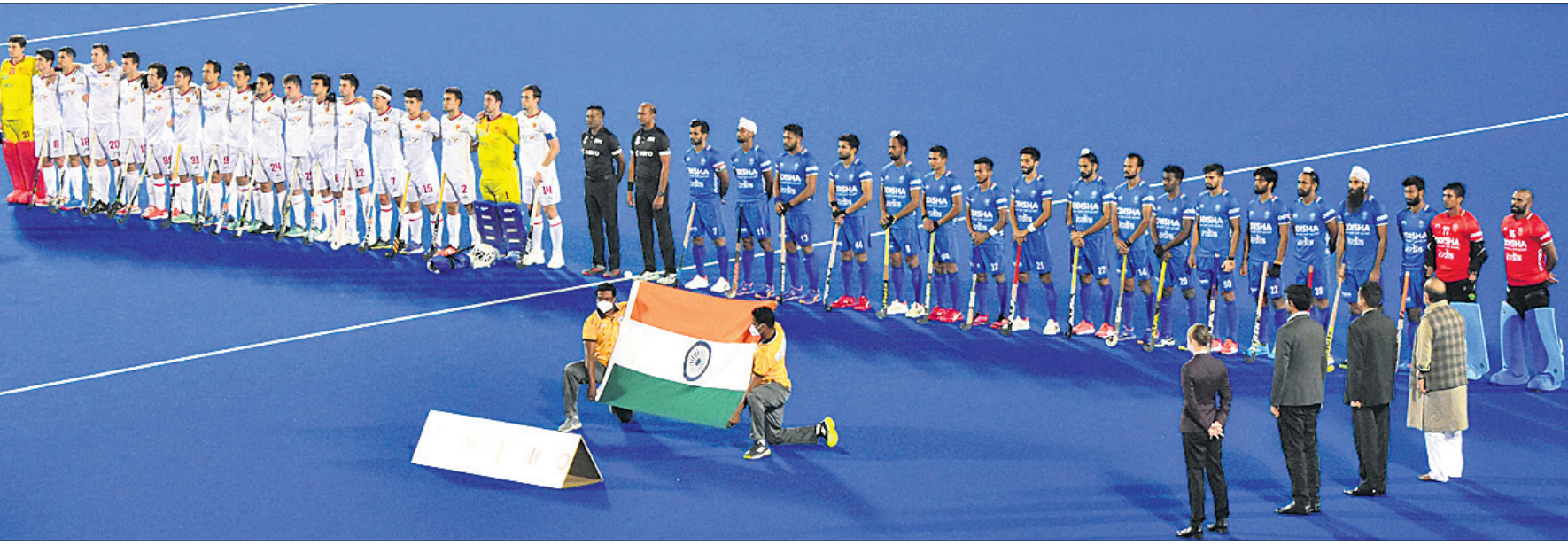
ଭାରତ ଓ ଶ୍ଵେତ ପୁରୁଷ ହକି ଦଳ ମଧ୍ୟରେ ଏଫଆଇଏଚ୍ ପ୍ରୋ ଲିଗ୍ ହକି ମ୍ୟାଚ ପୂର୍ବରୁ ଅଭିଯୁକ୍ତ ସହ ଦୁଇ ଦଳର ଖେଳାଳିମାନେ ।