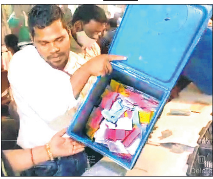
ପୁରୀ ଆଇଡିଆଲ କଲେଜ ପରିସରରେ ଭୋଟ ଗଣତି ପାଇଁ ବାଲେଶ୍ୱର ପେପର ଜଳାଯାଇଛି।

ଭୁବନେଶ୍ୱର, ୨୬/୨ (ବୁଧବେଳା) ତ୍ରିପୁରାୟ ପଞ୍ଚାୟତ ନିର୍ବାଚନ ଭୋଟ ଗଣତି ଶିବିର କଡ଼ା ପୁରୁଣା ମଧ୍ୟରେ ରାଜ୍ୟର ବୃକ୍ଷ ପୂଜ୍ୟାକର୍ଷଣକୁ ଆରମ୍ଭ ହୋଇଛି। ଆସନ୍ତା ୨୮ ତାରିଖ ପର୍ଯ୍ୟନ୍ତ ଗୋଟିଏ ଗଣନା ଜାରି ରହିବ। ତେବେ ଗଣନା ପ୍ରଥମ ଦିନରେ ବିଜେଡିକୁ ବିପୁଳ ଜନସମର୍ଥନ ମିଳିଛି। ଫଳାଫଳ ଏକତରଫା ଆଡ଼କୁ ଚଳିଯାଇଛି। ୨୧ ବର୍ଷର ଶାସନ ପରେ ମଧ୍ୟ ପୂଜ୍ୟମନ୍ତ୍ରୀ ନବୀନ ପଟ୍ଟନାୟକଙ୍କ ଛବି ଅମଳିନ ରହିଛି। ରାଜ୍ୟର ପ୍ରାୟ ଅଧିକାଂଶ ଜିଲ୍ଲା ପରିଷଦ ଆସନରେ ବିରୋଧୀ ଭାଜପା ଓ କଂଗ୍ରେସକୁ ବହୁ ପକ୍ଷରେ ପକାଇ ବିଜୟ ଆଡ଼କୁ ଆଗେଇ ଚାଲିଛି ବିଜେଡି। ଶାସକ ଦଳର ପ୍ରାର୍ଥୀମାନେ କେତେକ ଗ୍ରାମରେ ନିଜ ପ୍ରତିଦ୍ୱନ୍ଦ୍ୱୀଙ୍କୁ ବହୁ ପକ୍ଷରେ ପକାଇଛନ୍ତି। କେବଳ ଉପକୂଳ ରୁହେଁ, ଦକ୍ଷିଣ ଓ ପଶ୍ଚିମ ଓଡ଼ିଶାରେ ମଧ୍ୟ ବିରୋଧୀଙ୍କୁ ବିଜେଡି ମାତ୍ର ଦେଇଚାଲିଛି। ଭାଜପାର ବଡ଼ କୁହାଯାଉଥିବା ବାଲେଶ୍ୱର, ବଲାଙ୍ଗୀର, ମୟୂରଭଞ୍ଜ, ସମ୍ବଲପୁର, କଳାହାଣ୍ଡି, ସୁନ୍ଦରଗଡ଼ ଆଦି ଜିଲ୍ଲାରେ ବିଜେଡି ପୂଜ୍ୟ ପ୍ରତିଦ୍ୱନ୍ଦ୍ୱୀ ଭାଜପାକୁ ବହୁ ପକ୍ଷରେ ବିଜୟ ପଥରେ ଆଗେଇ ଚାଲିଛି। ଦୀର୍ଘ ବର୍ଷ ଧରି କଂଗ୍ରେସ କବ୍ଜାରେ ଥିବା ଝାରସୁଗୁଡ଼ାରେ ମଧ୍ୟ ରାଜନୈତିକ ଚିତ୍ର ବଦଳିଯାଇଛି।