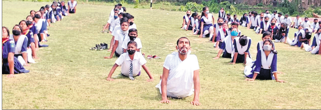
ଶିବିରରେ ସୂର୍ଯ୍ୟ ନମସ୍କାର ପ୍ରଶିକ୍ଷଣ ଦିଆଯାଇଛି।