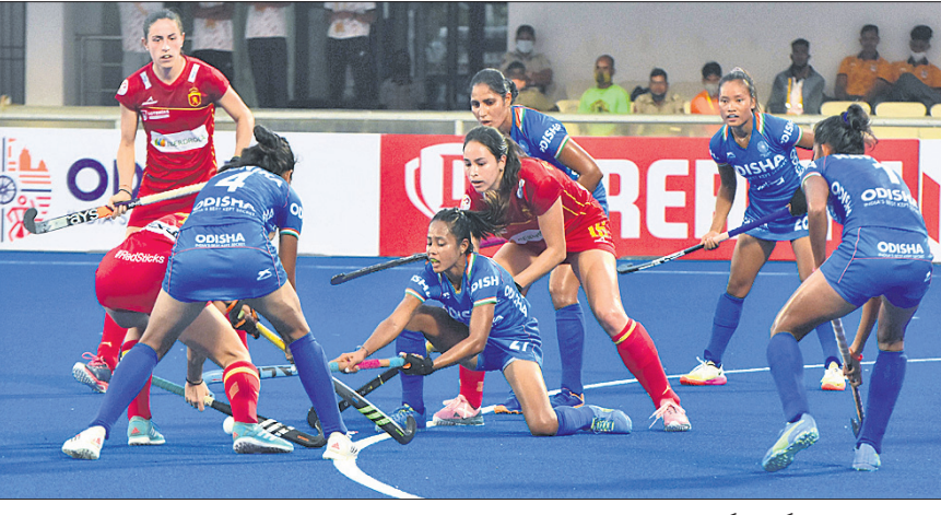
ଭାରତ-ଶ୍ଵେତ ମହିଳା ହକି ଦଳ ମଧ୍ୟରେ ଅନୁଷ୍ଠିତ ମ୍ୟାଚର ଉନ୍ନତାପୂର୍ଣ୍ଣ ମୁହୂର୍ତ୍ତ ।

ଭୁବନେଶ୍ଵର, ୨୬/୨ (ପି.ଟି.) ଏଫଆଇଏଚ୍ (ଫେଡେରେଶନ ଅଫ ଇଣ୍ଟରନାଶନାଲ ହକି) ପ୍ରୋ ଲିଗ୍‌ରେ ଭାରତୀୟ ମହିଳା ହକି ଦଳ ଏହାର ବିଜୟ ଧାରା ଜାରି ରଖିଛି । ଶନିବାର ଗ୍ଲାନାୟ କଲିଙ୍ଗ ଷ୍ଟାଡ଼ିୟମରେ ଶ୍ଵେତ ବିପକ୍ଷରେ ଖେଳାଯାଇଥିବା ଏକ ସଂଘର୍ଷପୂର୍ଣ୍ଣ