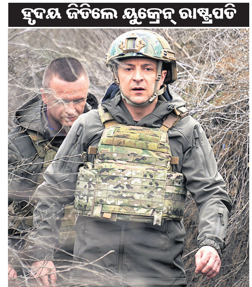
ସେନା ୟୁନିଟ୍‌ରେ ୟୁକ୍ରେନ୍ ରାଷ୍ଟ୍ରପତି ଭୋଲୋଡିମିର ଜେଲେନ୍ସ୍କି।

କ୍ରିକ୍/ଓଶିଟ୍ଟର/ମସ୍କୋ, ୨୬/୨ 'ମୁଁ ନିଜ ଭୂମିରେ ଛିଡ଼ା ହୋଇଛି। ଦେଶ ଛାଡ଼ି କୁଆଡ଼େ ଯିବିନା। ମୋତେ ଗୋଳାବାରୁଦ ବରକାର। ପକାୟନ ପାଇଁ ଗାଡ଼ି ରୁହେଁ। ଅତି ସମୟ ପର୍ଯ୍ୟନ୍ତ ଏଇଠି ଲଢ଼ିବି'। ୟୁକ୍ରିୟା ବିଭାଗିକା ଭିତରେ କ୍ରିକ୍ ଏବେ ମୁକ୍ତର ନଗରୀ ପାଲଟିଥିବାବେଳେ ୟୁକ୍ରେନ୍ ରାଷ୍ଟ୍ରପତି ଭୋଲୋଡିମିର ଜେଲେନ୍ସ୍କି ଏହି ମନ୍ତବ୍ୟ ବିଶ୍ୱାସୀୟାଙ୍କ ଦୃଷ୍ଟି ଆକର୍ଷଣ କରିଛନ୍ତି। ଶତ୍ରୁ ଯେତେ ଶକ୍ତିଶାଳୀ ହେଉ ନା କାହିଁକି ୟୁକ୍ରିୟା ଅସ୍ତ୍ରରେ ରୁହେଁ, ବରଂ ଦୃଢ଼ ମନୋବଳରେ ଲଢ଼ାଯାଏ ବୋଲି ବିଶ୍ୱାସ ବାଣୀ ଦେଇ ପୁରୁଣା ପାଇଁ ଆମେରିକା ଦେଇଥିବା ପ୍ରସ୍ତାବକୁ ସେ ପ୍ରତ୍ୟାଖାନ କରିଛନ୍ତି। ଦିନେ ଚିଲି ପରଦାରେ କମେଡିଆନ ସାଜି ଲୋକଙ୍କ ମୁହଁରେ ହସ ପୁଟାଉଥିବା ୟୁକ୍ରେନ୍ର ଜେଲେନ୍ସ୍କି ଏବେ ୟୁକ୍ରେନ୍ରାସୀୟାଙ୍କ ପୁରୁଣା ପାଇଁ ୟୁକ୍ରେନ୍କୁ ଓହ୍ଲାଇଛନ୍ତି। ସେ ରୁଷିଆ ସୈନ୍ୟଙ୍କ ସହ ମୁହାଁମୁହିଁ ଲଢ଼ିବାକୁ ଅଣ୍ଟା ଭିଡ଼ି ବିଶ୍ୱା ନେତାଙ୍କ ଆଗରେ ବିରଳ ଦୃଷ୍ଟାନ୍ତ ସାଜିଛନ୍ତି। ଜେଲେନ୍ସ୍କି ମିଲିଟାରୀ ୟୁନିଟ୍ ପିଆ ଫଟୋ ସୋସିଆଲ ମିଡିଆରେ ଭାଇରାଲ ହେବାରେ ଲାଗିଛି। ଇନ୍ସ୍ପିରା ସମ୍ପ୍ରଦାୟର ଜେଲେନ୍ସ୍କି ପୂର୍ବରୁ ଜଣେ ଚିଲି ହାସ୍ୟକାର ଥିଲେ। ତାଙ୍କ ଜେଜେବାପା ଦ୍ୱିତୀୟ ବିଶ୍ୱଯୁଦ୍ଧବେଳେ ରେଡ଼ ୧୬ ପୃଷ୍ଠା-୪