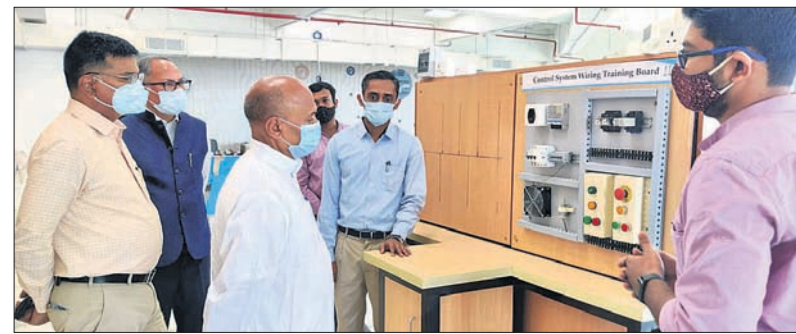
କେନ୍ଦ୍ର ଇସ୍ପାତ ମନ୍ତ୍ରୀ ରାମଚନ୍ଦ୍ର ପ୍ରସାଦ ସିଂ ଖାଲ୍ ସିଲ୍ ସେଣ୍ଟର ପରିଦର୍ଶନ କରୁଛନ୍ତି ।