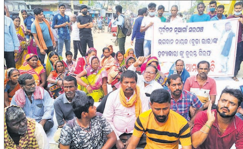
ଭଦ୍ରକ ଜିଲ୍ଲା ବାସୁଦେବପୁର ଥାନା ସମ୍ମୁଖ ରାସ୍ତାରେ ବସି ପ୍ରତିବାଦ କରୁଛନ୍ତି ।